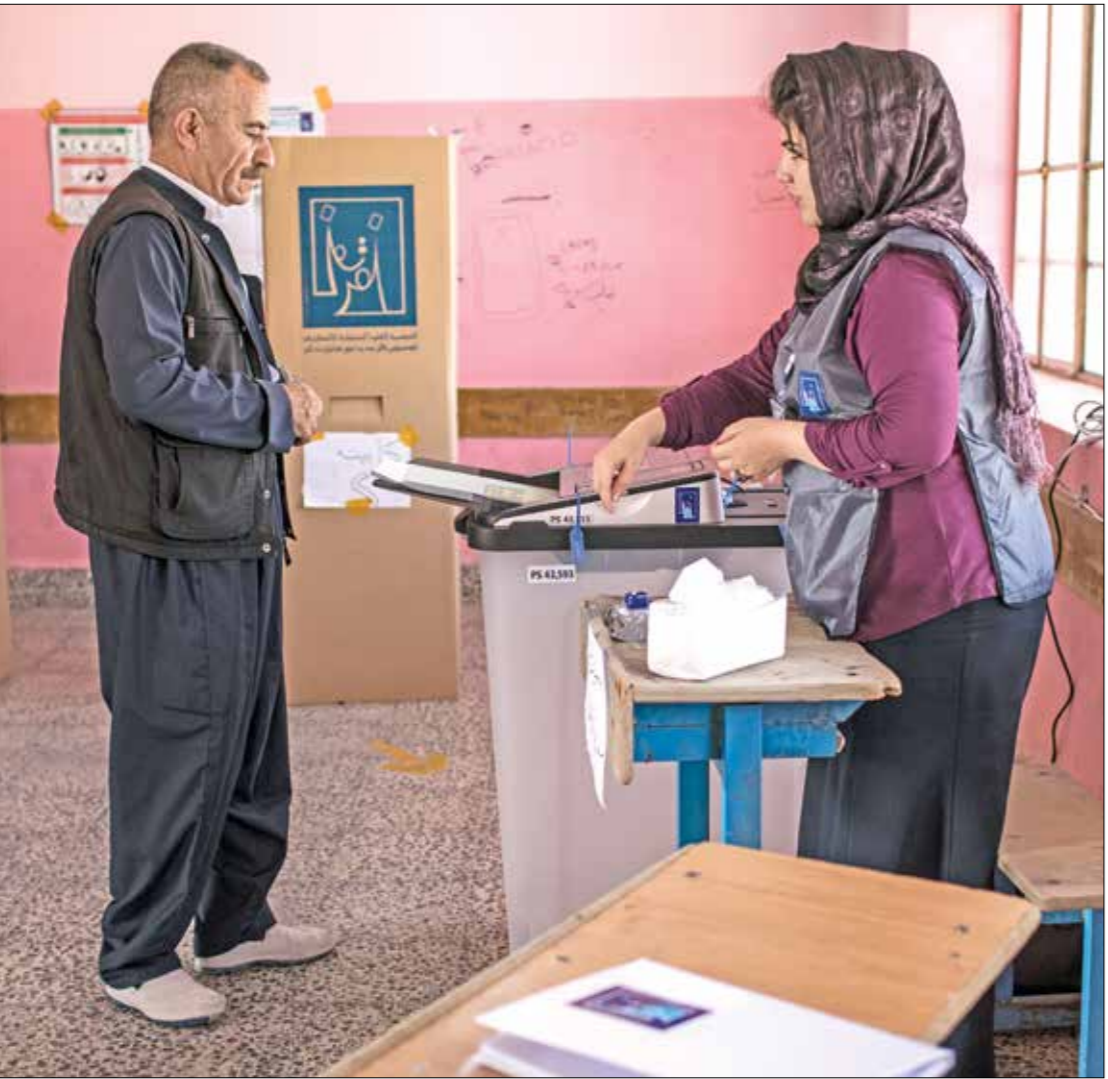
الفتية لروح الفضاضا

وأكد أن «الأسبوع الماضي وحده شهد تسريح رضاء 40 صحافياً من وسائل إعلام محلية عراقية ليضافوا إلى طابور العاطلين عن العمل».