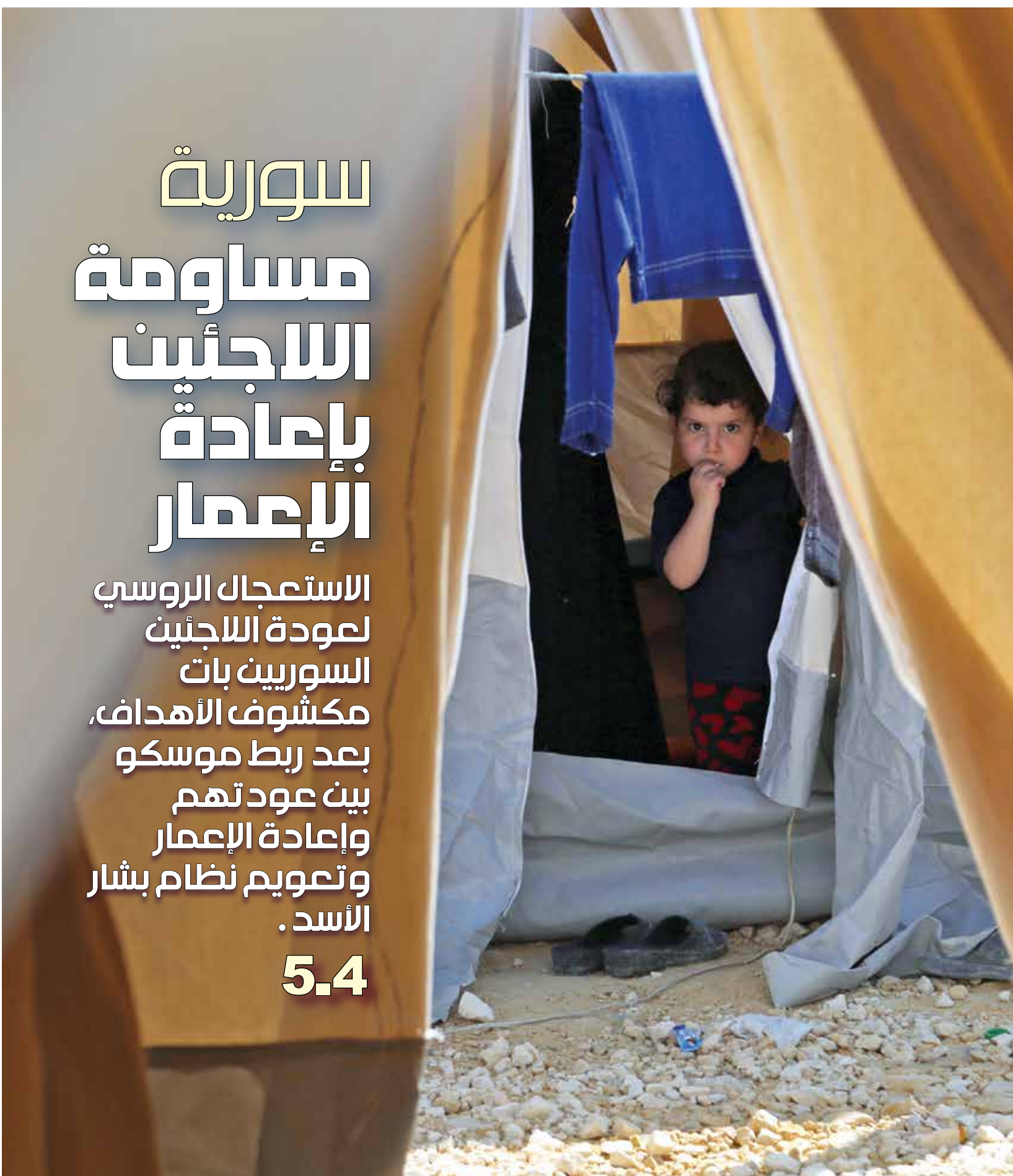
تحول السوريون إما إلى نازحين أو لاجئين بعيداً عن مناطقهم