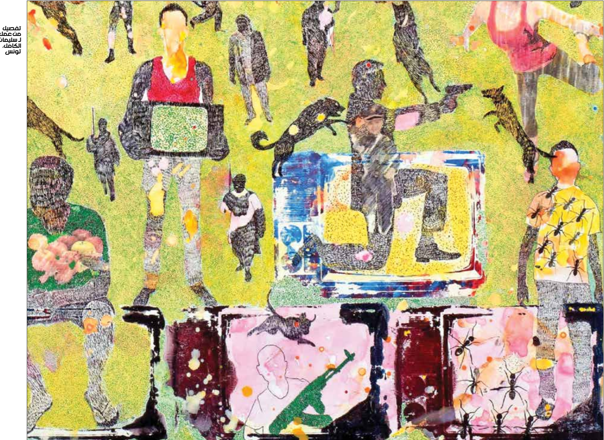
نصوص من نصيب لسيبوات لونس