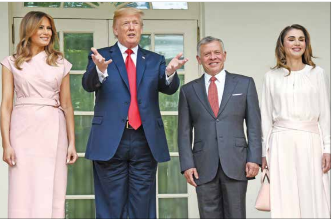
طلوات الشائعات رحلة الملك إلى الولايات المتحدة