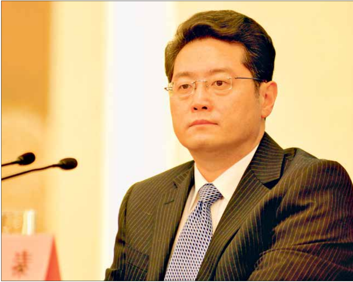
السفير الجديد تشين غانغ معروف بتصلبه وبكونه من «الذئاب المحاربة»

يواجه السفير الصيني الجديد لدى الولايات المتحدة مهمة عمل صعبة لا سيما أنه يتسلم منصبه وسط تدهور حادّ في العلاقات بين البلدين