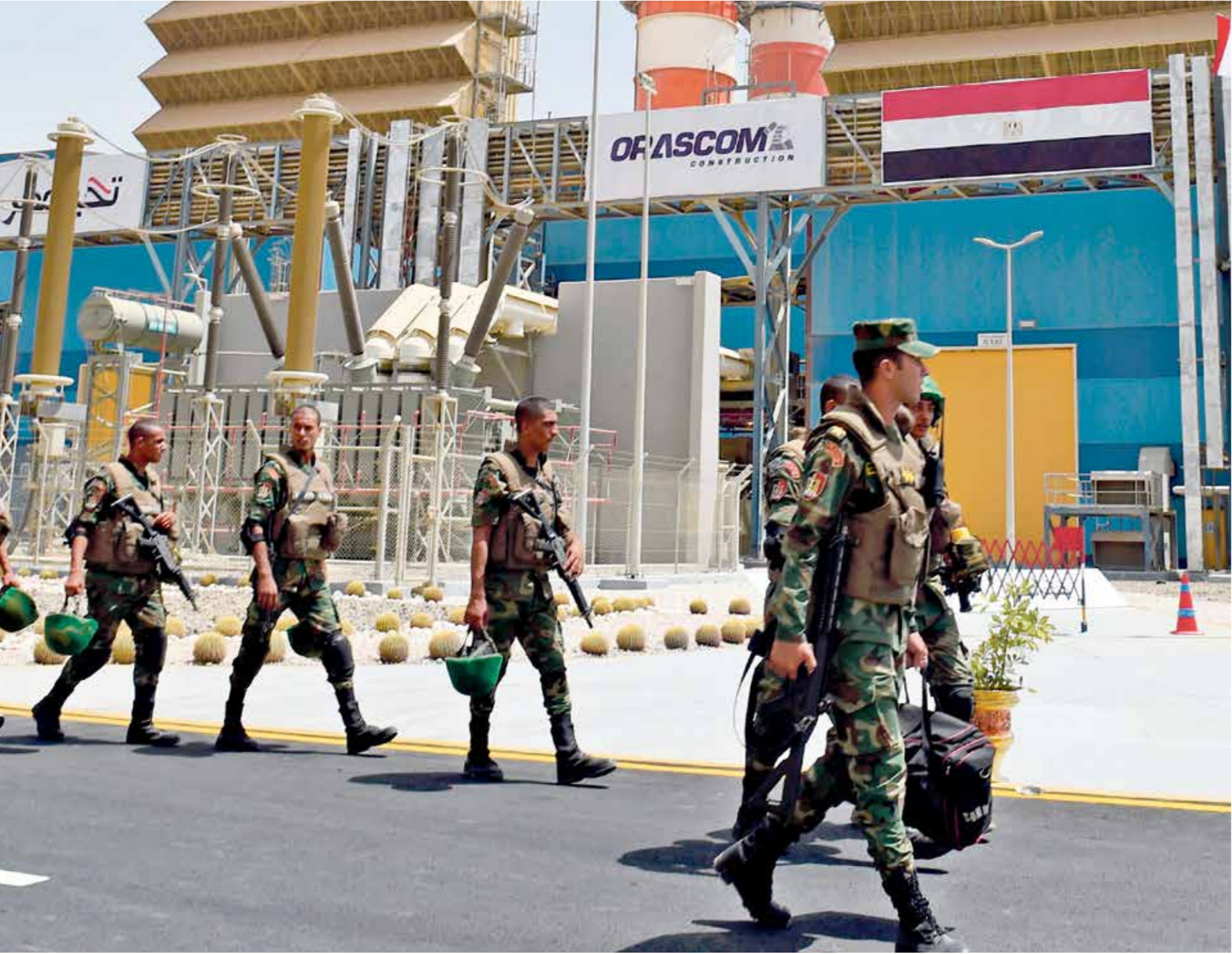
لشاهد مصر لوسما مطردا في اقتصاد الجيش (تأخذ دعويا)مراس (برس)

وامتدادا للأخذ بالتشبهات وتوسيع دائرة التشكيل، أجرت الرقابة الإدارية وجهات أخرى، تحريات بشأن علاقة الشركة