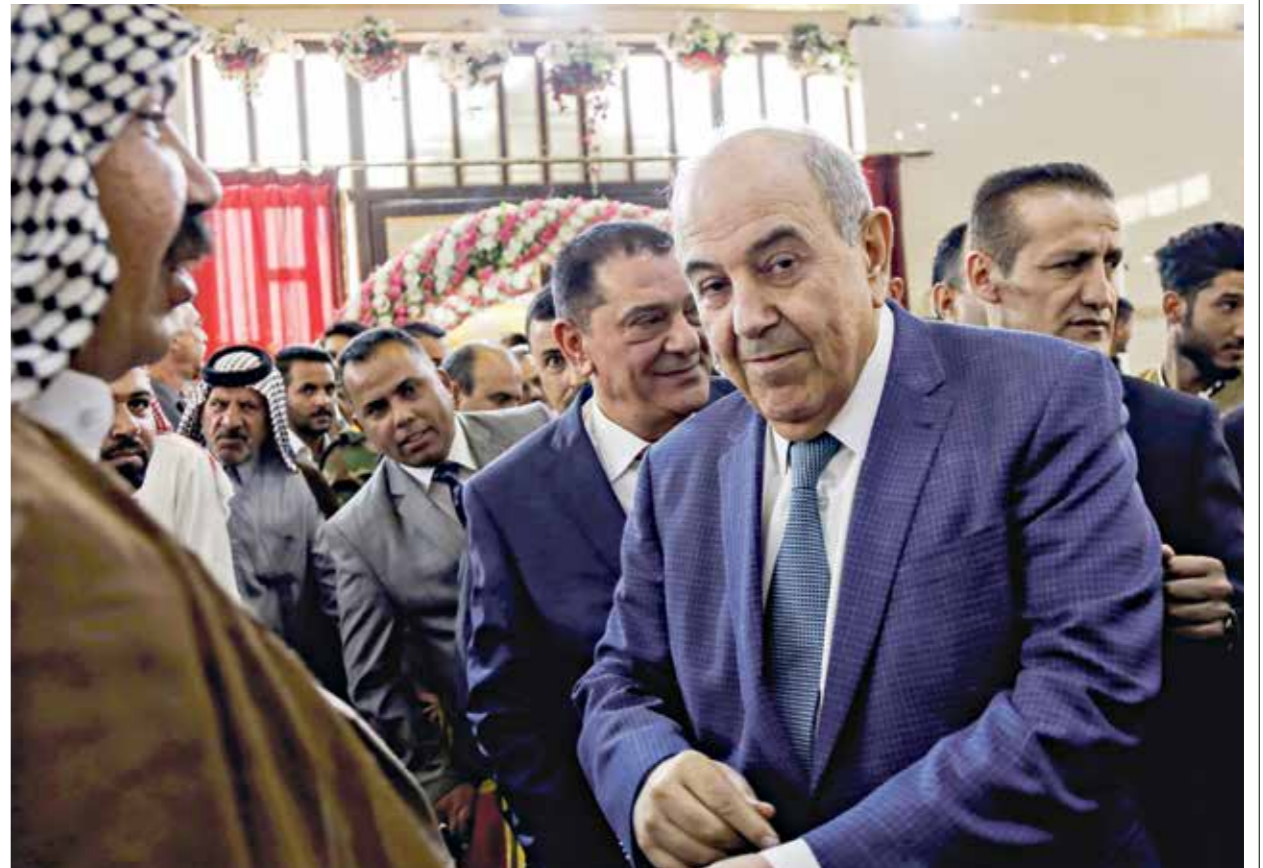
أعلن «المتر العراقي»، بقيادة علوي مقاطعة الانتخابات (تجرح حصدا)مراس (برس)

لا إشارات من الحكومة بشأن وقف إجراءات التحضير للانتخابات