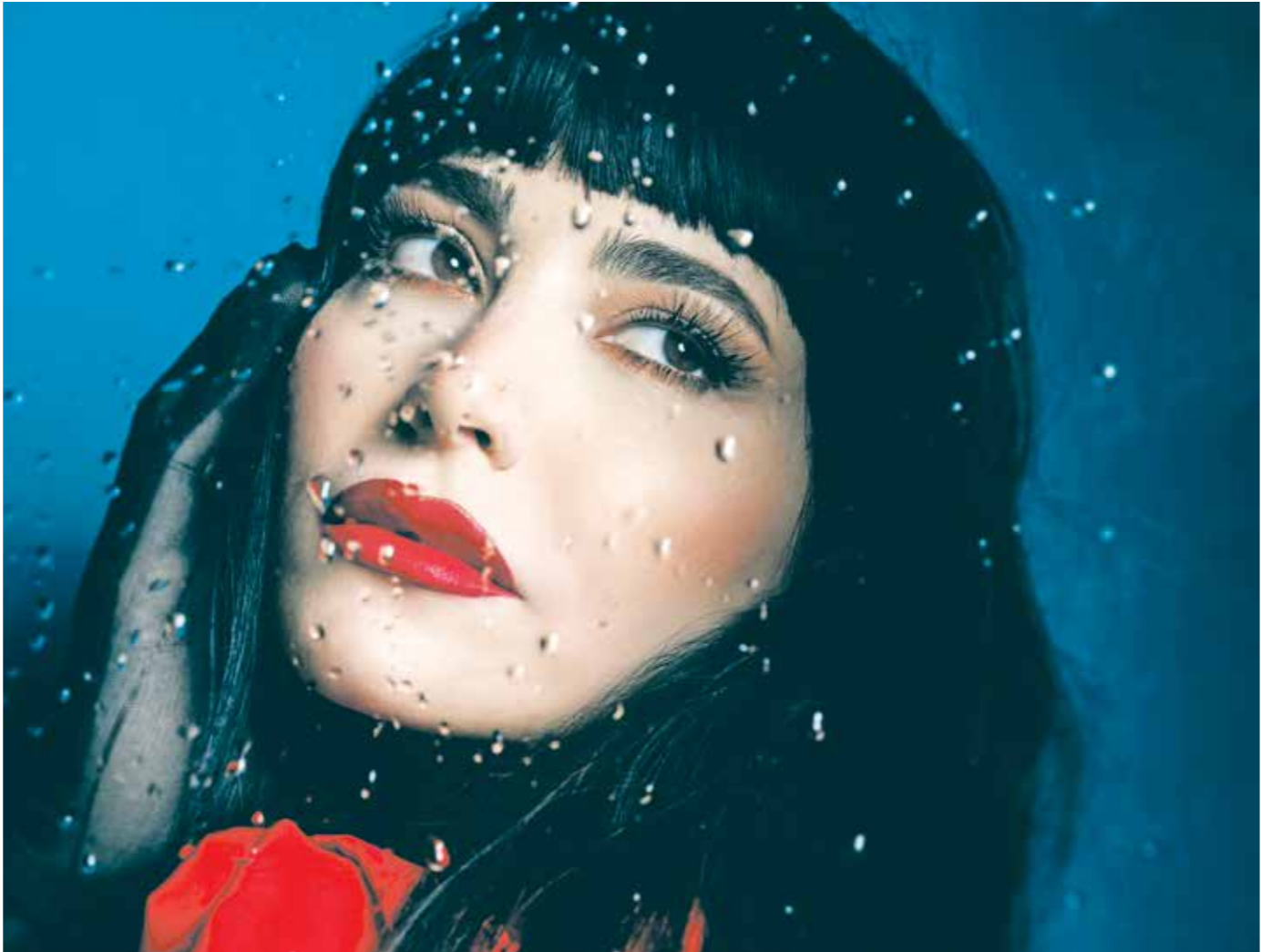
نعمة في غلاف أغلبها الجديدة، صة الفاتح

وذكرت «هيومن رايتس ووتش» أن الحكم ضد بيكا وكمال يأتي ضمن حملة أكبر تستهدف أغاني المهرجانات والأعمال الفنية التي تعتبر «مناقضة للقيم المصرية»، بما في ذلك أداء أنواع معينة في الأماكن العامة وإقصاء الفنانين من نقابة الموسيقين، وبدات القضية في وقت لاحق من ذلك العام، بحسب وسائل إعلام محلية، بعد أن اشكتي شخصاً ما، بحسب الزعم، إلى نقابة الإسكندرية من أن الفيديو ينتهك «القيم الأسرية»، وهي جريمة بموجب المادة 25 من القانون رقم 175 لسنة 2018 في شأن مكافحة جرائم تقنية المعلومات.»