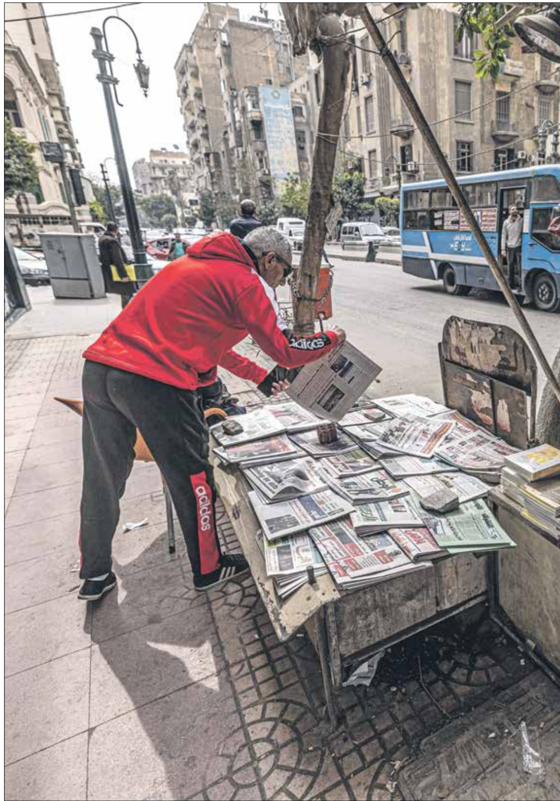
يعاني الصحافيون اوضاعاً اقتصادية صعبة