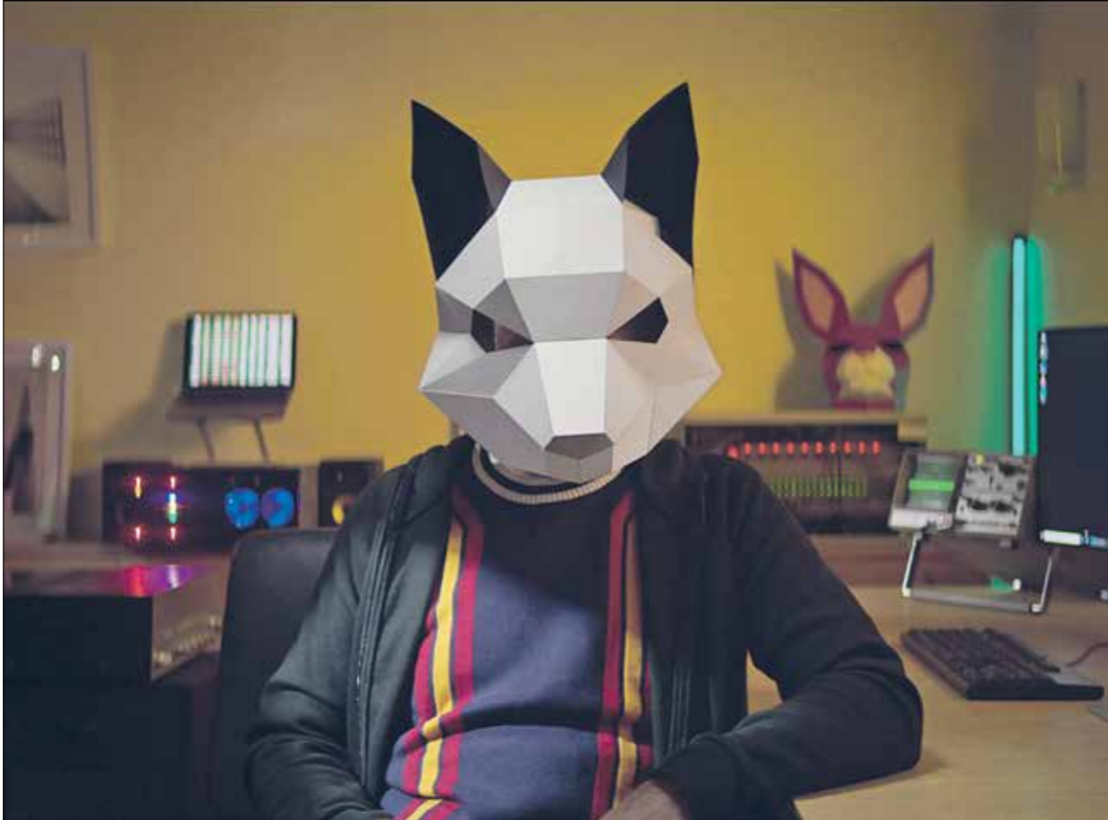
يوكو اله لتأنيب ضرورة اتباع الحكمة المرربطه بالعامل مع العملات الرقمية، لا تثقوا بأحد (فيليكس)