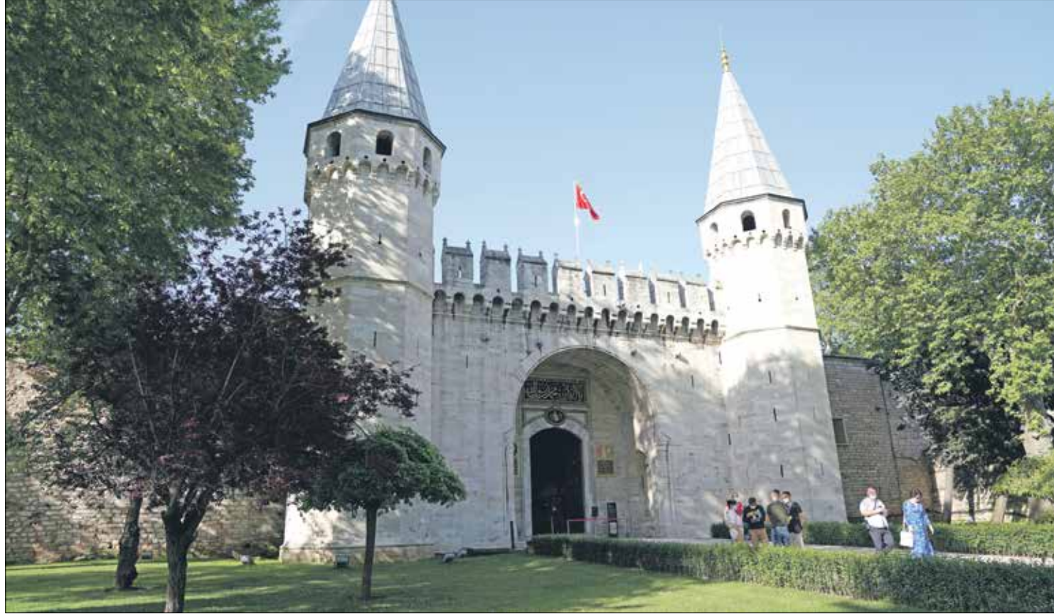
قصر «طوب كابي» مدعاة فخر الأتراك

يفتح قصر متحف «طوب كابي» في مدينة إسطنبول التركية أبوابه أمام السياح بعد ترميم قسم النساء والمستشفى، ما سيسمح بتعرف الزوار على أسرار «مطبخ القرارات العثمانية» ومركز السلطنة