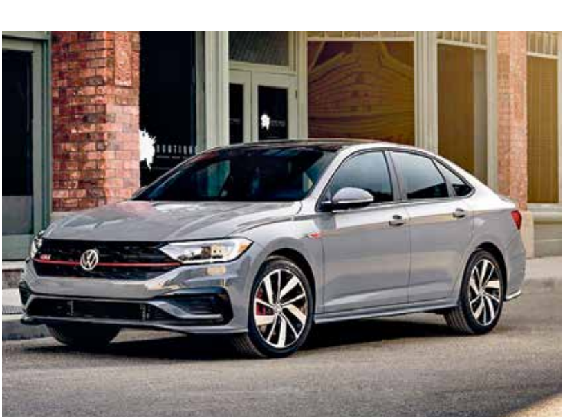
«فولكسفاغن» أجرت تعديلات على الموديلين من الداخل والخارج

النامسية إلى طراز عام 2022، ضففي المصداً الأمامية والخلفية المعدل تصميمها على منافس هوندا سيفيك مظهرها جديداً، تجلج فيه ألوان معدنية جديدة (أزرق صاعد،