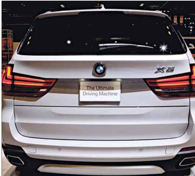
«إم دبلو X5 Drive40e» موديل 2016