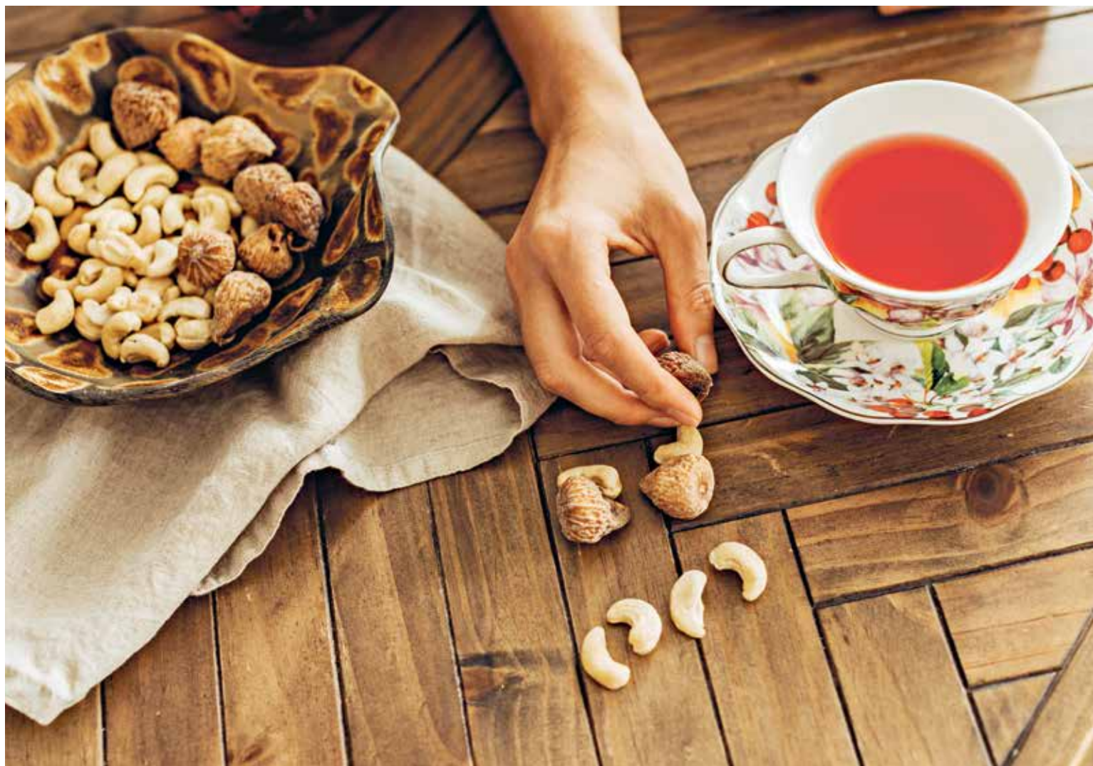
فهد لحولبي عكاز بعض أنواع التحضير الصاروخ

بين ثلاثية المصالح بين شركة الإنتاج والكتاب والممثل، تقاطع بعض الأعمال الدرامية التي تدخل في الشق التجاري والبحث. هكذا هو حال مسلسل «صالون زهرة»، من إنتاج شركة الإنتاج، والذي بدأ عرضه على منصة «شاهد» قبل أسبوع. سكاكنا الفهم والسرور، من خلال إنشاء مشاريع تنموية تخدم سكان المنطقة مثل المخازن والصالونات وتربية الطيور والأغنام وزراعة وحفر الآبار. جميع مياه الأمطار، إضافة إلى تقديم المعونات الخيرية من مواد تموينية والسبسة وأحذية ومساعدات مالية، ميمناً آن فترة إنشاء مكتبات للقراءة تأتي ضمن خطة ثابتة تعتمد على مجموعة من المعايير الدقيقة والتقييم العالي في اختيار مضمون الكتب بعناية، براعي من خلالها المستوى الثقافي والتعليمي، مؤكداً أن المبادرة تسعى لافتتاح 18 مكتبة أخرى، في مختلف مناطق المملكة خلال العامين القادمين.