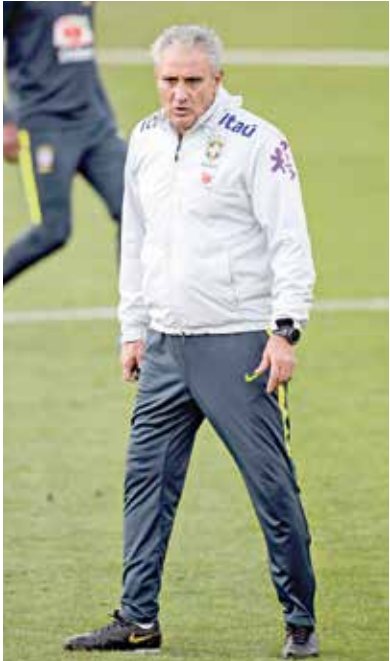
المنتخب البرازيل ينظر للمواجهات المهمة القادمة

استدعى مدرب منتخب البرازيل لكرة القدم، تيتي، 9 لاعبين خُدد إلى تشكيلته التي ستكمل تصفيات مونديال 2022 الشهر المقبل، وذلك بعد إصرار أندية أوروبية على منع لاعبيها من السفر إلى دول مصفحة ضمن اللائحة الحمراء لعدم وضعهم في عزل صحي طويل بعد عودتهم، ودعمت وابطح الدوريات الإنكليزية، والإسبانية، والإيطالية والبرتغالية حقوق أنديةها بعدم تسريح لاعبيها إلى دول يرتفع فيها تفشي فيروس كورونا، وهذا يعني أن تيتي مهدد بخسارة 15 من 25 لاعباً ضمن تشكيلته التي تدو في طريقها للتلال إلى النهائيات مونديال 2022 بسهولة كبيرة (الثان من بين اللاعبين التسعة الذين استدعاهم تيتي بخترافان في أحد الدوريات الأربعة: المهاجم فينيسوس أريال مدريد الإسباني ولاعب الوسط ماتجوس نوتيش في سبورتيغ البرتغالي. وقال جونينيو باوليستا، منسق المنتخب الوطني في بيان رسمي، إن الاتحاد البرازيلي «لا يستعد أي لاعب عن مباريات شهر ستمبر/ أيلول لكن نظراً لعدم القين بشأن توفر لاعبين، خصوصاً من بريطانيا،