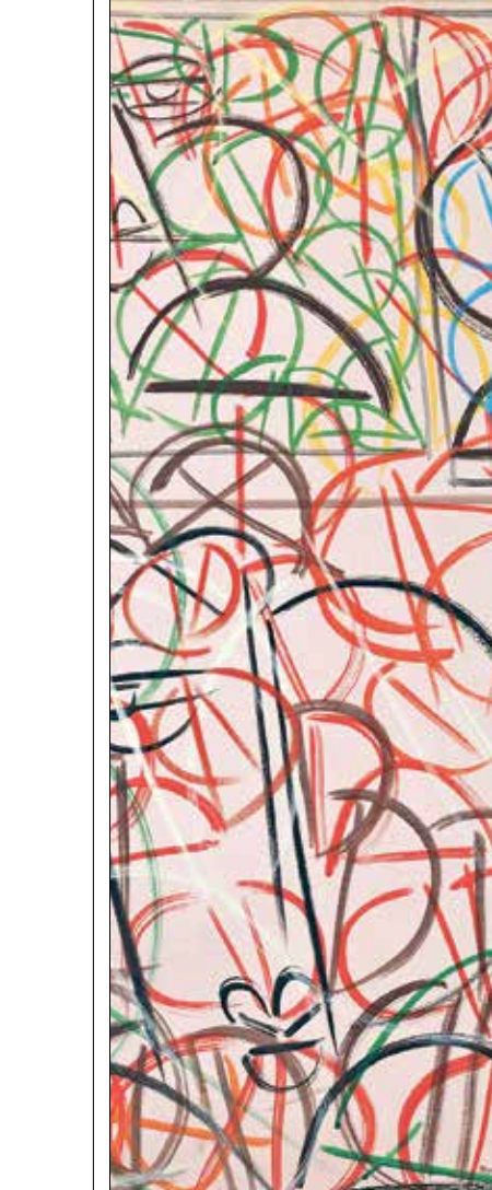
معك بلا عنوان ل حبس٢ ماضي (لبنان)، اكريليك على قماش، 1976

الرواية الأم، إذا جاز التعبير، هي رواية الوراق الذي، بعد أن تكاثرت عليه الأمور وانتحر أبوه، فخامره هو الآخر رغية بالانتحار. ليس الأمر هنا فحسب، لكن الوراق ليس واحد، إنه اثنان لا يتفكان يتحاوران في داخله. واحد بحث الآخر على أن ينتحر، بل ويحثه على أن يتخذ حياته ويقوم بمغامرة أخرى، قد تكون القتل نفسه. نحن هنا أمام شخص سيكوباتي، أمام شيروفريننا معلنة، هنا ما يخطر ونحن نسمع الشخص الثاني يتكلم في الرواية. مع ذلك فإننا لسنا أمام رواية سيكولوجية، إذ إن هذا الشخص الثاني يكاد يملك وجودا موضوعيا. سيبقى موجودا طوال الرواية، لكنه يكاد يتبدل هو الآخر معها، بل تتغير لهجته نفسها، فإذا كنا قد بدأنا معه بفكرة الانتحار، فإننا، مع بقائنا عليها، سنجاوزها أو نكاد.