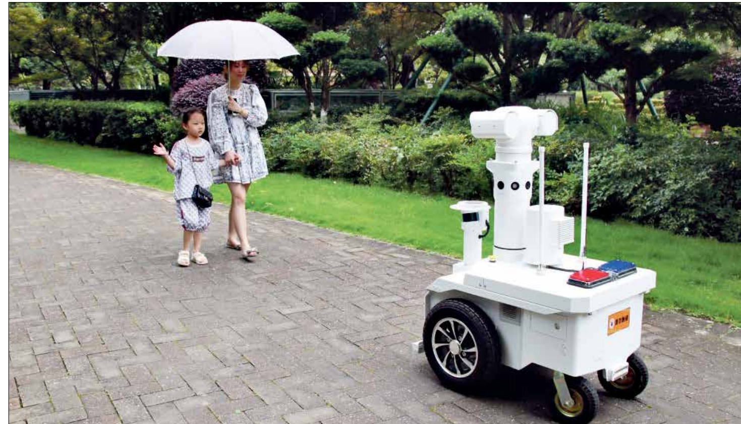
يراقب مكالمات ريمب المارات في مجمع سكني بالصين