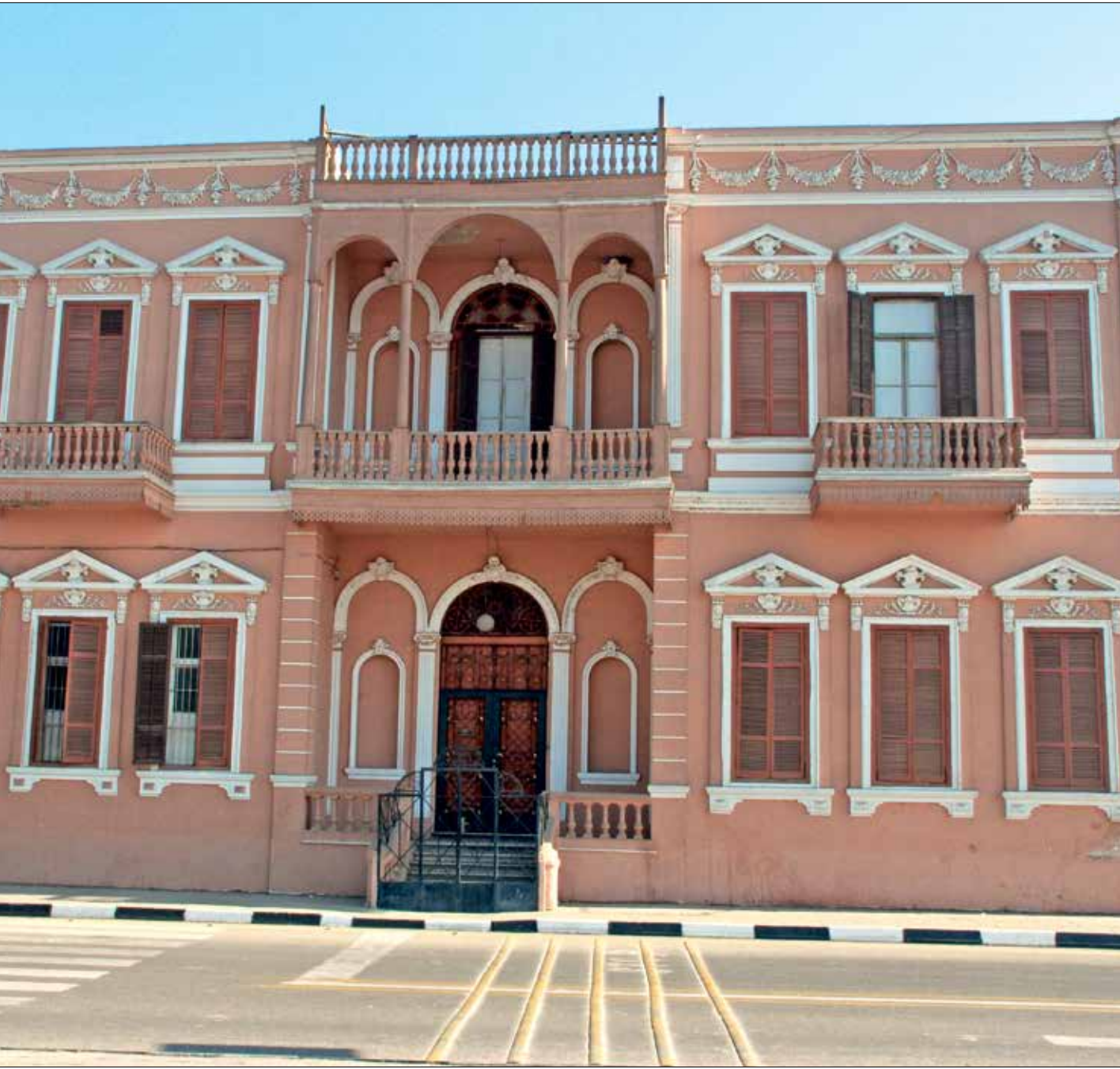
قصر اندراوس في عام 2009

صحيح انه يمكن القول بان قصر اندراوس قد بُني في منطقة أثرية، ولكنه بات جزءا من المكان، والتاريخ يحتمل طبقات كثيرة تتراكم فوق بعضها، خصوصا وان المعلم شاهد على مرحلة تاريخية مهمة أيضاً، وهي فترة نضال الحركة الوطنية المصرية