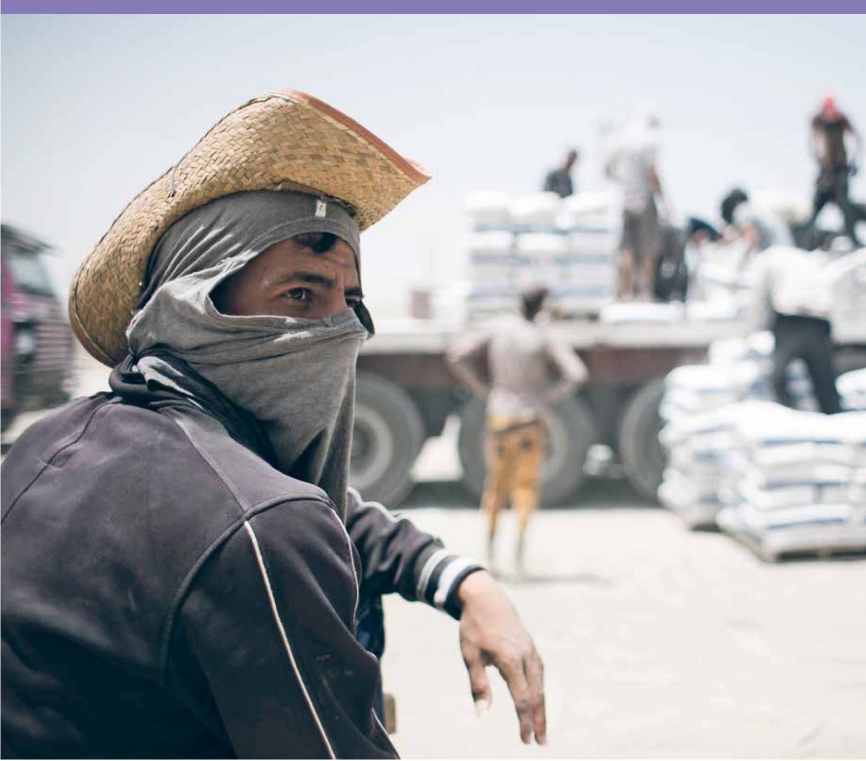
فلسطينيون يبيعون شاحنة إسمنت بعد دخولها غزة من مصر رفيع الحدودي مع مصر

مباشر، عدا عن تشغيل عشرات الآلاف من المهنيين والحرفيين ضمن القطاعات الخترنية عليه كالتجارة والحدادة والكهرباء والسباكة، وهو ما يجعل هذا القطاع محركاً أساسيا للاقتصاد المحلي. ويؤكد وكيل وزارة الأشغال العامة والاسكان في غزة ناجي سرحان، أن السوق يعاني من شح كبير في مواد البناء الخام على صعيد الحديد وحصى البناء ومواد تعبيد الطرقات، جراء المنح الإسرائيلي