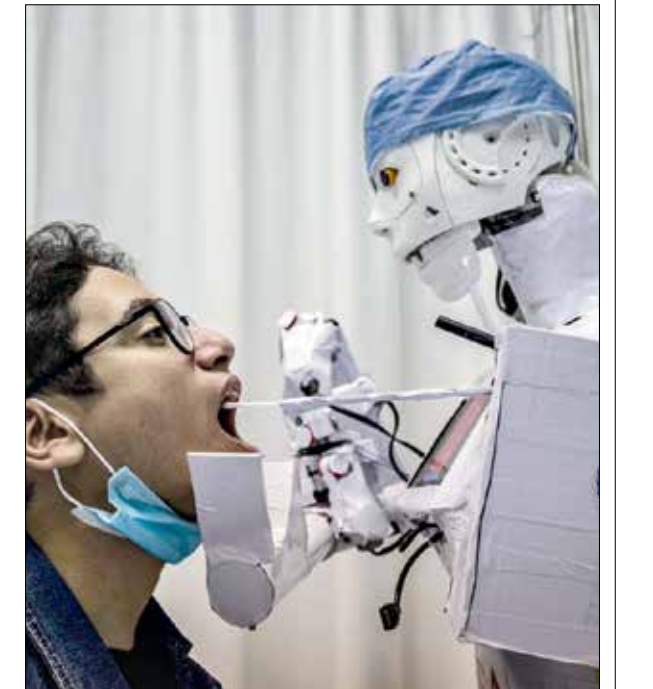
يجرب فحص كورونا في مصر

من البديهي أن تشهد الروبوتات أو الإنسان الآلي طفرة قوية بعد تفشي كورونا، ففكرة إيجار روبوتات عاملة تساعد على تخفيف العبء عن المستشفيات، باستخدامها في عمليات سحب الدم والخطرة على سبيل المثال سيحسني عاملين، كما أن عملهم في المصانع في أوقات الأوبئة والمرض سيساهم في دفع خطر الإصابة عن العمال. في البدء، جرى تطوير الروبوتات لتنفيذ وظائف مملة غالباً أو خطيرة أحياناً، لكن جائحة كورونا قد تنقل التوجه العام لأهمية استخدام الروبوتات