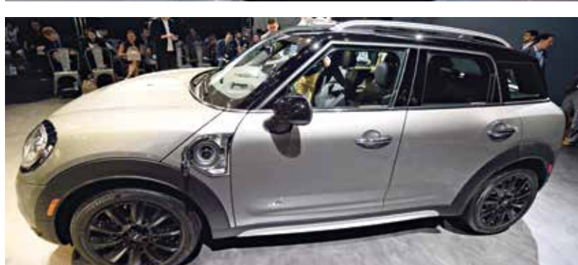
الهجينة «أودي Q5» 2014 و«ميتيب كوبر كواتر جيه SE» 2019

بريدون أن يفقدوا التصميم الداخلي الفاخر. 8 - «الهيجنه إنفينيتي QX60» موديل 2017: تستحق النسخة الهجينة ثلاثية الصفوف هذه البحث عنها في حال كنت تصعد سوق سيارات الدفع الرباعي المصديقة للبيئة، نظراً للكثير من المميزات الفاخرة، بسعر يقل عن 30 ألف دولار.