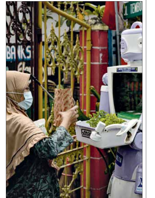
يسلم امرأة خبزاً في الهندوسيا