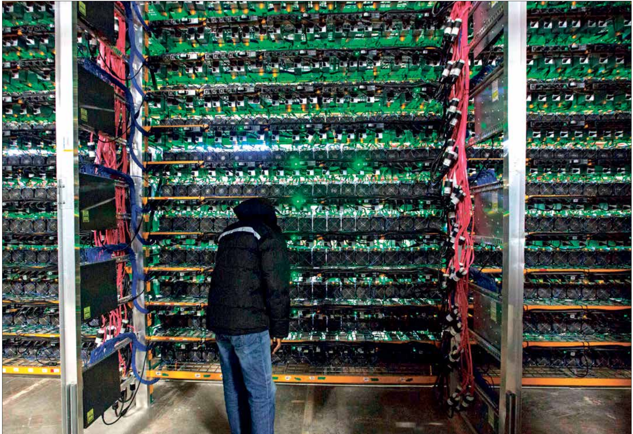
العملات الرقمية يسهل استخدامها للتخلف على العقوبات