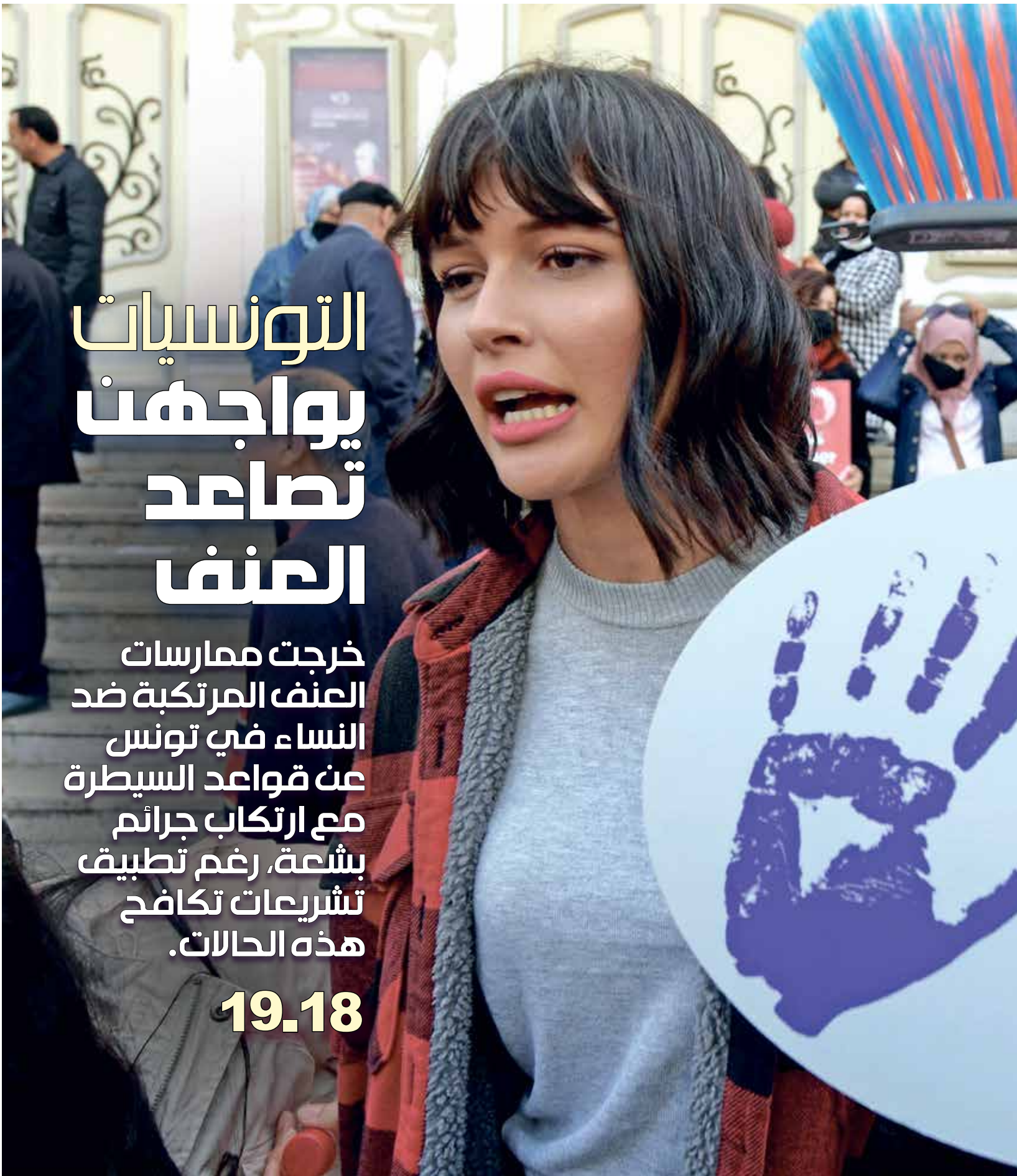
تظاهرة مناهضة للعنف ضد النساء في تونس العاصمة