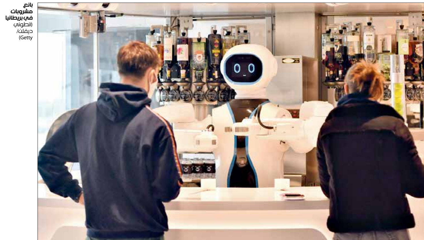
يأكل مشروبات في بريطانيا