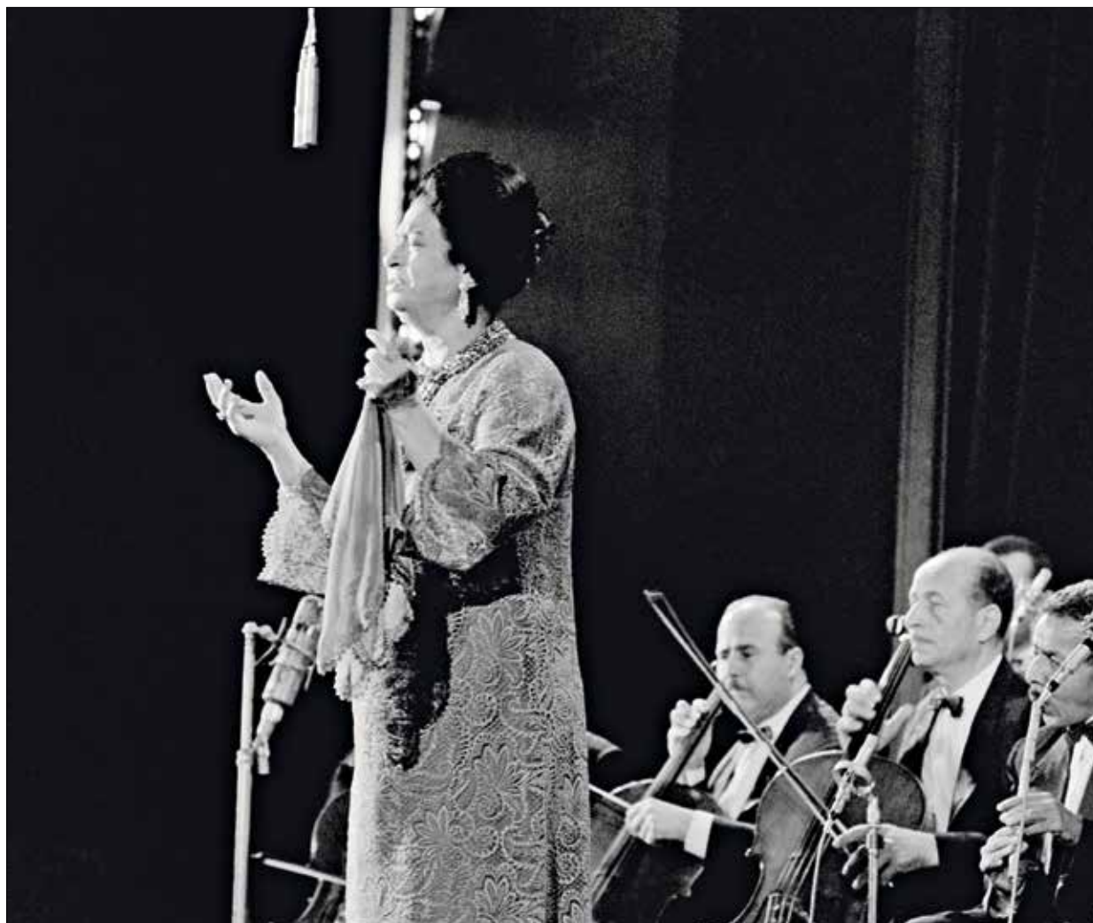
بعد 4 عقود من تسجيلها، قررت أم كلثوم إعادة تقديم القصيدة

بعد أكثر من قرن على غنائها للمرة الأولى لا تزال قصيدة «أراك عصي الدمع» لأبي فراس الحمداني محط بحث واهتمام في العالم الموسيقي العربي. تعود هنا إلى مختلف التجارب التي غنت هذه القصيدة والفروقات بينها