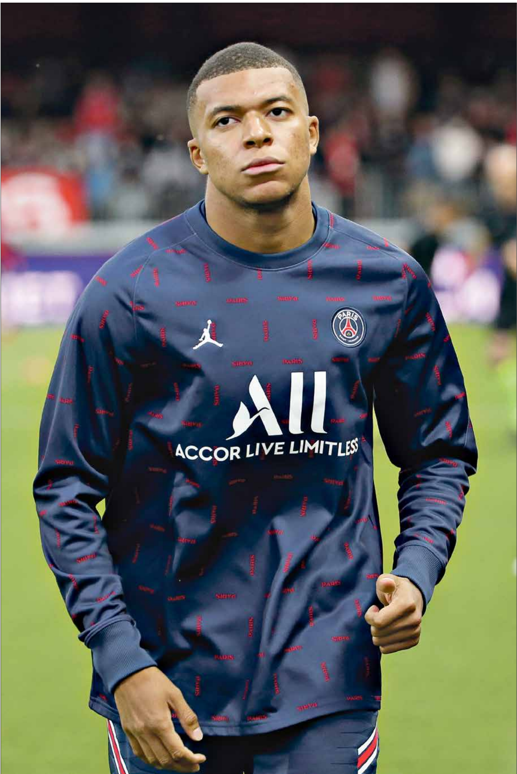
هك ييفت كيليان مبابيه مع باريس سان جيرمان هذا الموسم