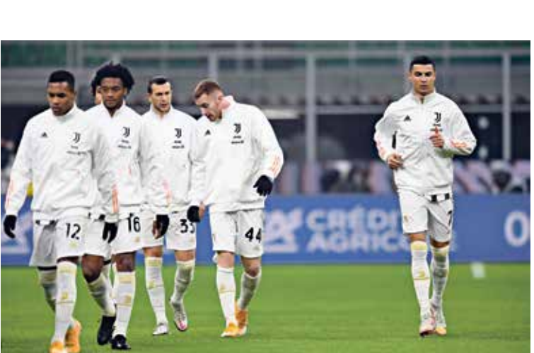
هدف رونالدو العودة ليونايتد مرة أخرى

فاجت إدارة نادي مانشستر يونايتد الإنكليزي الجميع، بعدما أعلنت بشكل رسمي في موقعها الإلكتروني، عودة النجم البرتغالي المخضرم كريستيانو رونالدو إلى صفوف «الشياطين الحمر» قادماً من يوفنتوس الإيطالي بعدما كان قريباً للغاية من الانتقال إلى الغريم مانشستر سيتي. وتحت الحساب الرسمي لنادي مانشستر يونايتد على «تويتر» تغريدة، جاء فيها: «هلا بك كريستيانو رونالدو في منزلك» الأمر الذي أدى إلى تفاعل جماهير الشياطين الحمر» يسعى مهمة جديدة مع «الشياطين الحمر».