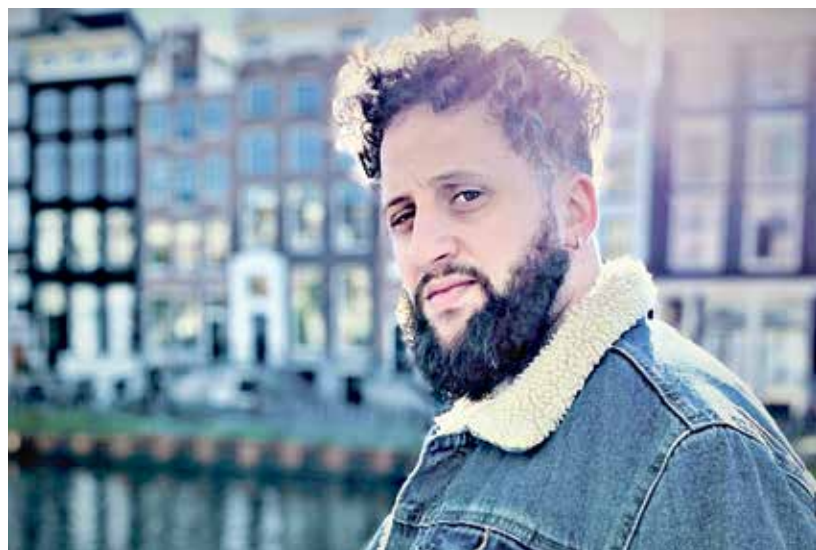
المئات السوريون بو كلثوم (مستجاب)

هذا التوجه لم تكسره بعض الإضافات على مستوى اللحن والتوزيع ودخول المقامات