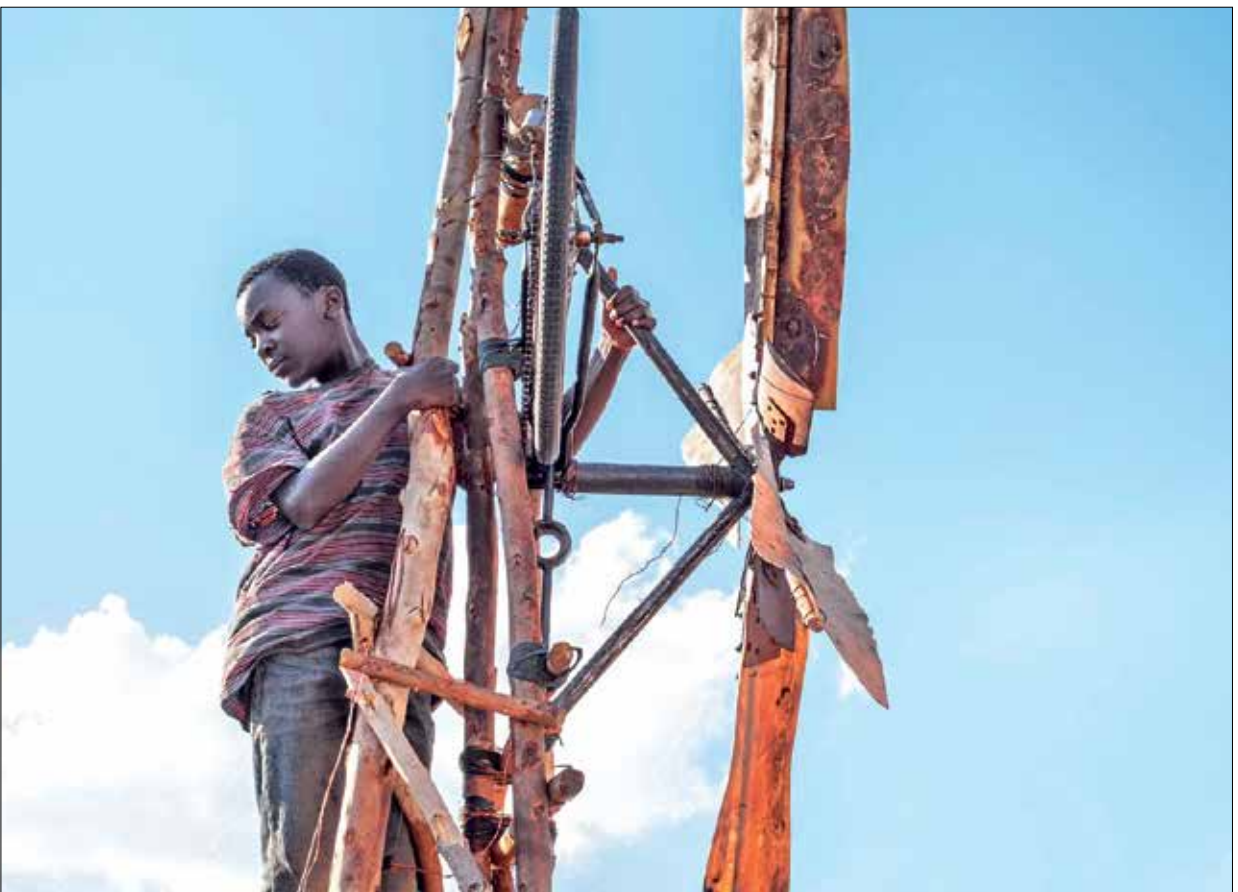
من فيلم «الصبي الذي اخضع للريح»

دون هدمه، كما ان الاستعانة بخبراء يمكن ان يقضي للوصول إلى الموقع الفرعوني المحتمل تحت القصر من دون تدمير هذا الأخير. لكن نزعة اللامبالاة التي نجدها لدى المسؤولين تجعل مثل هذه القرارات الرسمية وكأنها تنفيذ لما عجز عن