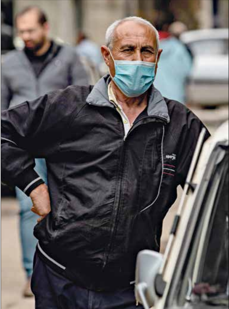
تكمير دادم بالصيانة (جليل سليمان، فرانس برس)

في المائة، فإن نسبة ارتكاب جرائم والاشتباه في ذلك ارتفعت في جرائم مخددة حتى عام 2018، وهي تتعلق بالأساس باختراص وزراء سيار الوسط، مستحقين لوفيق، على أن يدخل أسفلاته من منصفه فجأة، على أن يدخل ذلك حذر التنقيذ في نوفمبر/ تشرين الثاني المقبل ويامل الحرب الاجتماعي الديمقراطي أن يقطع الطريق على استغلال اليمين القومي المتشدد للعنف المتشدد خلال قوانين جديدة تواجه تزايد تحدي العصابات وتنتاج أفعالها الدموية شبه اليومية، حتى لا يخسر في الانتخابات التشريعية العام المقبل أمام منافسه من اليمين ويمين الوسط اللذين يجعلان تلك القضية على رأس جدول أعمالهما، وعملياتها الدعائية.