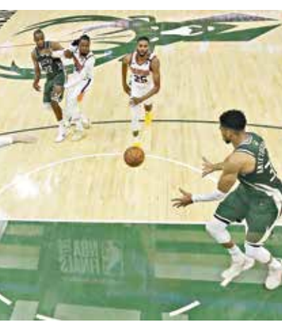
الملايس والزوار والحكام.

باعت الرابطة الوطنية للاعبين كرة السلة في الولايات المتحدة مذكرة داخلية إلى 30 فريقاً في الدوري المحلي، لإبلاغهم بضرورة حصول جميع أفراد الطاقم الذي سيحمل مع اللاعبين والحكام على الجرعات الكاملة من اللقاح ضد فيروس كورونا مع بدء التدريبات في سبتمبر/ أيلول المقبل. وتضمنت المذكرة جميع الأشخاص الذين يسافرون مع الأندية أو من يمكنهم دخول غرف الملابس والزوار والحكام.