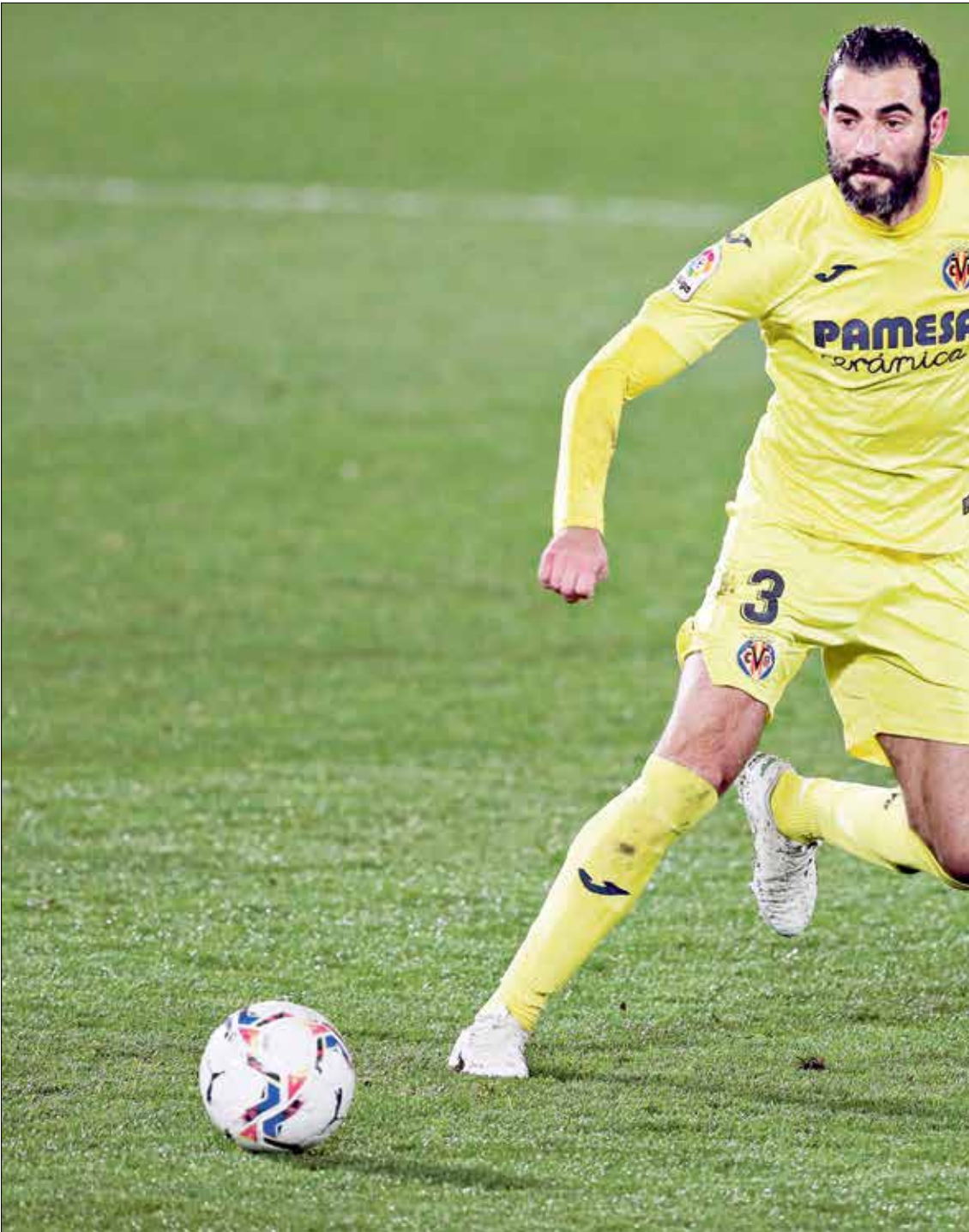
مواجهة من القمة منافسات الأفيس

انتصر فريق بوروسيا دورتموند على هوفنهايم (2-3) في لقاء الجولة الثالثة من منافسات دوري الدرجة الأولى الألماني لكرة القدم «البوندسليغا، الذي احتضنه ملعب (سيخال إيدونا بارك)، وتقدم جيوفاني رينيا في النتيجة لأصحاب الأرض، درومتوند، في الدقيقة 49. وعادل كريستوف بومغارتنر الكفة للضيوف، هوفنهايم، في الدقيقة 61، وأحرز جودي بيلينغهام الهدف الثاني لدورتموند في الدقيقة 69. لكن مؤنس ديور عامل الكفة مجدداً في الدقيقة 90، وكانت المباراة في طريقها نحو التعادل لكن مهاجم دورتموند، إيرلينغ هالاند، أبى أن تضع نقطتان على فريقه، وأحرز الهدف الثالث في الدقيقة 149-149. ويانتصاره، اعتلى بوروسيا دورتموند مؤقتاً صدارة ترتيب الدوري الألماني برصيد 6 نقاط، بينما توقف رصيد هوفنهايم عند النقطة 4 في المركز الرابع.