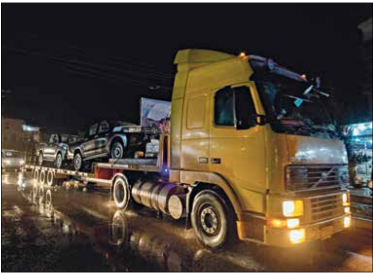
شاحنة تعبر القامشلي ليلاً

يقول جاسم علاوي المشرف على مشروع لتعبيد طرق في ريف دير الزور الشرقي الخاضع لسيطرة الإدارة الذاتية، لـ«العربي الجديد»: «مشروع التاهيل الذي تعمل عليه مستمر منذ أكثر من شهر، ويشمل مناطق عدة في دير الزور في قطاعات شرقي أول المدخ من الحجرة - الباغوز، وشرقي ثاني من أبو حماد إلى شكبة، غربي الجزائر - الحصان، ووسط صيطرة - أبو حروب، والجديد» - وشمالها الحصين العزبة والصور والسجديد» - وتحددت مدة تنفيذها بخلافة أشهر، بإشراف هيئة الخدمات والبلديات في ريف دير الزور. وتفيد دراسة أجراها مركز «اجيدو» بأن قوات سورية الديمقراطية (قسد) تسيطر على نسبة 15,7 في المائة من شبكات الطرق في سورية، بمساحة مقدارها 11581,4 كيلومتراً، و22 في المائة من شبكة الطرق الرئيسية في البلاد بمساحة تقدر بـ 1933 كيلومتراً، و23 في المائة من الطرق الفرعية، بمساحة 2128 كيلومتراً.