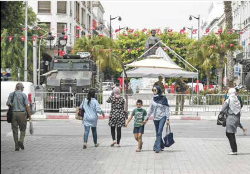
يحتشد التونسيون تدهور الوضع اكلر في البلاد