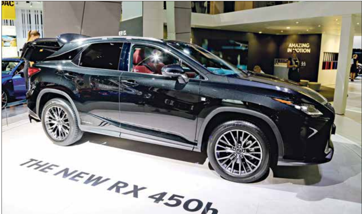
«كروس RX 450h» موديل 2015