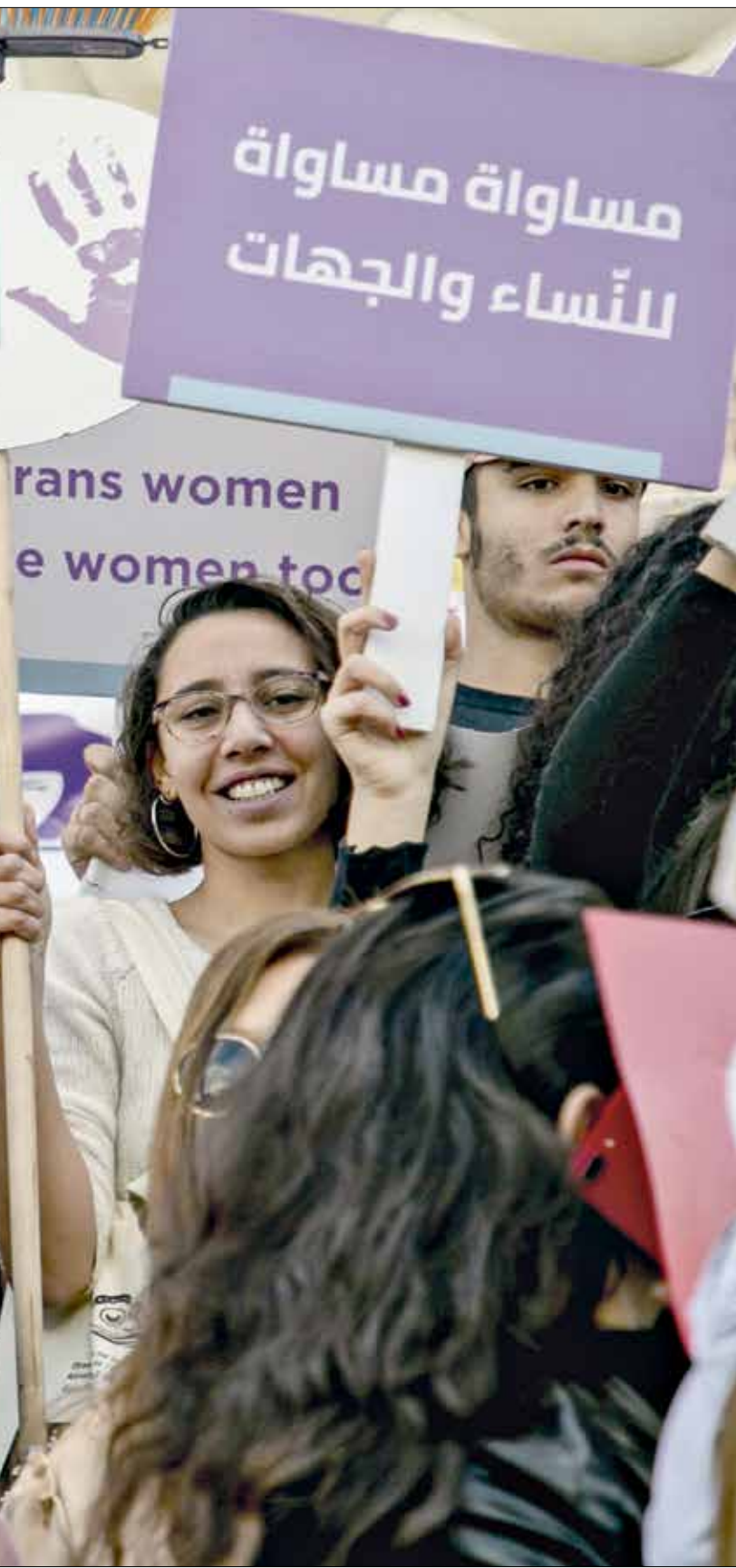
المرأة التونسية صرّخة على مواجهة العنف

ممارسة مقبولة تتطور إلى نهايات أو نتائج لا تحمد عقباها». وأملت الوزارة في تطبيق القانون 58 الصادر عام 2017 الذي يوفر حماية للمرأة من الضغوط التي قد تتعرض لها لدفعها إلى التخلي عن تقديم شكاوى، وإن تعاون كل الأطراف عن تطبيق هذا القانون من أجل أن يحقق هدفه في القضاء على كل أشكال العنف ضد النساء، وحفظ كرامتهن الإنسانية. وإبعاد كل مظاهر التمييز بين الجنسين. ورغم أن قانونا صدر عام 2017 جزم العنف ضد المرأة، ما شكّل حدثاً غير مسبوق في أول انبعاث قد يطالها، كي لا يتحول إلى