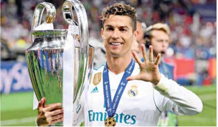
رحل رونالدو عن يوفلوس بعد 3 سنوات

ويحتل رونالدو 84 هدفاً سجلها مع مانشستر يونايتد في فترته الأولى، لكن «صاروخ ماديرا» يطمح إلى الوصول لـ100 هدف ليصبح النجم البرتغالي الوحيد، الذي سجلها في تاريخ الدوري الإنكليزي الممتاز، بعدما فعلها سابقاً في «الليغا» عندما أحرز بقميص ريال مدريد 31 هدفاً ورغم رحيله وغيباه الطويل الذي امتد لـ12 عاماً، بقيت 3 أرقام تاريخية صامدة للنجم البرتغالي كريستيانو رونالدو مع مانشستر يونايتد الإنكليزي الذي يبدو مُصمماً على مواصلة نشر سحره مرة أخرى في ملاعب «البريميرليغ».