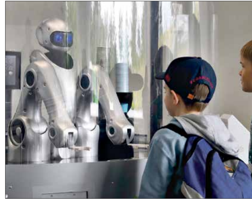
تأكل في مطعم باليابان

في حديثه لقناة «عذر» الحكومية، هذا الأسبوع، حاول مدير شرطة عزز منصور الأكلبي التنصل من اتهامات بوجود اختلالات أمنية داخل المدينة بالصورة التي تقدمها وسائل التواصل، وارجع إلى ما يفهمه بـ«المسبكين»، الذين يقومون بتضخيم الأمور بشكل غير طبيعي، حسب تعبيره. شن المسؤول الأمني حملة تحريض على ناشطي السوشال ميديا، عندما قال إن مواقع التواصل الاجتماعي «بدلاً من أن تكرس لدعم الاستقرار تتحول إلى نوع من