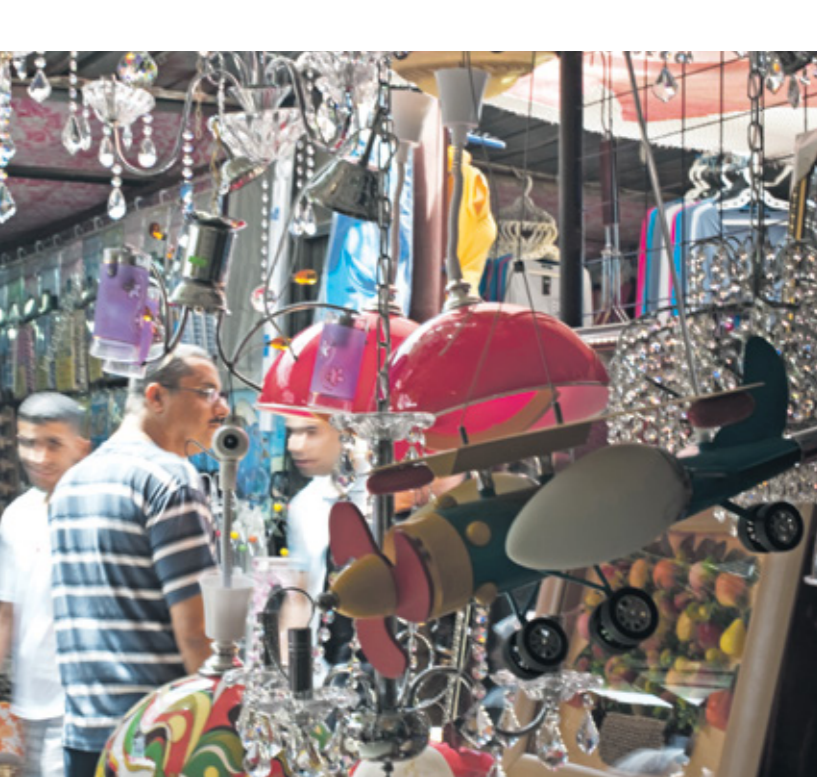
زبده الجبابة لمرقعة المحيد من الأنشطة التجارية

واستفادت خزينة الدولة من تحسن التحصيل الضريبي، حيث ارتفعت عائدات الجباية العادية (دون احتساب الجباية النفطية) العام الماضي 2021. لتصل إلى 4020 مليار دينار (الدولار = نحو 145 ديناراً) ما يمثل زيادة بـ 13 بالمائة مقارنة