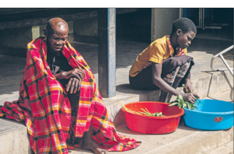
مواطنو أوغندا يعانون من الجفاف، إلى جانب نقص الغذاء

تعد زعماء مجموعة السبع أمس الثلاثاء بتقديم 4,5 مليارات دولار لمكافحة الجوع في العالم، واتفقوا على تنفيذ جهودهم لمساعدة المزارعين الأوكرانيين على مواصلة العمل ومعالجة نقص الأسمدة الذي يؤثر سلبا على قطاع الزراعة وإنتاج الحبوب. ووافقت المجموعة على ختام قمة استغرقت ثلاثة أيام في جبال الألب البافارية على توجيه الدعوة لأولئك الذين يملكون مخزونات لتوفير الغذاء، وشدت على الالتزام بالخلفاء على الأسواق الزراعية مفتوحة، وذلك وفق وزيرن، وحسب فرانس برس، ضخت دول مجموعة السبع الصناعية الثلاثة البلدان والشركات التي تحلكت مخزونات غذائية كبيرة على المساعدة في تخفيف حدة أزمة الجوع الناجمة عن الغزو الروسي لأوكرانيا. ودعت في بيان «جميع