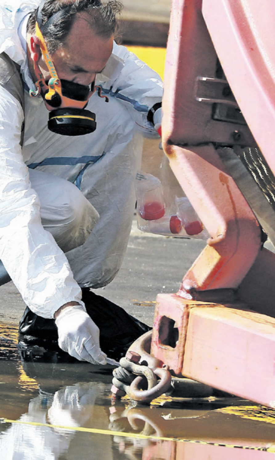
خبير جنائي يهذب موقع الانفجار خلال مزعاهوي