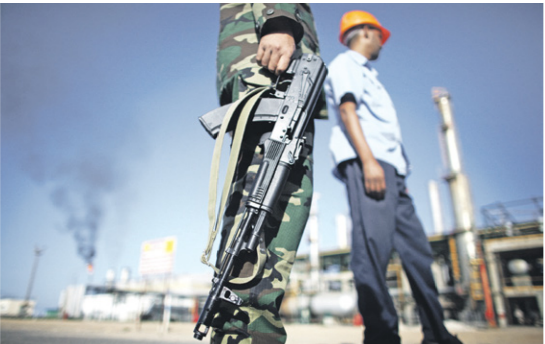
تعاوني الإنتاج بسبب تكرار انفجارات الحقول (فرانس برس)

وفي المقابل، تؤكد حكومة فتحى باشاغا أنها هي الحكومة الشرعية لأنها منتخبة من مجلس النواب (البرلمان) وأن تفويض حكومة الوحدة الوطنية انتهى في 22 يونيو/ حزيران، وشهدت صادرات ليبيا من النفط تراجعاً إلى 500 ألف برميل، أمس الثلاثاء، من 1,260 مليون برميل يومياً في شهر مارس/ آذار الماضي، نتيجة علاقات جديدة أكتت في ظل وجود حكومتين مع توقف إنتاج النفط والمشاكل الفنية التي يعاني منها القطاع. وتعد ثروة ليبيا النفطية المصدر الرئيسي لإيرادات الحكومة، وهي عاقله مرآزا وتكرازا في ظل صراعات متواصلة للسيطرة عليها بين الفصائل المتحاربة في الدولة المنقسمة. وفي ظل هذه الصراعات، توتثر علاقة وزير النفط في طرابلس محمد عون برئيس المؤسسة الوطنية للنفط مصطفى صنع الله منذ فترة طويلة. ما دفع رئيس حكومة الوحدة الوطنية إلى الاتجاه بموجب القانون رقم 24 لعام 1970 لنحل محل المؤسسة الليبية العامة للبتروول والتي انشئت بموجب القانون رقم 13 لسنة 1968. وتمتلك المؤسسة الوطنية للنفط شركات