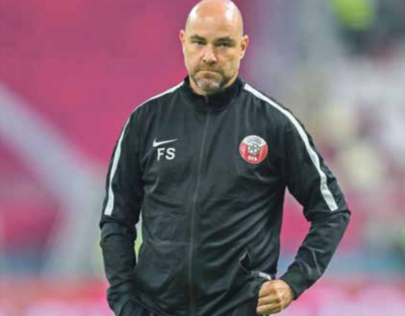
سانشيز قاد قطر لفتح باب اسما 2019

المقبل «ستكون بروفة للمونديال، خصوصاً وأننا سنخوضها هنا في قطر وعلى ذات ملاعب كأس العالم، سنخبر الروتين، لكن في الوقت نفسه سنواصل استثمار فترات توقف فيفا المتاحة لخوض مباريات مع منتخبات كبيرة»، وتابع «سواجيه فرقاً اسبوية لعبنا ضدها، وأخرى أفريقية قوية تمتلك أسلوباً خاصاً وتضم لاعبين ينشطون في كبرى الدوريات الأوروبية». على غرار منتخبات الجزائر والمغرب ومصر، وهذا أمر إيجابي طبعاً»، وخاضت قطر ثلاث وديات خلال تجمعين الشهرين الماضيين في تركيا والتمسا حيث تعادلت مع كوستاريكا 1-1 وخسرت أمام كوريا بمرتين 2-1 وأمام غانا 5-1 «لا نكن خلال بعضنا أكتوبر في أفضل حالاتنا عقب فترة توقف طويلة. الفترة لم تكن مثالية بلعبنا لنا»، وواصل «واجهنا منتخبا غاناً قويا جدا بقدرات بدنية عالية. لم نلق على مجاراة إرتفاع المباراة في نصف الساعة الأخير، وعندما لا تكون حاضراً يمكن أن تلقى خسارة كذلك» وأضاف «لا نلشى أننا نواجه منتخبا انتقل احد لاعبيه للثنو من إسبانيا إلى إنكلترا بقيمة خمسين مليون يورو (توماس بارتى) فضلاً عن لاعبين ينشطون في دوريات إسبانيا وألمانيا وفرنسا...المنتجة تحصل في كرة القدم لقد خسر لغيرول أمام ستون فيلا بالسبعة».