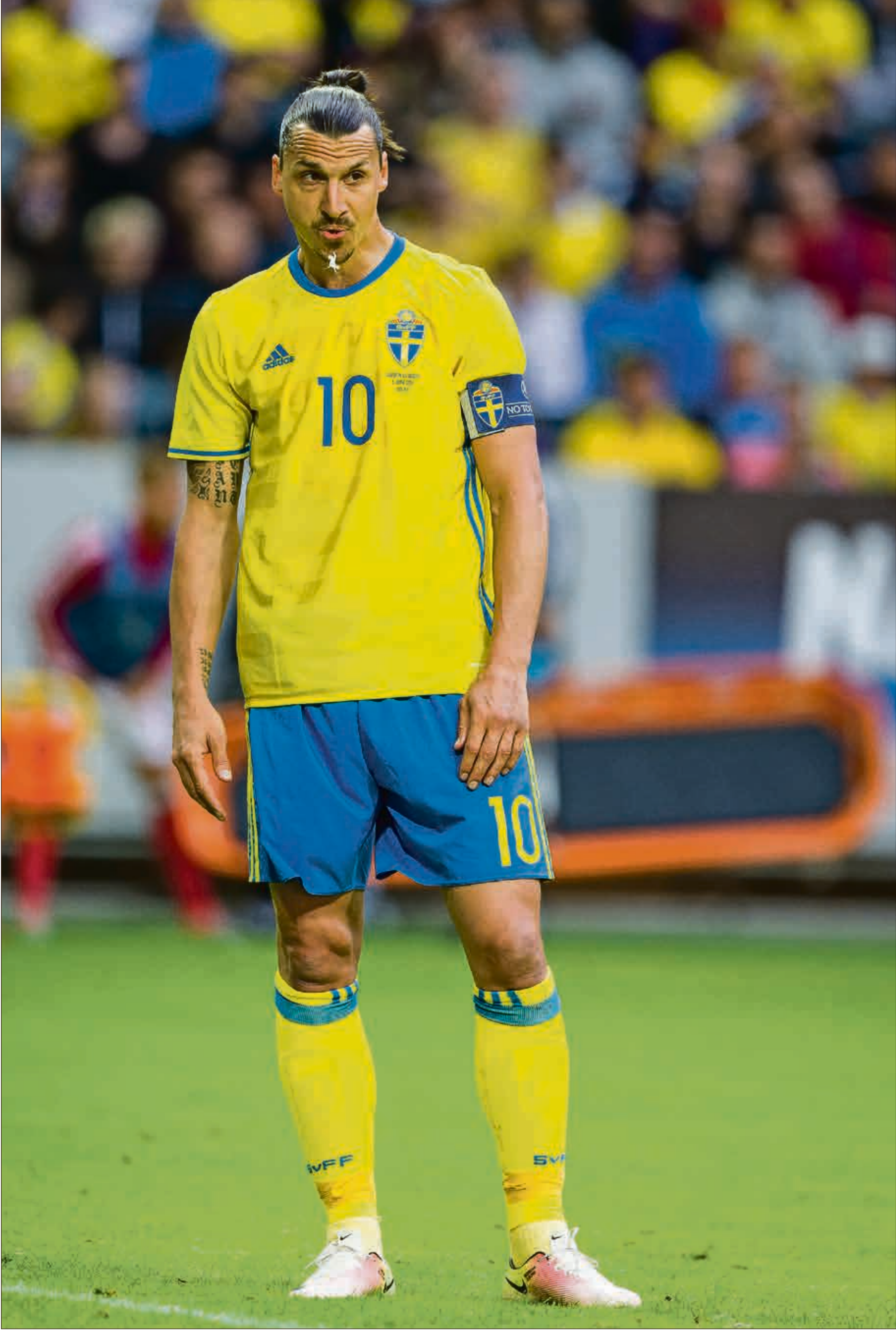
سكوتون عودة إبراهيموفيتش رانعة للجماهير السويدية

اقترب حلم عودة زلاتان إبراهيموفيتش من الاعتزال الدولي من التحقق، بعدما أكد الاتحاد السويدي لكرة القدم أن يان أندرسون، مدرب المنتخب الوطني، اجتمع مع المهاجم في ميلانو لمناقشة احتمال العودة للفريق. وقال إبراهيموفيتش، البالغ من العمر 39 سنة، في مقابلة أخيراً، إنه يفقد اللعب مع المنتخب الوطني ويفكر في العودة.