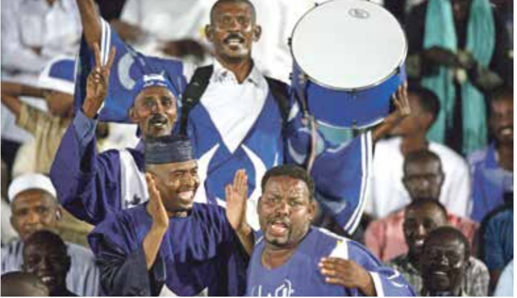
الهلك السوداني حشد نجومه لمواجهة الأبطال