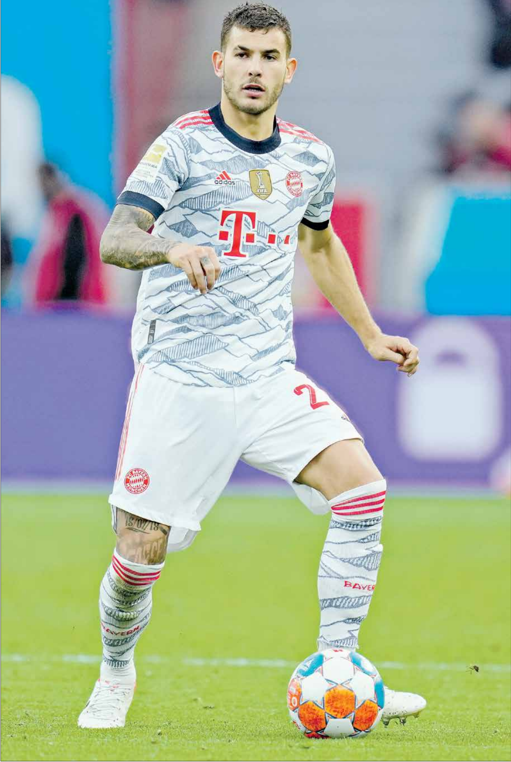
هيرنانديز تالف مع بايرن ميونخ

اعلنت محكمة في مدريد، أنها اوقفت تنفيذ الحكم السابق بحبس لوكاس هيرنانديز، مدافع بايرن ميونخ ومنتخب فرنسا، لمدة ستة أشهر، بعد مخالفة قرار محكمة وعقب إدانته بالعنف المنزلي ضد شريكته في المحكمة، في 2017. وقالت المحكمة، في بيان رسمي، إنها قررت إيقاف تنفيذ الحكم لمدة اربع سنوات، طالما ان اللاعب لم يرتكب اي خطأ جديد».