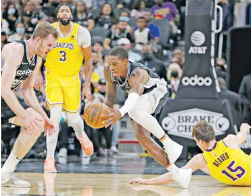
ليكرز حقق انتصارا صعبا على سبيرز

مزدوجة للمرة الخامسة في مسيرته، وحقّق نيويورك نيكس أول فوز له على فيلادلفيا سفنتي سيكسرز للمرة الأولى منذ عام 2017، بالفوز عليه 99-112، منها سلسلة من 15 هزيمة تواليا أمام منافسه. وتميز أداء نيكس بالجماعة، حيث نجح ثلاثة لاعين في تحقيق الفوز، وهم كيمبا وكر (19 نقطة) وجولويس راندل (16) والفرنسي إيفان فورنيه مع 18 نقطة. وقد لعب الأخير دورا دفاعيا كبيرا من خلال مراقبته لنجم فيلادلفيا الكاميروني جويل امبييد وكر من خطورته، ليكتفي بتسجيل 14 نقطة فقط، اما أفضل مسجل في صفوف سيكسرز فكان ثوبياس هاريس مع 23 نقطة. وحقّق دالاس مافريكس أول انتصار له على ملعبه هذا الموسم بفوزه على هيوستن روكتس 106-116 بفشل 26 نقطة لنجمه السوفلوني لوكا دونتشيتش، الذي نجح في 14 متابعة و 7 تمريرات حاسمة أيضا.