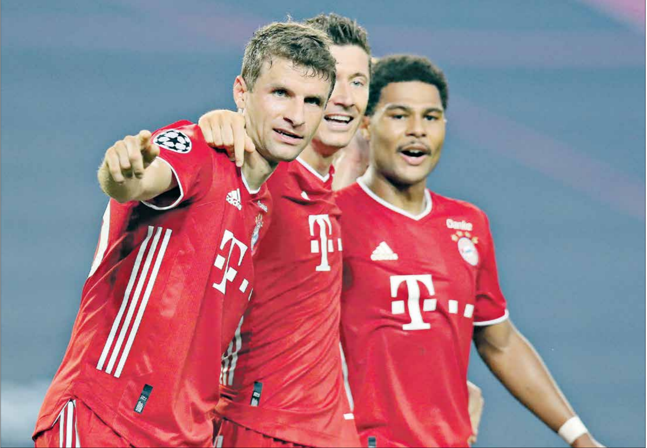
بايرن ميونخ يعلن عن أبرز اللاعبين الصنويين الهجوميين (البروكي جوناغو)

معينة وهو ما وجدته في البلجيكي، الذي ينتهي عقده مع ليستر سيتي نهاية الموسم المقبل، ويرغب اللاعب في الانتقال لحطة أكبر عبر نهاية هذا الموسم، بعد أن وضعه نجم ليستر سيتي، البلجيكي بوري تيليمانس، الذي يقدم أداء مميزاً في الأونة الأخيرة مع «الثعالب»، في قائمة أولوياته وبحسب شبكة «أي بي إن» العالمية، فإن بايرن يبحث عن لاعب وسط بمواصفات