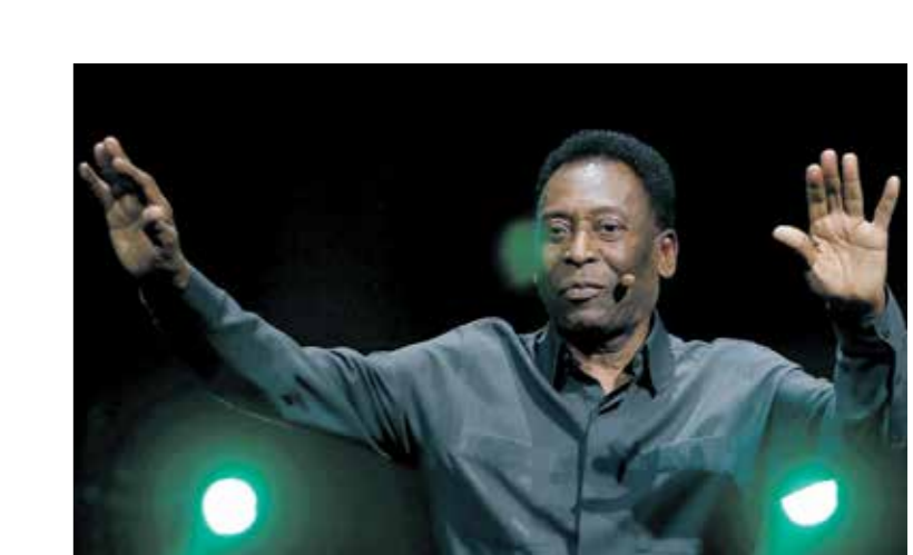
نرفع بيليه ان يكون ادو خليفته في كرة القدم

يعيش النجم الأميركي فريدي ادو، صاحب الـ(32 عاماً)، ظروفًا صعبة للغاية، بعدما وجد نفسه في الفترة الخالية من دون شارب بخوض معه المنافسات، رغم أنه كان يُعتبر خليفة أسطورة الكرة البرازيلية السابق بيليه، ونال اهتمام وسائل الإعلام بداية قصة فريدي ادو الحزينة بدأت عندما كان عمره 14 عاماً فقط وخطف الأضواء حينها، الامر الذي دفع إدارة نادي دي سي يونايتد إلى المسارعة للحصول على خدماته في عام 2004، وأصبح يسيرون على خطى الأسطورة بيليه، الذي