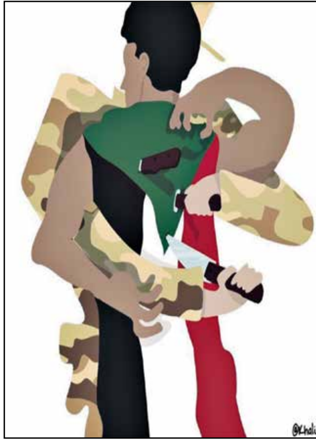
العسكر يطعنون شباب الثورة (خالد ود البيه/فيسبوك)

انقلاب السودان ما إن توالت أخبار الانقلاب العسكري في السودان، حتى ضج الإعلام ومعه سائل التواصل الاجتماعي بأخباره بالرغم من قطع الإنترنت. رسامو الكاريكاتير السودانيون أبدعوا ورسوموا العديد من الرسومات الكاريكاتيرية الرافضة للانقلاب العسكري، هذا إلى جانب العديد من الصور الساخرة المركبة والمميزة التي حفلت بها منصات التواصل الاجتماعي رفضاً لانقلاب البرهان. إليكم غيضاً من فيض الكاريكاتير السوداني النابذ للانقلاب.