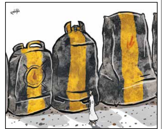
المواطن اليمني وحواجز الغذاء والوقود