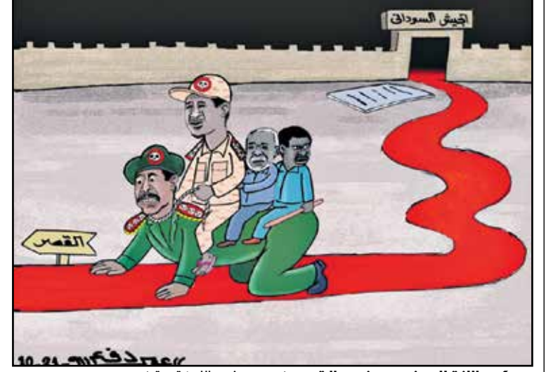
موكب الانقلابيين يسير نحو القصر