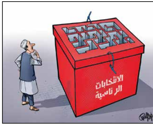
مهاة الانتخابات الرئاسية الليبية