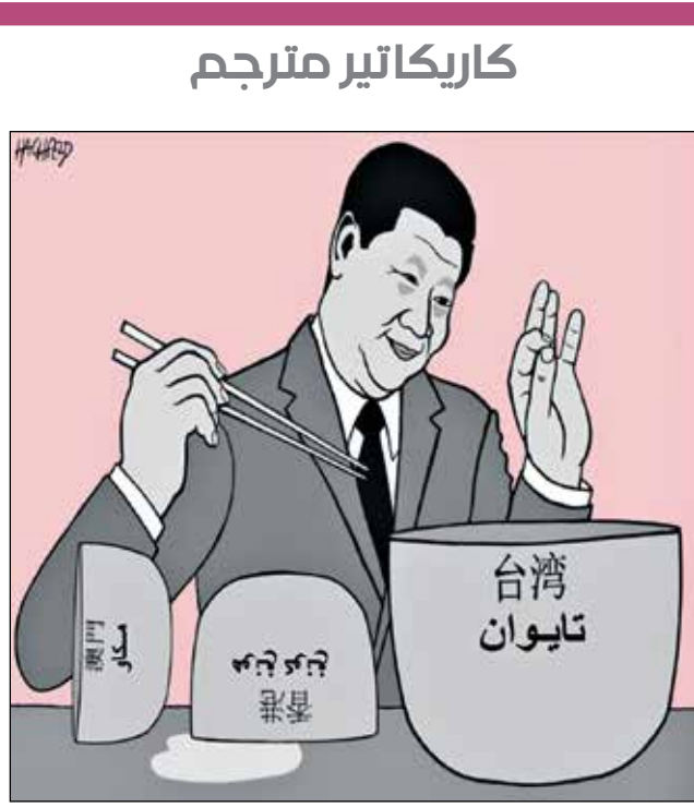
رينا هشفيلاذ/كيفل كار تونز