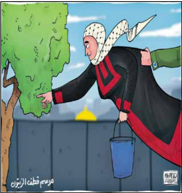
الاحتلال الإسرائيلي يجمع قاطفي الزيتون