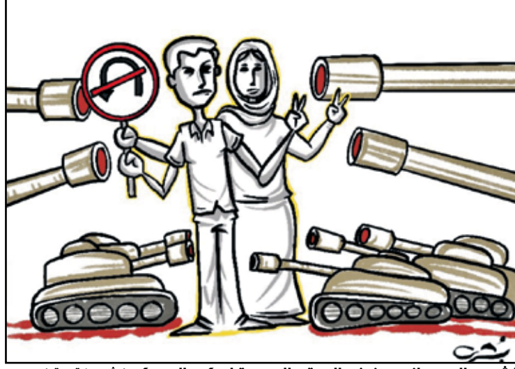
الشعب السوداني يرفض الردة والعودة لحكم العسكر

ولأن فخامته، أو عزم بإجراء تغيير كامل على قصره، وإدخال «الذكاء الاصطناعي»، والاستعانة بالروبوتات، وتحريك كل شي «عن بعد»، فقد عجزت ميزانية القصر، على ضخامتها، عن تلبية هذه المتطلبات، فكان لا بد من اجترار حل عاجل، وهو ما جادت به قريحة الزعيم نفسه، الذي بات يقرأ في الأونة الأخيرة، مصطلحات ضريبية لفتت انتباهه، لأنها تجيء مغلقة بإطار ناعم، على غرار «قرش التعليم»، و«قرش الريف»، و«قرش الأيتام». المهتم، راح فخامته يفكر باستحداث ضريبة جديدة، ففكر بداية أن يجعلها باسم «قرش الزعيم»، غير أنه سرعان ما نبذ الفكرة، نظرًا للتناقض الكبير بين عظمته وضالة القرش، فاختار اقتطاع ضريبة غير مباشرة، باسم «قرش النقابات»، وابتسم بسخرية حين خطرت المعادلة في ذهنه: «النقابات للشعب والقرش للزعيم». وأمر بسرعة التنفيذ؛ لأن أوضاع القصر مقلقة و«لم تعد تحتل التسوية». في صباح اليوم التالي، فوجئ الزعيم باكتوام النقابات تحيط بالقصر، وبخزينة الدولة فارغة تمامًا، لأن المعنيين بالتنفيذ، تلقوا الأمر معكوسًا: «النقابات للزعيم والقرش للشعب».