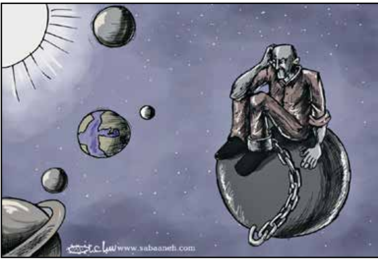
الاسرئ الفلسطينيون في عزلتهم