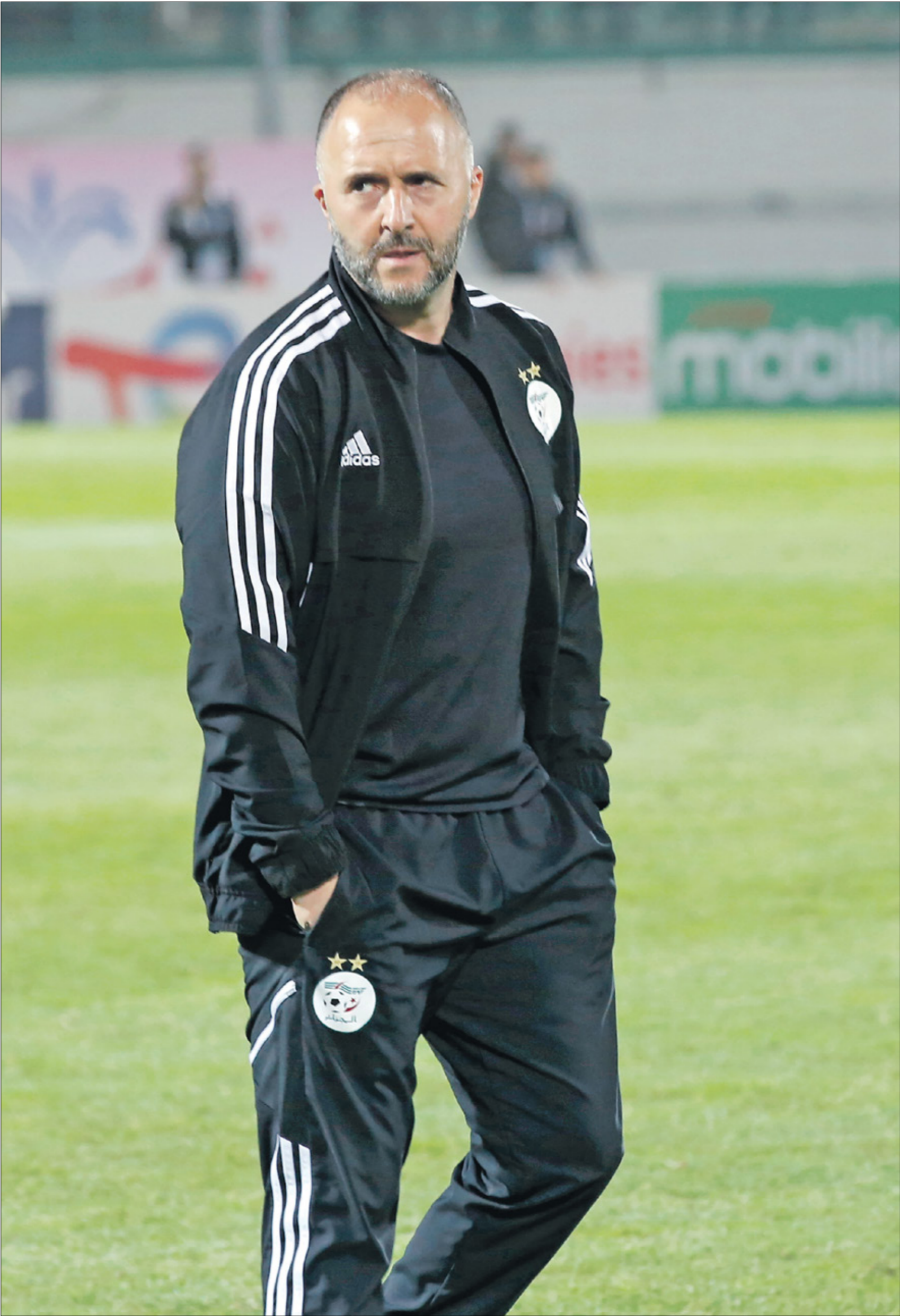
بلماضي كان فريدا من تراك منصبه محريا للجزائر