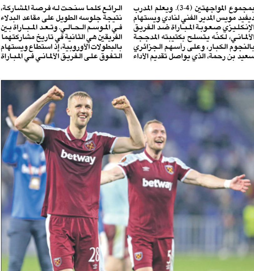
نجوم ويستهام جاهزون لربيع تهل

الرائع كلما سنحت له فرصة المشاركة، نتيجة جلوسه الطويل على مقاعد البدلاء في الموسم الحالي، وتعد المباراة بين الفريقين هي الثانية في تاريخ مشاركتهما بالخطوات الأوروبية، إذ استطاع ويستهام التفوق على الفريق الألماني في المباراة