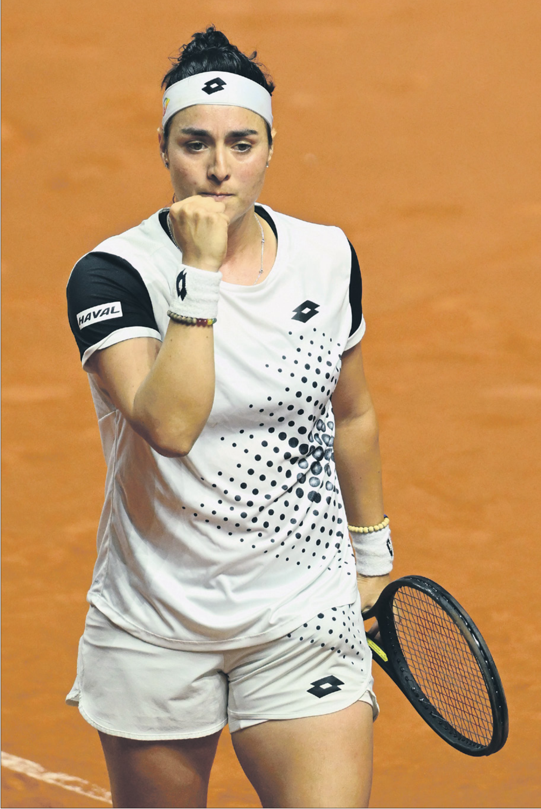
انس جابر المصنفة العاشرة عالمياً بين محترفات التنس

أوقعت قرعة بطولة مدريد للتنس للسيدات، التي تنطلق منافساتها اليوم الخميس وتستمر حتى 7 مايو المقبل، التونسية انس جابر، في مواجهة الإيطالية جاسمين باوليني، المصنفة 46 عالمياً. ولم يسبق لانس جابر مواجهة باوليني على مدار مسيرتها في ملاعب التنس. وكانت اللاعب التونسية، التي حافظت على مركزها العاشر عالمياً في التصنيف العالمي للاعبات التنس المحترفات، خرجت من الدور ربع النهائي لبطولة شتوتغارت.