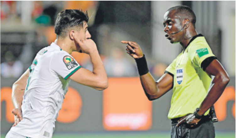
الحكيم الفريق مصالحة للاشفي

وتعيش الكرة الإفريقية في دوامة بسبب تردّي مستوى الحكام، وتكثبت بطولة كأس الأم الأفريقية في الكامبيرون 2021 مهالز بالجملة، لعل أشهرها مهزلة الحكم جاك سكاژوي الذي أنهى مباراة تونس ومالي في أولى جولات المجموعة لهما قبل نهايتها بنحو 5 دقائق، ثم انهاها قبل الموعد مرة أخرى بدقة، وسط زهول الجميع ورفض منتخب تونس بعد تدخل المراقب استكمال المباراة، والحكم سبكاژوي له واقعة لا تنسى في مباراة جمعت بين الترجي التونسي والوواد المغربي في نهائي دوري أبطال أفريقيا 2019، حينما كان حكماً لتقنية الفيديو، حيث تم اتهامه بالخواطأ وعدم تشغيل التقنية، ولم تستكمل وقتها المباراة، وتوج الترجي بجاء قرار «كاف» الأخير بإيقاف الحكم الجزائري مهدي عبيد، ليثير أزمة جديدة للتحكيم الأفريقي، خاصة في ظل ارتباط الحكم بأزمة في عام 2018 حينما تم اتهامه على المستوى الجماهيري، على هامش إدارته لمباراة الأهلي المصري والترجي التونسي في ملعب الأول في ذهاب نهائي دوري أبطال أفريقيا، عندما احتسب ركلة جزاء لأوليد ازارو مهاجم الأهلي شنوكا في صحتها، وبخت فيما بعد عدم