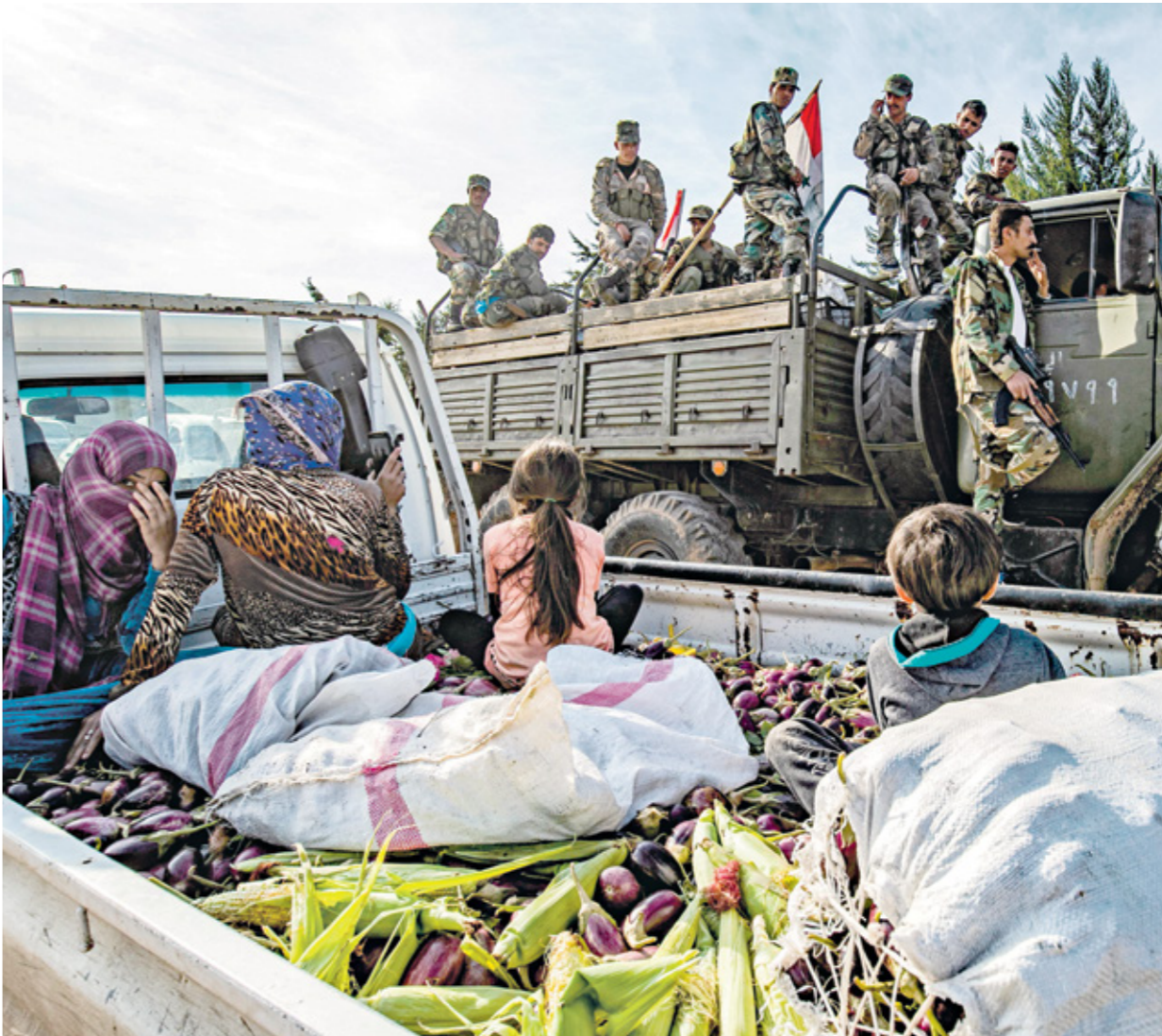
عناصر من قوات النظام في مدينة القامشلي بالحسكة. 2019

يعمل «الحرس الثوري الإيراني» على استمالة شيوخ عشائر مواليي للنظام السوري، في محافظة الحسكة، في الشمال الشرقي من سورية، وإغرائهم بالمال، لتشكيل مليشيات عشائرية، تخدم أجندة طهران في المنطقة، وذلك في ظلّ الأنشطة الروسي في اوكرانيا