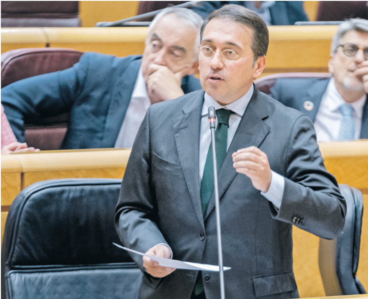
قال الباريس انه يرفض «تاجيح نقاشات عقبة» مع الجزائر