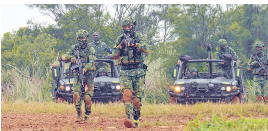
صوارات القوات الجوية الألبانية في مدينة سيه نو