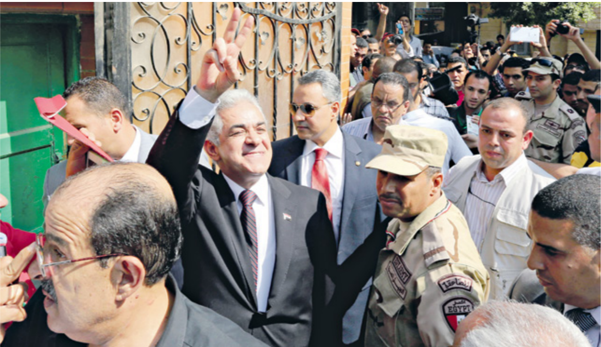
شكر صحابي السيسي على دعوه لحضور الإفطار (تدبير استيعاب/الأنوار)