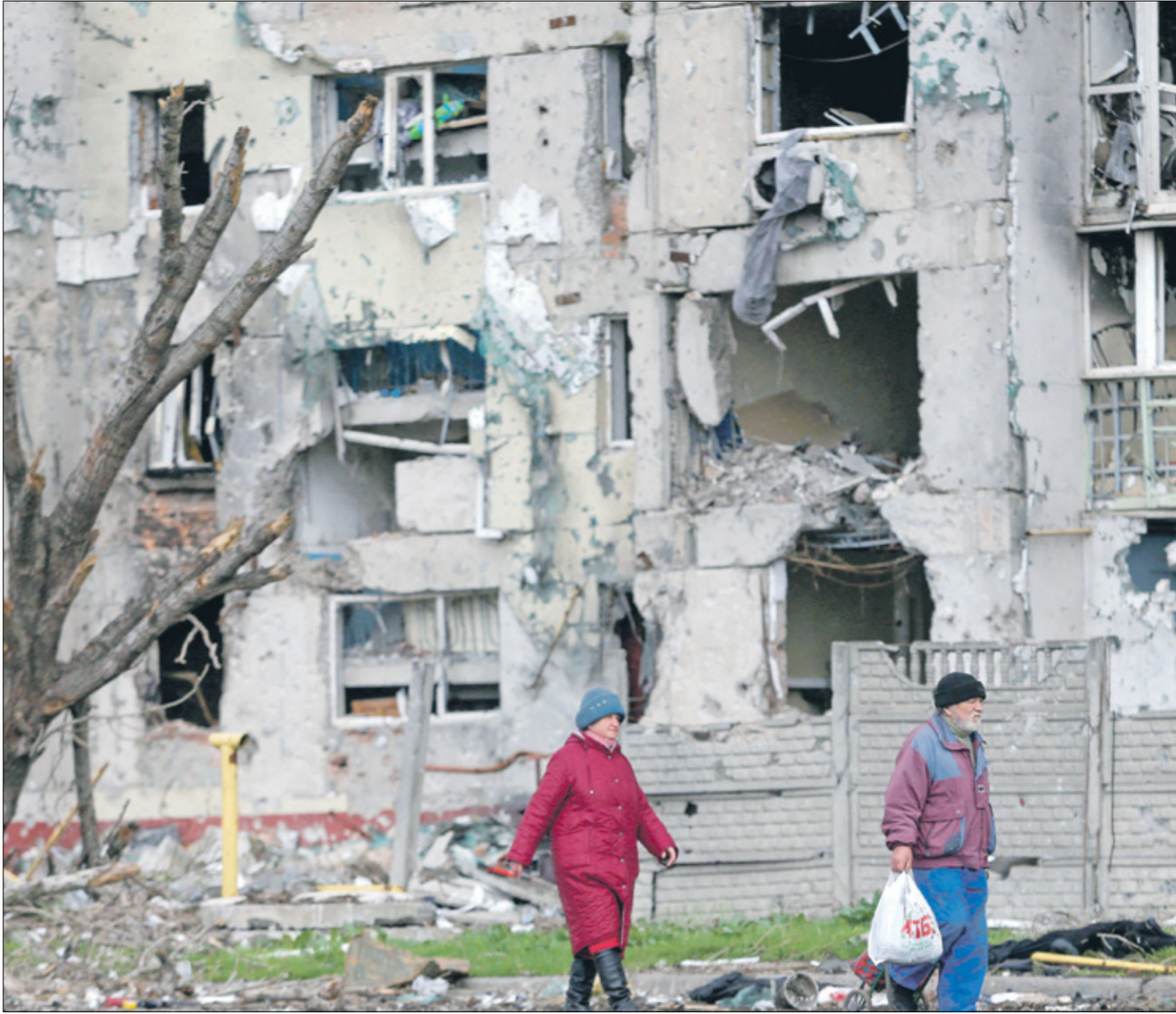
مدنيات يلجأن من ماربولوال ساحلية يوم السبت الماضي

في هذه الأثناء، ساد التوتر أمس في إقليم ترانسنيستريا المولدوفي الانفصالي، مع إعلان وزارة داخلية الانفصاليين المتطرفين الأوكرانيين، محاربو بودولياك، أنه لم يتم التوصل إلى اتفاق على اجتماع بين الرئيس الأوكراني فلاديمير زيلينسكي وبوتين مناقشة الحرب في أوكرانيا، على الرغم من التحذير الذي نذلهها تركيا لترتيب مثل هذه المحادثات ومن المتوقع أن يستقبل زيلينسكي، اليوم الخميس، الأمين العام للأمم المتحدة، أنطونيو غوتيريس، بعد زيارة الأخير موسكو، أول من أمس الثلاثاء 28 نأحياً، وأعلنت موسكو حظر دخول 287 ناشئاً بريطانيا إلى روسيا رداً على عقوبات بريطانيا استهدفت 386 بريطانيا روسيا. وطردت موسكو أيضاً 5 دبلوماسيين جدد، وشددت على أن «جيتها، أكدت هيئة الأركان الأوكرانية، أن القوات الروسية في