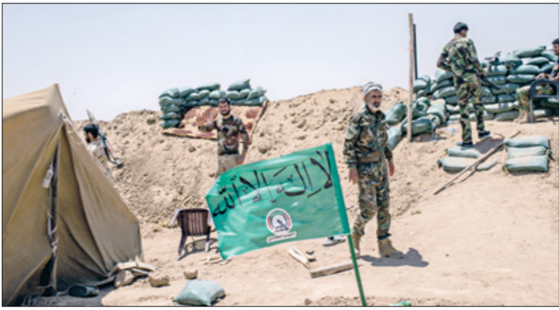
اللوات المصلاة إلى مناطة مجاورة لعراق

في المقابل، أكد ضابط في قوات حرس الحدود العراقي المنطقة الثانية، لهالعربي الجديد»، توسيع فصائل مسلحة، أغلبها عراقي، رفعة انتشارها على الجهة المقابلة ضمن مناطق الهري والزاوية والعبيد السورية ملاصقة للأراضي العراقية. وأشار الضابط إلى أن «من غير المعروف أين كانت