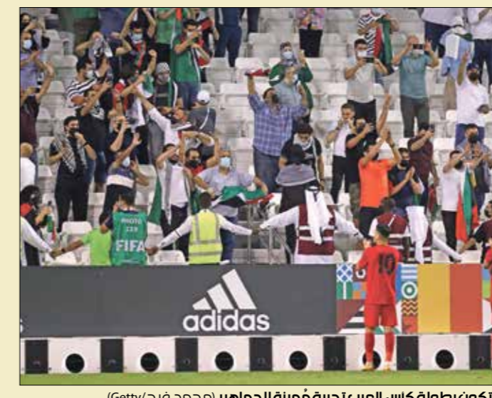
سكوت بطولة كأس العرب لخدمة خُميرة الجماهير