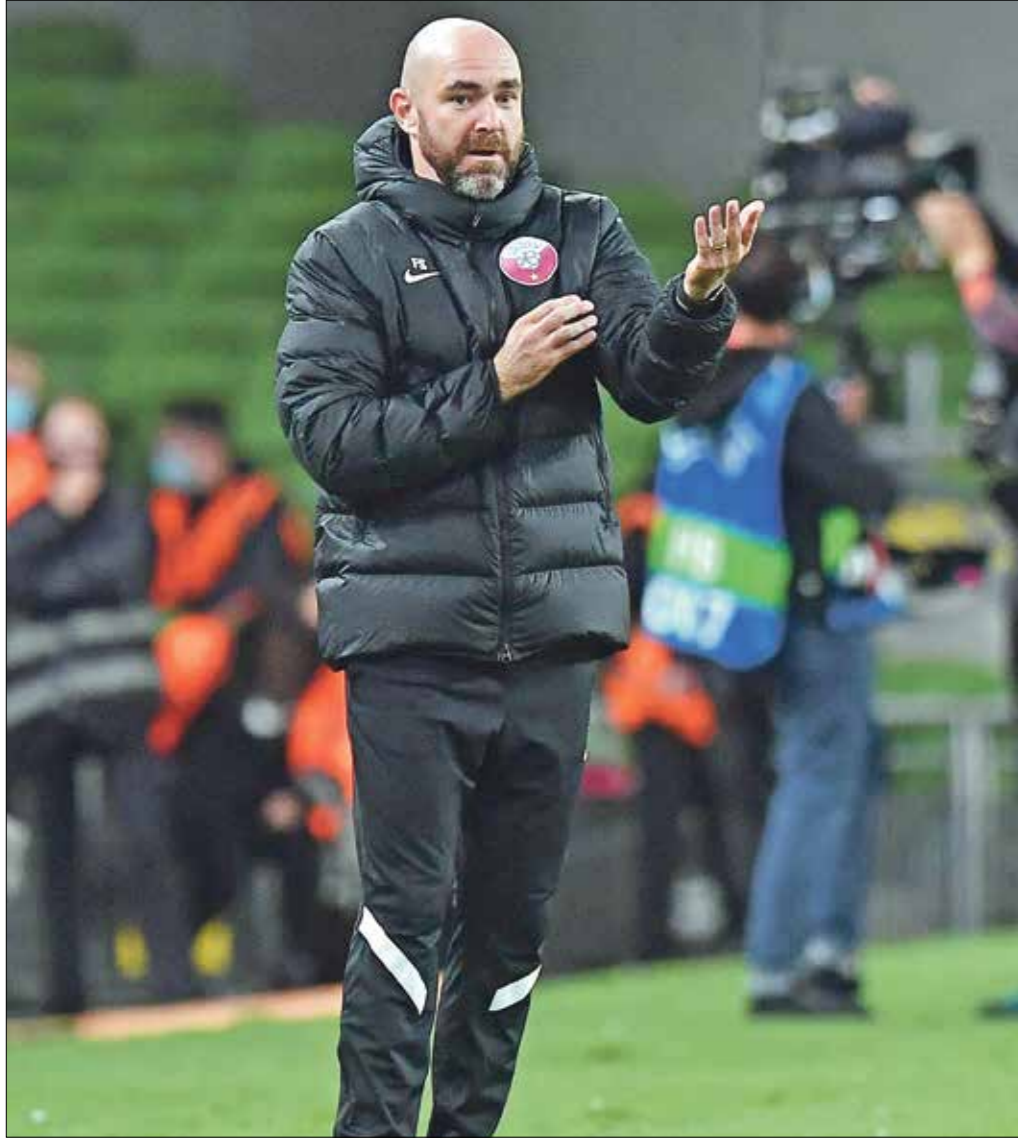
مدرب منتخب قطر جاهر لخوض منافسات البطولة (شارل ماكجواين/Getty)

تحدث المدرب الإسباني، فيليبكس سانشيز، عن تحضيرات المنتخب القطري لخوض منافسات بطولة كأس العرب، وقال سانشيز في حديث نشرته وكالة الأنباء القطرية: «كما هي العادة دائماً، نريد أن نقدم دوراً جيداً لكي يتعرف الجميع على المنتخب ويفخروا به، ونسعى للمنافسة على اللقب ولكن يجب أن نكون مستعدين لكي نحقق ذلك، كما أن المنافسة ستكون صعبة لحرص جميع المنتخبات المشاركة على التتويج