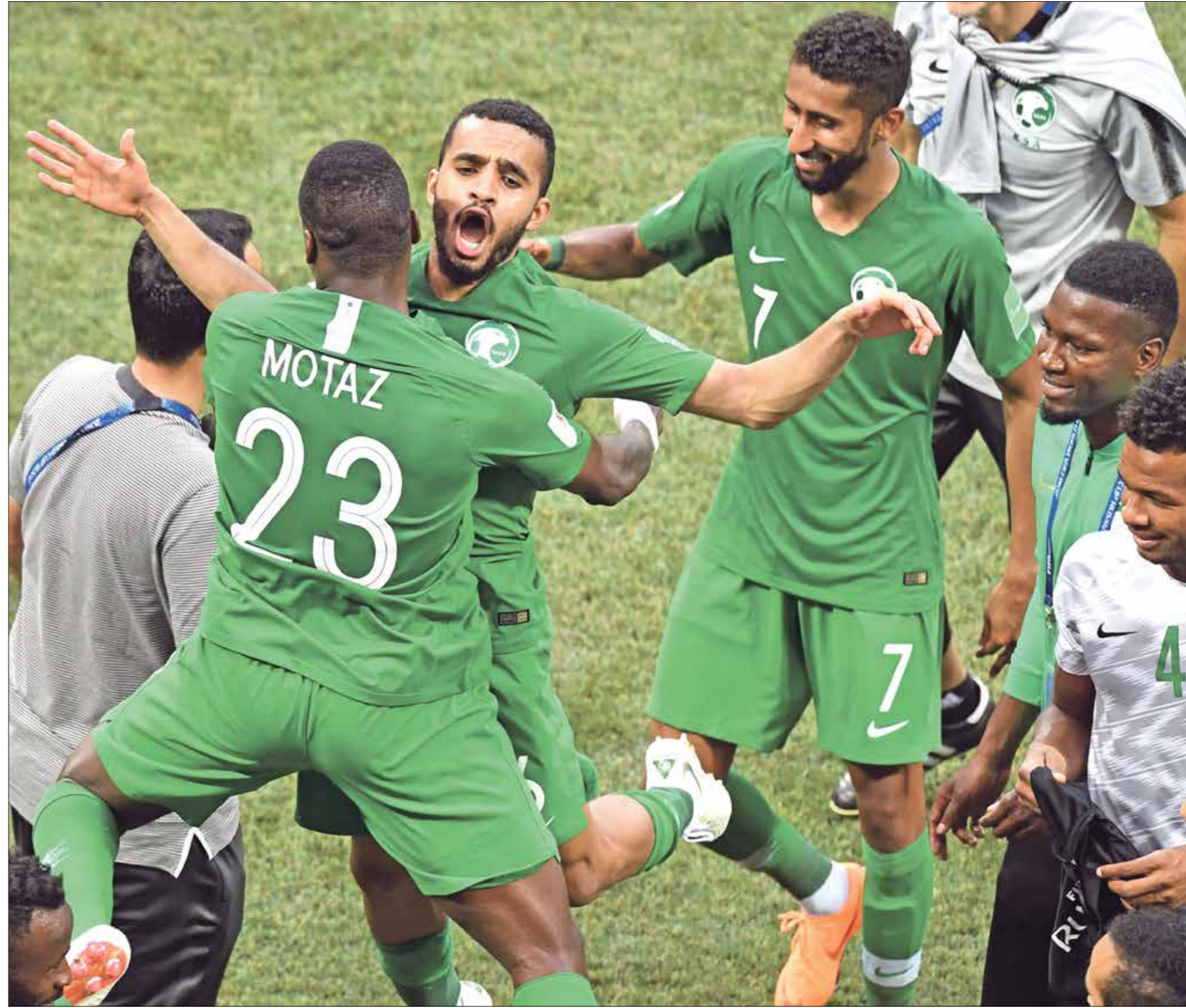
المنتخب السعودي يسعى للتتويج بلبف لانت

العباء المتألقين في التصفيات الآسيوية للمونديال في المنافسة، وحصد اللقب خاصة في ظل الظفرة الحالية التي يعيشها الأخضر، منذ قدوم هيرفي رينار المدير الفني لتحمل المسؤولية. وكان ياسر مسحل رئيس الاتحاد السعودي، أعلن في تصريحات صحافية له، أن السنديان الأقرب للأخضر، هو خوض البطولة عبر منتخب وطني، يضم مزيجا بين لاعبي المنتخبين الأول والأولمبي، ومنح راحة سلبية لمجموعة اللاعبين الذين خاضوا مباريات بالجملة في الفترة الدولية الأخيرة، بداعي إراحتهم، بناء على طلب من هيرفي رينار خشية من تعرض لاعبين لإصابات قبل استكمال منافسات التصفيات الآسيوية المؤهلة إلى بطولة كأس العالم. ووعد مسحل، الجماهير السعودية، بتقديم بطولة قوية في كأس العرب، حال حسم ملف تشكيل المنتخب في ظل الثقة بقرارات وإمكانات اللاعبين، سواء نجوم المنتخب الأول، أو الوافدين من سيجري اختيارهم من المنتخب الأولمبي ويسعى المنتخب السعودي لتجنب شبح الخروج من الدور الأول، ويراهن على تحقيق الفوز على حساب فلسطين والأردن على الأقل، بخلاف التعادل مع المغرب، وتجهه الترشحات صوب نهاب صادرة لمجموعة في الدور الأول إلى أي من المنتخبين السعودي أو المغربي.