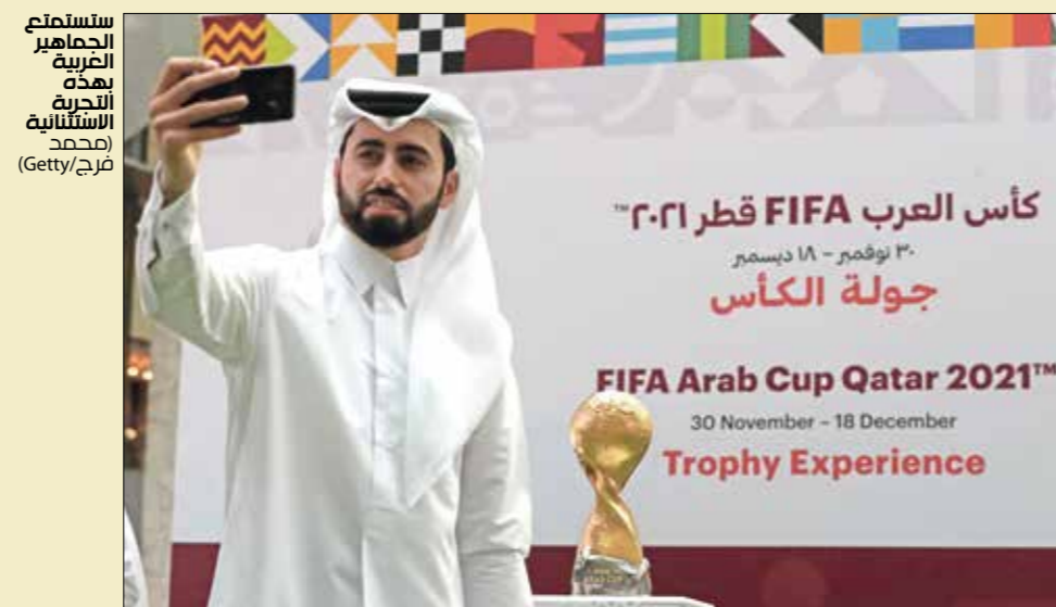
ستستلم اللجنة العربية لكرة القدم التجربة السنائية

كأس العرب FIFA قطر ٢٠٢١ ٣٠ نوفمبر - ١٨ ديسمبر جولة الكأس FIFA Arab Cup Qatar 2021™ 30 November - 18 December Trophy Experience