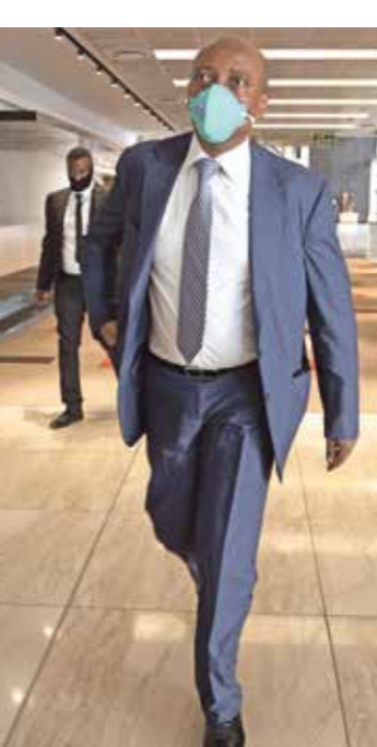
موتسيبي رئيس الاتحاد الأفريقي لكرة القدم (يمين) تافاكوتو

وحضر وفد من اللجنة المنظمة للبطولة برفقة قيادات الاتحاد الكاميروني لكرة القدم في العاصمة القاهرة لمتابعة الجمعية العمومية وعرض الموقف الأخير على باتريس موتسيبي، مؤكداً قدرة الكاميرون