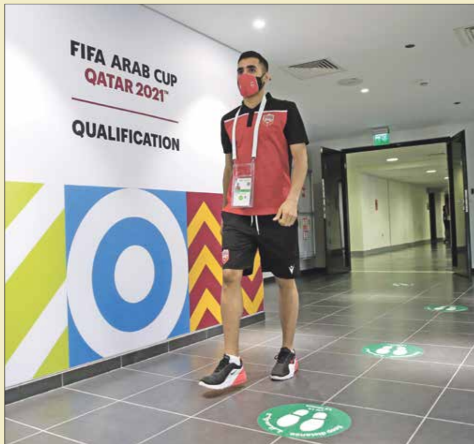
تجهيز خُميرة للملاعب من الداخل