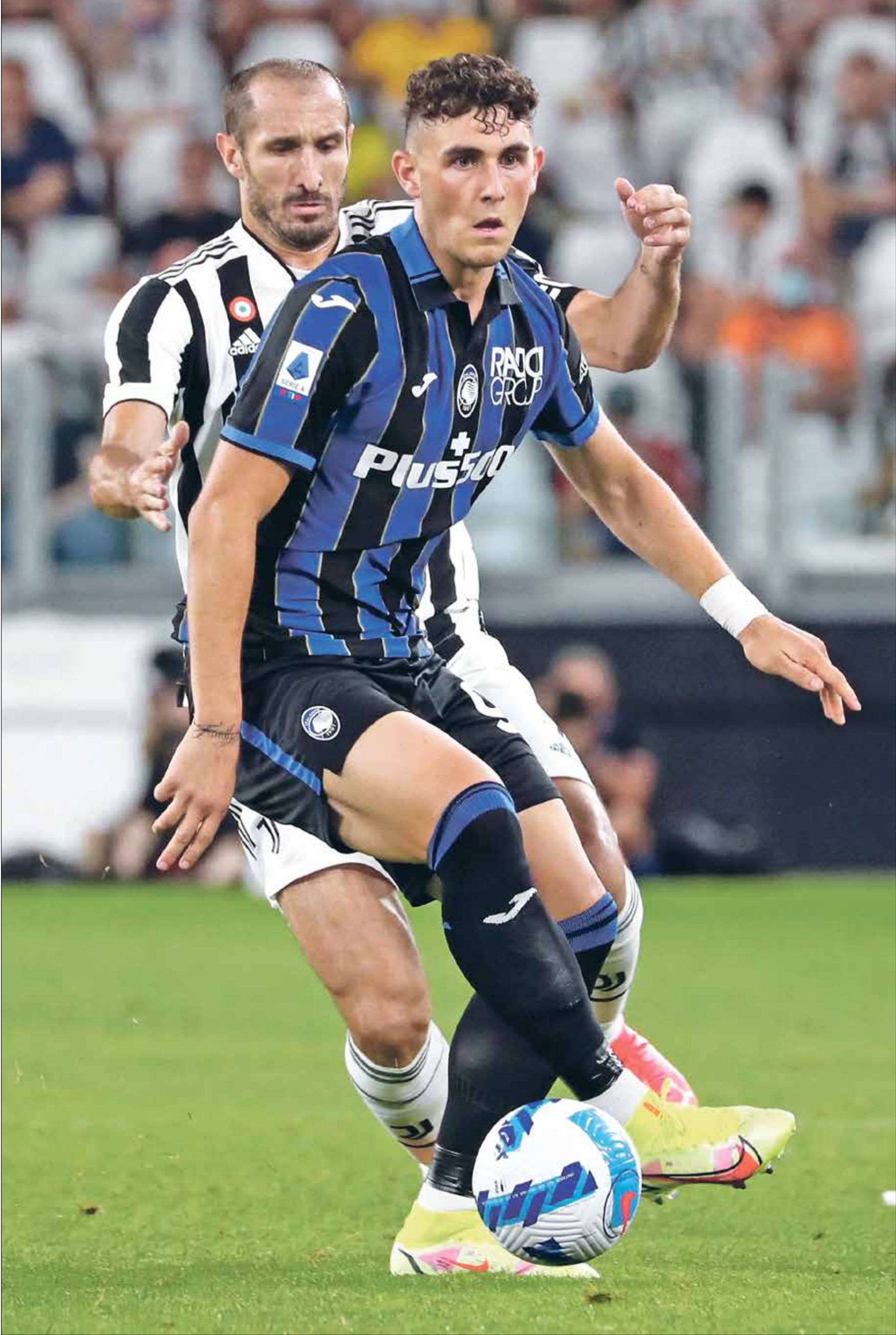
يوفنتوس والاتلانتا في قمة كبيرة بالكالتشو

تتجه الأنظار إلى الدوريات الأوروبية اليوم السبت، حين يخوض برشلونة مواجهة صعبة ضد فياريال على أرض الأخير، بقيادة المدرب تشافي هيرنانديز وهدفه تحقيق الفوز الثاني توالياً في الليغا، فيما يسعى يوفنتوس للتعافي من سقطته الأوروبية حين يلتقي اتلانتا في الدوري الإيطالي بقمة منتظرة بينهما، وفي ألمانيا يلتقي بايرن ميونخ نظيره أرمينيا بيليفيلد وهدفه تجاوز خسارته الماضية في البوندسليغا.