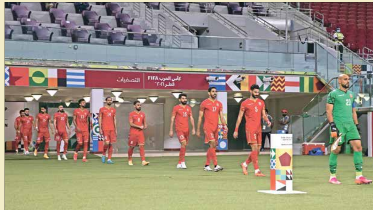
سكوت الملاعب لخدمة خُميرة اللاعبين