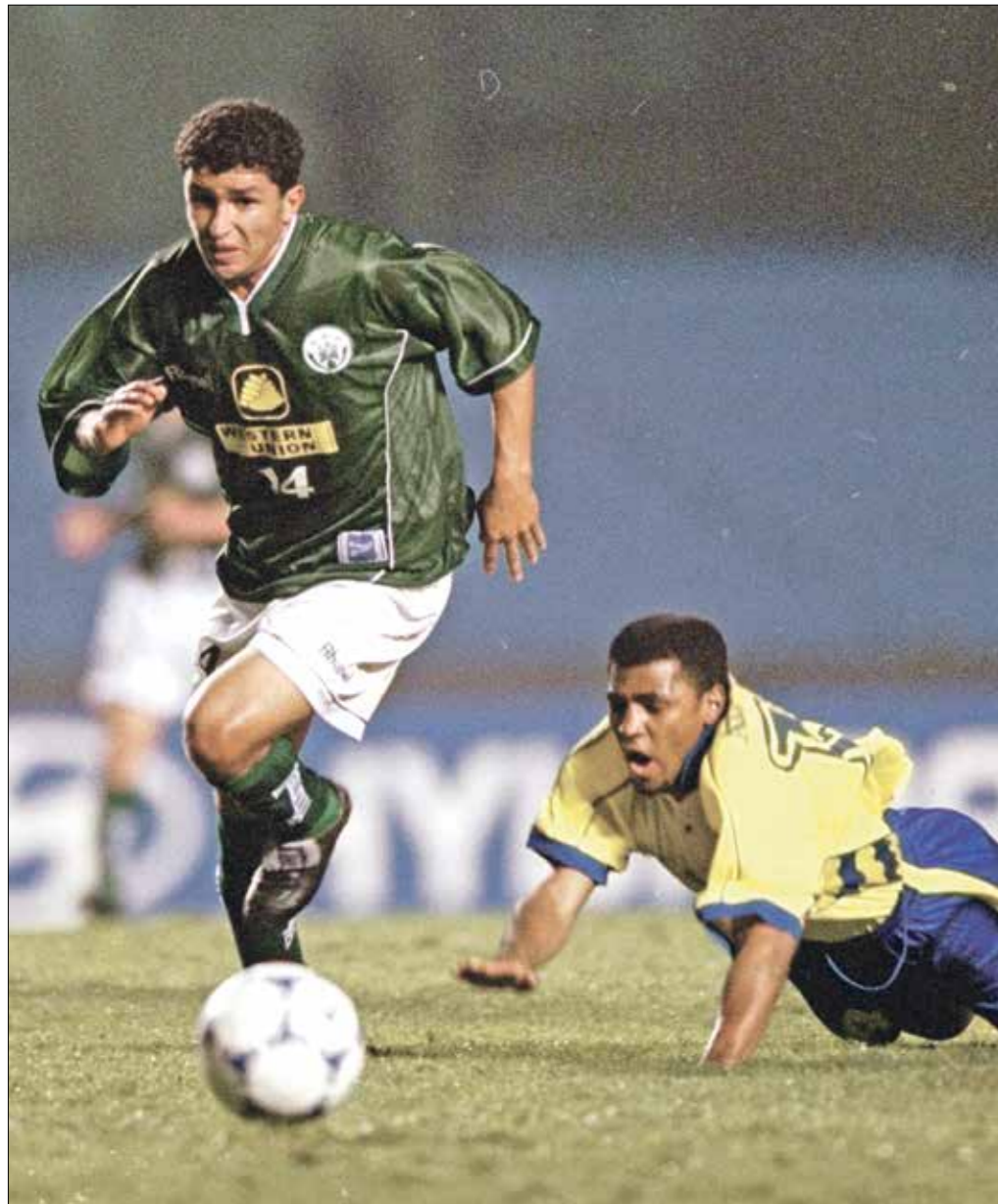
المهاجم المغربي بوشعيب المباركي