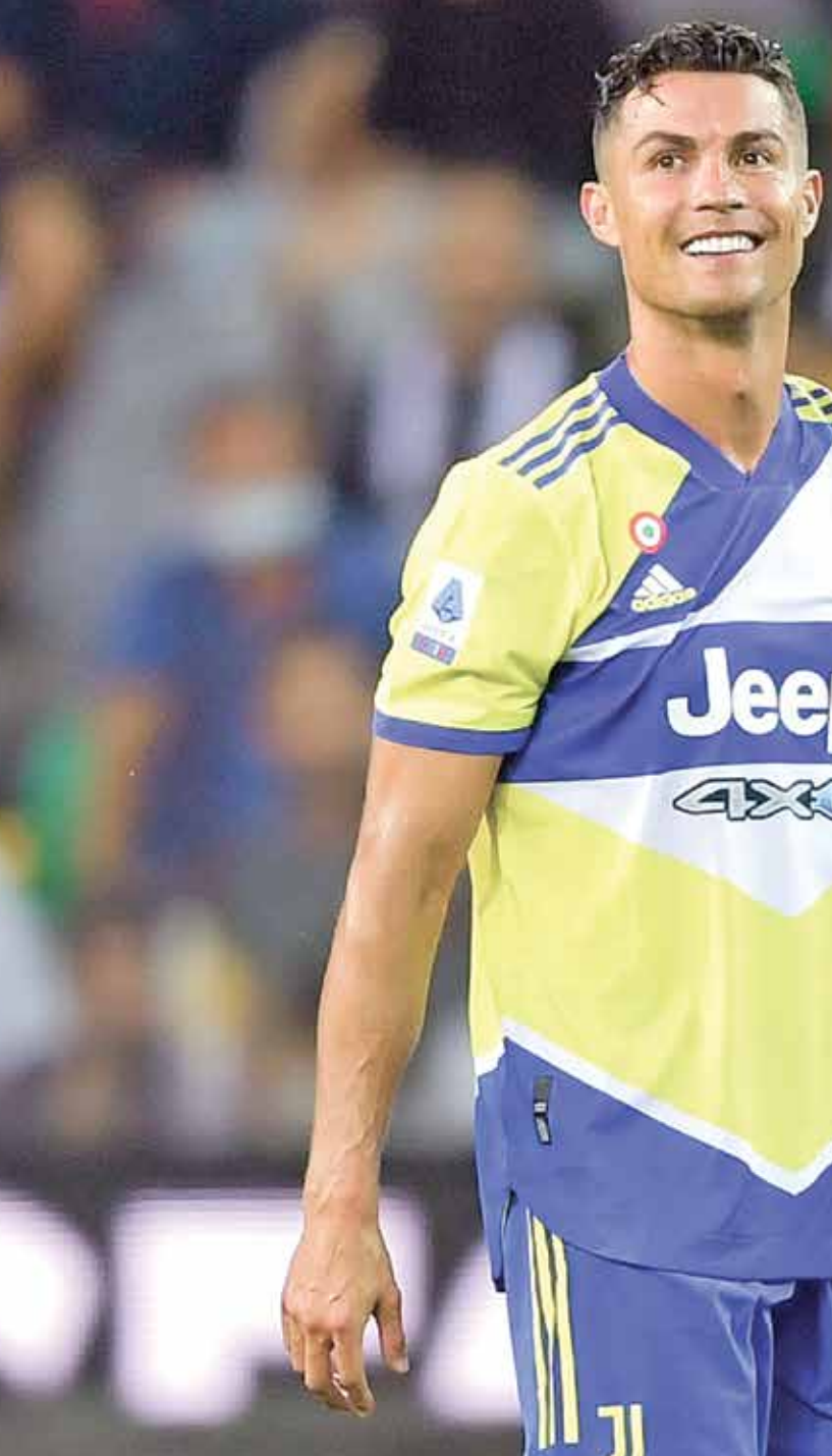
هاريزن رونالدو مرفأ بيفالوس

وتقديره للجمهور الذي لطالما صفق له، وبعيدا عن فرضية عودة رونالدو إلى ريال مدريد، من الممكن أن يقبل مانشستر سيتي وريال مدريد في إتمام الصفقة، وبالتالي لن يكون أمام «الدون» سوى ريال مدريد في حال فُتلت الصفقة مع فريق مانشستر سيتي، خصوصا أن رونالدو ومن ثم التفكير في الرحيل خلال سوق الانتقالات الصيفية القادمة 2022. ومن المتوقع أن تُكتشف الأيام القليلة القادمة مهاجماً لفريق يوفنتوس حتى عام 2022؟