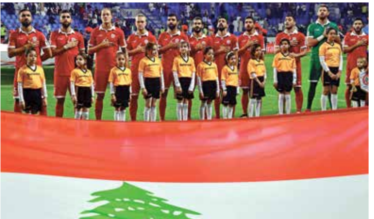
منتخب لبنان يستعد لظهور مشرف بالتصفيات

إلى تنقية نفوس لاعبيه من الآثار السلبية التي لحقت بهم جراء الأزمات المتعددة منذ نهاية 2019 مروراً بتداعيات جائحة كورونا وانفجار مرفا بيروت قبل نحو عام. وبدأ منتخب «رجال الأز» معسكراً أساسياً في الإمارات استعداداً للمواجهتين، بقيادة المدرب التشيكي إيفان هاشيك والذي تم