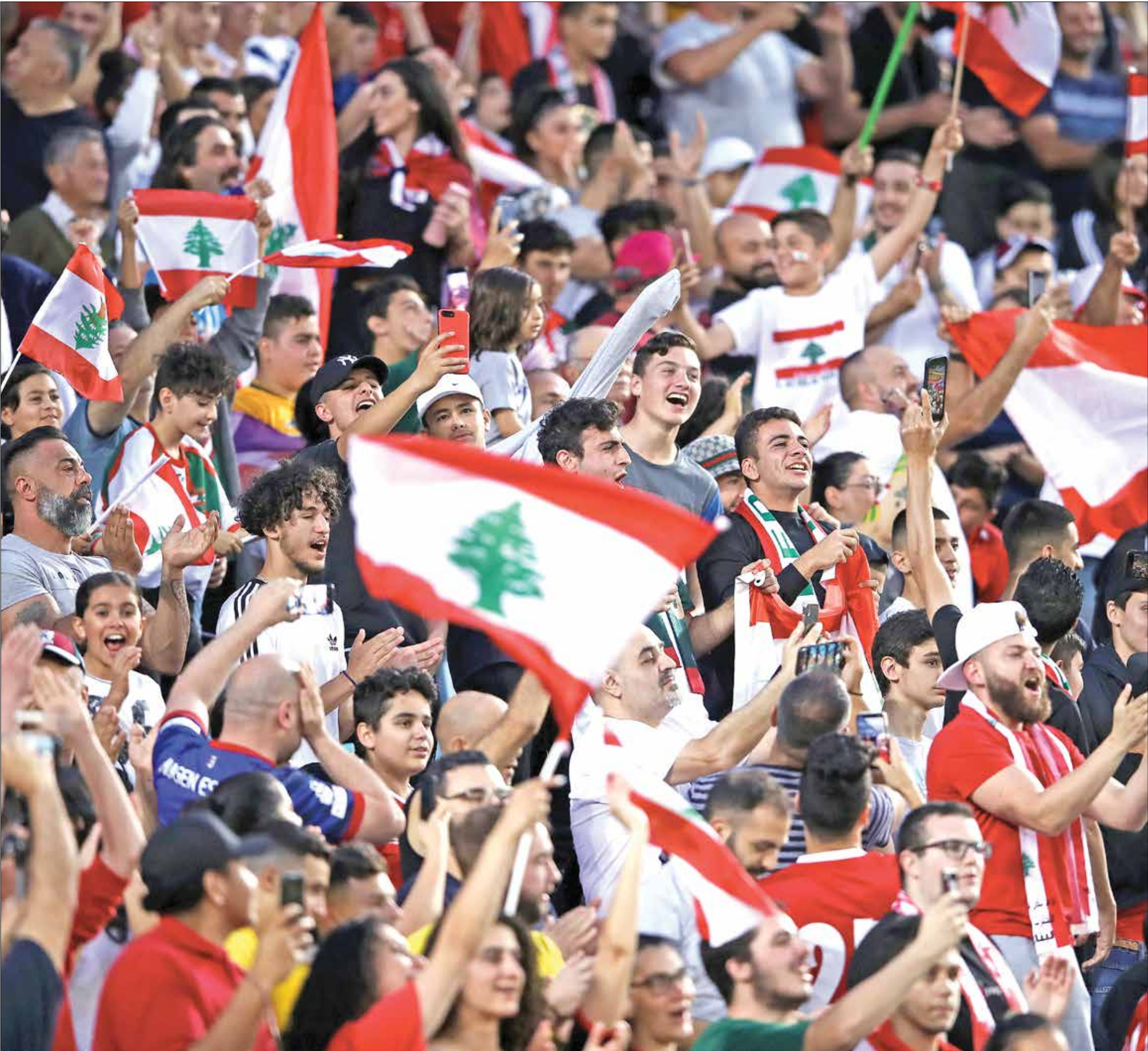
الجماهير اللبنانية لحلم برؤية متخليها بالف

والمدافع صبرا». وتابع: «مجموعة اللاعبين المتواجدين في المعسكر الإماراتي تعد جيدة ونستغل المعسكر الحالي لإعادة الجيد ولا سيما للمباراة الأولى ضد الإمارات». واعتبر هاشيك في حديث ثقفته وكالة «فرانس برس» كذلك، أن الطريق طويلة في التصفيات، وبالتالي ينبغي التحضير لكل مباراة على حدة «في المرحلة النهائية من التصفيات، كل الفرق المنافسة تعتبر قوية وتضم لاعبين مميزين». وأكد هاشيك أنه يمكن كل الإحترام لكل المنتخبات ولديه فكرة عن غالبيتها لا سيما الإمارات إذ درب سابقاً