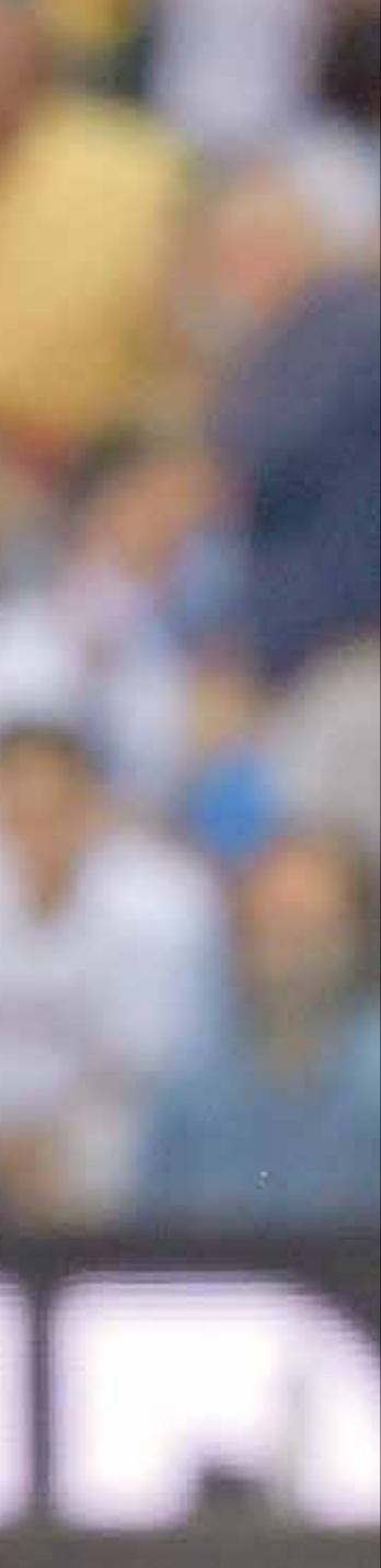
هاريزن رونالدو مرفأ بيفالوس

مباراة لفريقه يوفنتوس في الدوري كلاعب أساسي والذي أثار الكثير من الشكوك، رغم بعد مغادرة راموس، والظهور الباهت للفريق في أولى جولات «الليغا». فهل يكون خيار فريق ريال مدريد الأقرب لرونالدو في حال فُتلت الصفقة مع فريق مانشستر سيتي، خصوصا أن رونالدو بعد خيار مانشستر سيتي، خصوصا أن رونالدو عبر في أكثر من مرة عن أنه لن ينسى تجربته مع النادي الملكي» أبداً وسيبقى الفريق في قلبه إلى الأبد، بالإضافة لجهه