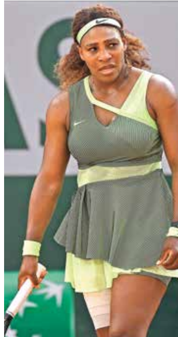
حست النجمة سيرينا ويليامز فرصة للترويج لقب «غراند سلام» جديد

وكانت شقيقتها، فينوس ويليامز، أعلنت في وقت سابق انسحابها أيضاً من البطولة الأميركية، ما يعني غياب أبرز شقيقتين