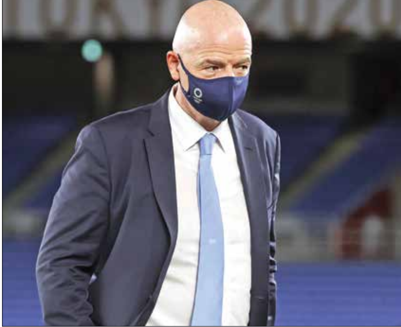
إنفانتينو عارض قرار الدوريات الكبرى

القائمة الحمراء للدول الأكثر انتشاراً للفيروس مع «عمل الزمامي لمدة 10 أيام للمسافرين العائدين من هذه الدول». وأثار منع اللاعبين المحترفين بالدوري الإنكليزي المعتاز، من تمثيل منتخبات بلدانهم، أزمة كبيرة قبل مباريات تصفيات كأس العالم، 2022. وقاسم نجم مانشستر يونايتد، إيدنسون كافاني، مشاعر الحزن والغضب التي يعيها بعدما رفض النادي السماح له بالتوجه نحو بلد أوروغواي، للمشاركة في المباريات الدولية، وذلك عبر حساباته بمواقع التواصل الاجتماعي. ونشر كافاني صورة للقرار ووضع عليه علامات استفهام، حيث عثر عن عدم استعابه لما يحدث، إلى جانب مجموعة من اللاعبين الذين يبلغ عددهم 60 لاعباً تقريباً، من منتخبات أميركية وأفريقية وآسيوية. ومثل كافاني منتخب الأوروغواي آخر مرة خلال الهزيمة بركلات الترجيح أمام كولومبيا، عند مشاركته بمنافسة «كوبا أميركا» قبل شهرين تقريباً، لكنه سيخض ثلاث مباريات مهمة من تصفيات مونديال قطر، ضد منتخبات بيرو وبوليفيا والإكوادور، وانفقت الأندية على ضرورة احترام قرار الحكومة البريطانية، على الرغم من أنه جاء ضد رغبتهم، باعتبار أن صحة المواطنين أهم من مباريات كرة القدم. غير أن الأثر السلبي كان على اللاعبين الذين سيجرمون من الدفاع عن الوان بلدانهم.