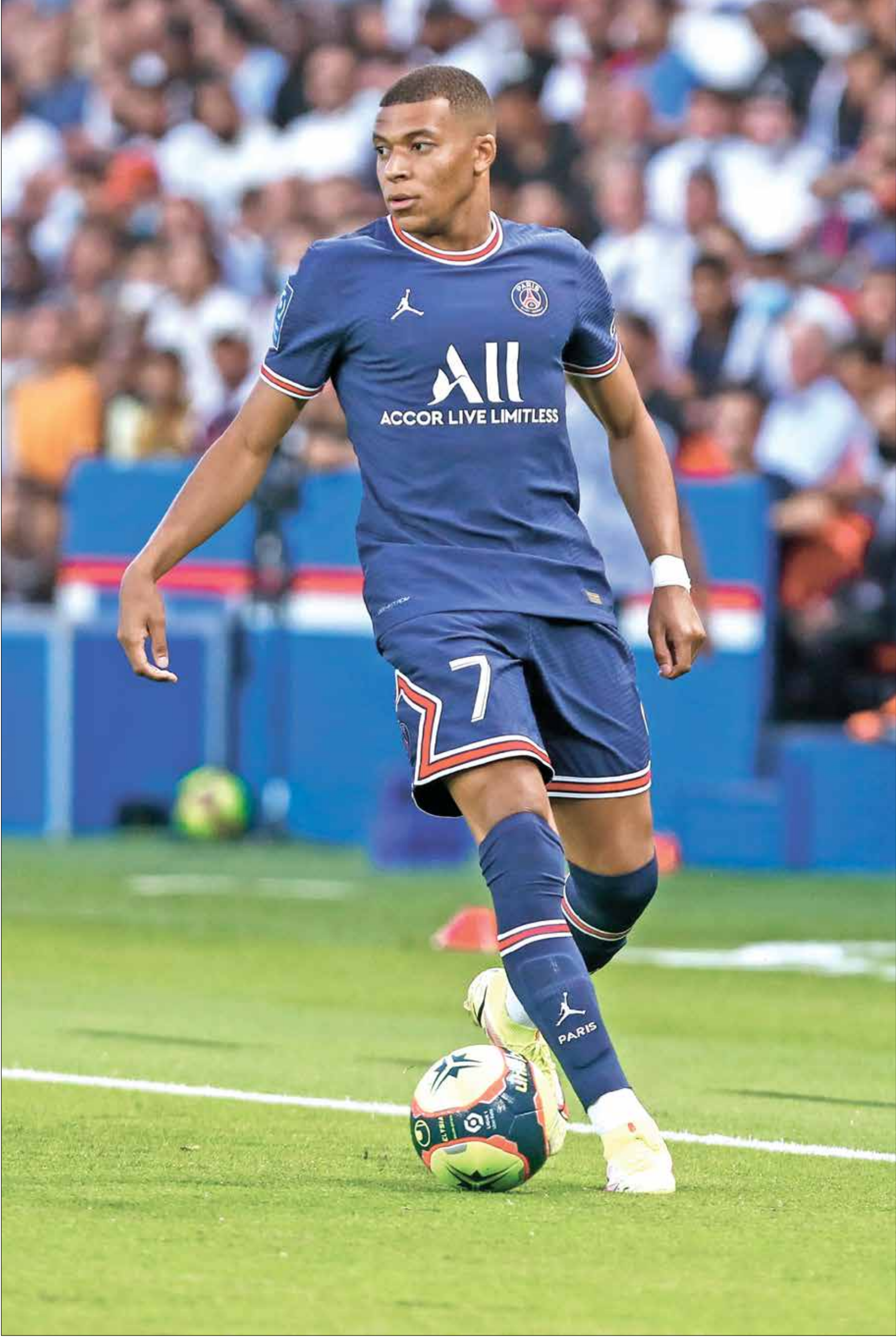
هل يُوضع مبابي مع ريال مدريد خلال الأيام القادمة؟

كشفت بعض المواقع والصحف الرياضية العالمية وخصوصاً الإسبانية منها، أن فريق ريال مدريد سيعلن عن صفقة المهاجم الفرنسي كيليان مبابي بشكل رسمي خلال 48 ساعة، وأن الاتفاق بين إدارتي الفريقين تم على قيمة الصفقة، خصوصاً في ظل رفض الفريق الفرنسي المغادرة وتجديد العقد، فهل يُصبح مبابي لاعباً «ملكياً»؟