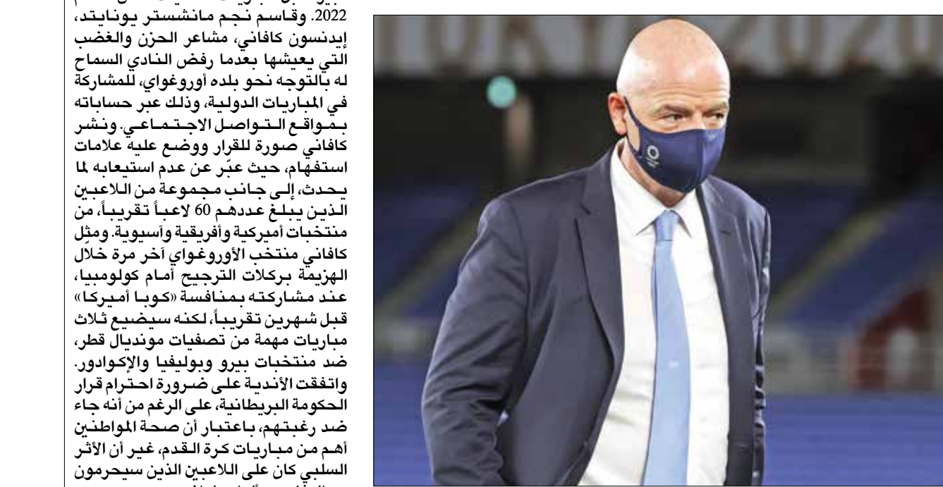
إنفانتينو عارض قرار الدوريات الكبرى

جونسون وناشدة تقديم الدعم اللازم، على وجه الخصوص، حتى لا يُرحم اللاعبون من فرصة تمثيل بلادهم في المباريات التأهيلية لكأس العالم». وتابع: «لقد اقترحت وتم إدراج مصر والبرازيل على لائحة