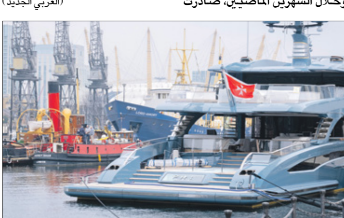
يخوت (إسبانيا) روسيا تحت مراقبة أوروبا

أعلنت السلطات الإسبانية، أمس الثلاثاء، تجعيد 12 حساباً مصرفياً وأصول ومصادرة 3 يخوت من 23 من الأصول تعود لمكثيها لأثرياء روس، وذلك منذ اندلاع الحرب في أوكرانيا على 24 فبراير الماضي. وقال رئيس الوزراء الإسباني أوسكار لوپيز، إن سلطات البلاد جمعت منذ اندلاع الحرب في أوكرانيا 12 حساباً مصرفية وأصولاً وصاربت 3 يخوت من 23 من الممتلكات التي تعود لأثرياء روس، وأضاف لوپيز في كلمة القاها بالبرلمان الإسباني، أن الأصول تمت مصادرتها تماثلياً مع العقوبات المفروضة من قبل الاتحاد الأوروبي على أوليغارشيين (الأثرياء) الروس، وخلال الشهرين الماضيين، صادرت