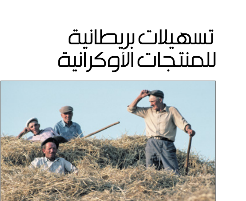
مزرعة قمح في أوكرانيا قبل الفزو

هناك اتهامات له بالتمتر، وهذه اتهامات تتعارض مع أهداف شفافية وحرية تويتر التي أعلن عنها بعد تنفيذ الصفقة. جانبها تقول صحيفة «وول ستريت جورنال»، إن الملياردير ماسك يسعى لتحويل تويتر إلى شركة خاصة، ولكنه