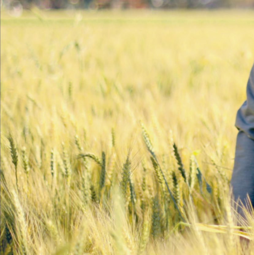
مصر استهلك نحو 20 مليون طن منها (التجار)