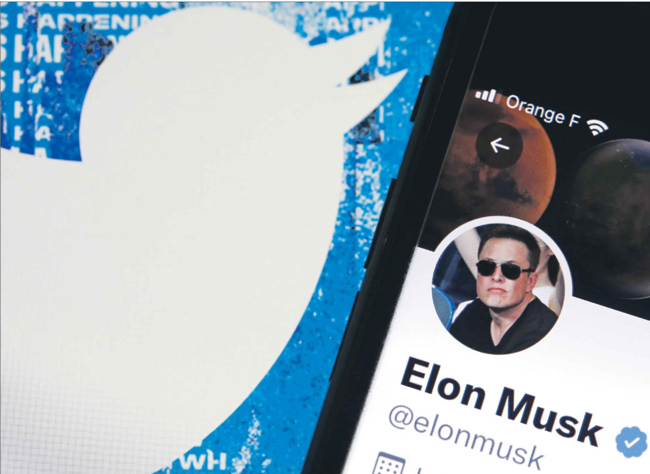
الملياردير إيلون ماسك يحرص على صفقة تويتر

هناك اتهامات له بالتمتر، وهذه اتهامات تتعارض مع أهداف شفافية وحرية تويتر التي أعلن عنها بعد تنفيذ الصفقة. جانبها تقول صحيفة «وول ستريت جورنال»، إن الملياردير ماسك يسعى لتحويل تويتر إلى شركة خاصة، ولكنه