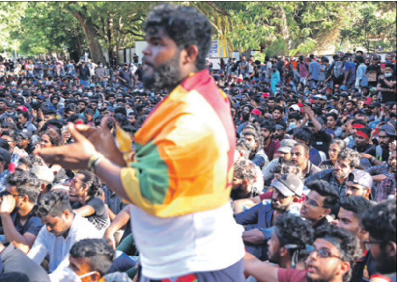
الاحتجاجات لتواكف في العاصمة كولومبو ضد الحكومة

وهو ما يلقى المستثمرين في البلاد، وعلقت الحكومة الدتاولات ببورصة كولومبو أمس الثلاثاء والليوم الثاني، بعد 5 دقائق فقط من التعامل بعد هبوط المؤشر بنحو 8,1%». وكانت الدتاولات بالبورصة استمرت الإثنين لمدة 32 دقيقة فقط قبل تخليق عمل البورصة بعد أن شهدت تراجع المؤشر بنسبة 7,6%». من جانبها خفضت وكالة «ستاندرد أند بورز» التصنيف الائتماني لسريلانكا إلى «المنحدر الانتقائي»، بعد فشلها في سداد مدفوعات سندات وتأتي خسائر الأسيهم في بورصة سريلانكا بعد الإراء المتضد الذي نشرته في العام الماضي، حيث كانت