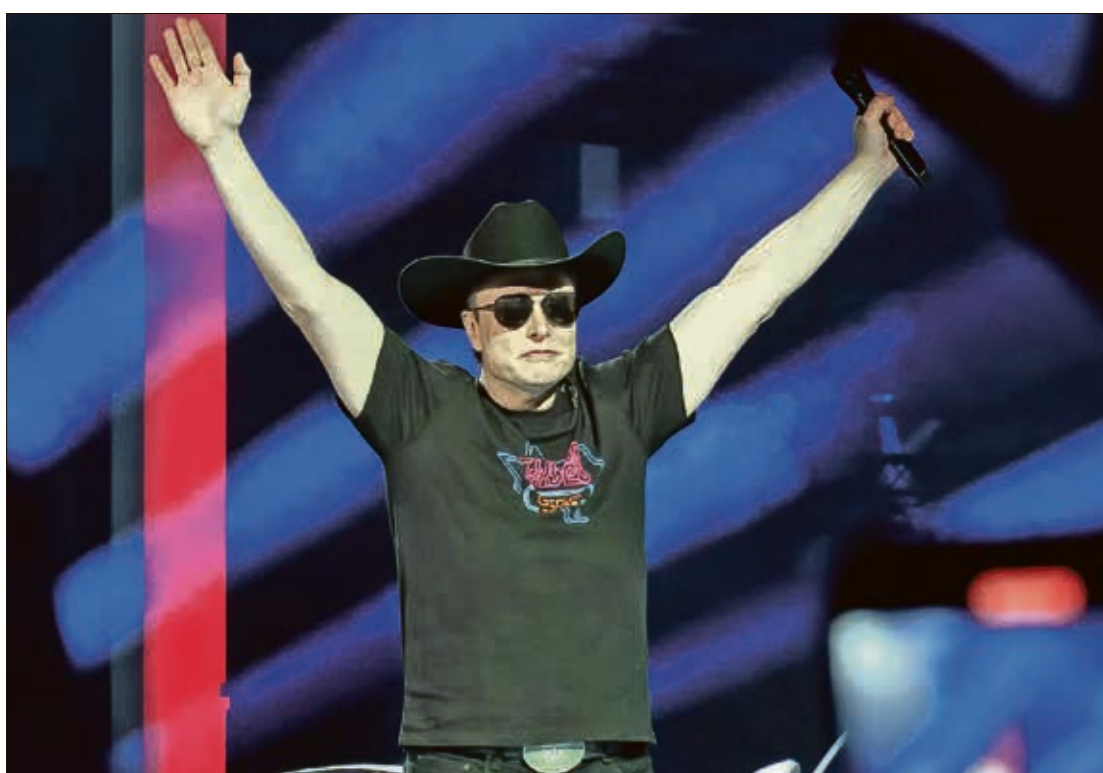
التقى ماسك بعدد من المساهمين في الشركة

قالت مصادر مطلعة، الأحد، إن شركة تويتر تتعرض لضغوط متزايدة من مساهميها للتفاوض مع إيلون ماسك بعد عرضه شراء منصة التغريد الشهيرة مقابل 43 مليار دولار. وبحسب المصادر التي لم تكشف عن هويتها، فإن المساهمين يملكون آراء متباينة إزاء الصفقة والمبلغ العادل لإتمامها، إلا أن كثيرين منهم تواصلوا مع إدارة تويتر بعدما أوضح ماسك خطته الخاصة بشراء المنصة، داعين إلى الاستفادة من هذه الفرصة. ومن المتوقع أن يجد مجلس إدارة «تويتر» أن عرض ماسك البالغ 54,20 دولاراً للسهم الواحد منخفض جداً، وذلك بعد الإعلان عن أرباحها الفصلية يوم الخميس المقبل. ومع ذلك، قالت المصادر لوكالة رويترز إن بعض المساهمين الذين يتفقون مع هذا الموقف، ما زالوا يريدون من تويتر السعي للحصول على عرض أفضل من ماسك، الذي تقدر مجلة فوربس ثروته الصافية بـ270 مليار دولار.