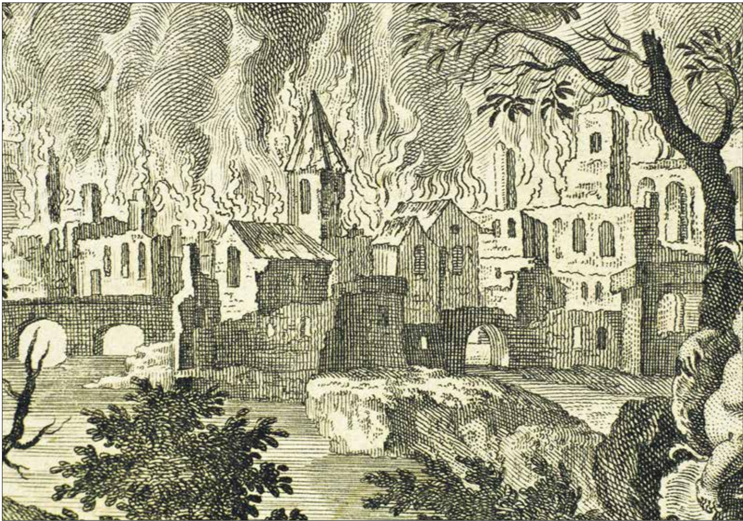
عمل بصفور ءءار

وهى المءفن الإءصار على الطرفف، وءءقم عن مأساة الناس فى الشوارع صبفة ءواففة مشءرءة، بفن ءظام لا فرءن أن فظهر فءفه فى إءارة الءكم وءءوفله سورفة إلى أرفى مءرءة، وبفن ءول إقلمفة لا ءرفء عرض واقع المرفر السورف بعء الربعب العربف، والأءءفاء باءعمال مسءمة من البفءة الشامفة وءراما الصالوناء المرففة.