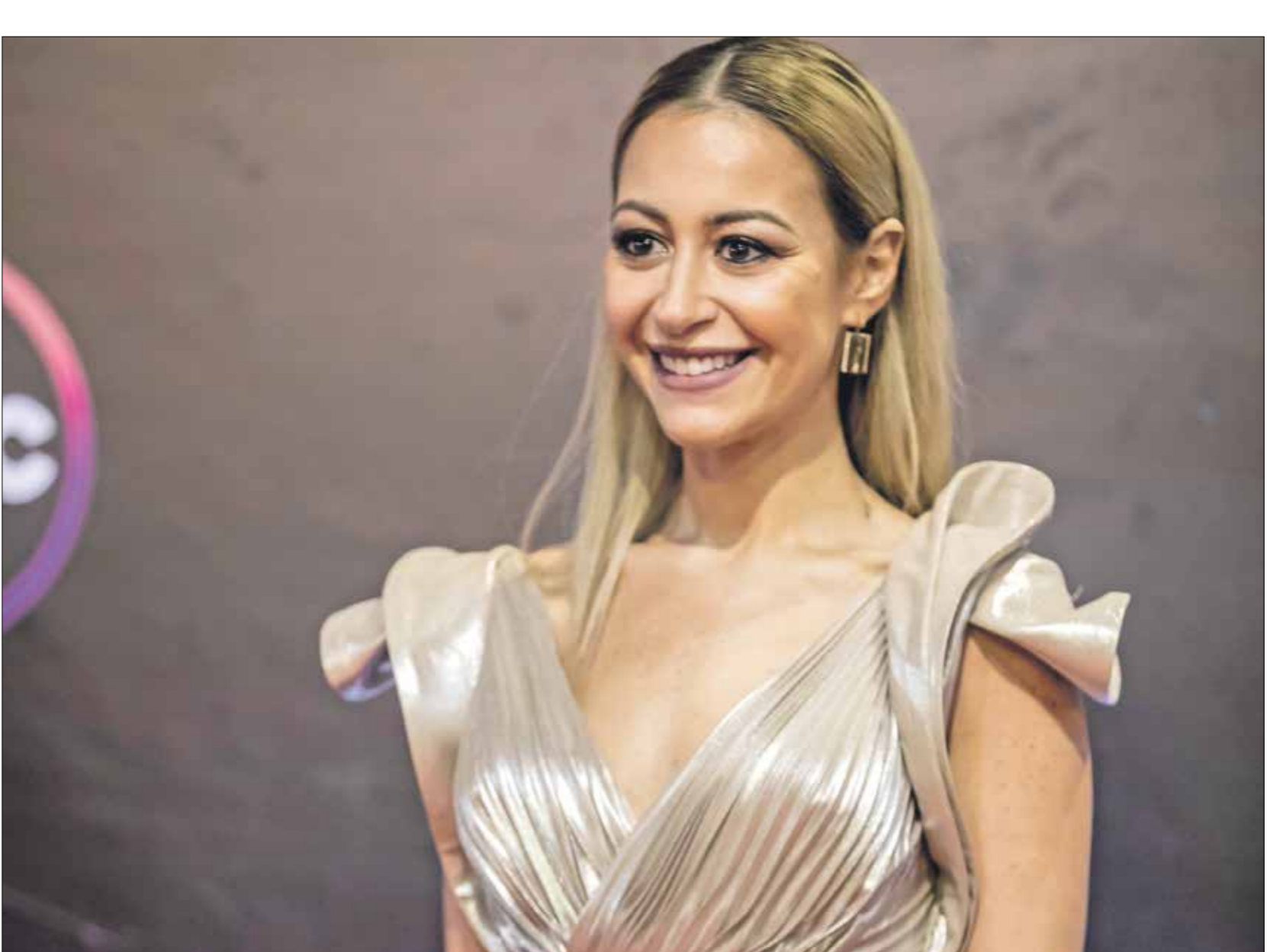
رشفء مئة شلفبى عن ءورها فى مسلسل «فى كل أسوء يوم جمعة»، (ءءاء ءسوفف/مرفاسل برسل)

وهنا عاملون فى الوسء الفف مئة شلفبى على هءا ءرفشفء، وبفبهم الممثلة هءء صبرف، والءرء عمرؤ سلامة، والمءئل صبرف فواز، والمءرء فسرئ نصر الله،