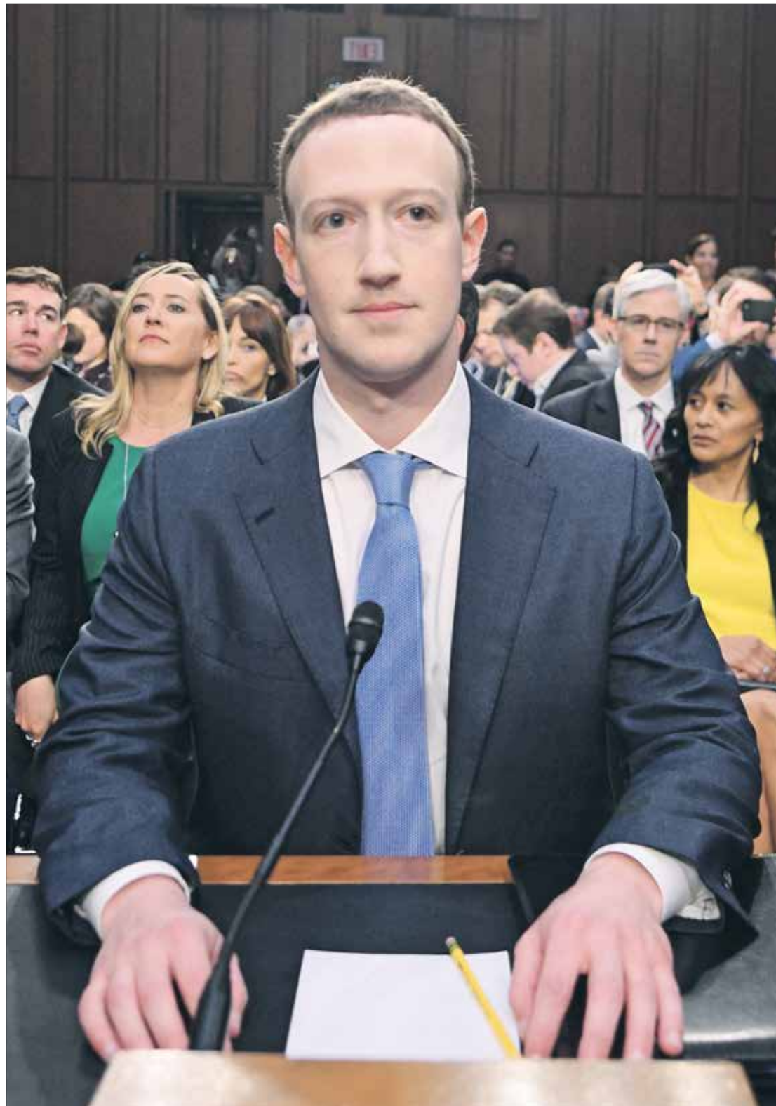
سعت «فيسبوك» إلى حماية صورة مارك زوكربيرغ من الفضائح

وفي إطار الجهود الجديدة، حذفت «فيسبوك» نحو 150 حساباً أو صفحة أو مجموعة يديرها أشخاص مرتبطون بحركة QAnon التي تعارض إجراءات مكافحة وباء «كوفيد-19»، مثل ارتداء الكمامات والإغلاق العام. حرض الأشخاص الذين يقفون وراء الحسابات، وبعضهم على «إنستغرام»، على العنف، على أنه وسيلة لقلب جهود الحكومة الألمانية ضد