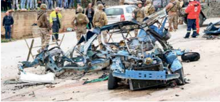
الازعمارة الإسرائيلية على الصوري، أمس

ان «فتح الحوزة في جنوب لبنان هو للدفاع عن لبنان، وإسناداً لإعلاننا عن غزة، الذين يتعرضون لحرب إبادة، ونذنبهم أنهم يطالبون بحربهم». وتابع خلتا حفل تأبيني في بلدة الخضر، «نخلتنا من واجبتنا لتعبر عن أداء كلكتنا في مساندتنا، و في الدفاع عن لبنان لأن هذا العدو لا يؤمن جانبنا، ولا يمكن أن يلتزم بميثاق من الموائيق أو أي اتفاق أو معاهدة» حاولت التصدي للصاروخين الإسرائيلي، بعد فتح «الرصق الإسرائيلي، بعد فتح السوري ليقوق الإنسان» عن نوي انفجارات في محيد دمشق، تزامناً مع الاستهداف.