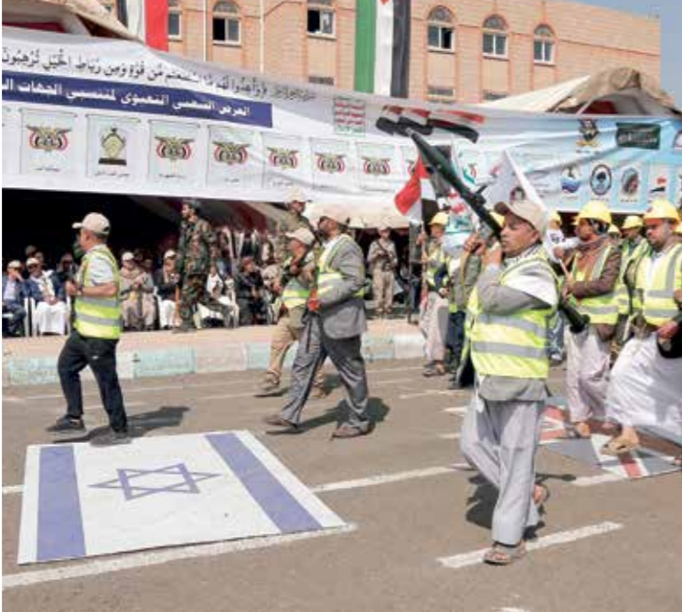
مة مسيرة حولية طمعا لطره قضاء، 9 مارس الحالي، (محمد حمود/جيتي)