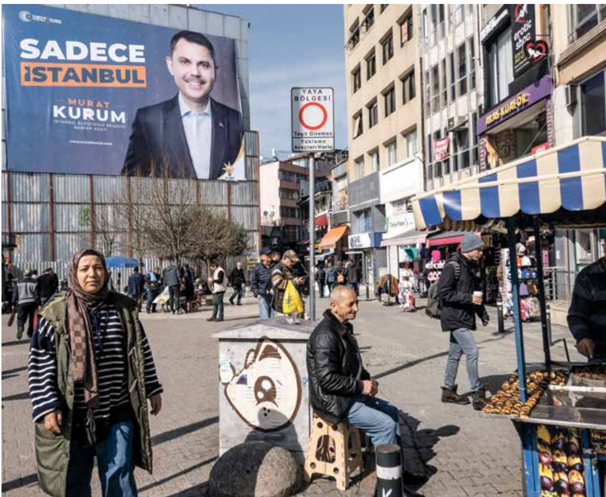
من الحملات الانتخابية في إسطنبول، فبراير الماضي

على جبهة المعارضة، يركز المرشحون على ما حققوه من إنجازات في 5 سنوات، في