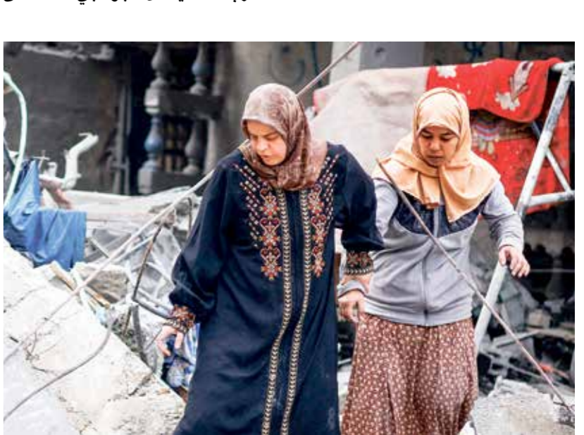
فلسطينيات المتحدان الرر عمارة إسرائيلية على ريف، أمس (محمد سالم روزيتر)

استعادت «يديعوت» ما يزرعه قادة منصور، وتين بان الشهيد استخدم بنديقة قنص أميركية متقدّمة وأن أحد التوجهات التي يتمّ عمليات ضد أهداف إسرائيلية في السنوات الأخيرة تشكل اساسي في قطع السلاح التي تتدفق إلى الضفة الغربية وإلى المجتمع العربي داخل الخط الأخضر