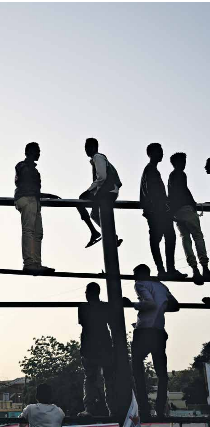
اسباب مختلفة قد تدفع الشباب إلى الإدمان