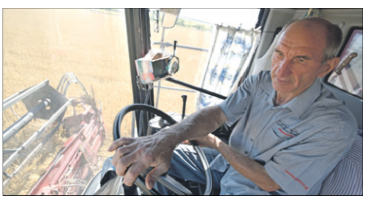
مالك صيد القمح مزرعة روسية

وحسب تقرير نشر في صحيفة «سكوفودايا برس» الروسية، أمس الإثنين، توصل روسيا تعزيز مواقعها في الأسواق الزراعية القائمة وتحتل أسواقا جديدة. وعلى وجه الخصوص، تستعد الجزائر، التي كانت تعتبر تقليديا سوقا للقمح الفرنسي، لشراء