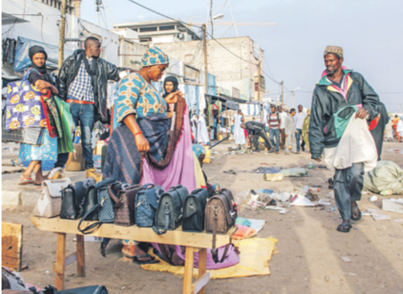
نوح نصف سكان البلاد نحت خط الفقر حسب تقارير دولية

القدر، باحتياطي ضخم من الذهب، إلا أنّ العائدات التي تحصل عليها من الشركة الأجنبية صاحبة الامتياز ضعيف