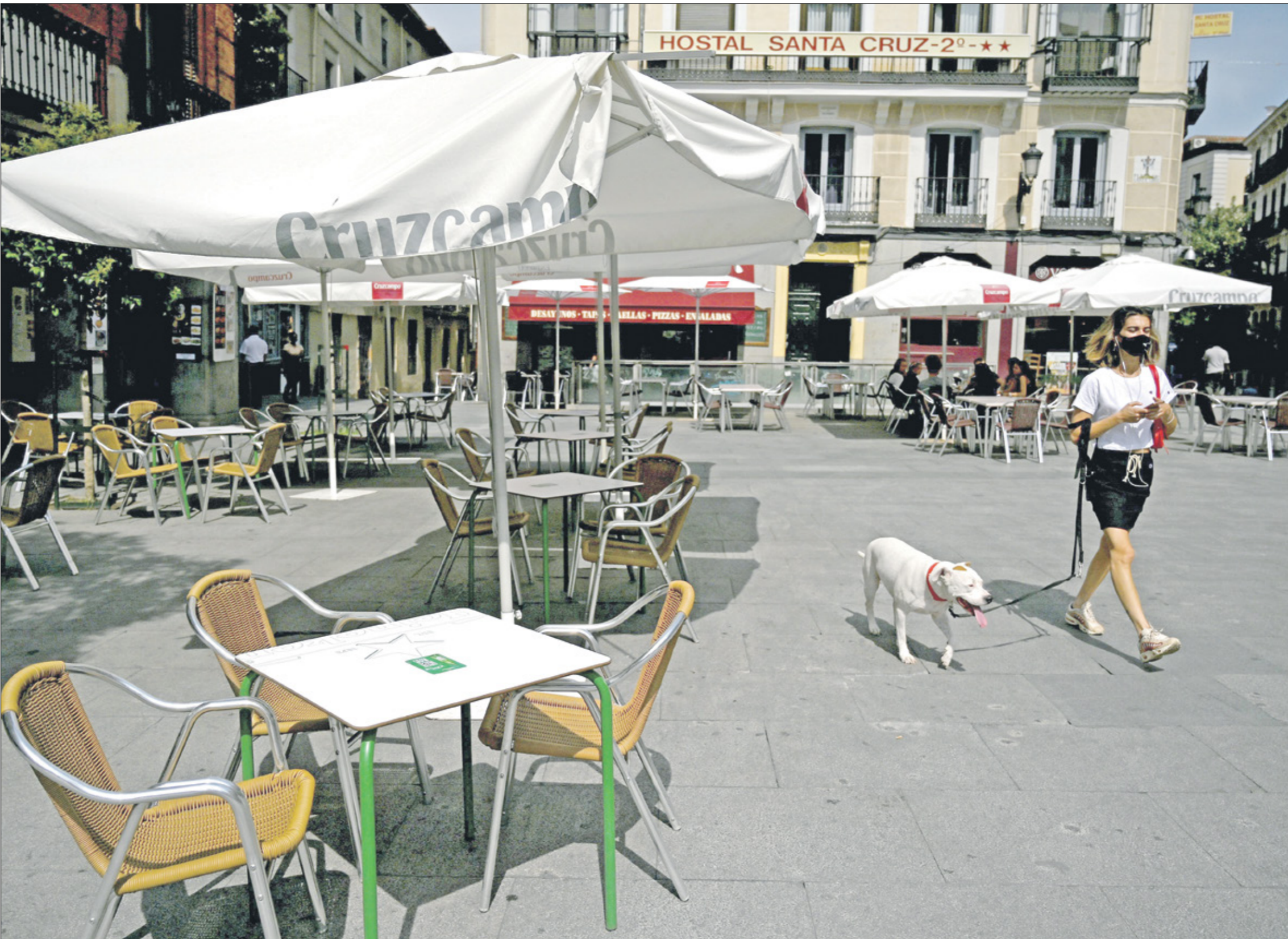
مراهب محارب خالية من الأثر بعد عودة إسبانيا للأنشاف

بلغت صادرات الملابس الجاهزة المنتمية في منطقة البحر المتوسط عائدات تركيا منها نحو 16,6 مليون منذ بداية العام وحتى أغسطس/ آب، وقال رئيس اتحاد مصدري الملابس الجاهزة للمنطقة غوركأن تكين لوكاتة «الأناضول»، الإثنين، إن صادرات المنخطة من الملابس الجاهزة منذ بداية العام، سجلت زيادة بنسبة 26% مقارنة بالفقرة نفسها من العام 2019. وأشار إلى أن عملية شراء الزبائئن من الخارج للملابس الجاهزة بدأت مع عودة مصدري تركيا من الخارج وتتحف تدريجيا مع كافة كورونا. ولقت إلى أن هولندا تصدرت قائمة أكثر البلدان