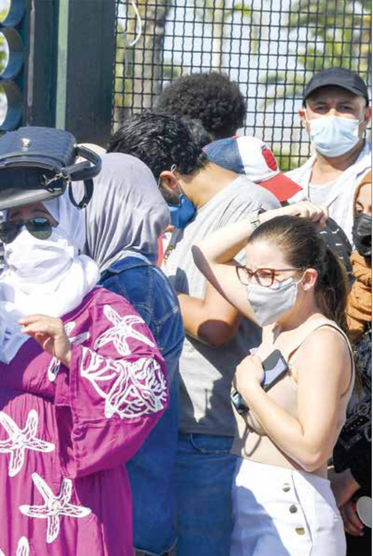
سجلت زحمة امام مراكز التلقيح بعد دعوة مهدي لحملات التلقيح مفتوحة لجميع المواطنين

لا تزال تونس تعيش دوامة الخلافات بين الاطراف الداعمة للحكومة والمعارضة لها، في ظل مرور البلاد بمرحلة حرجة نتيجة تفشي كورونا. وفيما تضغط المعارضة للإجهاز على الحكومة، تبحث الاغلبية النيابية عن حلول تمكنها من تلافي دفع ضربة الضلث