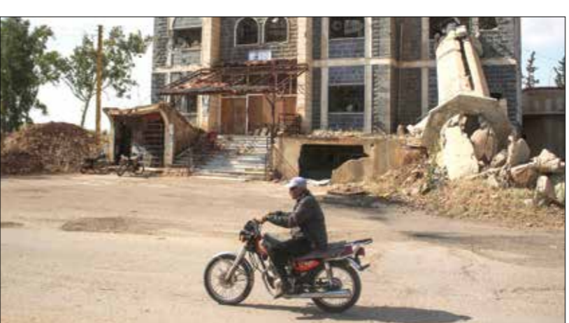
يتحرك حصار درعا البلد من دونع الشهر

في مناطقه والشمال السوري عموماً. في غضون ذلك، لا تزال البداية السورية مفرامية الأطرا مسرحا لعمليات عسكرية من قبل فلول تنظيم «داعش» ضد قوات النظام ومليشيات محلية وإيرانية تساندها، وهو ما يستدعي قفصا جويًا روسيًا يبدو أنه غير قادر على الحد من نشاط التنظيم الذي يتحرك على طول المبادية المعادلة لتصف مساحة سورية وعرضها، وتقدّم الطيران الروسي، أول من أمس، أكثر من 50 غارة جوية على مناطق انتشار التنظيم في البداية، بحسب «المرصد السوري لحقوق الإنسان»، مشيرًا إلى أن ست مقاتلات روسية تناوبت على قصف كوفوف ومغاور.