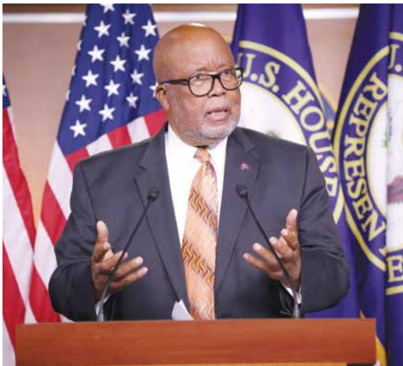
حذر طومسون الجمهوريين من عرقلة تحقيق اللجنة

2016، قبل أن يتم تعيينه رسمياً رئيساً للجنة المنظمة لحفل تنصيب الرئيس الخامس والأربعين للولايات المتحدة. واعتباراً من كانون الثاني/يناير 2017، قدم باراك المشورة لعدد من كبار المسؤولين الحكوميين بشأن سياسة الولايات المتحدة في الشرق الأوسط. وأشسارت وزارة العدل في بيانها بالخصوص إلى خطاب حول سياسة الطاقة الأميركية القاه ترامب، في مايو/ أيار 2016، خلال حملته الانتخابية، مؤكدة أن باراك ضمن هذا الخطاب فقرات مؤيدة للإمارات. كذلك فإنه متهم بالقيام بحملة في مارس/ آذار 2017 من أجل تعيين مرشح زخته الإمارات سفيراً للولايات المتحدة في أبوظبي، والمستشار السابق متهم أيضاً، وفق الوزارة، بتزويد أحد المتهمين الآخرين معلومات سرية حول ردود فعل إدارة ترامب إثر محادثات جرت في البيت الأبيض بين مسؤولين أميركيين وآخرين إماراتيين. وباراك متهم أيضاً بالكذب على مكتب التحقيقات الاتحادي خلال مقابلة حول تعاملاته مع الإمارات.