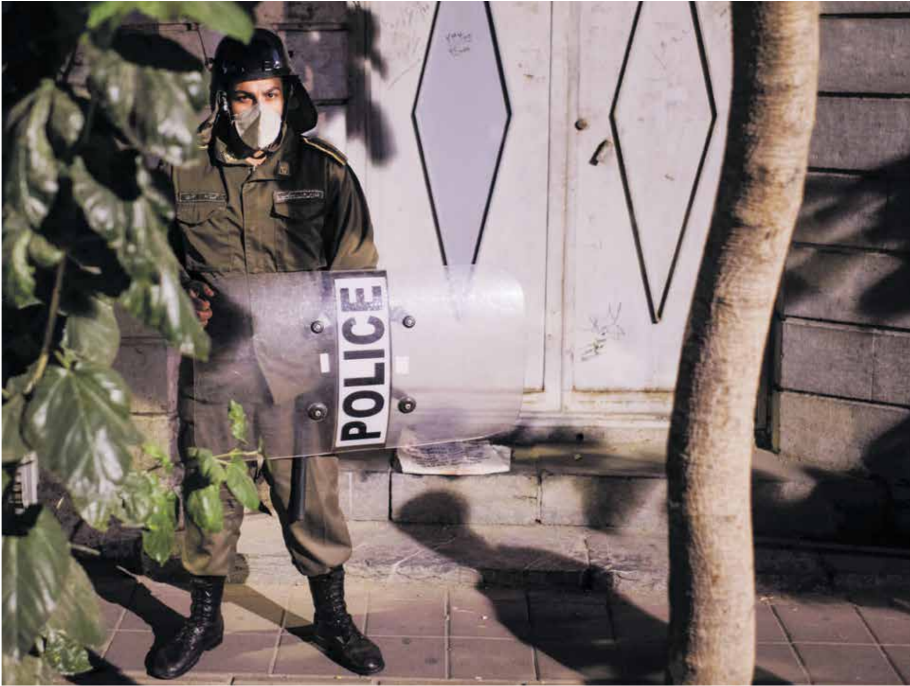
شجك مهتل شرطي إيراني خلال الاحتجاجات

وتحدثت صحيفة «اعتماد» الإصلاحية عبر قناتها على تطبيق «تلغرام»، ليل الثلاثاء، عن قطع الاتصال بالإنترنت، في شادكان، وأن خدمات الإنترنت الخلوية في مدينة اهواز «مقطعة»، وأشارت الصحيفة إلى أن بعض المسؤولين وقومون بامور أخرى (غير الاحتجاج السلمي)، القائلون يقول لنا إنه ينبغي التعامل معهم بشكل مختلف لكن الأساس عزيزون علينا».