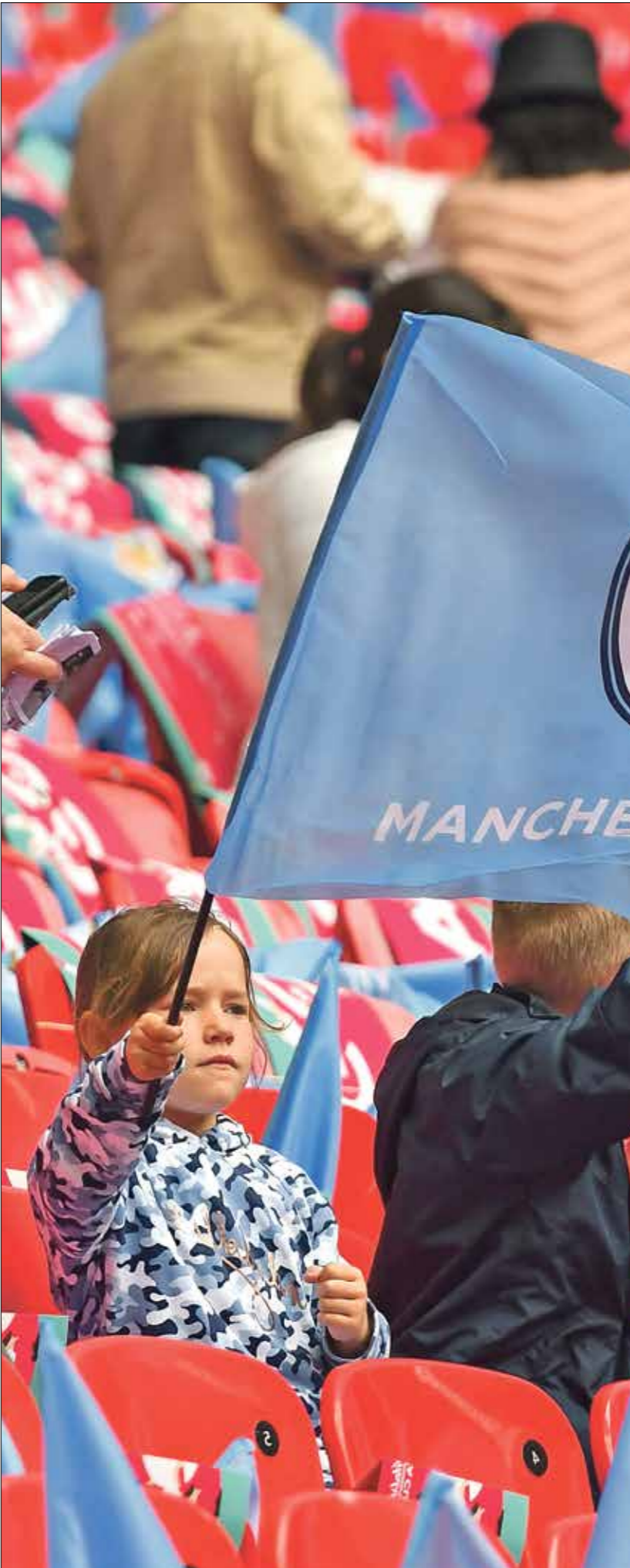
سيليا يتصدر ترتيب الدوري الإنكليزي

وتأثر الإسباني المخضرم البالغ من العمر 35 عاماً بتجدد الآلام في قدمه خلال مشاركته في دورة رولان غاروس، ما ساهم في خروجه من الدور الثالث على يد منافسه الكندي دينيس شايبولوف. لكن رافاييل نادال نصح أمام الألف المشجعين، الذين حضروا إلى الملاعب «رولان غاروس» بغرض حقيقية (للقول) أم لا» وتابع «إنه شيء أعرض معه كل يوم، لذا فهو ليس جديداً بالنسبة لي وليس مفاجأة كبيرة، لذلك أنا هنا فقط لألعب كرة المضرب ولأحاول تحقيق أفضل نتيجة ممكنة هنا في رولان غاروس. وإذا كنت لا أؤمن بأن هذا الأمر (الفوز) يمكن أن يحدث، فلم أكن لأوجد هنا على الأرجح».