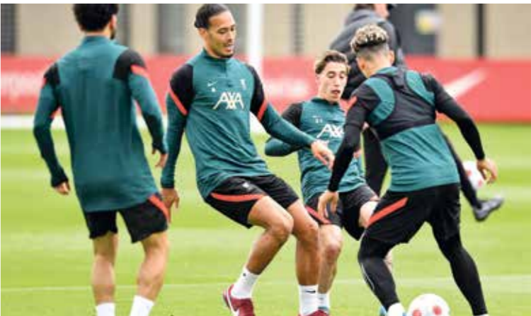
ليورول يامله في حصص رابعة تاريخية

وتحتج أنظار الجماهير الرياضية، الأحد، إلى الأسبوع الـ 38 والأخير من منافسات الموسم الحالي بالدوري الإنكليزي لكرة القدم، من أجل معرفة بطل «البريميرليغ»، وهوية الأندية التي ستضمن الحصول على مقاعد في المسابقات القادمة، بالإضافة إلى تحديد الفريق الهابط إلى «التشامبيونشيب»، البداية ستكون في تحديد هوية البطل، حيث سيلعب مانشستر سيتي ضد أستون فيلا في استاد «الأتش» فيما يحل نادي وولفرهامبتون ضيفاً على ليفربول في