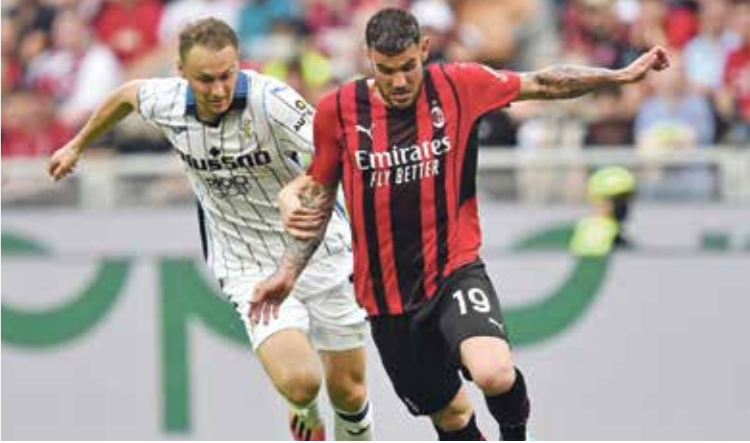
ميلان الثقب لحسم لقب الدوري الإيطالي