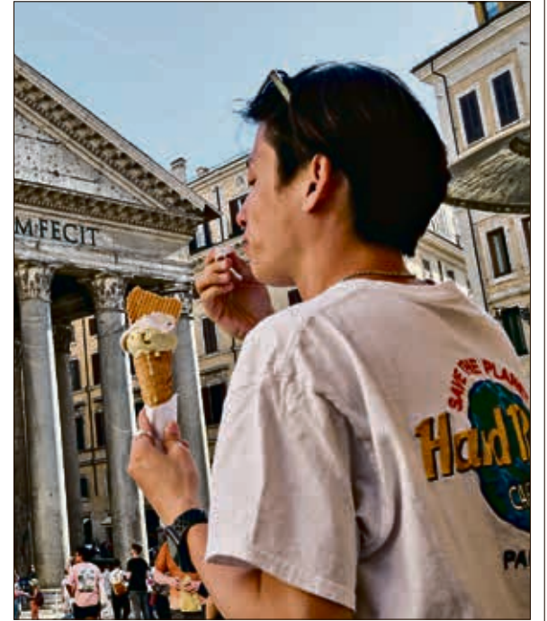
يتناول البوظة في إيطاليا