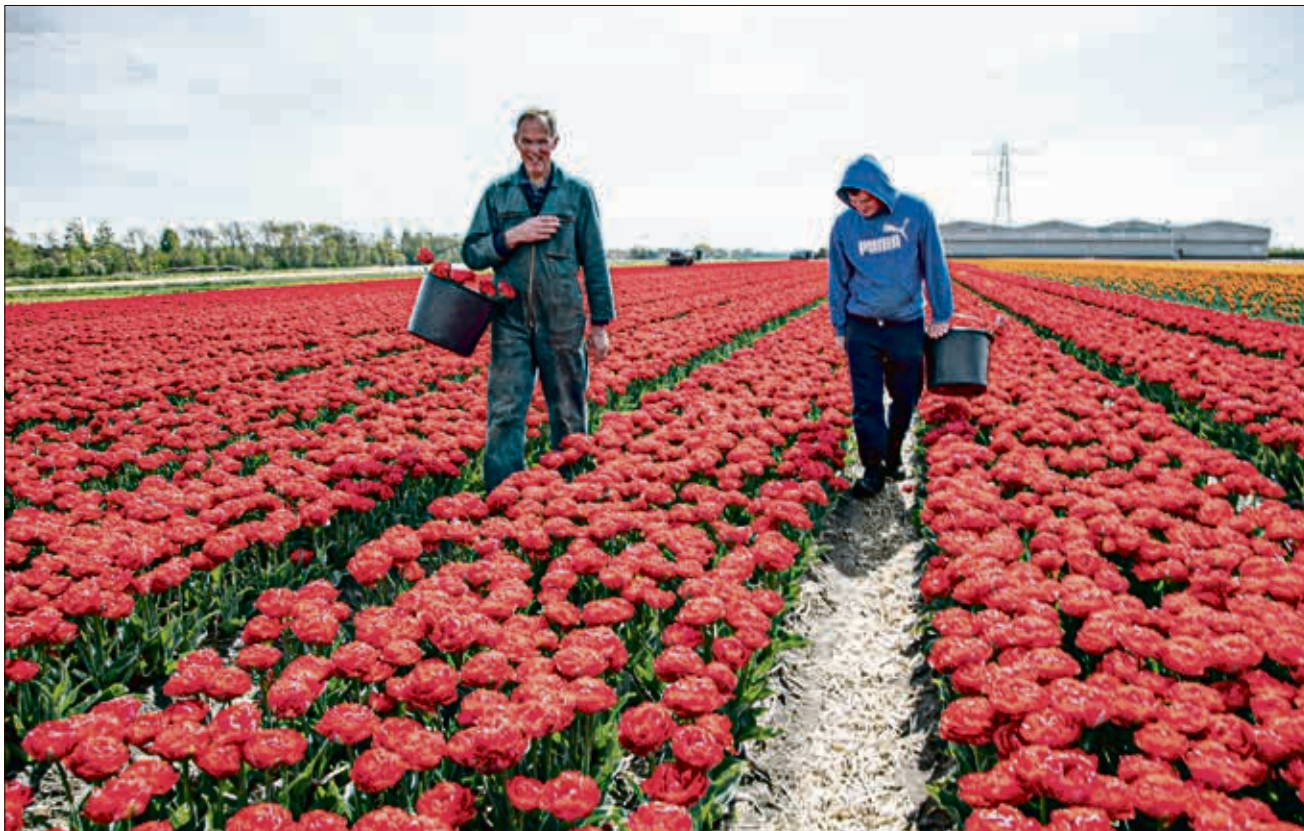
حقلة لأزهار التوليب في هولندا