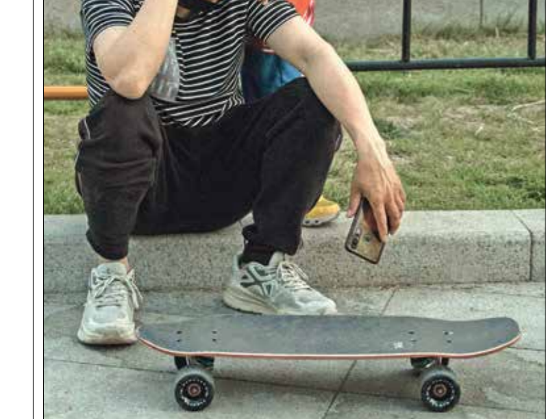
مني انتظار انتهاء استنثار كورونا (الجزيرة فريد/الأمم) (Getty)

وتشهد العاصمة الصينيّة بكين منذ أسابيع إغلاقات جزئيّة لـ 12 منطقة على الأقل مع وقف كل وسائل المواصلات، وإخضاع السكان البالغ عددهم 22 مليون نسمة لفحوص حمض نووي ويومّة، وسبق أن أعلنت شركة النقل العام في العاصمة أن ركاب الحافلات يجب أن يظهروا تطبيق الهاتف الخليوي الخاص بحالتهم الصحيّة على بعض الطرق اعتباراً من بداية العام الحالي، وحتى نهاية إبريل/ نيسان الماضي، كما سجلت عودة 96% لاجئاً من الأراضي السوريّة منذ بداية شهر مايو/ أيار الحالي وحتى 18 و2000 لاجئ، في إحصائية لمعبر باب الهوى الحدودي بين هاتان التركيّة وإدلب السوريّة عودة 1323 لاجئاً خلال إبريل/ نيسان الماضي فقط وبحسب إحصائية المعبر التي نشرت بشكل رسمي، فقد تمّ تصنيّف هؤلاء بأنهم «مرحّلون من تركيا»، أمّا في معبر باب الهوى الحدودي بين كلس التركيّة وأعزاز السوريّة شمال حلب، فقد أشار مصدر لـ «العربي الجديد» إلى أنّ عدد اللاجئين الذين عادوا خلال هذا الشهر بشكل طوعي إلى سورية يقدر بما بين 18 و2000 لاجئ، في وقت يبلغ عدد الذين رحلوا بشكل سري خلال الشهر الحالي حوالي 200 لاجئ، وهؤلاء سجلت بحقهم مشكلات ومخالفات داخل تركيا.