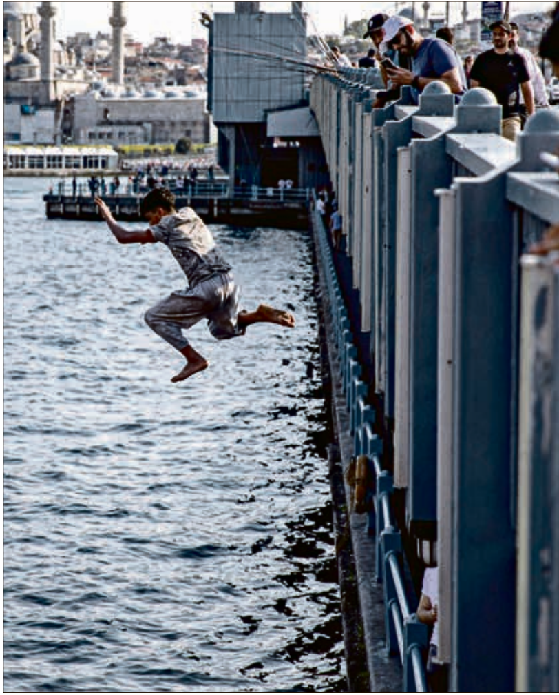
قفزة في البوسفور