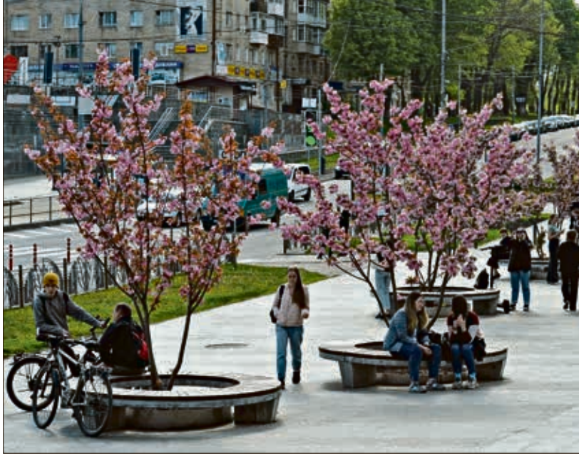
ربيع منطقة فينيتسيا وسط كييف