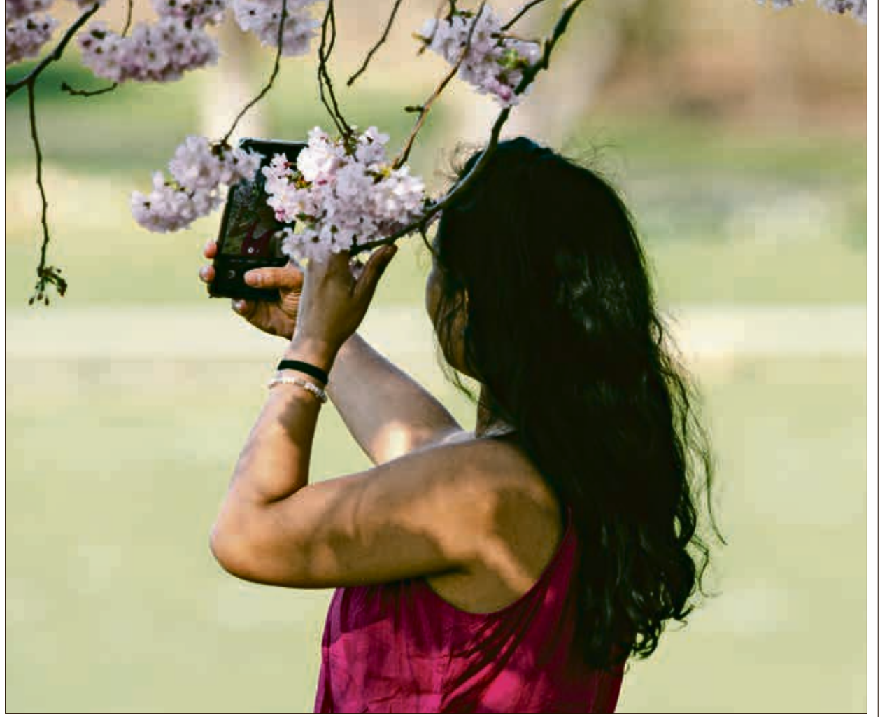
صورة سيلفي تحت شجرة مزهرة في بون