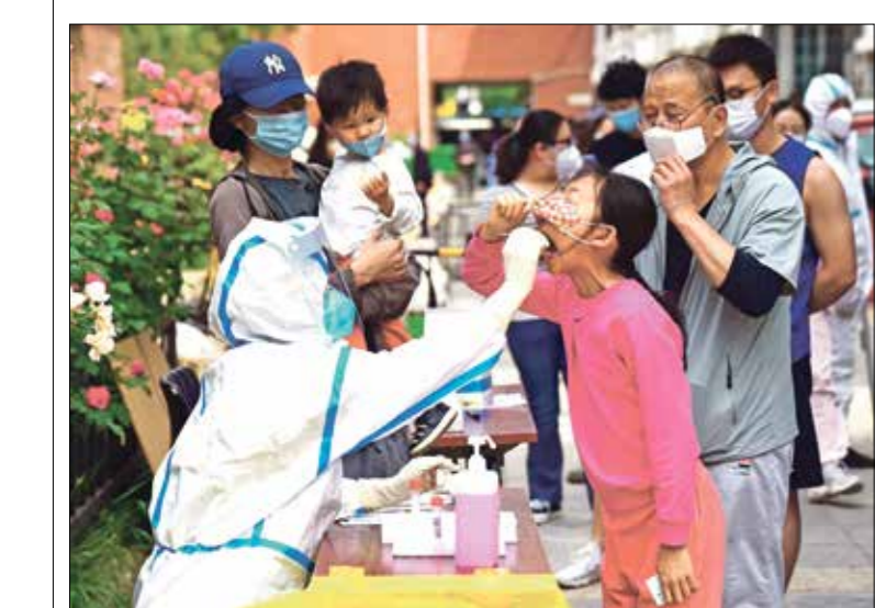
يخطّص 22 مليون شخص في بكين لفحوص حمض نووي، يوميّة

وتشهد العاصمة الصينيّة بكين منذ أسابيع إغلاقات جزئيّة لـ 12 منطقة على الأقل مع وقف كل وسائل المواصلات، وإخضاع السكان البالغ عددهم 22 مليون نسمة لفحوص حمض نووي ويومّة، وسبق أن أعلنت شركة النقل العام في العاصمة أن ركاب الحافلات يجب أن يظهروا تطبيق الهاتف الخليوي الخاص بحالتهم الصحيّة على بعض الطرق اعتباراً من بداية العام الحالي، وحتى نهاية إبريل/ نيسان الماضي، كما سجلت عودة 96% لاجئاً من الأراضي السوريّة منذ بداية شهر مايو/ أيار الحالي وحتى 18 و2000 لاجئ، في إحصائية لمعبر باب الهوى الحدودي بين هاتان التركيّة وإدلب السوريّة عودة 1323 لاجئاً خلال إبريل/ نيسان الماضي فقط وبحسب إحصائية المعبر التي نشرت بشكل رسمي، فقد تمّ تصنيّف هؤلاء بأنهم «مرحّلون من تركيا»، أمّا في معبر باب الهوى الحدودي بين كلس التركيّة وأعزاز السوريّة شمال حلب، فقد أشار مصدر لـ «العربي الجديد» إلى أنّ عدد اللاجئين الذين عادوا خلال هذا الشهر بشكل طوعي إلى سورية يقدر بما بين 18 و2000 لاجئ، في وقت يبلغ عدد الذين رحلوا بشكل سري خلال الشهر الحالي حوالي 200 لاجئ، وهؤلاء سجلت بحقهم مشكلات ومخالفات داخل تركيا.