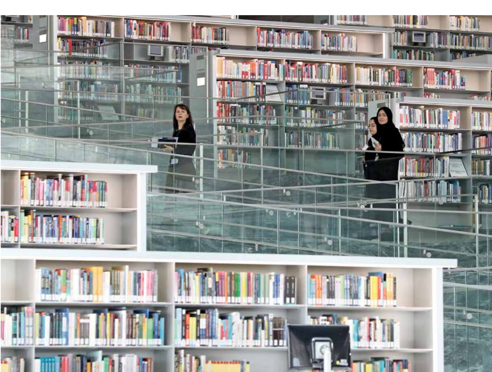
أطلقت المكتبة مشروع «حماية» لمكافحة الاتجار بالتراث الوثائقي

تصدر الإشارة إلى أن هذا المشروع يعزز دور المكتبة، التي اختيرت لتكون المركز الإقليمي لصيانة مواد المكتبات والمحافظة عليها في الدول العربية ومنطقة الشرق الأوسط منذ عام 2015، من قبل الاتحاد الدولي لجمعيات