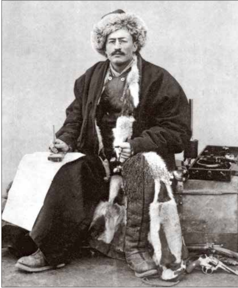
ولد هيدين في استوكهولم عام 1865 وتوفي عام 1952