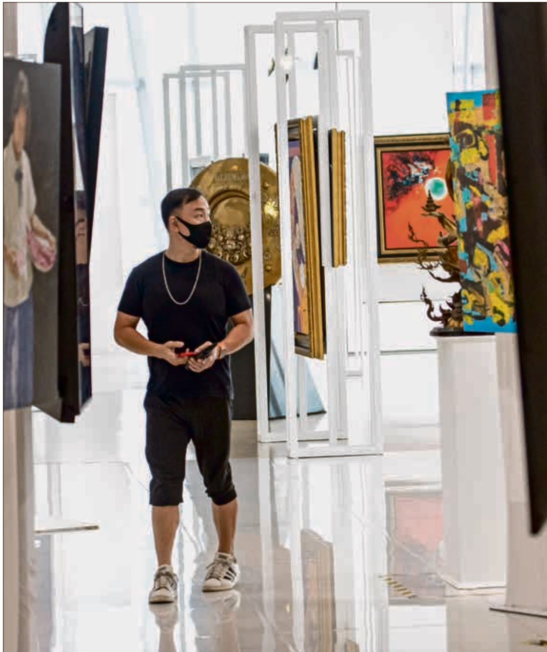
قيمة القطعة ليست هي الفائدة منها، بل هي الصفة الاجتماعية التي تضفيها على صاحبها