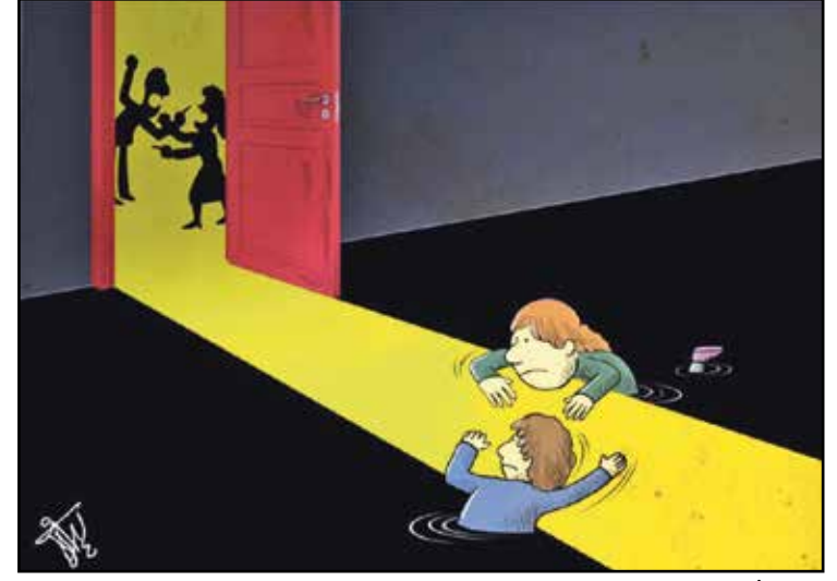
آباء يتشاجرون واطفال يغرقون في الظل (كيفان فريسي، كار تون موفمنت)