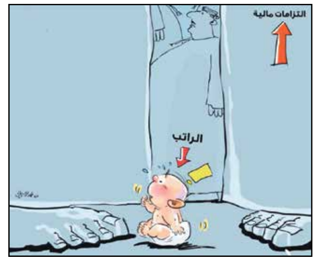
الراتب عاجز (فهد الزجال، جريدة عُمان)