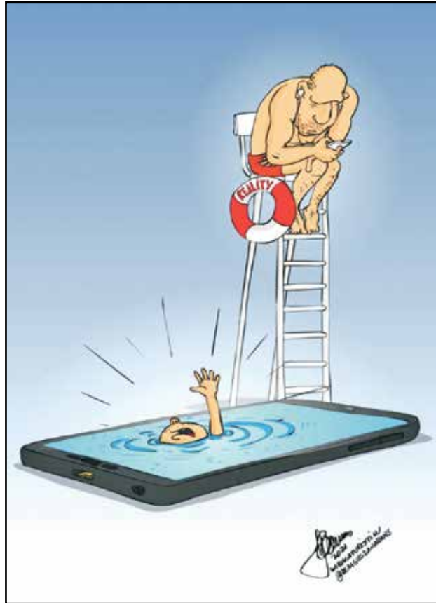
طفله يغرق في الموبايل وابوه لا يسمع صراخه (مفوس زهران، المصدر ذاته)