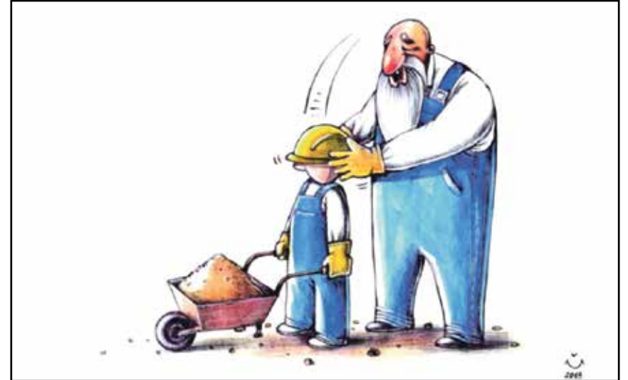
اطفال يرتدون الشفاء والتعب عن آباءهم (مظفر بلشبيوف، المصدر ذاته)