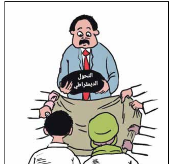
هل ينجح حمدوك في حل الخلاف؟ (هيبد، تويتر)