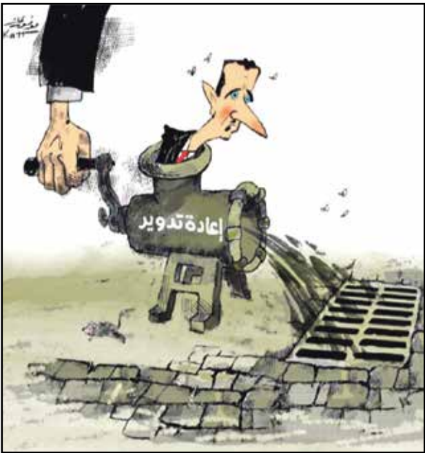
إعادة تدوير بشار الأسد (موقف فات، تلفزيون سوريا)