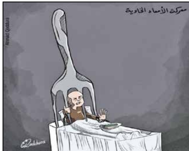
اسرر فلسطين في معركة الأسماء الخاوية (احمد قدورة، فيسبوك)