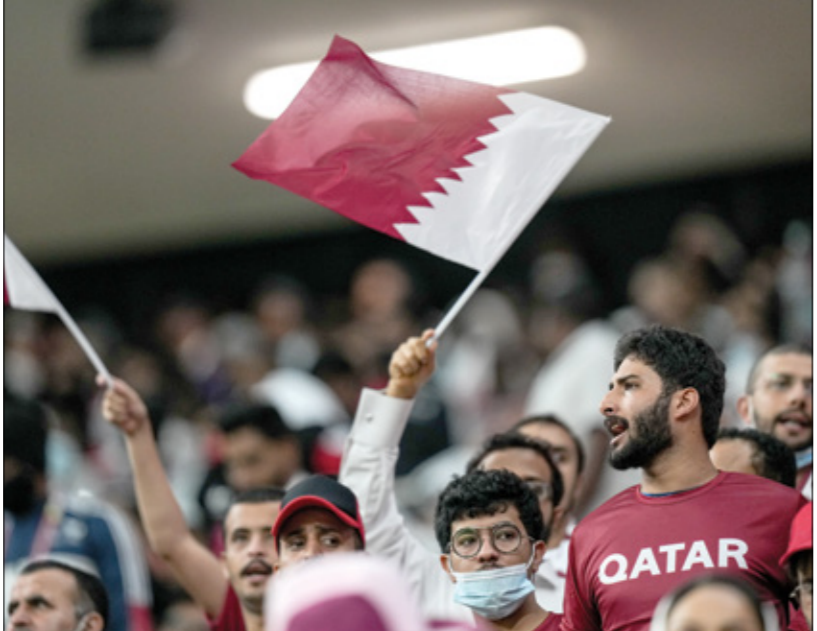
الجماهير تستلعم ملعب مونديال قطر 2022

ورغم ذلك، لا يزال استخدام مكيفّات الهواء في الملاعب أمراً متخيراً للجدل، وبحسب الرئيس التنفيذي للجمعية البريطانية للرياضة المستدامة راسل سميون، فإنّه على الرغم من فعالية التكنولوجيا والطاقة المجددة في قاعة، هناك مخاوف حيال الرسالة التي تقدّمها عملية تكثيف الهواء في الهواء الطلق. ففي الوقت الذي يتم فيه حبس الناس على توفير الطاقة، «غالباً ما يفتح الناس في المكتب نوافدهم، فهم يريدون هواء منعشاً ولكن لديهم أيضاً مكيف هواء، فتختلط الأمور وتبدأ المشكلات». وأضاف فتحتخلط الأمور وتبدأ المشكلات، فإنه بغض النظام والتحقّق من فعاليته، علماً أنّ هذه التكنولوجيا الجديدة خالصة من براءات الاختراع، كما أنّه متأكد من أنّ نهائيات كأس العالم في المستقبل، لا سيما في 2026 في الولايات المتحدة والمكسيك وكندا، ستحتاج إلى نظام «مكتور كول»، وأوضح في ختام حديثه «في المستقبل، من أجل سلامة اللاعبين، ستكون الملاعب المكيفة أكثر شوعاً».