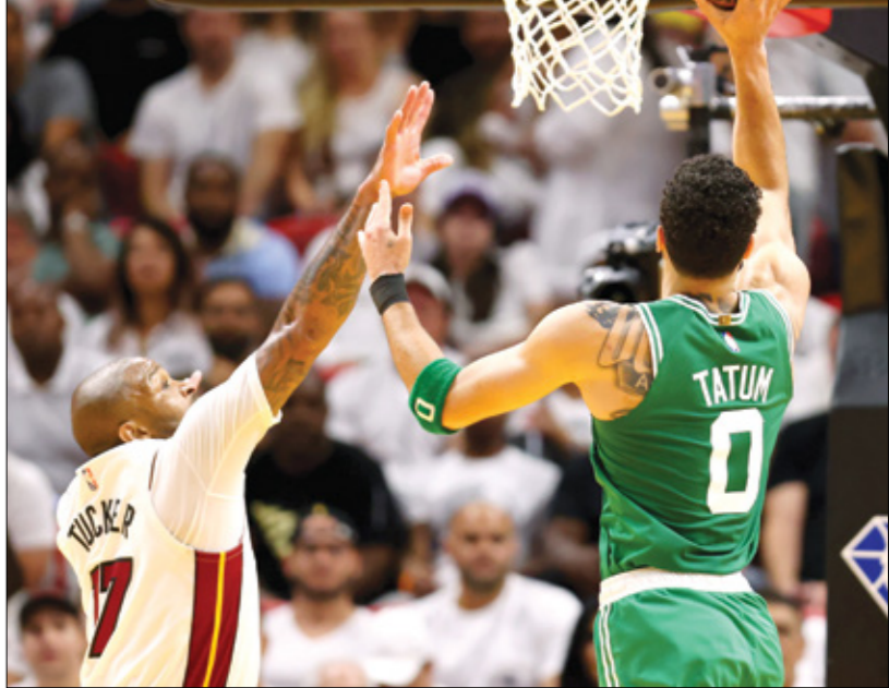
سلتيكس يرد التاهل للماتب السلة الأميركية هذا الموسم

عاد فريق بوسطن سلتيكس في مواجهته ميامي هيت، ليواصل منافسته للتاهل