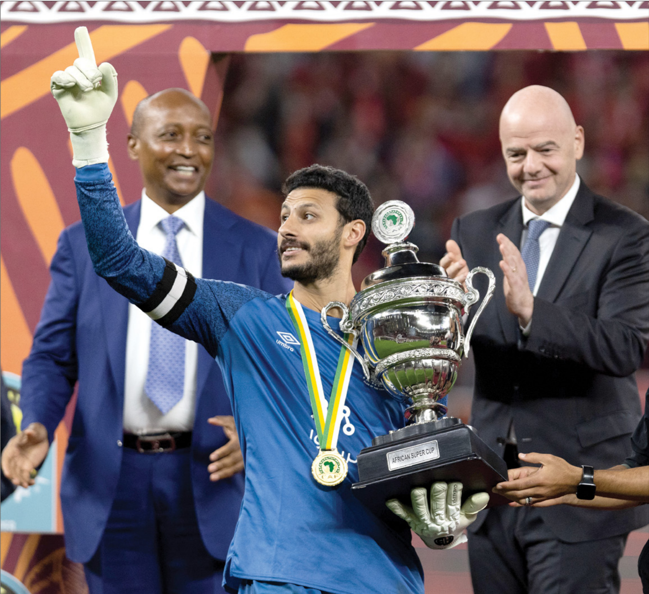
الكرة الأفريقية لتعاب المرث بسبب سوء التنظيم (جزيرة صليب)

الثقة إلى المغاشي أحمد أحمد، ثم عانى الأخير من التجمد في ولايته «2017-2021» ولاخفة قضايا الفساد من جانب سكرتير «كاف» السابق الراحل عمرو فهمي في الاتحاد الدولي «فيفا»، وصلت في النهاية إلى إيقاف أحمد أحمد عن ممارسة أي نشاط رياضي في كرة القدم مستقبلا، وانتهت ولايته بتسكّر درامي ليحل محله باتريس موتسيبي.