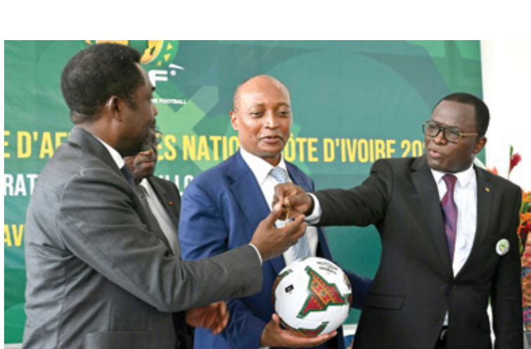
رئيس الاتحاد الأفريقي صليب، يتلخيم أفضل للبطولات

المصري مع نادي السودان المغربي، المقرر لها في 30 مايو/ أيار الجاري في نهائي دوري أبطال أفريقيا لموسم 2021-2022 بآداب البيضاء، بركان الغضب حول عملية تنظيم البطولات في ظل تردّي القرارات المتخذة وتضاربها من وقت إلى آخر. وتسير