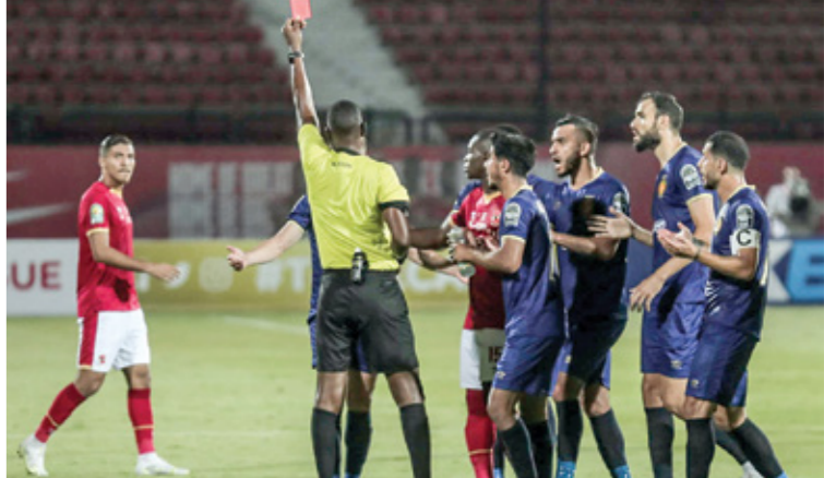
غياب التنسيف وتضارب القرارات يعضان الكاف في ورطة

كاس الكونفيدرالية الأفريقية السيناريو نفسه هي الأخرى عبر عودة الدور النهائي إلى مصر مباراتي الذهاب والإياب بعد 3 سنوات، رغم أن الأمور في الكونفيدرالية أفضل حالا من دوري الأبطال وجرى تنظيم المباريات النهائية في 3 دول مختلفة، هي المغرب 2020 وبنين 2021 ونيجيريا 2022،