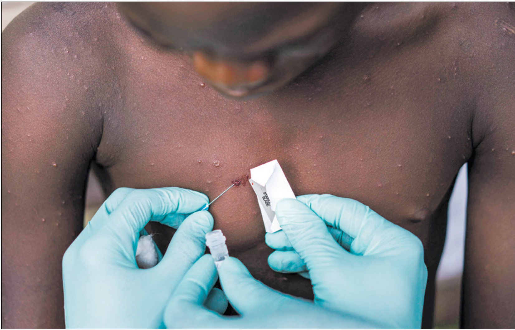
الطفح الجلدي من أعراض المرض - جمهورية الكونغو