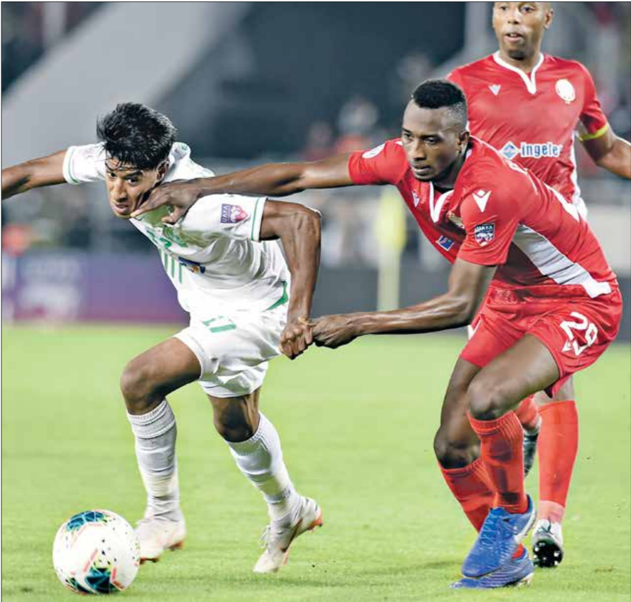
مواجهة فظفظة في منافسات الكرة المغربية

الفرمان بلعبان ورفعة المالح نجحت المساهمات المالية، التي جمعتها