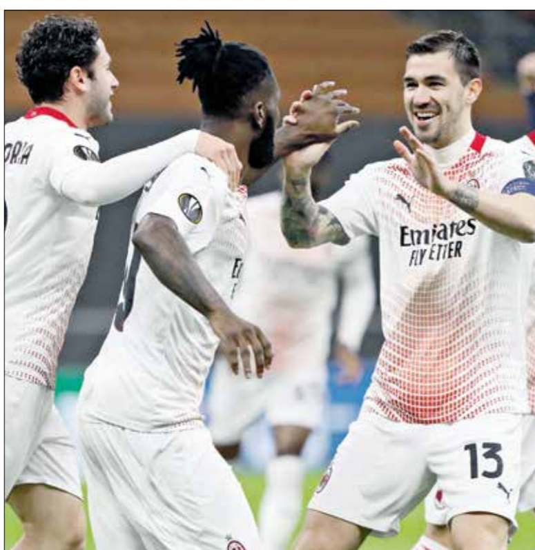
ميلان يريد استعادة التوازن محلياً سريعاً

وأضاف فريق «الروسونيرى» هذا الخروح الخصب إلى سلسلة النتائج السلبية التي حققها في الدوري، والتي أدت إلى تمازجه عن الصدارة، وتحلّفه بفارق تسع نقاط عن جاره إنتر ميلان، الذي يسير بخطى نحو لقبه الأول منذ 2010، وجاء خروج ميلان على يد مانشستر يونايتد، على الرغم من عودة نجمه الخضر السويدي زلاتان إبراهيموفيتش، بعد تعافيه من إصابة عضلية، وقد شارك في الشوط الثانى، ليخسر فريق الرجاء والوداد، في ظل حالة الطوارئ الصحية التي تعيشها المملكة العربية حتى حوالي ستة، بسبب الوضع الصعب، وقررت السلطات، إغلاق مجموعة من المقاهى المجاورة للعب محمد الخامس، في فترة المباراة التي ستعطل في الخامسة مساءً بالتوقيت المغربى، بالإضافة إلى تلك الموجودة بالأجزاء الشعبية، فضلاً عن منع جمهورى الفريق من الاقتراب من محيط الملعب لتجنب أي مناوشات بينهما.