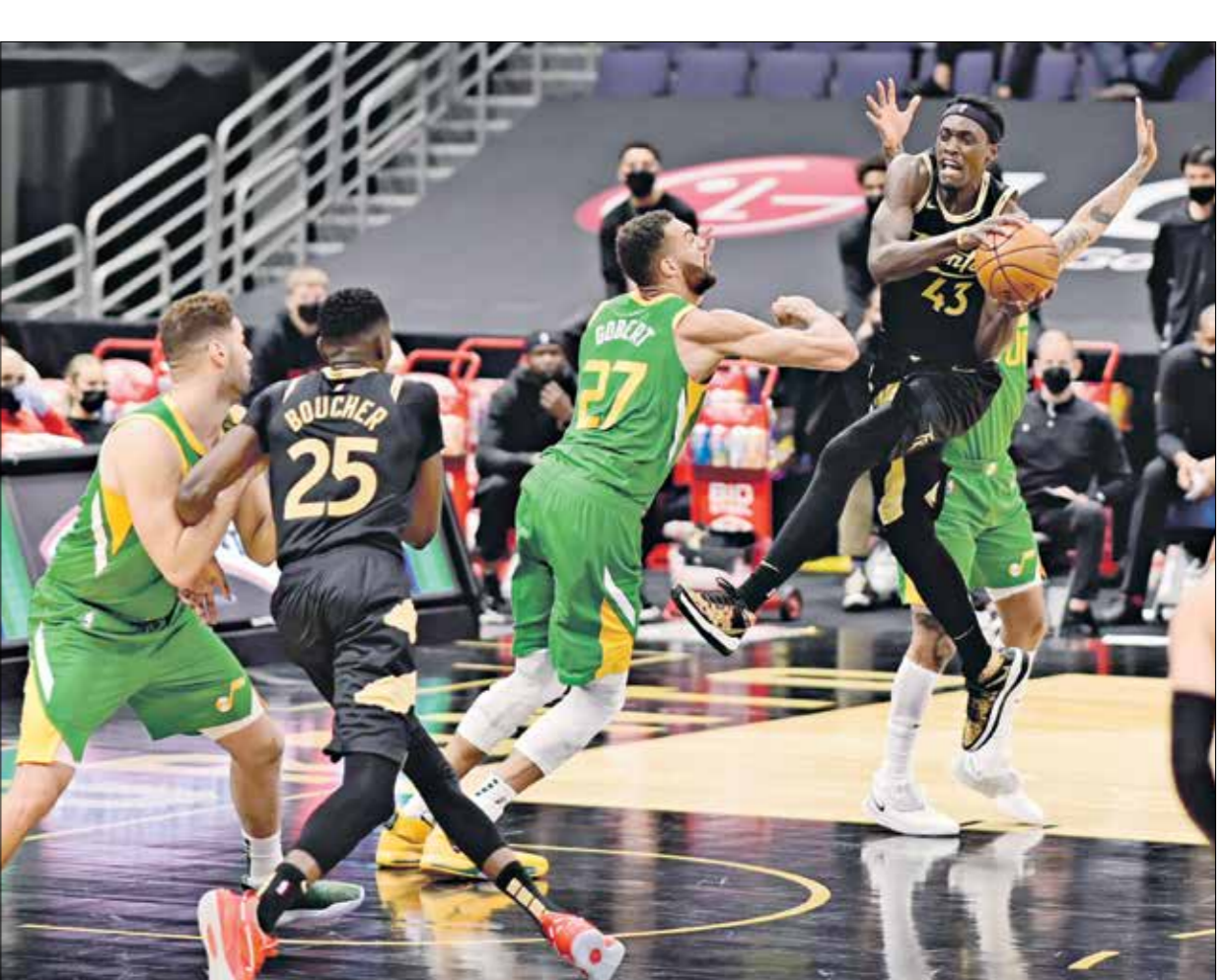
يوتا جاز حقق فوزاً مهماً في بطولة الدوري

وخاض فريق جاز المباراة بعد تلقي خسارة صادمة أمام منافسه واشنطن ويزاردز (131 - 122) يوم الخميس الفائت، ونجح الفريق في حسمها بعدما أفلت التعادل من نجم الكاميرونى بايكل سيباكاف في الثواني الفائتة، ولم يظهر جاز الأداء الذي مكّنه من