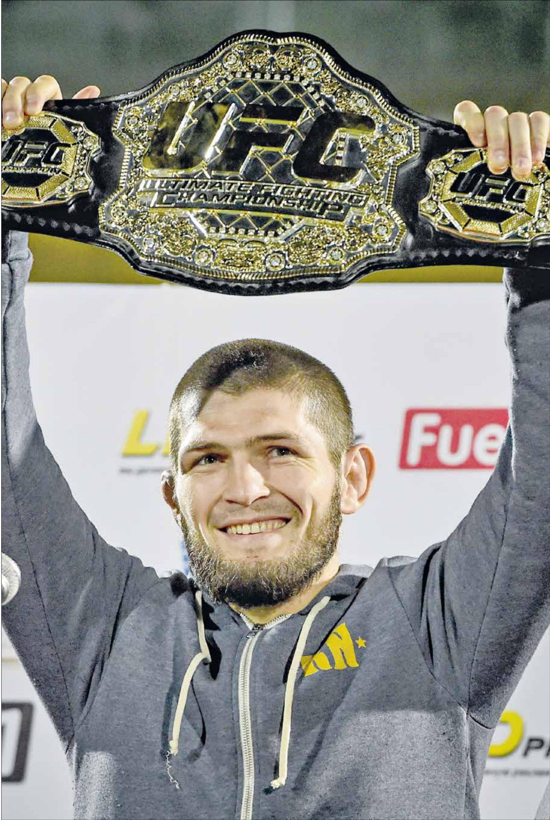
خبيب ملك الأرقام القياسية في الفنون القتالية المخلطة

أعلن الروسي خبيب نورمحمدوف بطل الفنون القتالية المخلطة اعتراله رسمياً من بطولة النزال النهائي. وأعلن دانا وايت، مالك الشركة المنظمة للبطولة، في منشور على «تويتر» عن ذلك، وخرج نورمحمدوف بعدها، وأعلن عن شكره على الدعم خلال مسيرته الرياضية. ويأتي اعترال خبيب بعد 29 فوزاً، من دون أي خسارة، والدفاع بنجاح عن اللقب في 4 مرات.