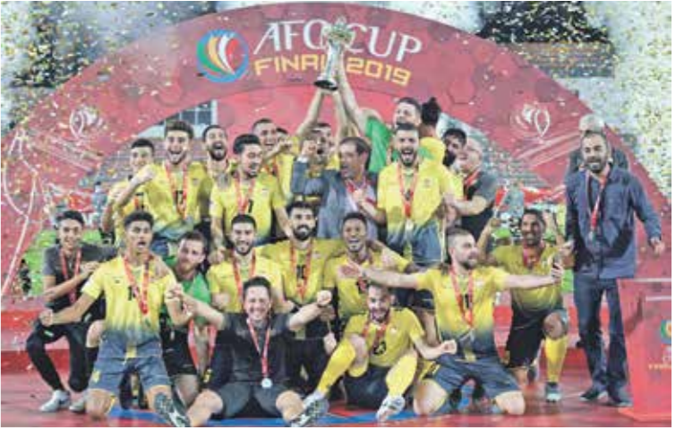
العهد الثنائي بطة النسخة الماضية لكأس الاتحاد الآسيوي

وقال الاتحاد الآسيوي في بيان رسمي: «في ضوء الوبجستيات لتتسبق المناطق ففي السقارة الآسيوية قررت اللجنة التنفيذية للاتحاد الآسيوي لكرة القدم، في اجتماعها عبر تقنية الفيديو، إلغاء مسابقة كأس الاتحاد الآسيوي لعام