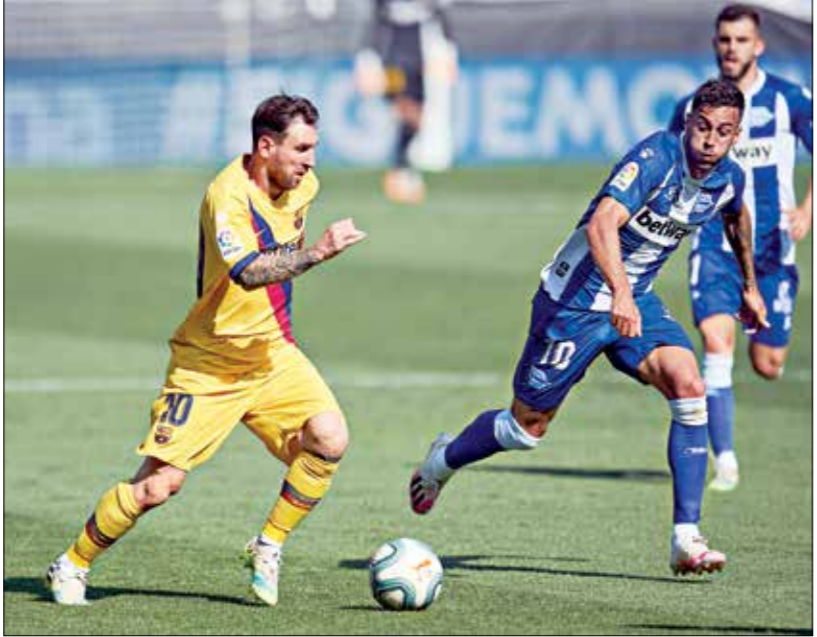
عاشت جماهير برشلونة وقتا عصيبا بسبب ميعاد

الجديد غايي غارسيا، بعدما فقد بعض أعمدة الفريق، لكن فترة الإعداد تشي يانه لن يكون فريسة سهلة، إذ أوقعته الفرقة في صوفه بصفتق قوبتين هما داني بارخو ورافانسيس كوكيلين القادمين من فالنسيا، أما فالنسيا فسيفيدا موسمهم مع المدير الفني