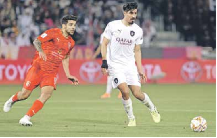
قطر تلحظ أبطال آسيا بسبخته الجديدة

ووافق المكتب التنفيذي على إقامة نهائي دوري الأبطال في منطقة غرب آسيا يوم 19 كانون الأول/ديسمبر، من جولة واحدة بدلا من مباراتي ذهاب وإياب، وقال البحريني سلمان بن إبراهيم آل خليفة رئيس الاتحاد الآسيوي بحسب ما نقل الاتحاد القاري: «تم القيام بعمل كبير من أجل ضمان إمكانية انطلاق هذه المباريات يوم 14 أيلول/سبتمبر، وامتاز الاتحاد الآسيوي لكرة القدم بالاحترافية الكاملة من أجل ضمان إقامة هذه المباريات