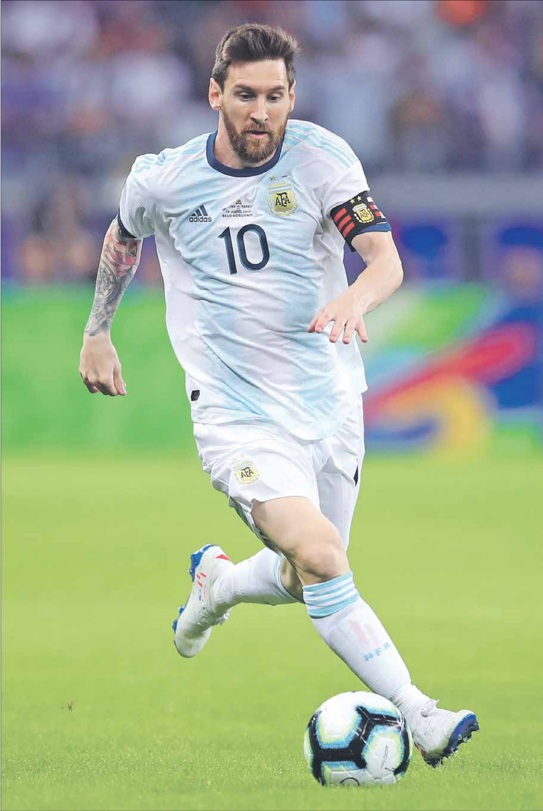
ميسي سيكون موجودا في تصفيات مونديال قطر

قال رئيس الاتحاد الأرجنتيني ليونيل ميسي مع المنتخب في افتتاح تصفيات كأس العالم الشهر المقبل، بعد انتهاء إيقافه خلال كأس كوبا اميركا العام الماضي. وتم إيقاف اللاعب بعد طرده في لقاء تحديد المركز الثالث ضد تشيلي واتهامه مسؤولي اتحاد اميركا الجنوبية بالفساد.