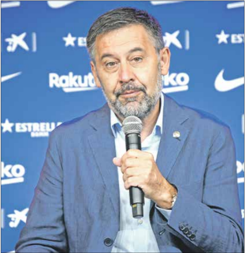
للاحق، المشاكل بارتوميو رئيس برشلونة بسبب فشل العريف

وكان النجم الأرجنتيني ليونيل ميسي، قد أثار ضجة كبرى خلال الأسابيع الماضية، بعدما أعلن نيته الرحيل عن برشلونة،