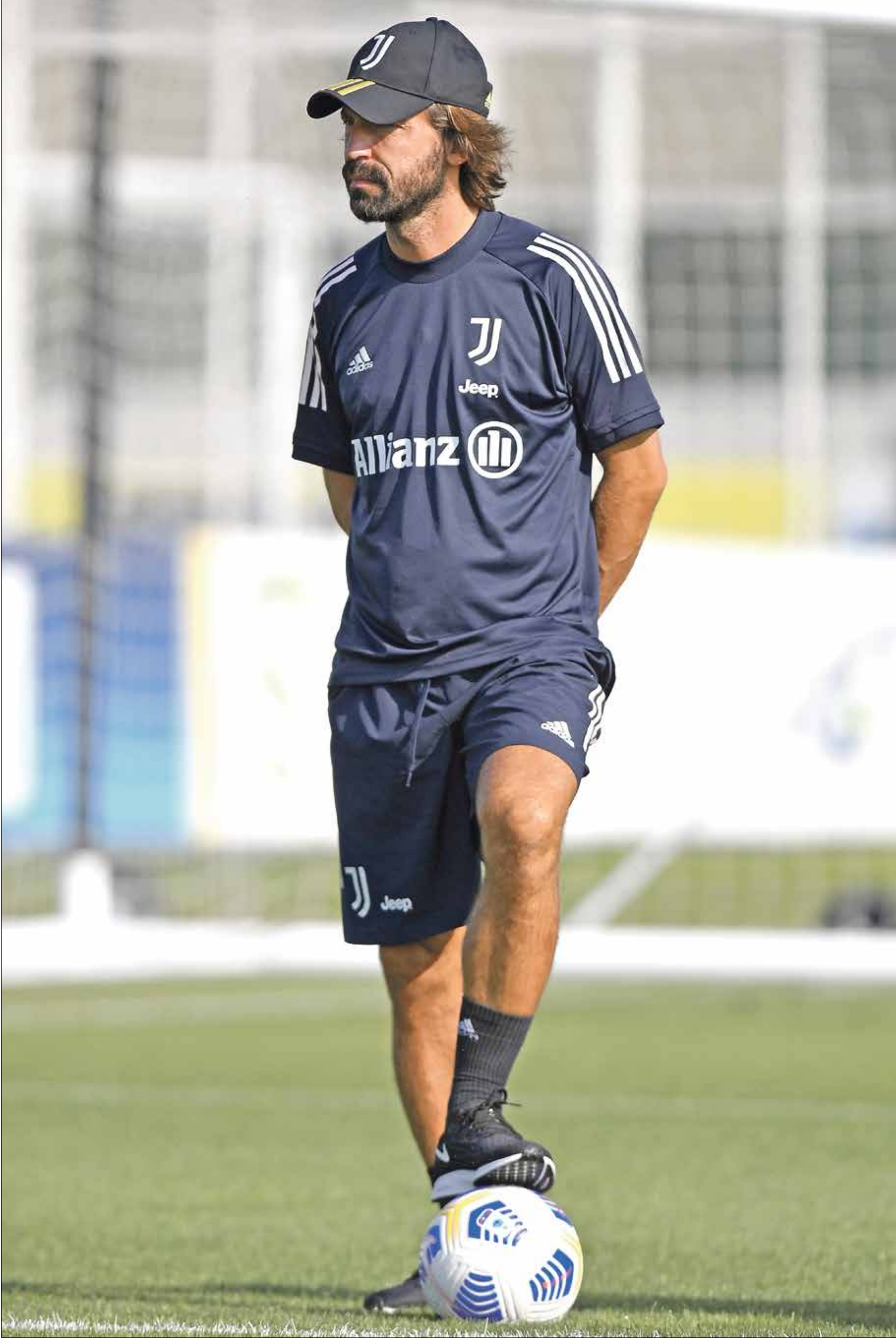
بيرلو تولى المهمة خلفا للمقال ساري

كشف أندريا بيرلو، المدير الفني الجديد ليوونتوس، بأنه يجب عليه أن يفوز بلقب الأسكوديتو العاشر مع التوالى مع فريق «السيدة» العجوز»، الذي هيمن على بطولات الدوري الإيطالي في السنوات الأخيرة، وجاء الدور على بيرلو الذي تولى المهمة الفنية هذا الصيف، خلفا لساري، لحصد تتويج جديد.