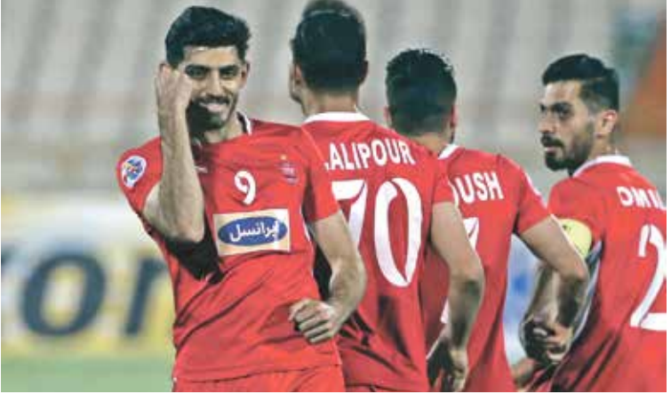
بيرسيبوليس الإيراني ملانس فوجي ملتظ

وفي اللقاء الثاني تقاسم فريق النصر وضيفة السد نقاط اللقاء حين تعادلا 2-2، سجل لأول عبدالرزاق حمدالله وعبدالرحمن العبيد، فيما سجل الفريق القطري كل من بغداد يونجاح وحسن الهيدوس. وفي الجولة الثانية خسر العين على أرضه مرة