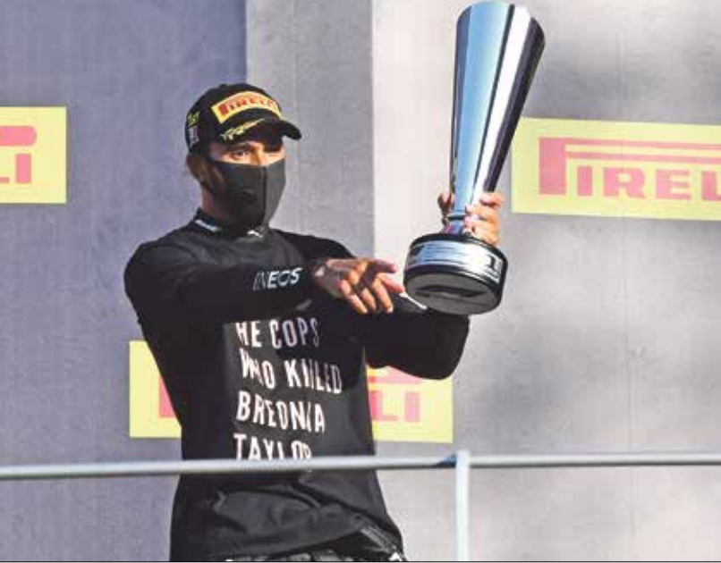
فرحة هاميلتون بفوزه بجائزة سائق توسكانا

الذي سبّب خروج 6 سيارات أخرى، وحصل الحادث عندما استبق سائقو ذيل الترتيب في سيارتهما نتيجة حادث اللقّة الأولى، وعند انطلاق السباق مجددا في نهاية اللقّة السابعة بعد خروج سيارة الأمان، حدث الحادث الثاني الأكبر والأكثر استعراضًا والفرنسي إستييان أوكون (رينو)، ورأى الفرنسي ضمن عروجان أن ما حصل كان غريبا من النخس الموجود في المقدمة، في إشارة إلى بوتاس، مضيّفاً: «هل يريدون قتلنا أم ماذا؟ هذا أسوأ شيء أراه على الإطلاق»، وسأل بوتاس فرقة مهيدس عما حصل بعد الانطلاق الثاني، فجابيه مهيدس الاسترأنتيجة في الفريق جيمس فاولز: «متحقد أن البعض انطلق قبل أن نطلق نحن، فاصطدم بعضهم ببعض». وبعد الانطلاق الثالث إثر توقف لأربعين دقيقة، نجح هاميلتون في استعادة المركز الأول من زميله بوتاس، ولم تنته الأمور عند هذا الحد، إذ اضطرت سيارة الأمان إلى الدخول في اللقّة الـ44 بعد حادث قوي لهندسي لانس ستروول (رايسينغ بوينت)، فسارع السائقون إلى الأعادة من توقف السباق لاستبدال الإطارات، لكن مراقبي السباق عادوا واتخذوا باللقّة الـ44 قرار توقيف السباق للمرة الثانية من أجل السماح بإزالة السيارة التي تحطمت كليًا.