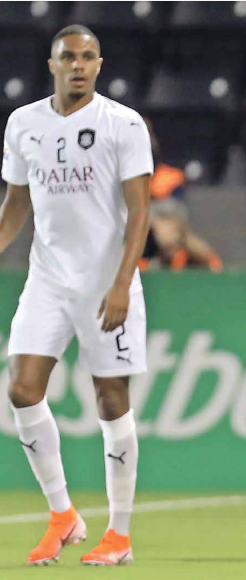
السد القطري يصنع لهزيمة الضيف

واحتسب الكح ضريرة حرة مباشرة لصالح أولمبيك مرسيليا، فذهبا ريمسيتري بايت بإتقان كبير، بعدما أرسلها إلى زميله فوران توفين، الذي كسر مصيدة التسلل وأطلقها