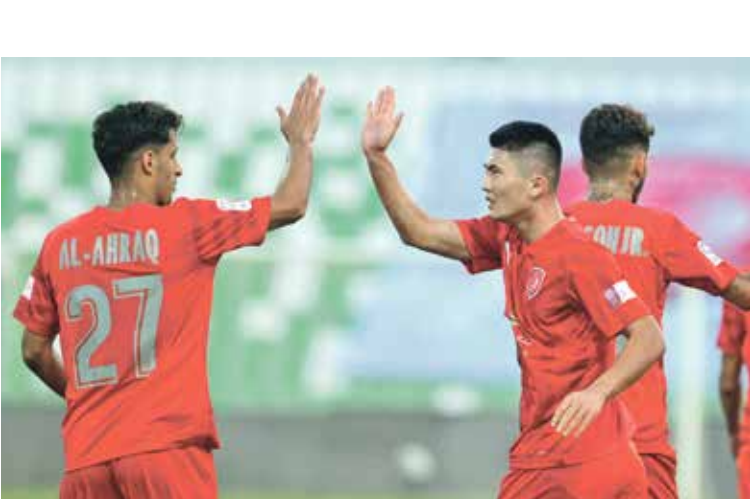
الدحيل وطوحوحات التالاف في الأبطال

تتواصل منافسات مسابقة دوري أبطال اسيا في العاصمة القطرية الدوحة، إذ تقام اليوم الثلاثاء مواجهات مثيرة ومتعددة، فيلتقي نادي الدحيل القطري مع الشارقة الإماراتي على استاد المدينة التعليمية ضمن المجموعة الثالثة، وبلي هذه المباراة على ذات الملعب ضمن ذات المجموعة لقاء بيرسيبوليس الإيراني مع التعاون السعودي. وفي المجموعة الرابعة يلتقي نادي العين الإماراتي مع السد القطري على استاد جاسم بن حمد في قمة مثيرة للغاية، على أن يُلعب بعدها لقاء سيباهان