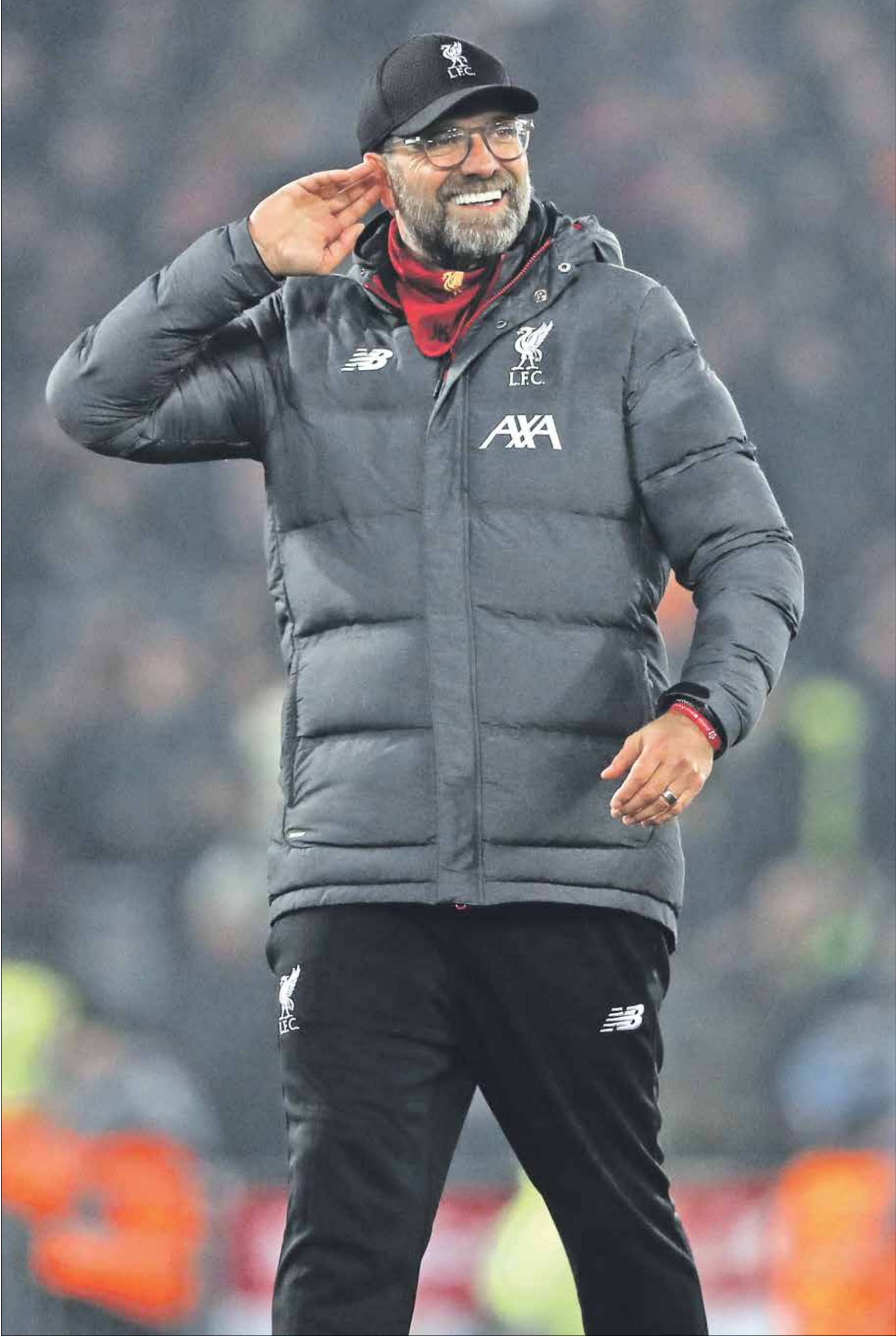
كلوب مدرب نادي ليفربول الإنجليزي

أصبح المدير الفني لفريق ليفربول الإنجليزي، يورغن كلوب، مُهدداً بفقدان نجمه الهولندي جورجينيو فينالدم، المطلوب بقوة من قبل مواطنه رونالد كومان المدير الفني الجديد لبرشلونة، والذي يعرف اللاعب جيداً أثناء تدريبه لمنتخب «الطواحين». وكشفت صحيفة «ليفربول إيكو» المتخصصة في أخبار «الريدز»، أن هذا الوضع بات يزعج كلوب، بسبب عدم اتضاح الرؤية حيال مستقبل نجمه، قبل أيام من بداية الدوري الإنجليزي الممتاز.