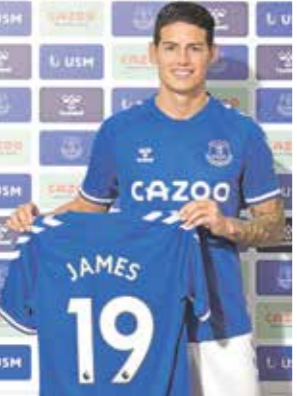
خاميس رودريغز يلاحف بانثيلوت في إيفرتون

التحق صانع الألعاب الكولومبي خاميس رودريغيز بمدربه السابق الإيطالي كارلو أنشيلوتي، وذلك بتوقيع مع إيفرتون الإنكليزي لمدة عامين قادماً من ريال مدريد الإسباني مع خيار التمديد لعام آخر، وذلك بحسب ما أعلن القطب الأزرق لمدية ليفربول. ونقل موقع إيفرتون عن الكولومبي البالغ من العمر 29 عاماً قوله «أنا سعيد للغاية بالتواجد في هذا النادي الرائع، وأنا أكون هنا مع مدرب يعرفني جيداً، مضمناً «أتطلع لتحقيق أمور رائعة هنا والخوف بأشياء، وهذا ما يهدف إليه الجميع». وأنشيلوتي، الذي يشرف على إيفرتون منذ كانون الأول/ ديسمبر 2019، كان صاحب الفضل في قدوم خاميس إلى ريال مدريد من موناكو الفرنسي عام 2014، ثم ضمه أيضاً إلى بايرن ميونيخ الألماني حيث لعب للكولومبي على سبيل الإعارة بين 2017 و2019 قبل العودة إلى النادي الملكي، وفي ظل معاناته في صفوف ريال، شدد خاميس على أنه قادم لإيفرتون «من أجل محاولة التطور والتحسين، كما أتيت إلى هنا من أجل مساعدة الفريق على الفوز ولعب كرة جميلة، كرة متعة»، وتابع «أنا متفجع، بوجود كارلو (أنشيلوتي) والطاقم الفني، بإمكاننا تحقيق أشياء كبيرة»، كاشفاً أنه «من بين أكبر الأسباب (القدومه إلى إيفرتون) هو وجود كارلو أنشيلوتي. استمتعت بأوقات رائعة تحت قيادته سابقاً في ناديين مختلفين. هذا سبب أساسي لقدمي إلى هنا».