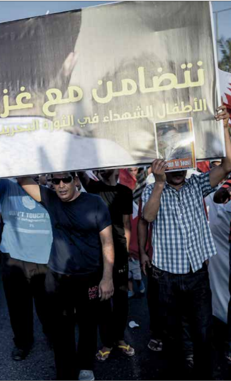
يشار الشعب البحريني لصالح القضية الفلسطينية

وفي لقاء مع دوري غولد، مستشار سابق لرئيس الوزراء الإسرائيلي بنيمائين نتياهو، في ذات البرنامج، قال إن إيران كانت ترسل مسلحتها البحرينية بحماس