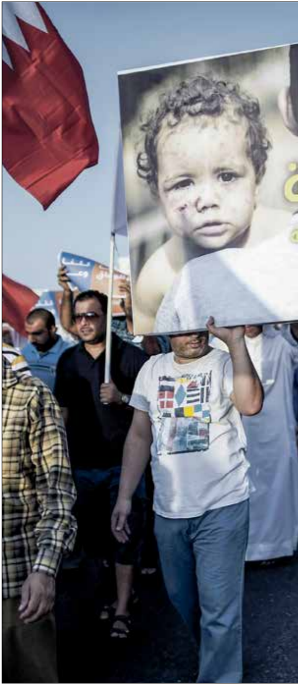
يشار الشعب البحريني لصالح القضية الفلسطينية

الملاذ عبر البرلمان الذي تم حله عام 1975 واستبداله بقانون الطوارئ الذي أدخله في الحكم، وسط العاصمة المنامة وشاركوا في الحكم طائفة وفدوية لم تنته إلا بانتهاء قانون الطوارئ عام 2002.