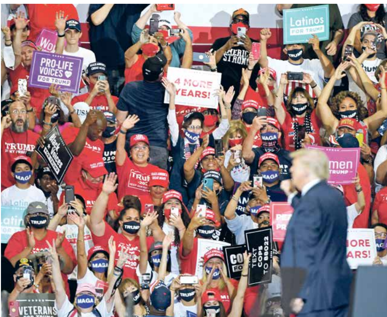
التفد مسؤولون وحاكم ولاية نيفادا تجتمع لترامب الانتخابي

الباهتة لكسب دعم مجتمعهم قد يكون لها عواقب وخيمة في انتخابات نوفمبر. وذكر ساليغان أن استطلاعات الرأي الأخيرة التي أظهرت نجاحات ترامب مع اللاتينيين، أحدثت موجة جديدة من