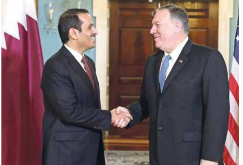
وقع بومبيو ووزيره القطري علي عبد مّد المفاوضات (اليمين واليسار)

من ثلاث سنوات بعد قفّ كل مع من السعودية والإمارات والبحرين ومصر علاقاتها مع قطر وفرض حصار شامل عليها. وأثنى الوزير الأميركي على الدور القطري في عدد من قضايا المنطقة، وأشاد في هذا السياق بالدور القطري «في مساعدة الأفغان من أجل الوصول إلى السلام». كما أشار إلى أنّ «قطر تلعب دوراً مهماً لتخفيف التوتر في سورية ولبنان».