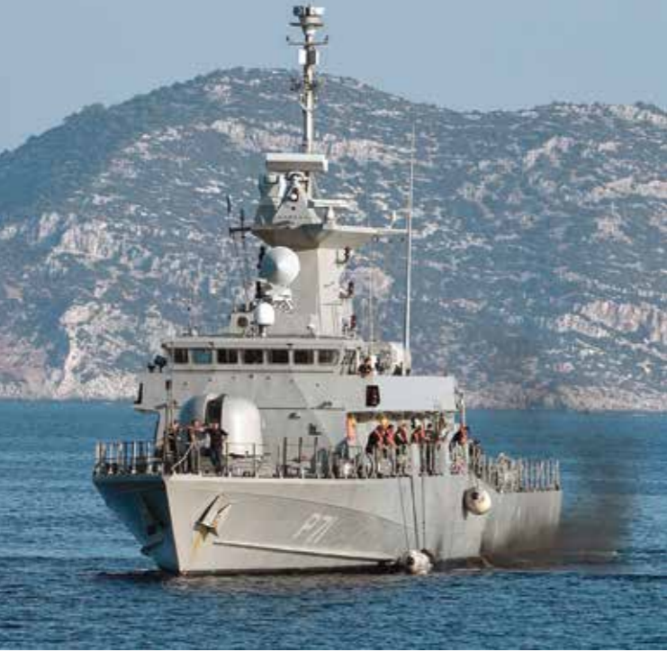
تلنرت اليونان فرقاطات وسفنا حربية قرب جزرها في المتوسط