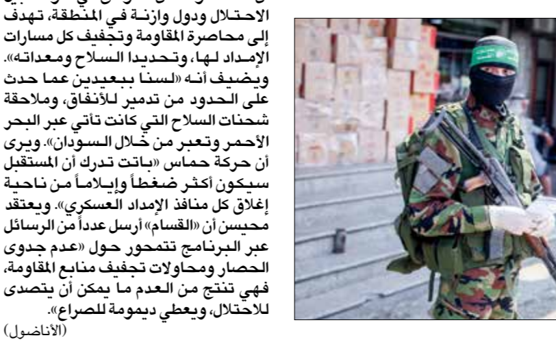
كشفت «القسام» عن اسلحة أمير دوربما

ومنذ عام 2006، تطالب اللجنة الرباعية الدولية (تضم الولايات المتحدة، روسيا، والاتحاد الأوروبي، الأمم المتحدة، حماس، واليحاد الإرهابي، والاعتراف بحق إسرائيل في الوجود، والاعتراف بالانفاقات الموقعة بين إسرائيل والفلسطينيين، ونزع سلاحها» مقابل الاعتراف بها كطرف مقبول ومعترف