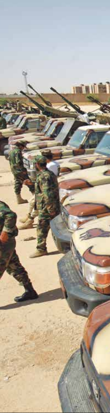
تسعّم القاهرة للخطاط علي تاصم مليشيات حفتر

كما يتخصن التصور الذي يلقي قبولاً مصرياً، بتشكيل مجلس عسكري تتوخّد تحتة كافة الكتائب والمليشيات الرسمية