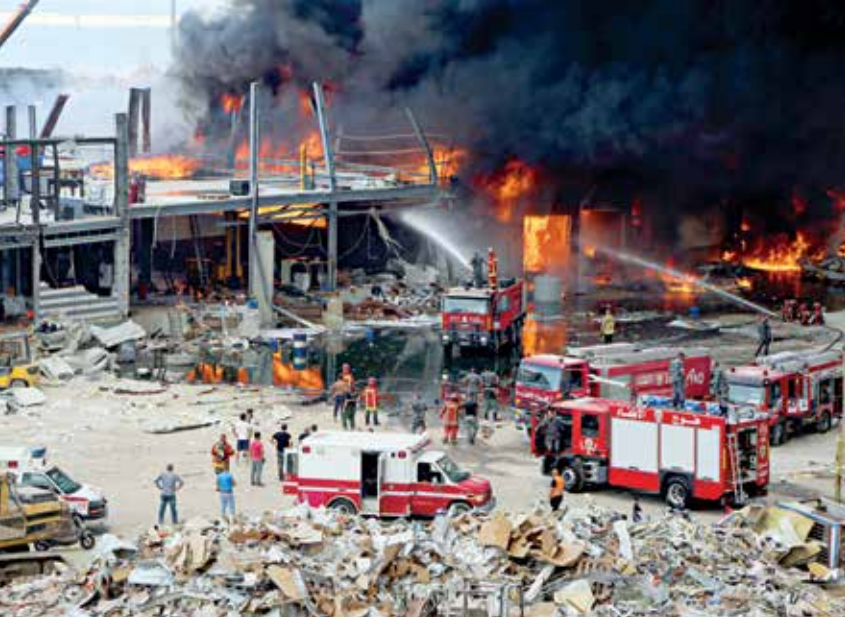
حريق المرفأ بعد الشجار بشهر

ويشير شحادة إلى أن «مستشفى حيفا استقبل أكثر من 60 جريحاً من مختلف الجنسيات»، مضيفاً أن أسرة المستشفى امتلات وكذلك قسم الطوارئ، «ما جعلنا نعالج بعض المصابين وهم جالسون على سرير واحد». لافتاً إلى أن «الأطباء الفلسطينيين قدموا من كل المناطق اللبنانية للمساعدة، وأن التضامن الإنساني بين الشعبين الفلسطيني من لبنان اللبناني كان عالياً». ويوضح أن الجمعية تولت تكاليف علاج الجرحى. في المقابل، يقول إن «أي مسؤول لبناني لم يسأل عن وضع الجرحى. كما أنه لم تبادل الجهات اللبنانية للعنية لتغطية تكاليف العلاج، علماً أنها أعلنت علاج جميع المصابين على نفقتها».