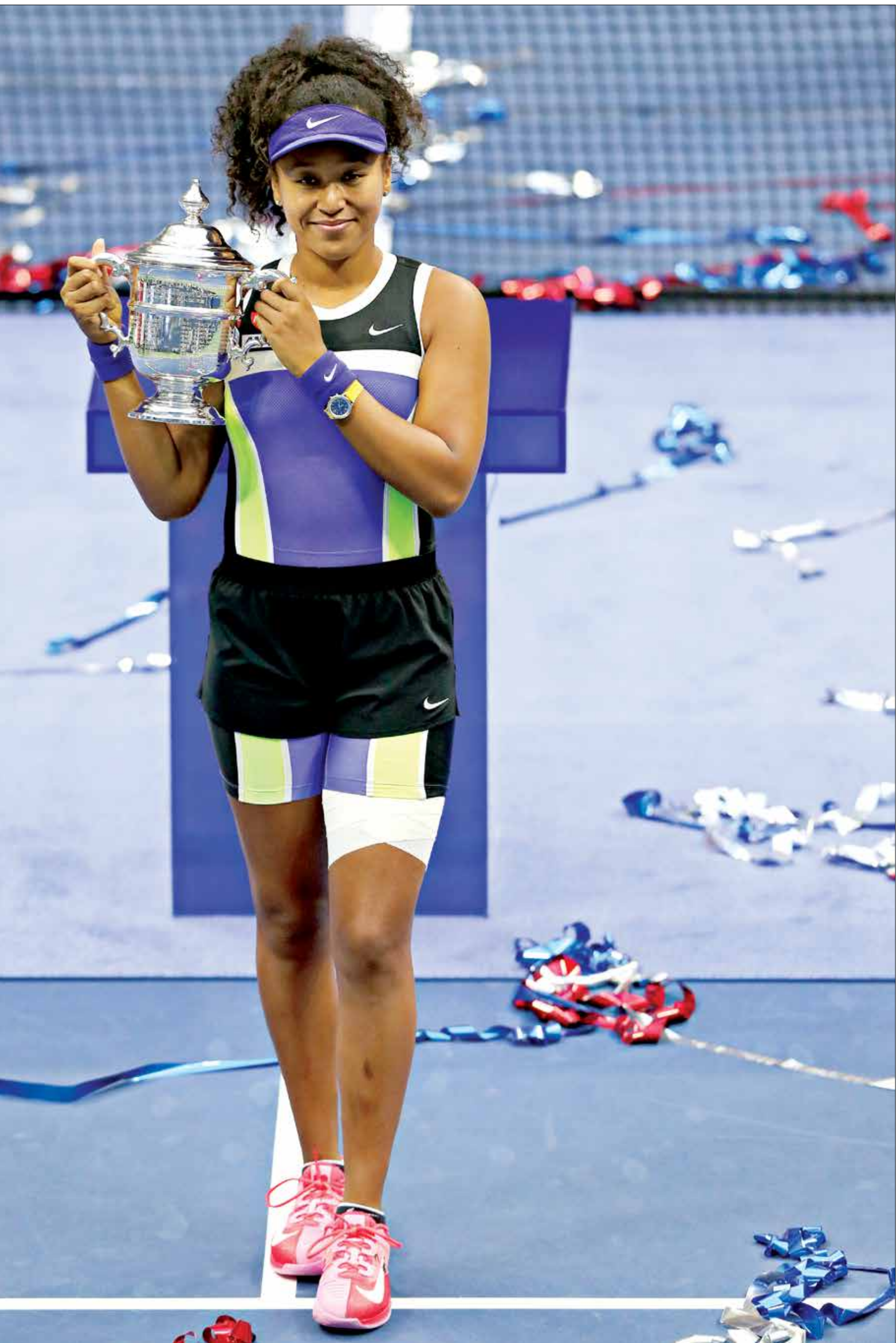
اوساكا حصدت اللقب الثاني في البطولة والتاسع عالمياً