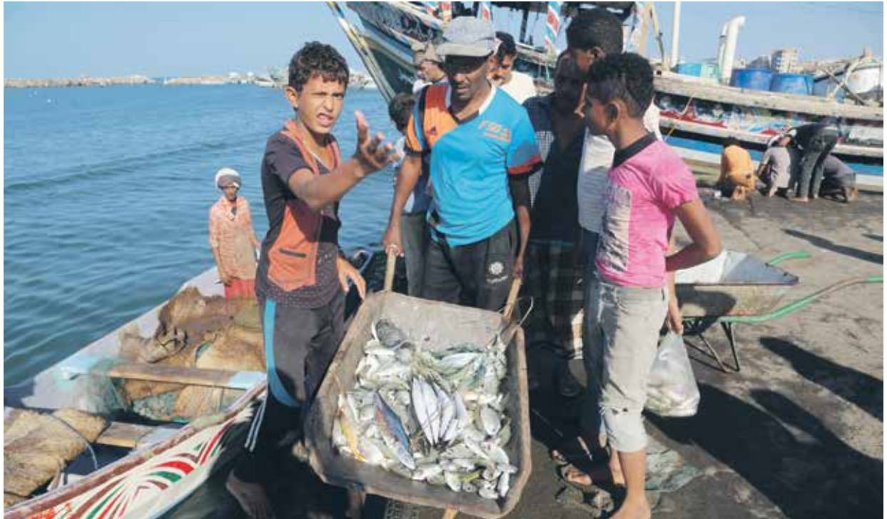
خسرال صاخذة للصيادين

وتواصل حملة التوعية والتحذيرات المحلية والدولية من وضعية الناقله المتهالكة التي تحتوي على نحو مليون ومئتي ألف برميل من الوقود، إلى حوالي 150 ألف طن مخزنة في عرض البحر منذ مارس/ آذار 2015، إذ