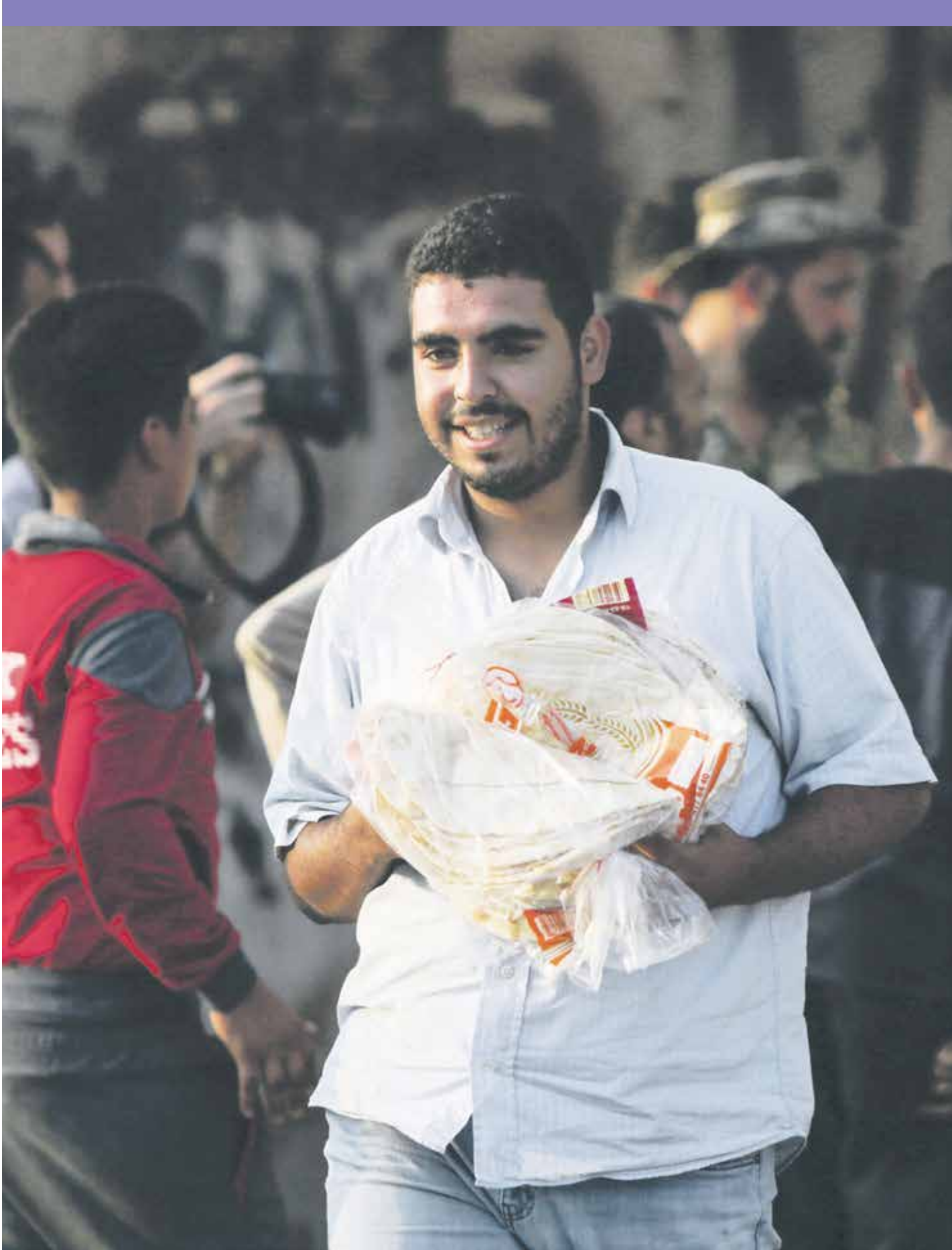
قفزة فء السعر الخبز