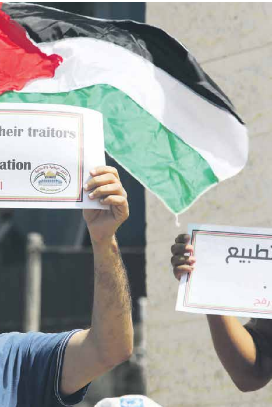
من حركة فتح غزة ضد التطبيع (بعد الرحيم الخطيب) (اليمين)

دعت القيادة الشعبية للمقاومة الشعبية لتظاهرات يوم غد