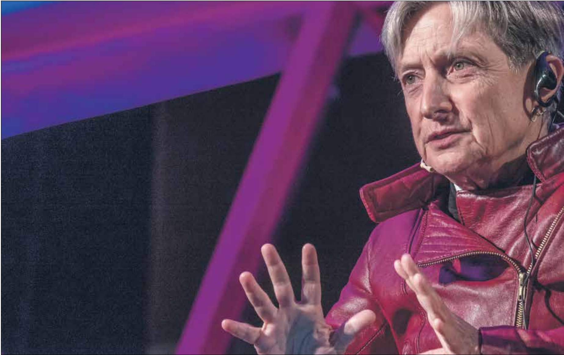
جوديث باتلر