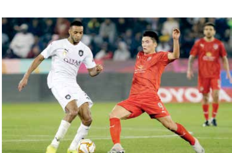
السد والحديد يسميان استعلاك عامل الأرض

غرب آسيا، عبر المباريات التي تقام في العاصمة القطرية الدوحة. وكان الاتحاد الآسيوي قد أسند تنظيم ما تبقى من البطولة لدولة قطر في ظل الصعوبات التي واجهها في إسناد المسابقة لدول أخرى، لتسحق الفرصة لتقطر لإتقاد البطولة في ظل قدرتها واستعدادها على استضافة