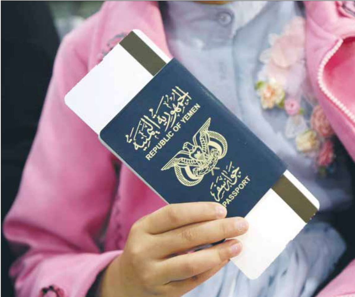
طفلة يمنية تحمل جواز سفرها في مطار صنعاء في إطار السفر لرحلة علاج برعاية الأمم المتحدة في 23/ 10/ 2020

الوطنية وفيها بين أبناء الوطن الواحد، نتيجة الأرتداد الكبير عن قيم ثورتي سبتمبر وأكتوبر. ولهذا شهد اليمن سلسلة حروب أهلية طاحنة، من حروب المناطق الوسطى على امتداد عقد الثمانينات، وصولاً إلى حرب صف 1994، وحرب صعدة، وأزمات الجنوب اليمني. وقد أرت كل هذه الأزمات إلى إصلاح مسار الثورتن، واستعادة مضمانيه (احلوله)، لصالح مسار الثورتن، واستعادة مضمانيه الوطنية اليمنية التي تم الانقلاب عليها، وكما يقول أمارتيا صن، عندما يبدأ الفرد بفقد الشعور بهويته، فإن الهوية الوطنية الحاكمة فتشلا ذريعا في تعزيز مفهوم الهوية