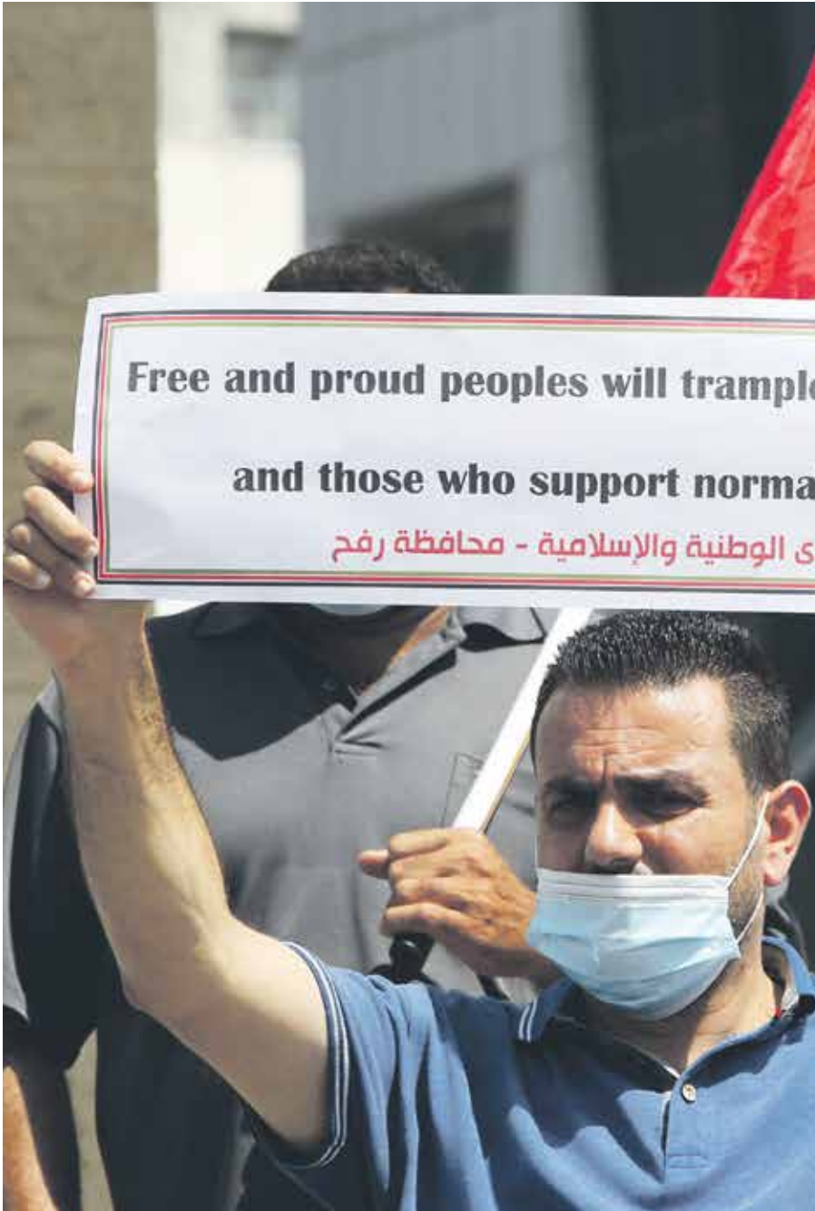
من حركة فتح غزة ضد التطبيع (بعد الرحيم الخطيب) (اليمين)

دخلة تقابل نواب اإقامة تحالفت اسلمة مقابل حياية» وأضاف خلال مؤتمر صحفي عقده افتراضيا عبر الإنترنت من رام الله، «إن من يعتقد أنه يدخل في حلف عسكري مع إسرائيل للسلام مقابل الحماية هو مخطي استراتيجييا». واعتبر تلك