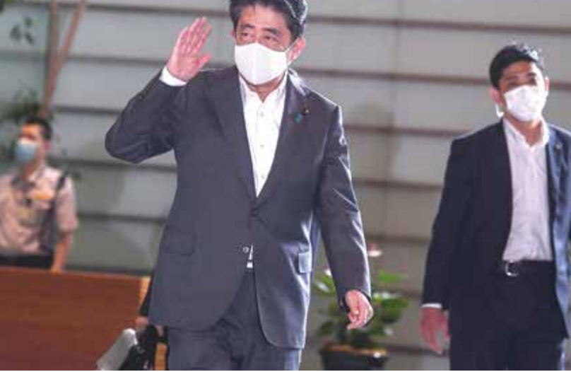
شينزو ابي يغادر منصبه لراثة الوراثة وسط ظروف اقتصادية حرجة

وتواجه الحكومة الجديدة التي ستخلف الزعيم ابي ثلاثة تحديات رئيسية، وهي معالجة تداعيات جائحة كورونا السلبية