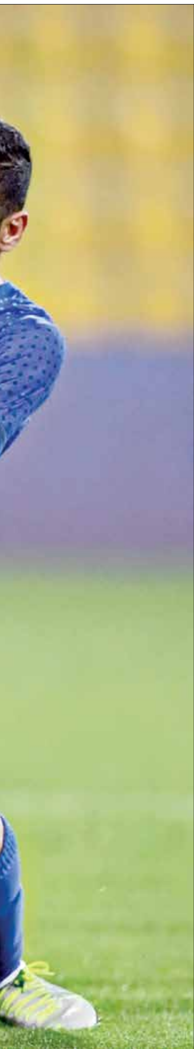
مواجهات مرتقبة في البطولة الآسيوية

القطري على استاد جاسم بن حمد، ويلي هذه المباراة لقاء سيبهاهان الإيراني مع النصر السعودي. وتخصمن معايير السلامة والصحة للمتفاسات إجراء جميع اللاعبين والحكام والمسؤولين فحص فيروس كورونا قبل المغادرة من بلدانهم، ثم بعد الوصول إلى قطر، على أن يتم إجراء فحوصات أخرى لكل ثلاثة إلى ستة أيام كما تم وضع جميع اللاعبين والحكام والمسؤولين في فقرة طبية محكمة، حيث يتم تعقيد حركة الجميع لتكون فقط ضمن الفنادق والملاعب