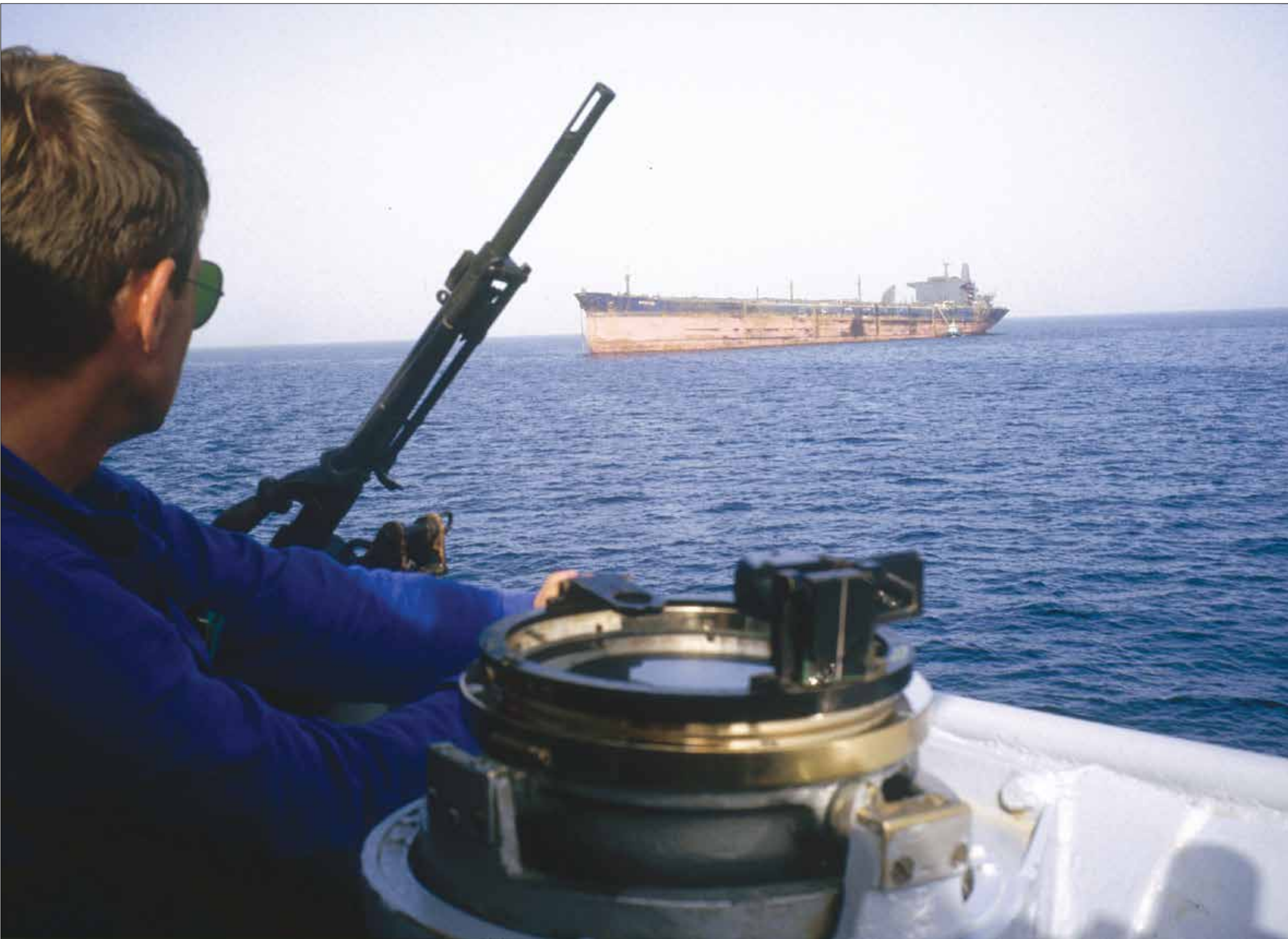
مصيف هرمز من الممرات المائية الخطرة في ممرات الزراع العالمي

وإن قل حجم استيرادها منه، إذ إنه جزء لا يتجزأ من المكونات التي تبني مكنة «دولة» عظمى، من حيث إنه يوفر لها وسيلة للنفط على دول العالم وتلبية احتياجاتها كحافئها في آسيا وأوروبا، وذلك إضافة إلى أنه غطاء مهم للعملة الأميركية، من حيث إنه يباع بالدولار، وبالتالي يرفع الطلب على الدولار في جميع الدول المستهلكة للطاقة ويمكن الولايات المتحدة توسيع ميزانيتها الدفاع والدين السيادي.