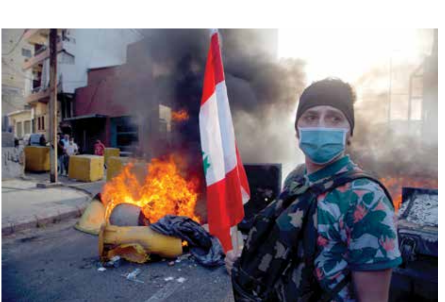
لشارع الكعك في 17 أكتوبر 2019 (حسين بيضون)

إن يعاني لبنان منذ نحو عام من أزمة اقتصادية طاحنة ترافقت مع انهيار غير مسبوق في