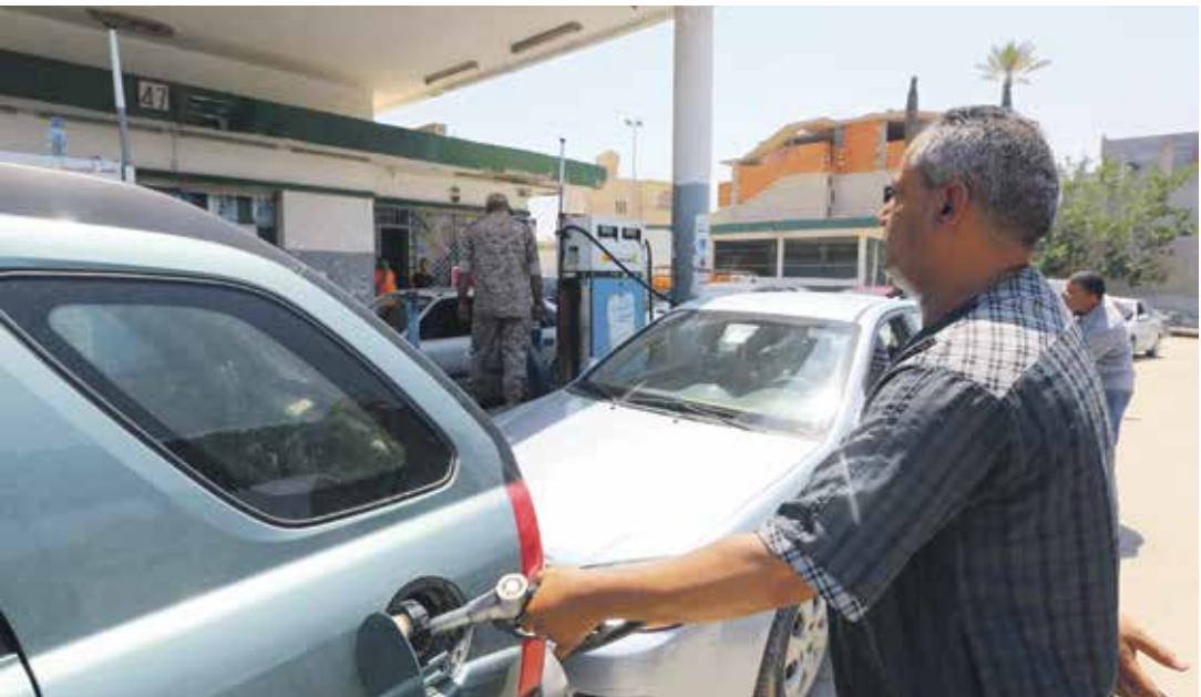
أزمة وقود خائفة

يضف الرجل الستيني بأن لديه 10 أبناء لا يستطيع راتبه الهزيل الذي لا يتعدى 850 ديناراً توفير أبسط مقومات الحياة، مشيراً إلى أنه يضطر إلى بيع صك مصري بقيمة ألف دينار الذي يحصل عليه من الدولة، مقابل 700 دينار نقداً للحصول على الكاش. ويدافع المستهلكون أمام محطات الوقود في العاصمة الليبية طرابلس منذ أسبوع، مع تدني كميات البنزين المتوافرة. المؤسسة الوطنية للنفط تؤكد أنها تبذل كل جهد ممكن لإيصال الوقود إلى كافة أنحاء ليبيا وإلى محطات توليد الكهرباء في مختلف أرجاء البلاد، على الرغم من إقبال مصافي النفط المحملة واستنزاف الخزائيات لاستيراد المحروقات خلال الفترة الماضية، وأوضح عبر بيان لها أن الإعراق غير القانوني للمحطات النفطية الخائبة للمؤسسة تسبب في العبت بالاقتصاد الليبي وعدم الأتقرات بالوضع المعيشي المزري الذي يعيشه كل مواطن في ليبيا اليوم بسبب هذا الإعراق.