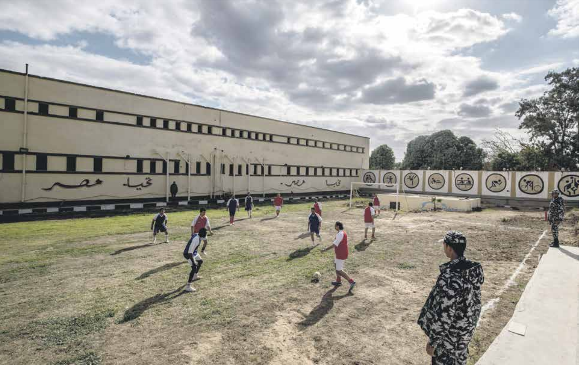
لحاول السلطات المصرية لتقديم صورة مختلفة عن واقع السجون (حادث دسومة)مراسل برس)

يناير، وأخضعته للتعذيب ثم أعادته إلى الشراة الأولى للثورة، التي انطلقت يوم 25 يناير 2011. وادعت قسم شرطة المنبى أنه هرب من المخبرين وأبلغ لفاقة مخدر «بانغو» ومات نتيجة الخنق بينما أثبت تقرير الطب الشرعي الذي طلبته الشرطة أن وفاته بعد الوفاة مباشرة وجود كسر في الفك وتزول في عظام الوجه، «تحصم للجمحة»، إضافة إلى رضوخ وكدمات في الوجه وإصابات متعددة في الوجه وبعض أجزاء الجسم، وسقوط الإنسان نتيجة تلقى