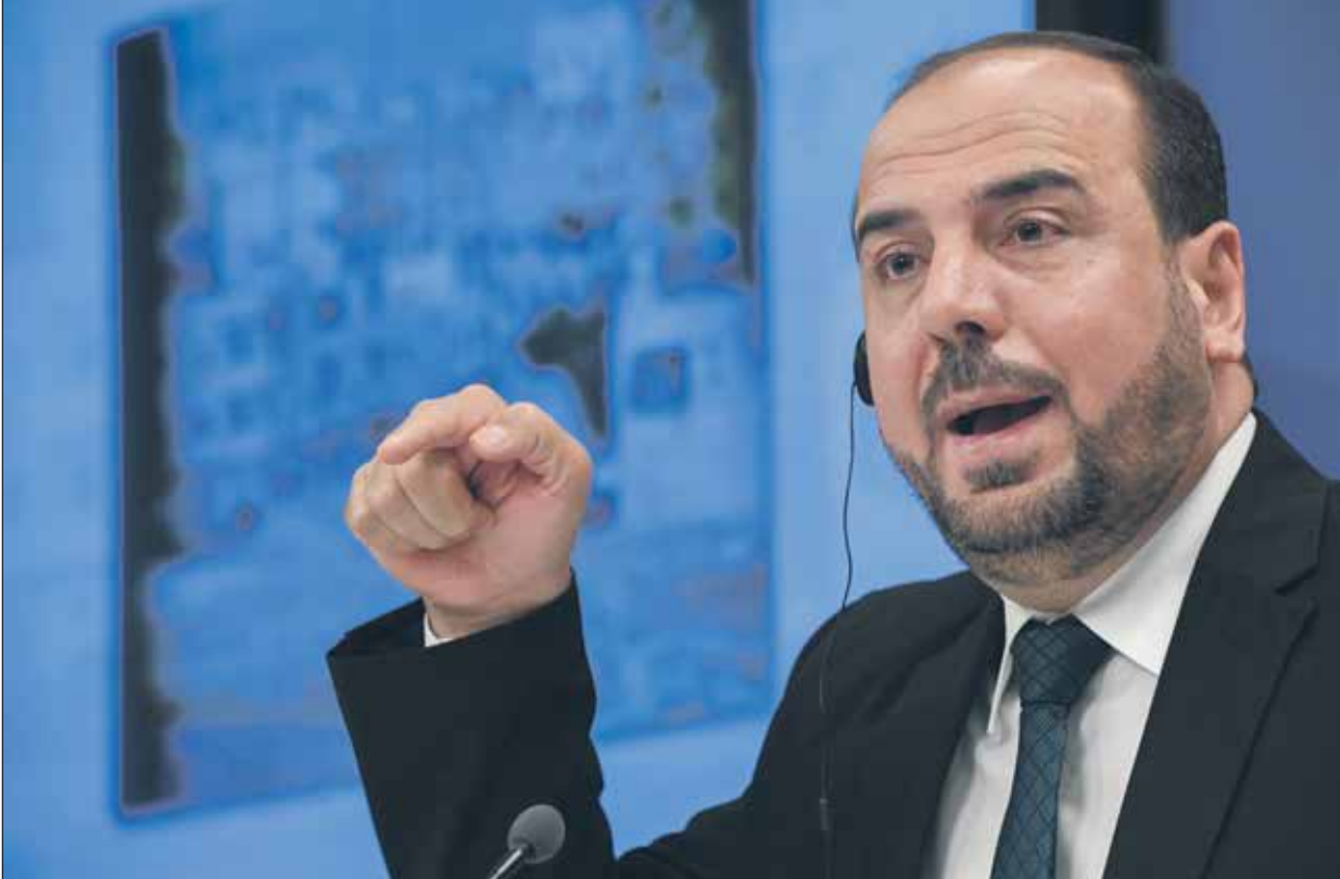
الائتلاف في يوليو الماضي نصر الحريري ريسا له

في آخر المستجدات الميدانية والسياسية»، والإطلاع على خطة تنفيذها الهيئة الرئاسية الجديد للائتلاف وتحسين واقع السوريين، وتعزيز التواصل مع مكونات المعارضة السوري، والتأكيد على التنشيطية مع الأحزاب والتيارات السياسية السورية في الوصول لرؤية سياسية مشتركة للحل في سورية»، وكان الائتلاف قد اتخَب في يوليو/تموز الماضي نجسا جديدا، هو نصر الحريري الذي أُنشأ للائتلاف لدعمه وإقناع السوريين، وتعزيز التواصل مع مكونات المعارضة السوري، والتأكيد على التنشيطية مع الأحزاب والتيارات السياسية السورية في الوصول لرؤية سياسية مشتركة للحل في سورية»، وكان الائتلاف قد ضم خلال العام الحالي مكونات سياسية إلى صفوفه منها «اربطة الكرد المستقلين» في محاولة لتوسيع دائرة التمثيل الكردي، إضافة إلى «مسلس