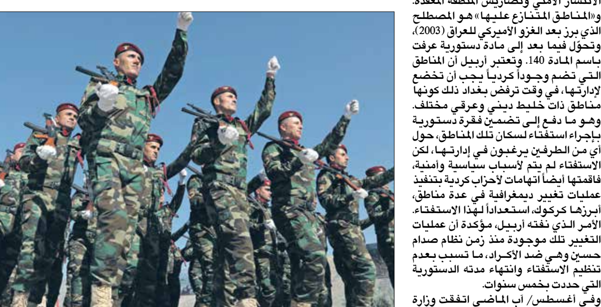
التزمك رفضوه بقيادة عودة البشمركة

بدفع امركي من خلال مظلة التحالف الدولي، تتواصل مباحثات الجيش العراقي مع قوات البشمركة التابعة لحكومة إقليم كردستان العراق، بهدف إتمام مشروع تدشين مراكز عسكرية وأمنية تنسيقية في المناطق المتنازع على إدارتها بين بغداد وأربيل والتي تبلغ مساحتها أكثر من 28 ألف كيلومتر مربع، فعلى شريط يمتد على طول محافظات نينوى وكركوك وصلاح الدين وديالى، تنسّب عدم التفاهم الأمني بين الجانبين على الائتثار فيها في إيجاد بيئة مناسبة لوجود تنظيم «اعش» مستغلا قلة الانتشار الأمني وتضارب المنطقة المعقدة، «والمناطق المتنازع عليها» هو المصطلح الذي يبرز بعد الغزو الأميركي للعراق (2003)، وتحوّل قفعا بعد إلى مادة دستورية عرف باسم المادة 140، وتعبر أربيل أن المناطق التي تضم وجوها كرديا يجب أن تخضع لإدارتها، في وقت ترفض بغداد ذلك كونها مناطق ذات خليط ديني وعرقي مختلف، وهو ما دفع إلى تضمين فقرة دستورية بإجراء استفتاء لسكان تلك المناطق، حول أي من الطرفين يرغبون في إدارتها، لكن الاستفتاء لم يتم لأسباب سياسية وأمنية، إمكانية لإصلاح الائتلاف، مفصلا الأسباب بالقول: «لميسب هناك ارادة لدى اعضاء الائتلاف للقيام بالإصلاح الضروري» وأشار إلى أن من بين الأسباب «عدم التحمل بمؤسسات المعارضة من قبل الدول المحليفة»، مشيراً إلى «أن هناك ضغفا على ثقافة الشفافية والإصلاح الإداري داخل مؤسسات المعارضة عموما والائتلاف في وجه الخصوص، لا سيما بين اعضاءه القبايدين».