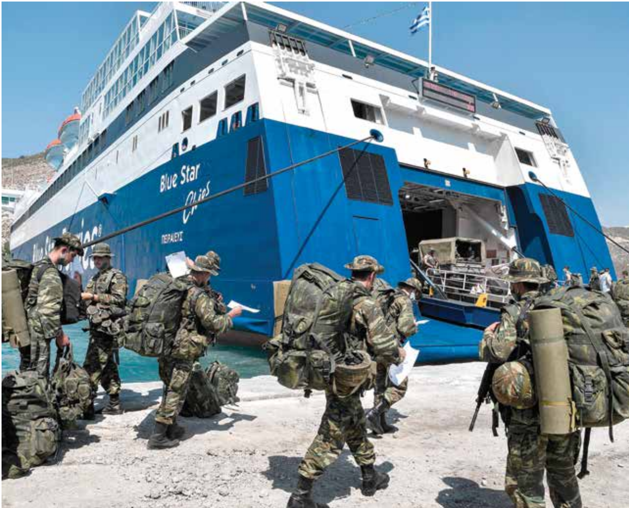
إنقذت إنقرة برنامج التسليح اليوناني

عادت سفينة التنقيب التركية «الريس عروج» إلى أنطاليا