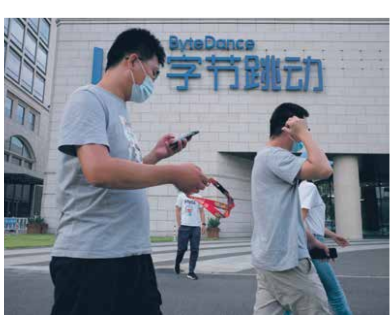
ايام شركة «باي بانس» ملكة تطبيـق «باي بانس» في بيكينـج (المناطق وونغ Getty)

للإضافة، كانت الصين في الأخرى قد تدزعت، منذ عدة سنوات، لحماية الأمن الوطني الصيني، لحظر استعمال مواقع الإنترنت الأميركية واسعة الانتشار في الإحترام، مثل غوغل وفيسبوك، والبرامج والتطبيقات المرتبطة بهما، مثل ويندوز وماستنجر، وإستغرام، وهذه كلها لا تساعدها الصينيون، ولا يمكن الدخول إليها بطريقة شرعية في الصين، لكن الصين أخذت خطوات خاصة بتحويل الإنترنت شبكة«نظيفة»من الحضور