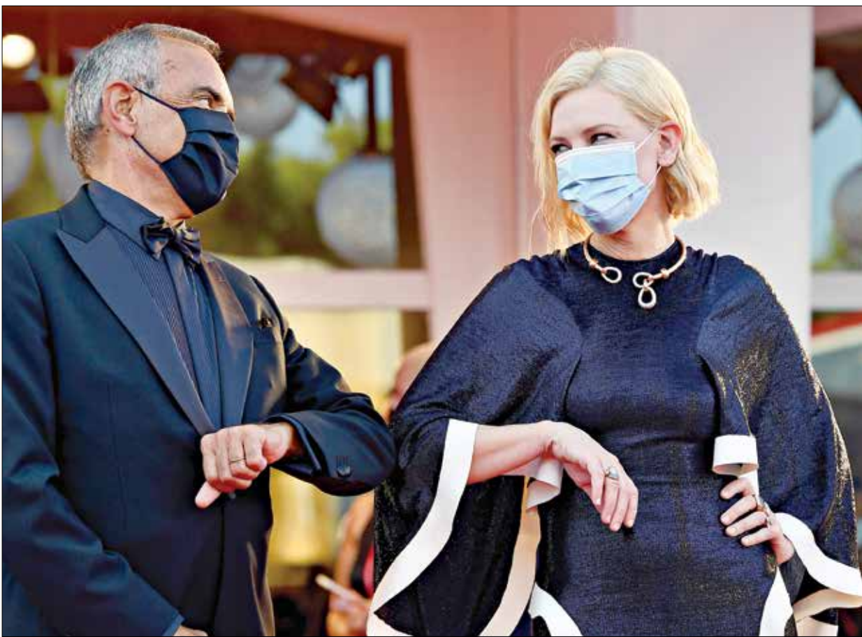
كايت بالاشيت والبرينو باريرا في افتتاح «موسرا» 2020، (إزيلا هاب/فريانس برني/ Getty)

«الحارث» (2020) لمحمد نادر (تمثيل احمد الغبشاي وباسم بن رئيس) ينضم إلى تلك الأفلام، توافرت له عوامل منطوية لصنع فيلم جيد، أو مقبول على الأقل، لكن النتيجة كارثية، بالكاد. الفيلم المعروف حصرياً على منصة «ساهد»، ثاني الأفلام المصرية المقدّمة إلى الجمهور عبر شبكة «انترنت» مباشرة، بعد