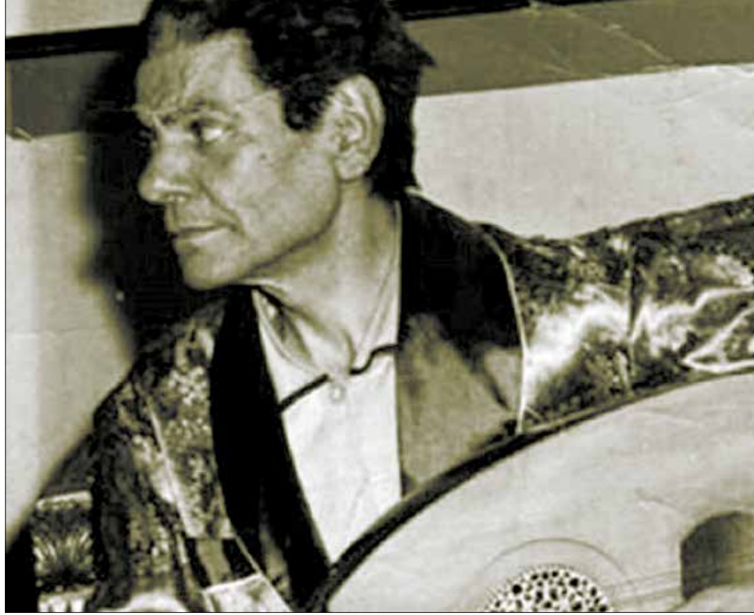
في سنة 1935 كان أول لقاء عملي بين السنباطي وأم كلثوم مع أغنية «على بلد المحبوب» (فيسبوك)

ترك رياض السنباطي خلفه مكتبة موسيقية ضخمة، لا تزال بصمتها حاضرة في العالم العربي، إذ بلغ عدد مؤلفاته الغنائية 539 عملاً، كما أنه ألف 38 قطعة موسيقية