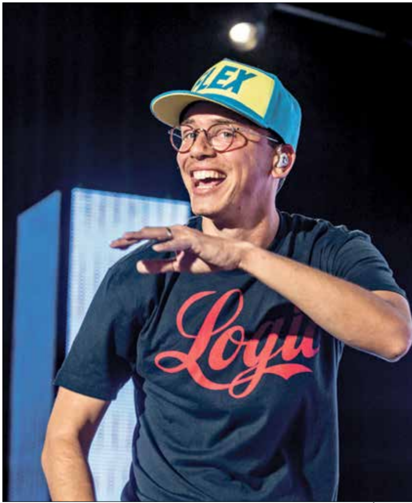
اليوم يضخ امكارا لادعة تقيم الحفام والاشكار اميريكية

تلاحظ في المسار الموضوعي للأغاني ازواجية على مستوى المقاطع الصوتية، إذ تسجّل أكثر من نسق إيقاعي في الأغنية الواحدة كماغنية A22 مع الحفاظ على إقحام أصوات أنخوية تقترن بالانحان، وتصبح جزءاً منها، وتسمح بمنح شعور