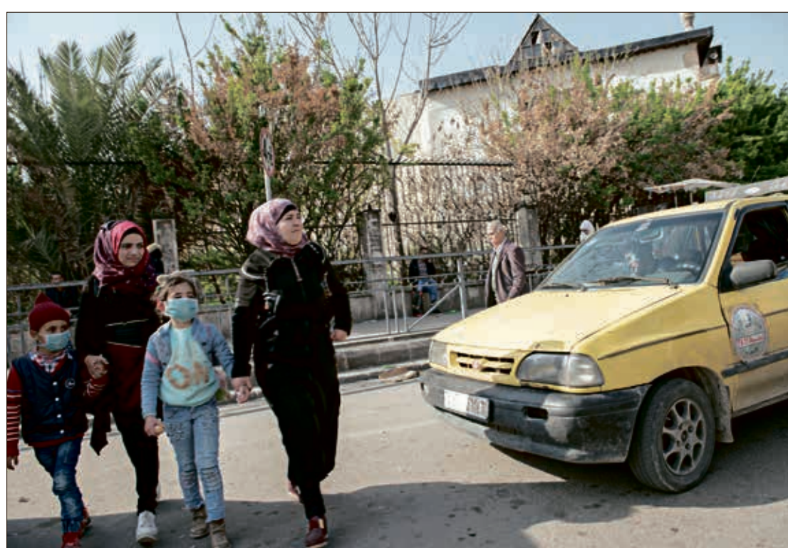
«حلول» تطرح الترفيه «مجاناً»

وفي بعض الحلقات، يقوم البرنامج بطرح حلول ليتمكن المشاهد المكتئب بواسطتها من الحصول على السعادة. ومنال على ذلك، حلقة تم تقديمها قبل أيام طرحت حلولاً للسوريين كي يُرفهوا عن أنفسهم من دون إنفاق أي نقود. وبعد تخمة المعلومات النظرية التي تؤكد أن السعادة والرفاهية لا ترتبطان بالمال، جاءت الحلول مثيرة للسخرية ولا يمكن تطبيقها على أرض الواقع، فاعتبروا أن مشاهدة التلفزيون هو أمر يسبب السعادة، وتناسوا أن سورية تعيش معظم وقتها من دون كهرباء، واعتبروا أن أفعالاً بسيطة كالأكل تسبب السعادة، وتناسوا أن مشكلة السوريين الكبرى في الوقت الحالي هي عجزهم عن تأمين قوتهم اليومي. وفي النهاية وصل المقدّمون للحل الأرخص والأفضل للحصول على السعادة، وهو النوم. وبعيداً عن السياق الذي ورد فيه هذا الحل، بدا كصورة فائقة تحزّل منهجية إعلام النظام السوري؛ فالإعلام الذي يسعى إلى تخدير الشعب وتجميده، ليس غريباً عنه أن يطلب من السوريين في برنامج «صباح الخير» أن يناموا لسعدوا. ومن الأمور الطريفة أيضاً، أن البرنامج يُقدّم في جميع الأيام بالطريقة ذاتها، فلا فارق بين أيام العيد والأعياد الرسمية وغيرها؛ فكل أيام السوريين تبدأ بالاحتفالات على قناة «سما».