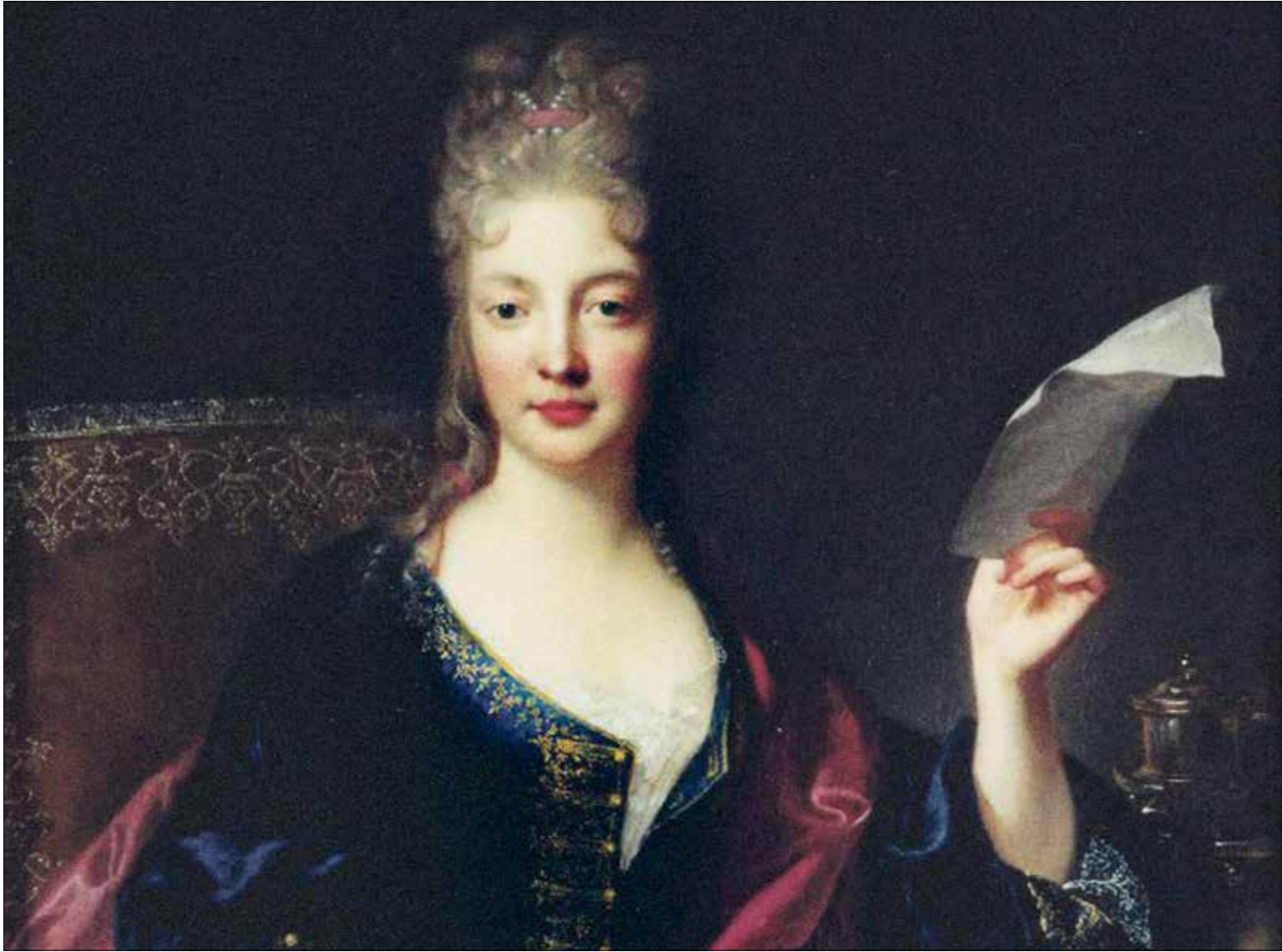
لصحت الازايك حاكمه دولاً غير كارهة الاسوة التي احترضت الحرف والتأليف الموسيقيين

لسنوات طويلة، لم تستسغ القاهرة دخول المنتج الخليجي متمثلاً بشركة «روتانا» أو غيرها من الشركات الخليجية، إلى إنتاجها الفني وخلال سنوات، لم يظهر أي عداء أو خلاف بين الشركة وبين صاحبة «الكلب تعمد» في المجال، لا تتدخل الشركة بانتاجات انغام، بحسب المعلومات نفسها، بخلاف أن يأتي البعض، وكذلك بالنسبة لحفلاتها الخليجية التي تفضل المنضات العربية على إجراءات