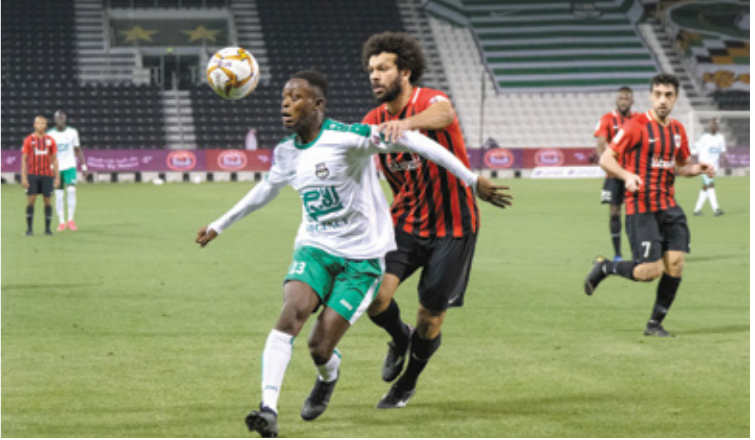
يردد الريان ملاحظة الحديك بجذوه للترتيب