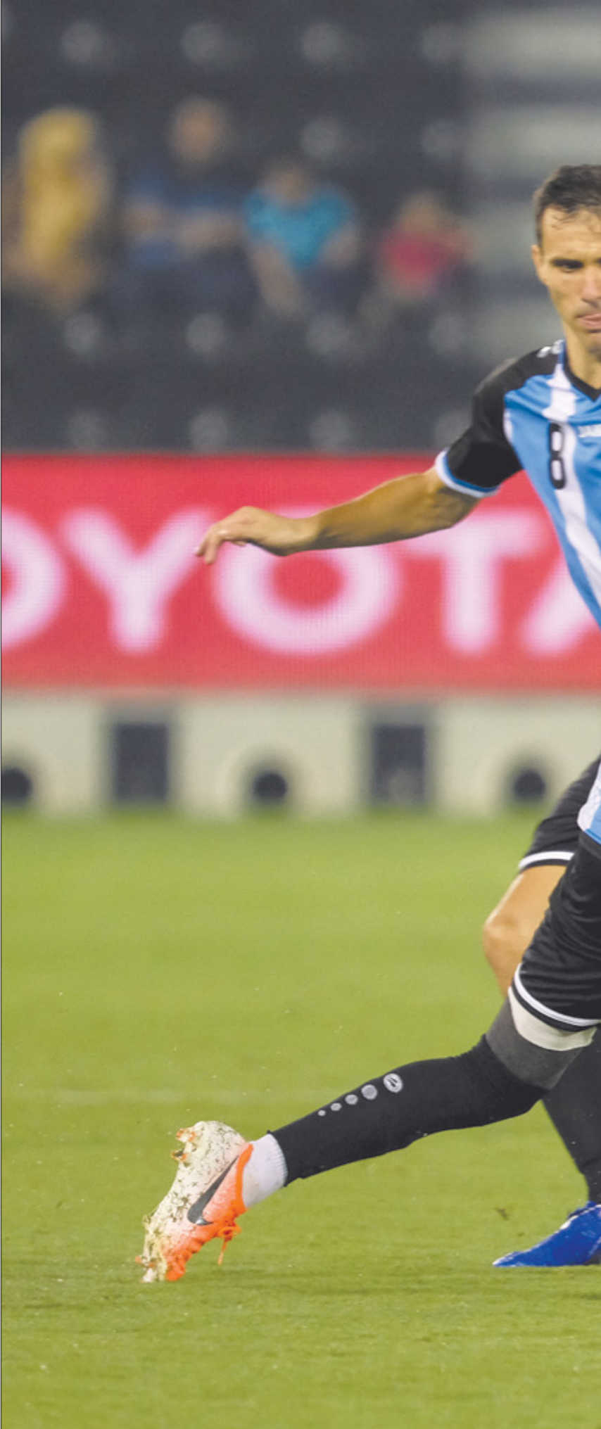
يتحجم الوكرة لتحليف لثالل جديدة دوري نجوم قطر

بين الزمالك والأهلي في مباراةين مؤجلتين من المرحلة الخامسة عشرة، على أن يلعب الأهلي مع إثني في الخامسة عشرة في مباراة مؤجلة من المرحلة الخامسة عشرة على ملعب القاهرة