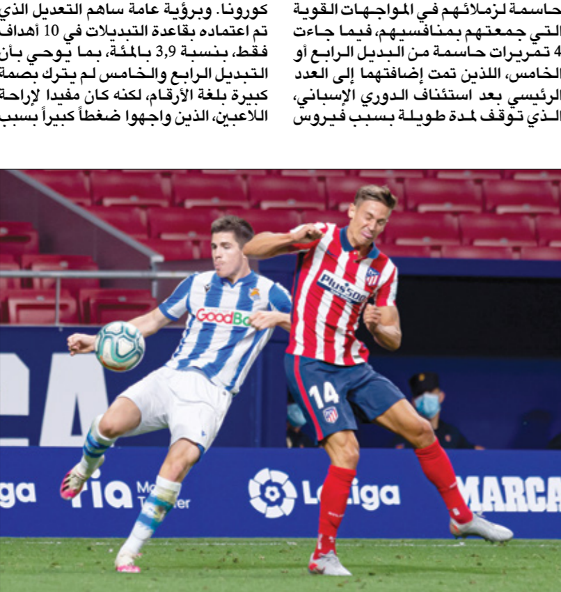
الدوري الإسباني حسمه الريال

وتشير الأرقام إلى أن 35 هدفاً من إجمالي 257 هدفا جاءت بين الدقيقتين 31 و45 (بنسبة 14 بالمئة)، مقابل 66 هدفاً بين الدقيقتين 75 و90 (بنسبة 26 بالمئة)، استطاع نجوم الدوري الإسباني تسجيلها في الموسم الماضي، الذي انتهى بتفويض ريال مدريد بالنق للمرة الـ34 في تاريخه. ويشكل عام جواد 40 بالمئة من الأهداف بعد الاستراحة القصيرة، لكن النسبة كانت مماثلة تقريبا قبل عصر فيروس كورونا، حيث كانت تأتي 16 بالمئة من الأهداف بين الدقيقتين 31 و45، و24 بالمئة من الأهداف بين الدقيقتين 75 و90، ولا يبدو أن هذه المستجدات أحدثت تغييرا كبيرا على أرض الملعب، لكنها كانت مفيدة لافتعارات بديلة وصحيحة لفترة مؤقتة، ولا توجد نية على الأرجح للإبقاء عليها مستقبلا في الدوريات الكبرى، التي تستعد فيها بعض الأندية للعودة المقبل، فيما تواصل الأخرى العمل على إنهاء المسابقات المحلية.