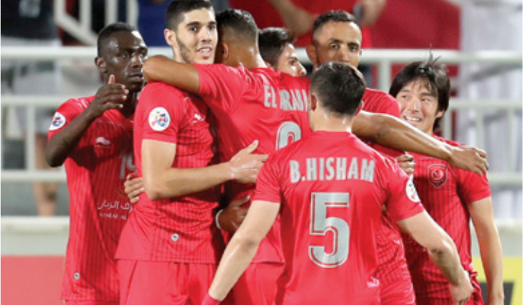
يلعب نادي الحديك على عدد من نجومه للحدد الالف كبحم فرانس برسن

الدوحة . العريبي الجديد ترقب الجماهير الرياضية عودة منافسات دوري نجوم قطر مساء اليوم الجمعة، بعدما توقفت المواجهات الحالية، نتيجة تفشي فيروس كورونا، الذي تحول إلى وباء عالمي، عقب ارتفاع عدد حالات الوفيات والمصابين به. وقبل انطلاق الصافرة الرسمية التي ستعلن عودة دوري نجوم قطر مرة أخرى، قامت الأندية المشاركة بالمسابقة المحلية، بالعمل بشكل جدي عبر برامجها الإعدادية المكثفة، وخوض مواجهات ودية قوية، كي تلقط قطر، استعداداته لعودة المنافسات، بالفوز