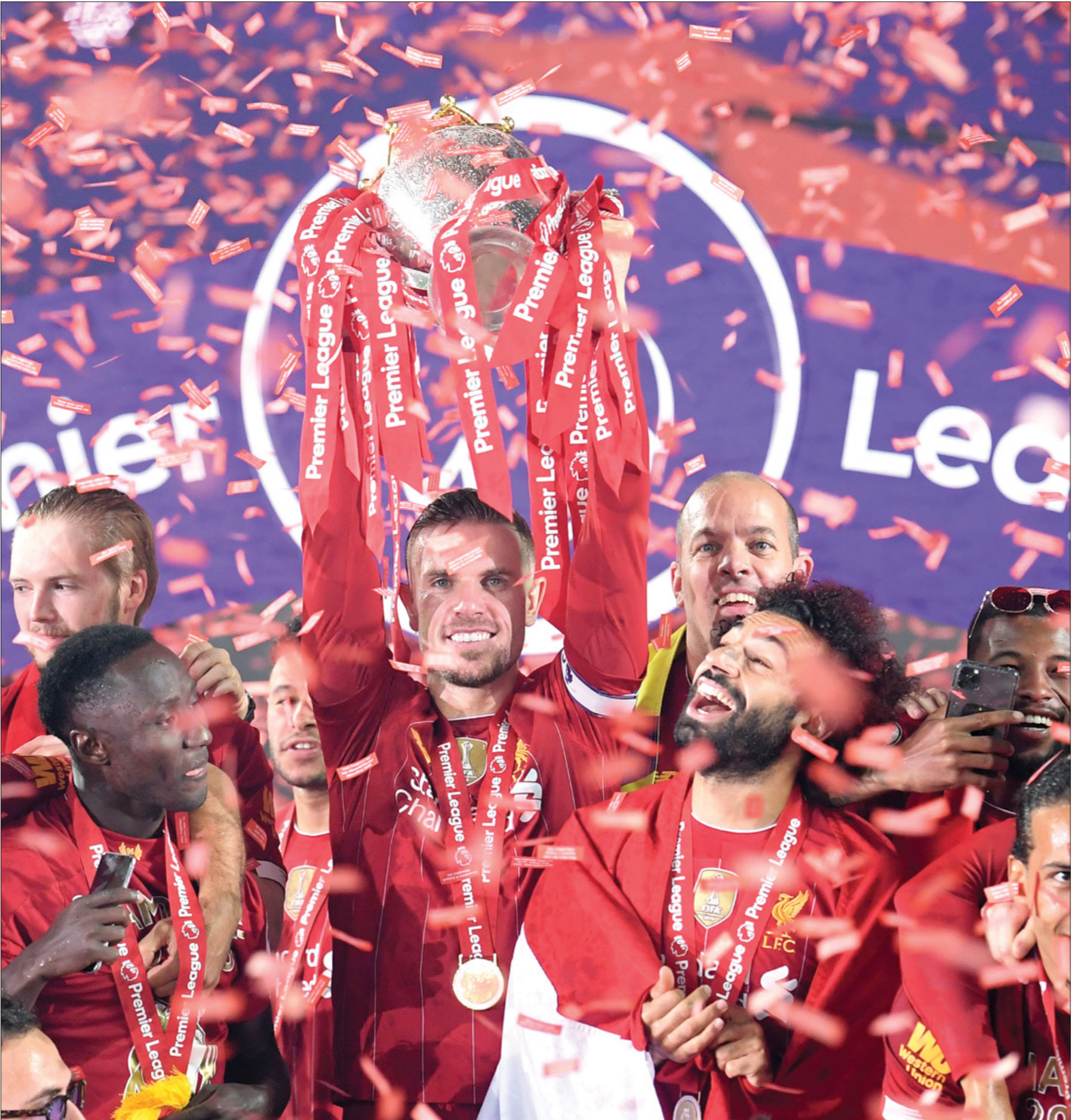
ليفربول يرفع الكاس «البريميرليغ» لأول مرة (الروس) غريمشي

بوعده الذي قطعه على نفسه امام جماهير «الريدز» المتعطشة للانقلاب، بقوله «أريد أن ننشئ تاريخنا الخاص في ليفربول»، بعد أن اهداهم لقب الدوري الإنكليزي، وتفوق على منافسه مانشستر سيتي، من دون لقب «البريميرليغ» الذي انتظرته الجماهير لمدة 30 عاماً، وأوفى المدرب يورغن كلوب