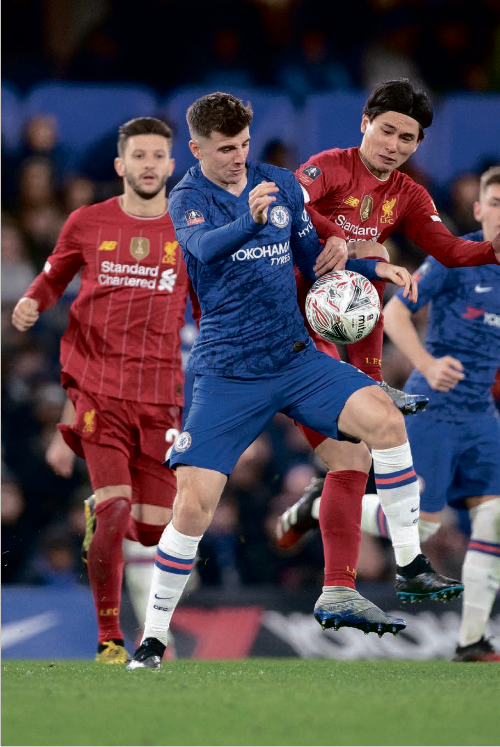
هك يُسقط تشيلسي البطل مرة ثانية في أقل من 10 أيام

تشهد الجولة ما قبل الأخيرة من منافسات الدوري الإنجليزي لكرة القدم قمة منتظرة بين ليفربول وتشيلسي على ملعب «أنفيلد». وفي وقت يُعتبر اللقاء شكلياً لفريق «الريدز» لأن اللقب حسم مسبقاً، إلا أن المواجهة في غاية الأهمية لفريق «البلوز» الذي يسعى لضمان مقعد مؤهل إلى دوري أبطال أوروبا الموسم المقبل في ظل منافسة شرسة من مانشستر يونايتد وليستر سيتي.