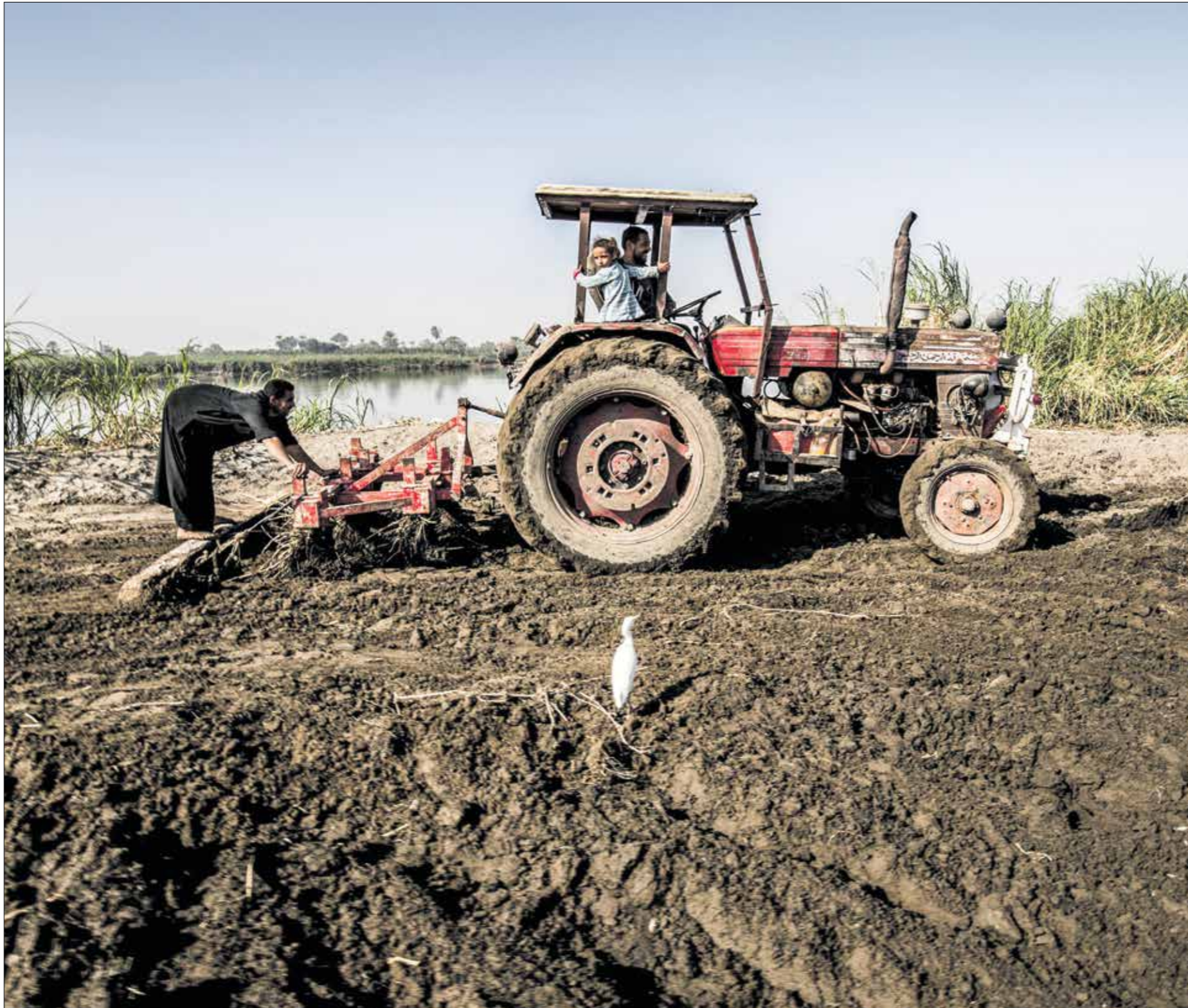
توضعات بحسرة مصر 200 ألف فدان (رامح) تحاد دكوهف/مارس برس)

ويقر مسؤول عراقي في مكتب رئيس الوزراء مصطفى الكاظمي، بوجود ما سناه