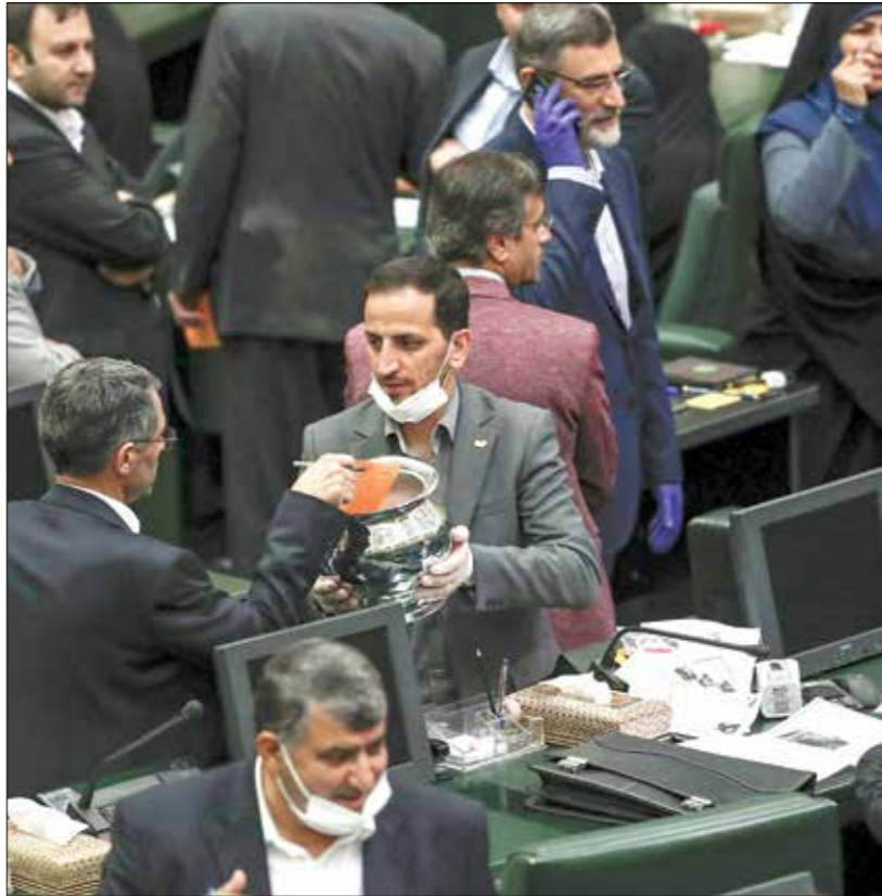
يكون ملووع القانون النووي من مادة واحدة

وكان من المقرر أن تبدأ محادثات السلام الأفغانية - الأفغانية في مطلع مارس/ آذار الماضي، لكنها تأخّلت مراراً وسط اتهامات ل«طالبان» بزيادة وتيرة العنف، وتعتز صفقة تبادل السجناء والأسرى بين كابول والحركة، ومن المتوقع أن تستضيف العاصمة القطرية الدوحة هذه المحادثات. إطار نطاق ضمانات الوكالة فقط.» وبحسب