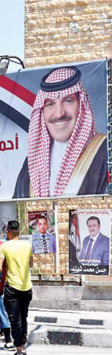
لترشح 2100 شخص 2500 فصدا برلمانيا

مع مجلس الشعب وانتخاباته»، وفق مصدر محلي في دمشق، أشار إلى أن «الشراع السوري، سواء كان مؤيداً أو معارضاً، متفق على أن هذا المجلس لا يملك من أمره شيئاً في دولة تحكمها الأجهزة الأمنية». ونقلت وكالة «سانا» الرسمية التابعة للنظام عن وإدلب (الخارجين عن سيطرة النظام) في أماكن تجمع أهالي المحافظين خارج نطاق المنطقتين في بعض المحافظات الأخرى لتسهيل عملية الانتخاب من دون أن ينقلوا إلى محافظاتهم بينما لن تشهد منطقة شرقي نهر الفرات الخاضعة أغلبها لدقوات سورية الديمقراطية» (قسد) إجراء انتخابات، باستثناء مرتعين أمينيين وبعض القرى في مدينتي الحسكة والغامقلبي التي تسيطر عليها قوات النظام. ويبلغ عدد أعضاء مجلس الشعب 250 عضواً عن كل المحافظات السورية، وتوزعون ما بين قطاع العمال والفلاحين، وقطاع «باقية قطاع الشعب»، وفق التوصيف المعتد من النظام السوري، ويبنّت مصادر