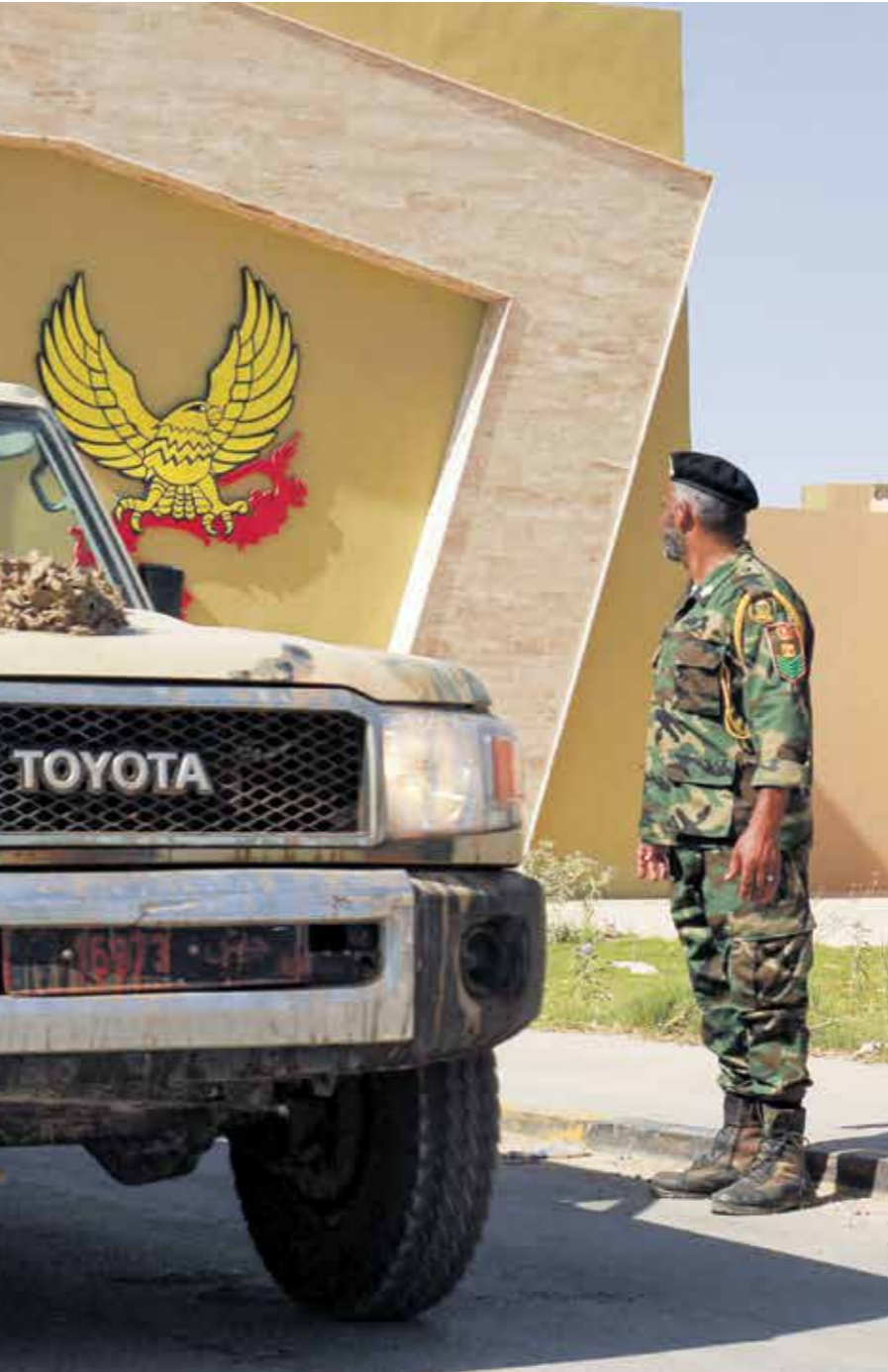
لا لتوقف ميليشيات حطر عن الهجوم بالحسم (عبدالله جوه/فارس برس)

القاهرة بتوجيه ضربة ضد تركيا في ليبيا، وكشفت مصادر ليبية لـ«العربي الجديد» عن ضغوط أميركية لحل في منطقة الهلال النطصي، يجعلها خاصة لحماية دولية، على أن تتشكل فاصلاً بين طرفي النزاع في ليبيا، حكومة الوفاق ومعسكر شرق ليبيا، فيما يتم إطلاق مفاوضات سياسية واسعة في الشرق الأوسط، وحول ماهية وطبيعة التدخل الإماراتي في أزمة سد النهضة، ومدى تأثيره على موقف إثيوبيا، اكتفت المصادر بالقول إن «الوطني شددت على أن تدخلها سيكون مقتصر على خبراء الوقت ذاته إن القاهرة أكدت أنها لن تبادر باتخاذ أي خطوات عسكرية مباشرة طالما أنه لم يتم المساس بالخط الأحمر» الذي أعلنه الرئيس المصري عبد الفتاح السيسي في يونيو/حزيران الماضي، خلال لقائه قوات المنطقة الغربية في قاعدة سيدي براني العسكرية.