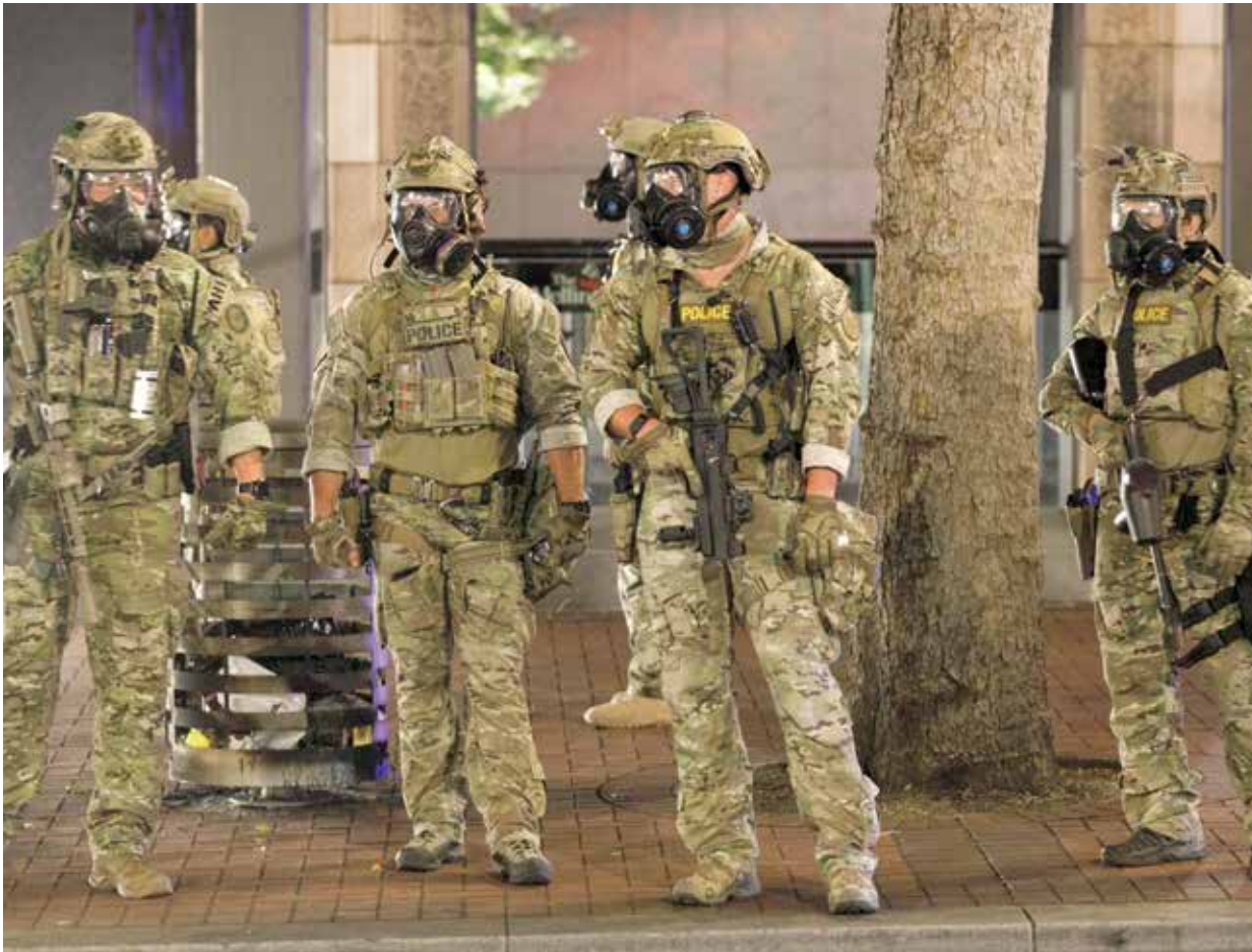
طالب المسؤولون في بورتلاند بسحب العناصر المدججين بالأسلحة