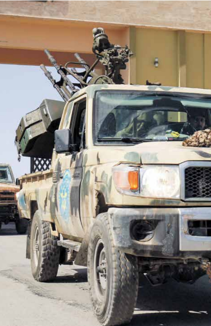
لا لتوقف ميليشيات حطر عن الهجوم بالحسم

مع تحركه لبدء تلقي أسماء الشخصيات المرشحة لخلافة رئيس الحكومة المستقل الياس الفخفاخ، يُطرح سؤال مهم حول مدى قدرة الرئيس التونسي قيس سعيد، على الاستفادة من أخطأ الماضي وتجنب البلاد خياراً فاشلاً آخر، من شأنه أن يفاقم الأزمة السياسية والاقتصادية والاجتماعية، وربما يقود إلى الجهول، وقام سعيد، صباح أول من أمس الجمعة، بعراشة الأزمات السياسية والاختلافات والكتل البرلمانية لتقديم مقترحاتهم ومرشحهم حول الشخصية التي سيتم تكليفها بتشكيل الحكومة الجديدة، في أول لا يتجاوز يوم الخميس المقبل، في 30 يوليو/تموز الحالي، وكان رئيس الجمهورية قد راسل البرلمان قبل ذلك لإبلاغه بقبوله استقالة الفخفاخ، ومطالبة السلطة التشريعية بتحديد توريح