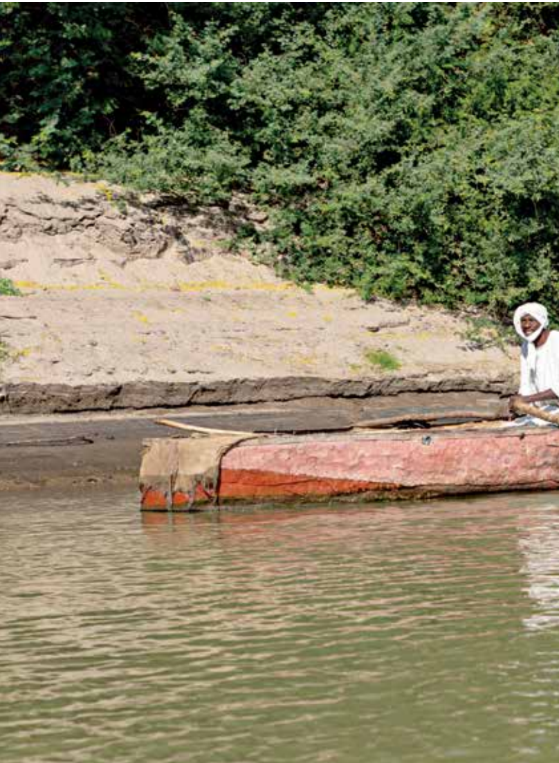
تحمي ليبيا أمن الملة حاليا لن يطر مصر والسودان

وقالت المصادر، لـ«العربي الجديد»، إن الخلافات نشبت بعد قرار «مستقبل وطن» الحصول على 40 مقعداً من أصل 100 مقعد مخصصة للنظام الحاكم المغلقة، وتوزيع المقاعد الأخرى بواقع 20 مقعداً لحزب الشعب الجمهوري، و6 مقاعد لـ«الوفد»، ومثلها لحزب خماة الوطن، و5 مقاعد