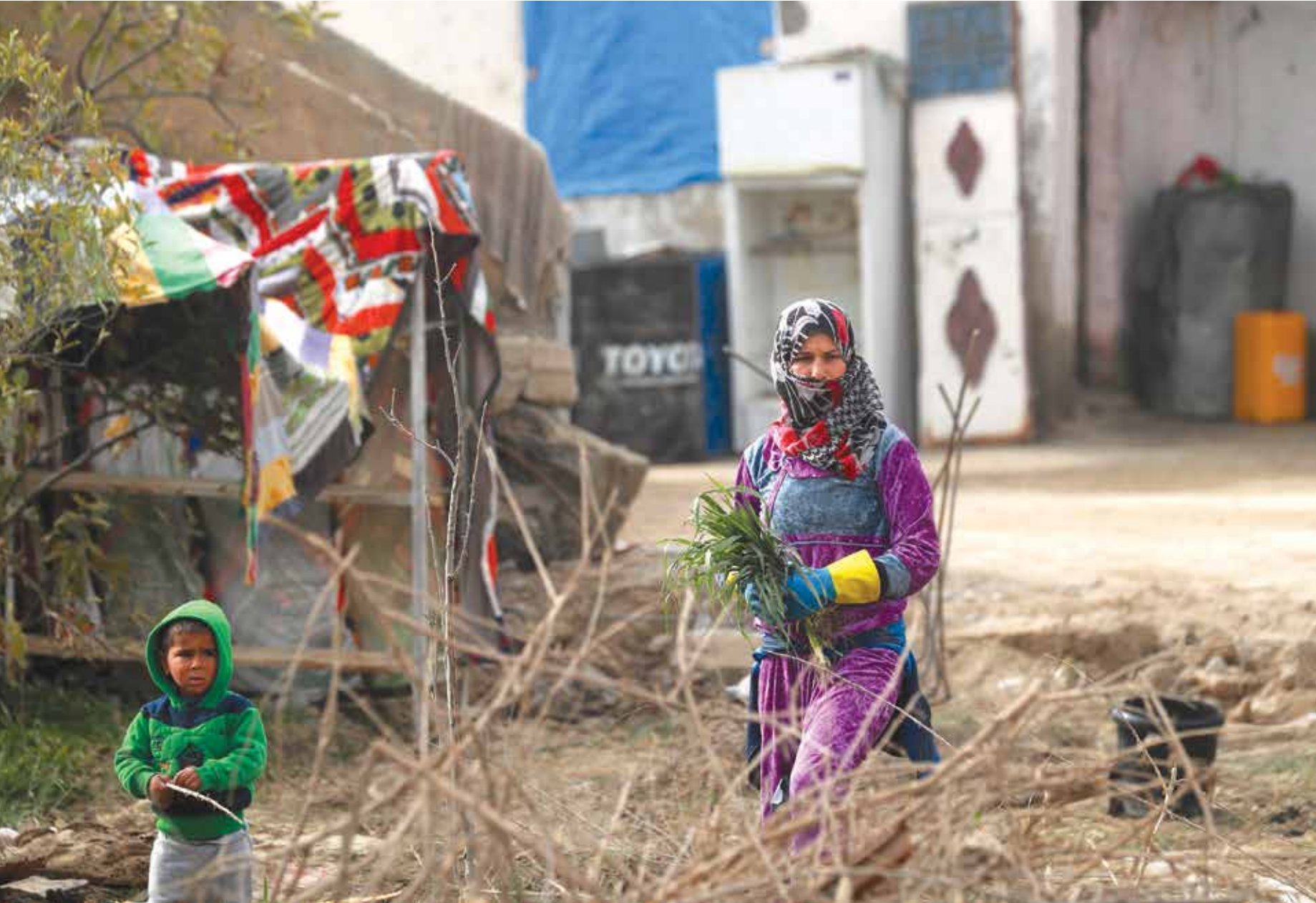
يعيلها،هك المحافظةطرما مصليةحالة (أحدك سياتفراس برس)

ومرت دير الزور بتحولات كبرى، حيث سطر «الجيش السوري الحر» على أغلبها في العام 2013، ثم انتزع تنظيم «اعاش» المحافظة، باستثناء قسم من مدينة دير الزور، ومطارها العسكري، والأسد ظل محاصراً من التنظيم لأكثر من عامين،