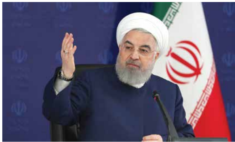
روحاني، إيران لم تلت لرضخ للوقوع (الناظر)

استمررا لسلسلة أحداث متشابهة وقعت أخيراً في مواقع إيرانية حساسة، اتهمت الخبريان سبيع سفن في حريق اندلع في مصنع للسفن والقوارب في ميناء بوشهر، جنوب البلاد، وذلك بعد ساعات من تأكيد الرئيس الإيراني حسن روحاني، في الذكرى الخامسة لتوصلت إلى سبب وقوع الحادث، من طهران ولم ترضخ للوقوع والضغط من جانب القوى العظمى، وتحديداً أمريكا». وقال المدير العام لمنظمة إدارة الأزمات الحكومية في محافظة بوشهر جيانجفر دهمقاني للتلغرافيون الإيراني، أمس الأربعاء،