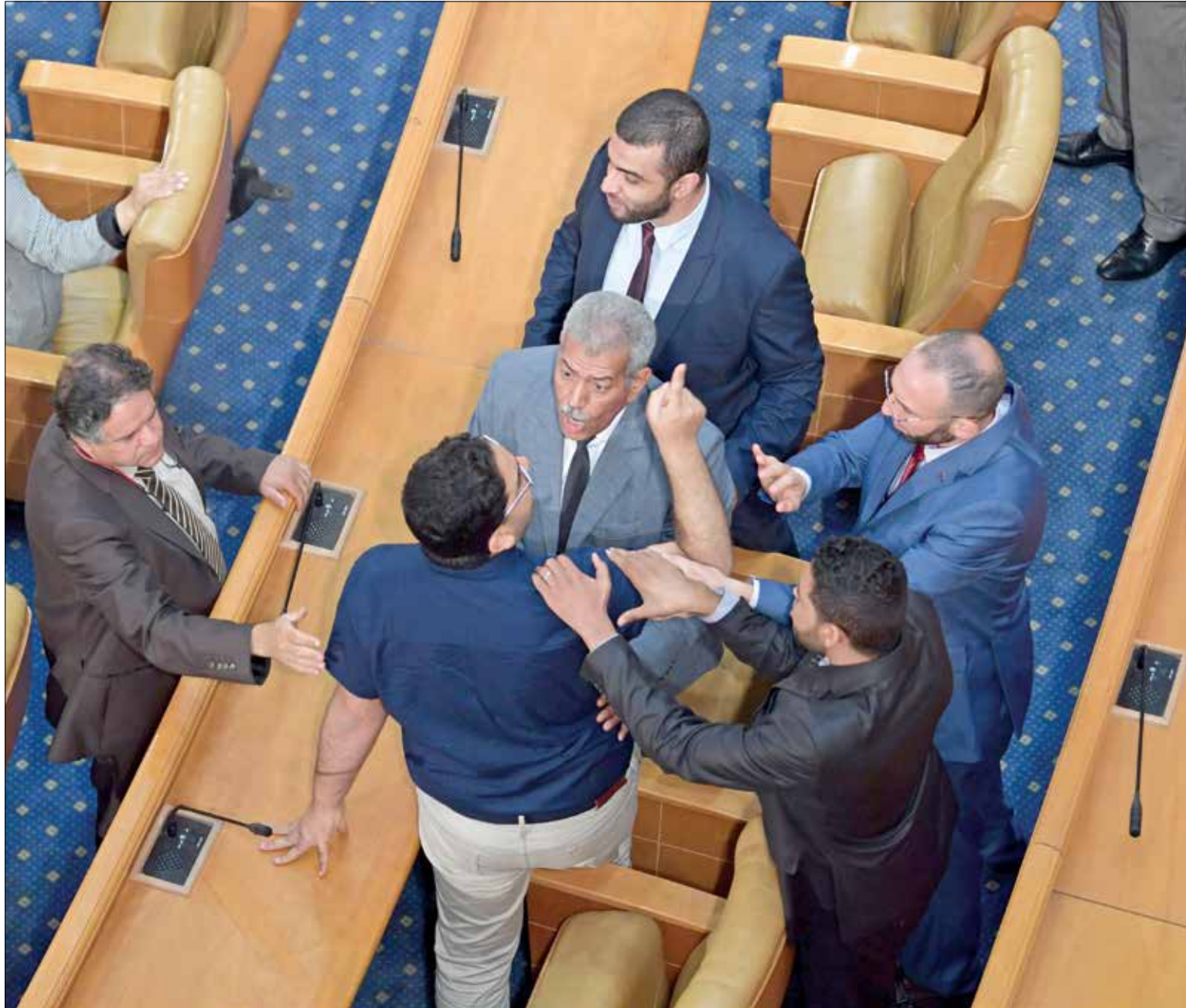
ينذر الوضع البرلماني المتشجج بفشل الجلسة الانتخابية