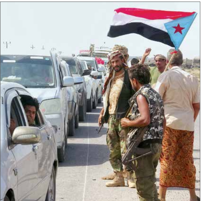
لجا «المجلس الانتقالي» للحزب ورفة الشارح

انخفت السعودية مجدداً في ردم الهوة بين الحكومة اليمنية الشرعية و«المجلس الانتقالي الجنوبي» لادعوم إماراتياً. «قطرت للعبان بطلان الدعامات التي حققتها طهران من خلال الاتفاق» «لا تزال قائمة»، مشيراً إلى إلغاء ستة قارات امنية ضدها وإخراجها من تحت الفصل السابع الأممي، ولتف إلى أن إيران عبر الاتفاق وحديداً أميركا، مستدداً على أنها «لم ولن تعزل»، وأشار روحاني في الذكرى الخامسة للتوقيع على الاتفاق النووي في 14 يوليو/تموز 2015، إلى أن واشنطن «شفتي» تصرفاتها السياسية والحقوقية خلال المقررات الدولية».