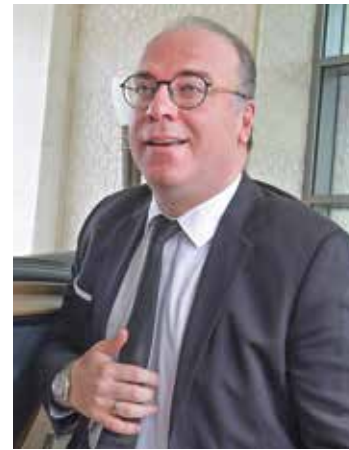
سعيد طلب من الفخفاخ تقديم استقالته

تتجه تونس نحو التعرف إلى رئيس حكومة جديد بدل إلياس الفخفاخ، الذي تتزايد التوقعات باقتراب تقديمه استقالته، وذلك بعد اقتراب حركة النهضة من الحصول على الأصوات اللازمة لإطاحته في البرلمان. وعشية انتخاب أعضاء المحكمة الدستورية، اليوم الخميس، اندلعت حرب لوائح برلمانية بين الأحزاب التونسية مع دعوة إحداهما لسحب الثقة من حكومة الفخفاخ، في حين تدعو أخرى إلى سحب الثقة من رئيس البرلمان راشد الغنوشي. ورجحت مصادر حزبية، لـ«العربي الجديد»، إمكانية استباق الفخفاخ إطاحته عبر البرلمان بتقديم استقالته طوعاً أو بطلب من الرئيس قيس سعيد، فيما أشارت إذاعة «موزاييك» الخاصة إلى أن سعيد طلب بالفعل من الفخفاخ، الثلاثاء الماضي، تقديم استقالته، فيما لم تعلن الرئاسة التونسية بعد موقفها الرسمي. ويحافظ سعيد في هذه الحالة على حقه الدستوري باختيار شخصية جديدة لرئاسة الحكومة، بينما سحب منه هذا الأمر لو سحب البرلمان الثقة من الفخفاخ، وأودعت حركة النهضة، أمس الأربعاء،