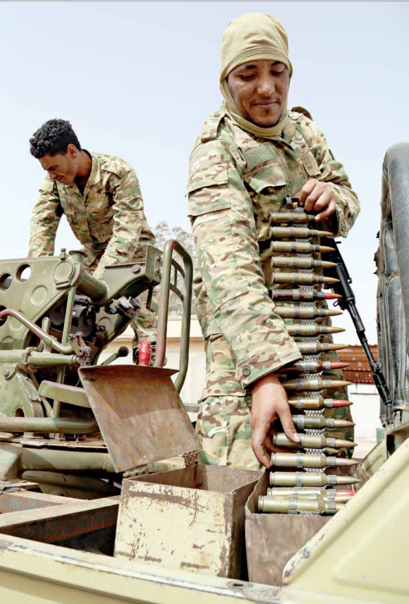
قوات الوفاق على تخوم سرت (من كتاب:الاضرب)

وأوضحت المصادر انه بالتوازي مع وصول تلك الوحدات، أعلنت المنطقة الغربية العسكرية في نفس حالة الاستقرار الغصوي، وتم في المرحج دخول تلك الوحدات عدد من الابات العسكرية ووحدات المدفعية