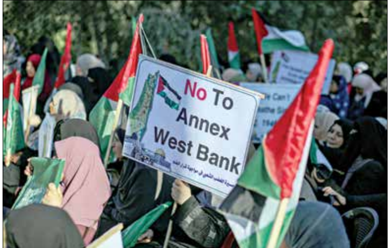
ذلك الظاهرة فيه مرة ضد الضم (من كتاب:الاضرب)

الحالية لم تتخل بعد عن خططها بالضم، ولا يزال تهديد الضم بلوح في اسرى سابقون، وتكررت الاعتقالات في عدة بلدات في محافظة (إم الله والبيرة في الأثناء، حثلت لجنة الأسيز للمقوى لكون الضم أمراً غير قانوني وانتهاكاً صارخاً لقرارات الأمم المتحدة ذات الصلة، واقترح منسوق تنظيم اجتماع اوروبي وأعضا في الكونغرس الأمريكي، للتأكيد على المفهوم الرضاه للضم وتحذير إسرائيل من مخاطر الضم.