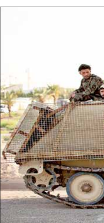
يحاول الكاظمي ضبط التصعيد الأمني والسياسي للمليشيات

بصواريخ الكاثوشيل على المنطقة الخضراء في العاصمة، في رسالة للأميركيين، تنهم تلك الفصائل بالوقوف وراءها. كما سُجّل أخيراً هجوم جنوبي العراق استهدف شاحنات أمتة من موائئ البصرة، تحمل مواد ومعدات لصالح القوات الأميركية، فضلاً عن حادثة اغتيال الباحث هشام الهاشمي، والتصعيد الإعلامي من قبل نحو 30 وسيلة إعلامية تمكّنها تلك الميليشيات ضد الكاظمي، واستخدمت هذه الوسائل لظهران في العراق من جهة، وبين الكاظمي الملحوقة للمليشيا «مصانف أهل الحق» وهي من أكبر الميلشيات الموالية لإيران في العراق، وصفت جهاز الاستخبارات الذي يترأسه الكاظمي بميلتيها «الاستخبارات»، كما وصفت تلك الوسائل الإعلامية القوات التي فضت تقاطعات السفيرين من قانون «رفحاء» في العراق، بانها «قوات الكاظمي»، ما أكد عمق الخلافات بين الطرفين، وبحسب