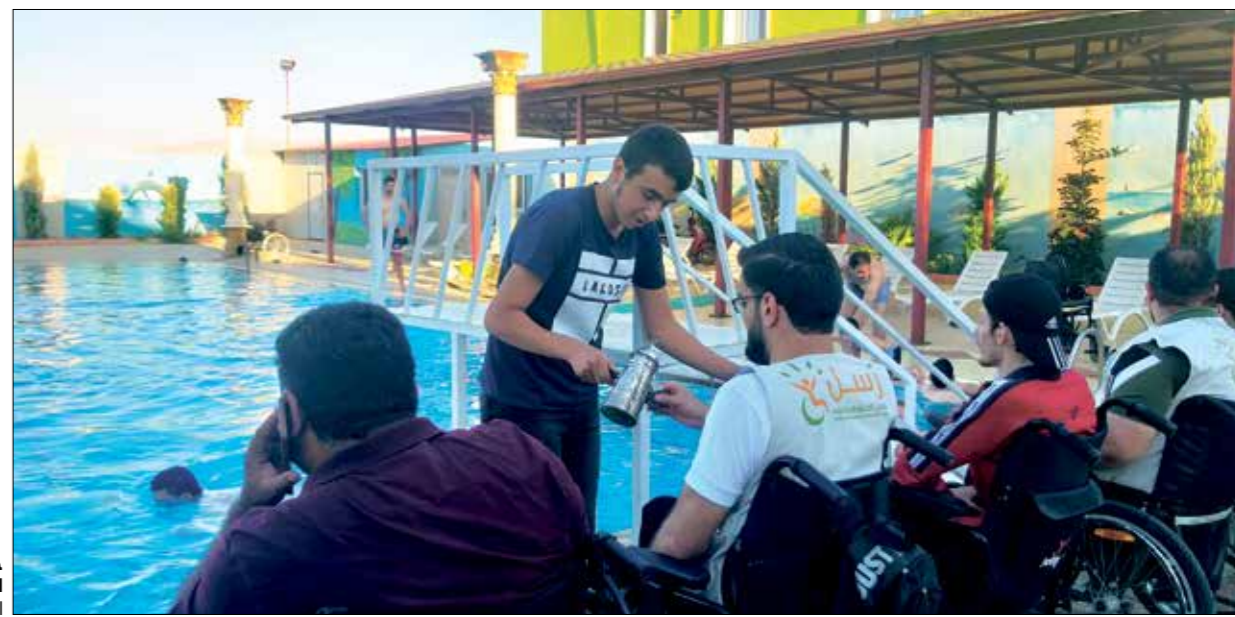
خلال أحد النشاطات

وجد شبان سوريون عالمًا افتقده بعد أصابتهم في الحرب السورية طوعياً يساعد اقربانًا لهم سلبتهم القابيل والفضائل اطرافهم، اسسوا «رُسل» ليكون جونا في زرع التفاؤل والحث على الاستمرار بالحياة