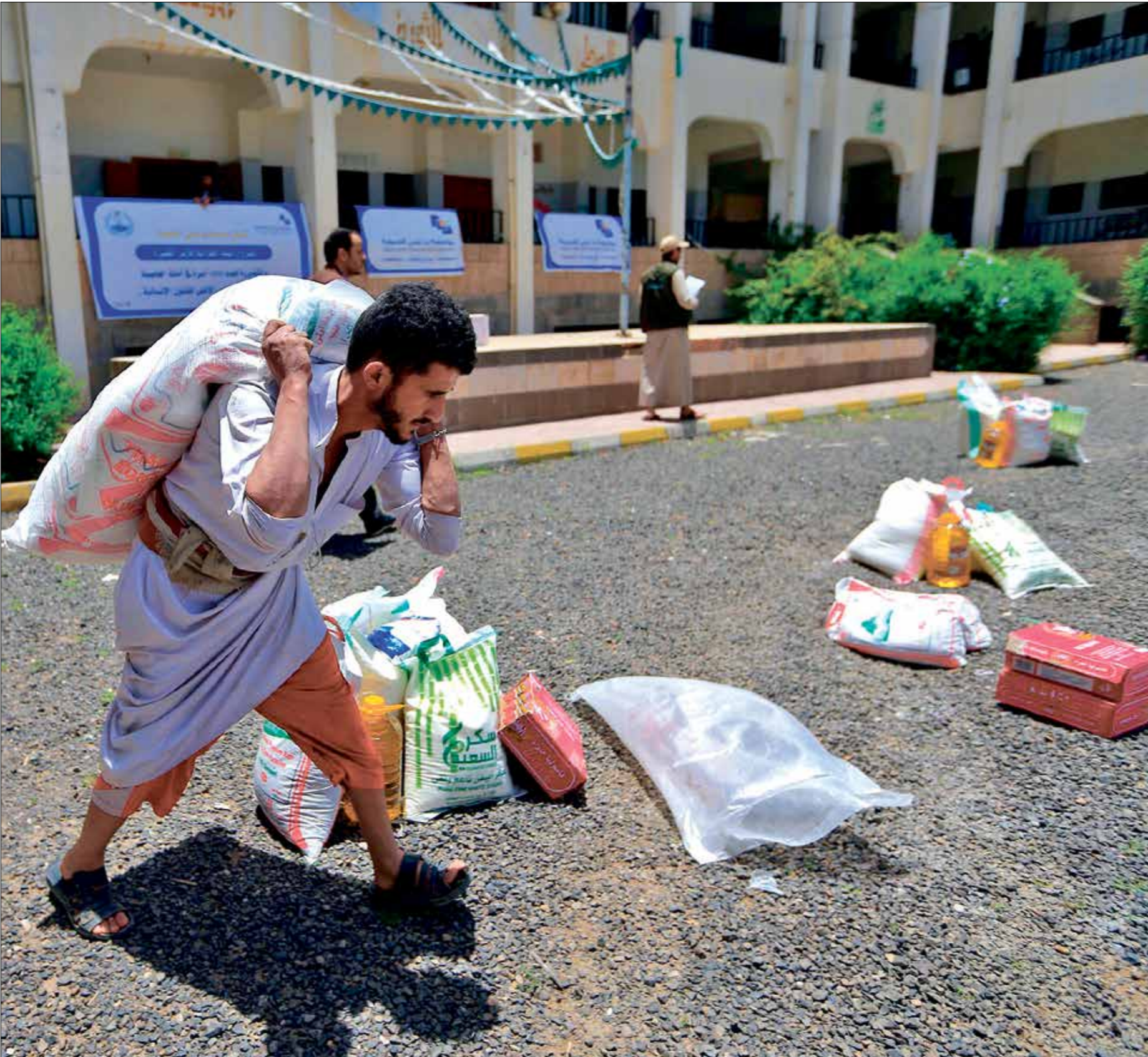
لم تعد المساعدات تصب بالنظام

70% من سكان اليمث، يعيشون في مناطق الحوثيين، وبالأزوت تقلّص حجم المساعدات المخصصة لهم