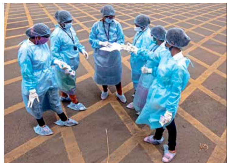
ممرضات في العلق

في جهودنا للتغلب على الفيروس الصيني الخفي، وكثر يقولون إن وضع كمامة هو عمل وطني حين تستحيل ممارسة التباعد الاجتماعي». وتابع: «لا أحد أكثر وطنية مني، رئيسكم المفضل». ولليوم السابع على التوالي، سجّلت الولايات المتحدة أكثر من 60 ألف إصابة جديدة بكورونا خلال الـ 24 ساعة الماضية، بحسب بيانات نشرتها جامعة جونز هوبكينز. وظهرت أنّ إجمالي الإصابات بالفيروس ارتفع إلى أكثر من 3,82 مليون إصابة، إضافة إلى 140,922 وفاة، إلى ذلك تبرز مخاوف جديدة إزاء دول القارة الأفريقية، خصوصاً جنوب أفريقيا، إذ تجاوزت حصلة الوفيات عمئة الخمسة آلاف نهاية الأسبوع ويمكن أن تكون الوضع في جنوب أفريقيا بمثابة «تحذير» للماق ولول القارة، وفق ما أعلن مدير الحالات الصحية العارثة في منظمة الصحة العالمية مايكل راين. أضاف: «انا قلق جداً إذ بدأنا نرى تسارعا