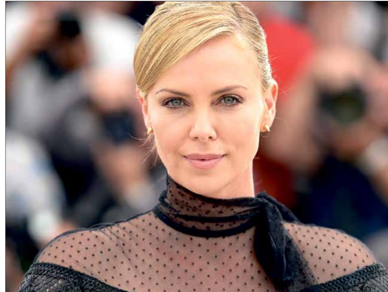
تللار ليروم، «حادة»، الشات البشرية من مونها

بإصدارها عددًا خاصًا (يوليو/ تموز، أغسطس/ آب 2020) بعنوان «ومي، مصير مفسور» (عن رومي شنيدار)، تُؤكّد المجلة الفرنسية «باري ماتشي» أنّ الصحافة الفنّية جزءٌ من العمل الصحافي الذي يبلّغ قواعده المهنية وأصولها، بعيداً عن ثُرثرة وبنائهم وأخبار غير فريدة، لكنّ المجلة غير مطلوبة بعدد خاص كهذا كي تُؤكّد المؤكّد، فمسارها معروف، وأشتغالها الفنّية مرتكزة على مواضيع سينمائية (وغير سينمائية) تتعدت عن النقد والسجال، وتقرب من المعلومة والحكاية والسردي والقصاص، التي ينضى بعضها (على الأقل) لتنامت خُفتي أحضان الإصلي، وتمتج القراري متعة التعرف على جوانب غير مُتداوله كثيراً في حيوات مشاهير، وبعض