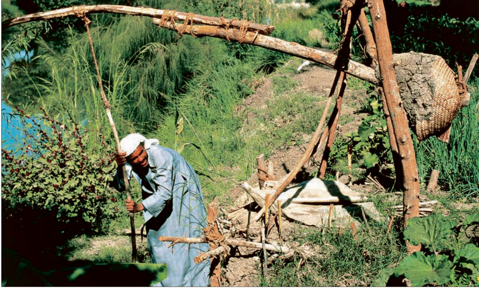
يقول النوبيون: لا يصعد ثوران إلى حلبة الساقية

توصف السواقي النوبية بأنها الأكثر انتشاراً على امتداد حوض نهر النيل، من صعيد مصر حتى وسط السودان، وقد ظلت تتناقل صناعتها الأجيال، حتى وقت قريب، محتفظة بهيكلها وأجزائها التقليدية الموروثة