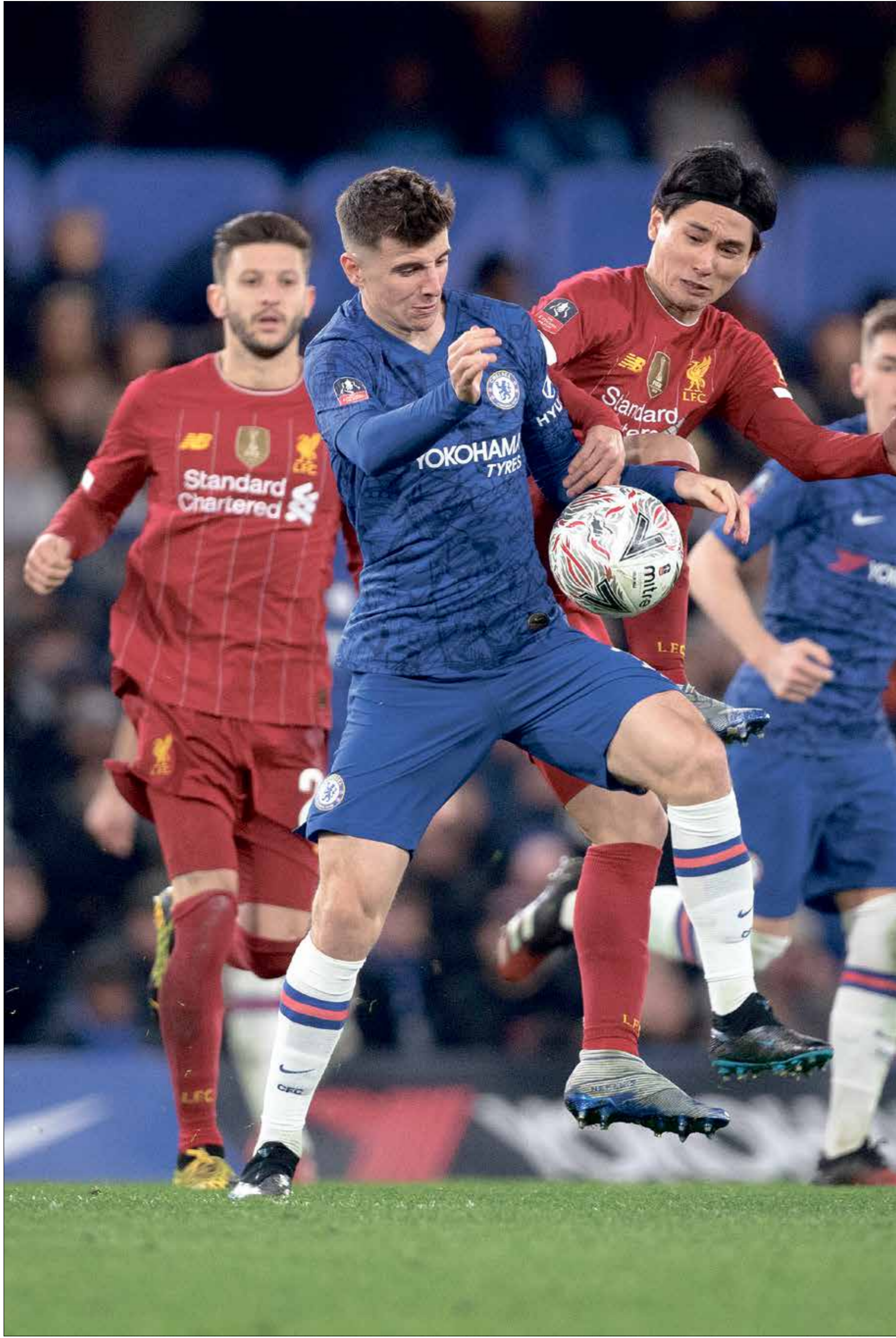
هان ينسحق لفيشيب البيك مرة لثانية في املك عن 10 ايام

Sister لشفيلثانا سُوتسوروكفا: تحاول راينا، بمزاجها المتقلب وجهها اللانكي، البقاء على قيد الحياة مع والدتها وشقيقتها، رغم الصاعق التي تخاصرهم. يصنع الثلاثي تماثيل ليبيها للسباح القادمين إلى قريتهم البلغارية، ولكي تهرب من اللل، يتكر راينا قصصاً للتسلية تنتهي بها إلى إفقاد العائلة توازنها.