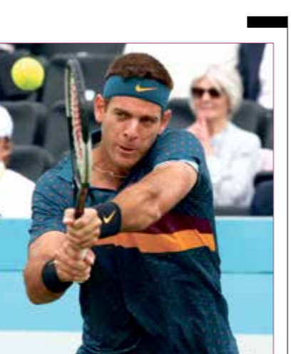
رافيل نادال يلعب التنس في بطولة أستراليا المفتوحة

ديك بو تزو يعود للتدريب تدريجياً على الملاعب كشف لاعب التنس الأرجنتيني خوان مانويل ديل بوترو (31 سنة) أنه عاد للتدريب على الملاعب، ولكنه لا يزال يشعر بالألم في الركبة بعد خضوعه لجراحة في شهر كانون الثاني/يناير بسبب كسر في أعلى الركبة، وكتب اللاعب على «إنستغرام»: «لقد عدت هذه الأيام للتدريب تدريجياً على أرض الملعب، الركبة لا تزال تؤلمني وهما نحن نرى كيف يستطو الأمر، لا توجد تواريخ معينة للعودة الرسمية».