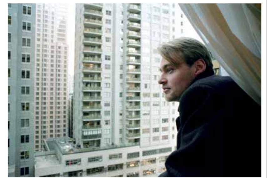
كريستوفر نولان، مخرج مشرف عن الصالات (أبوابها مغلقة)

يصغ السينمائي البريطاني الأميركي كريستوفر نولان (1970) نفسه بأنه «مخام شرس» في دواعي عن الصالات السينمائية، الأميركي ريتشارد غلفوندي (1954)، رئيس المجمعيات السينمائية IMAX، يقول إن أحدًا في الولايات المتحدة الأميركية لا «يضاغف من أجل إعادة افتتاح الصالات» هناك، إلا نولان، مُضيفا أنه يجهد لتحقيق ذلك «كي نُطلق العروض التجارية لفيلمه Tenet» (تنت)، نولان غير مُتحمس لكلام غلفوندي، لكنه يناصر الصالات والعمالين فيها، المعلقة أبوابها منذ منتصف مارس/ آذار 2020 في العالم، بسبب قفّتي وباء «كورونا» المستجد.