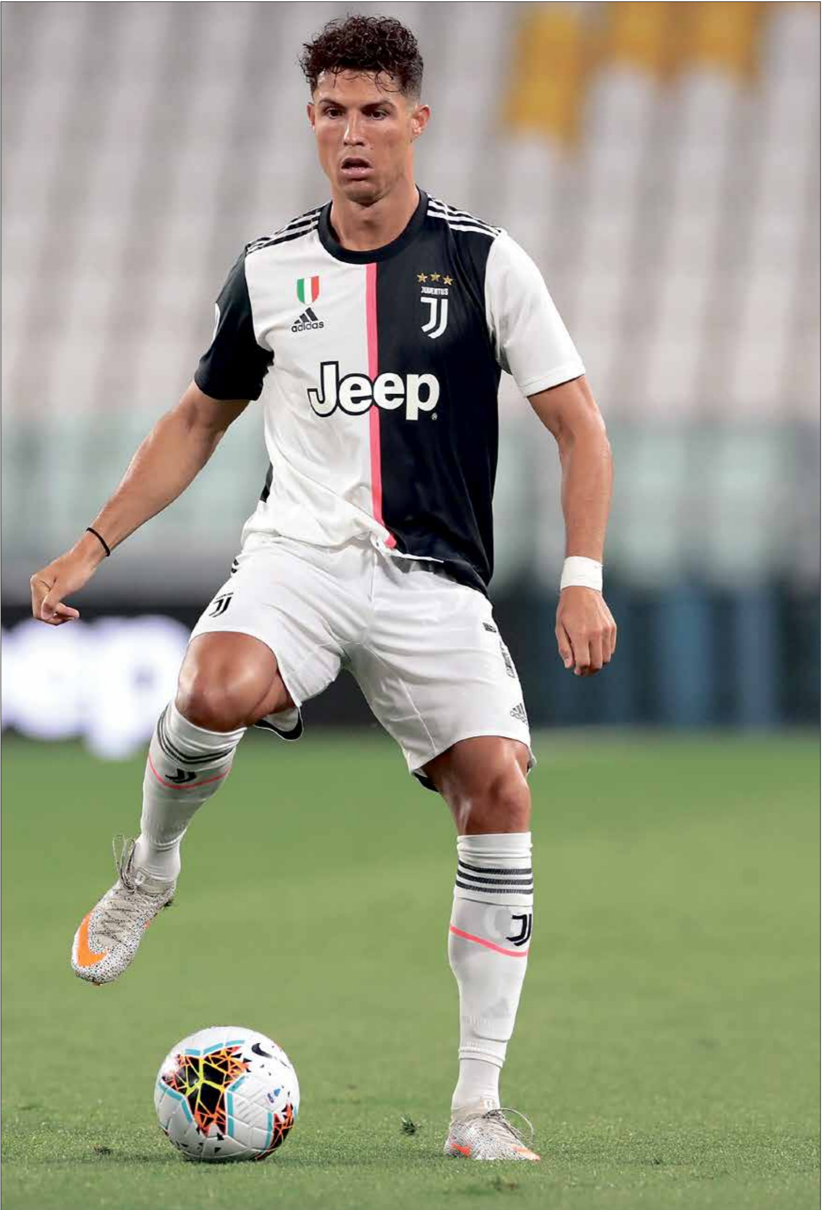
رونالدو يلعب مع يوفنتوس

حقق البرتغالي كريستيانو رونالدو بعر 35 سنة في رصيده 4 جوائز حذاء ذهبي، وهي الجائزة التي لم يفز بها منذ عام 2015 حين سجل 48 هدفاً مع فريق