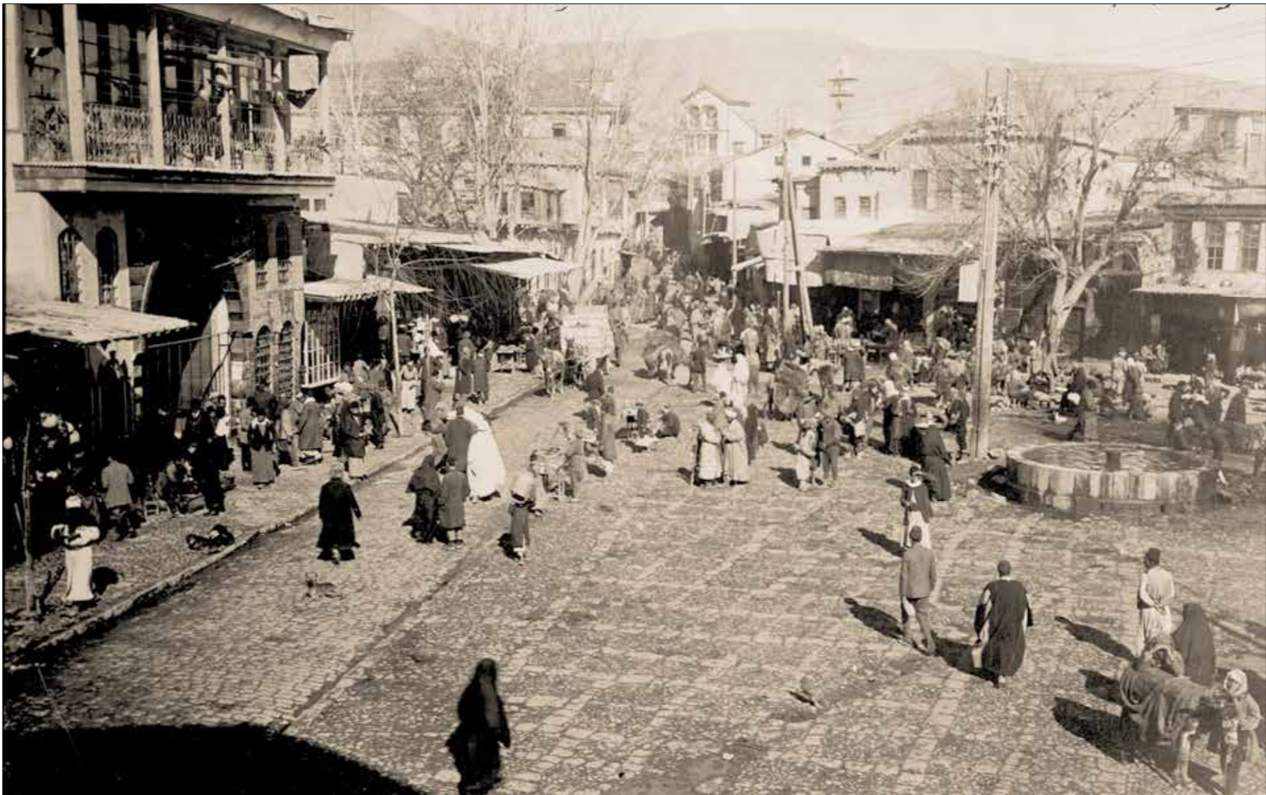
دمشقه بين 1915 و1920

يثار هذا السؤال اليوم بقوة في مصر، مع تناقل صور ومقاطع فيديو لعمليات هدم بالجرافات لمقابر في منطقة صحراء المماليك، شرقي القاهرة، بهدف ترمير طريق أسفلتي ضمن مشروع يحمل اسم «محور الفردوس» وهكذا يتقدم «الفردوس» سكة الموتى في قبور تاريخية يصل عُمر بعضها إلى عة