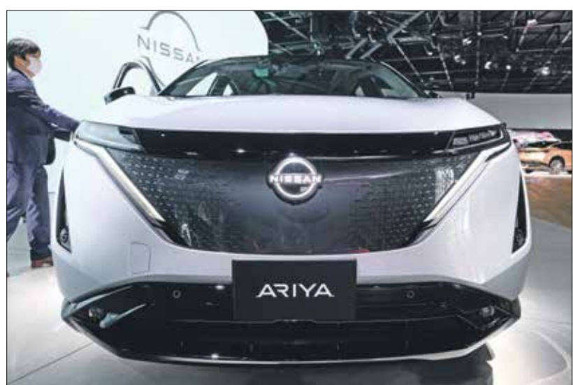
عرض السيارة الجديدة في بوكوهاما

مهدت السيارة 610 كيلومترات وسعرها 46,6 الف دولار