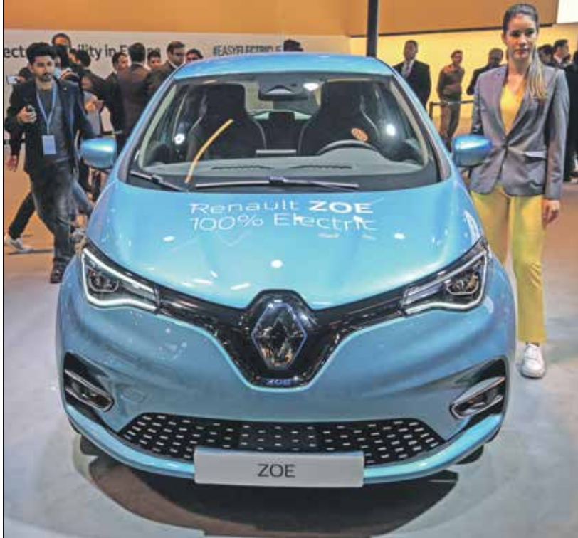
إقبال شديد على «زوي»