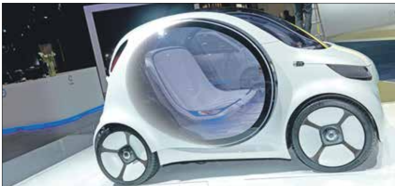
المنافسة «سمارت» من «دايمر»

مقراً، وبدأت يوم الأربعاء الماضي في عرض عقود الإيجار التلكني لـ«سمارت إي-كيو» Smart EQ العاملة بالبطارية من شركة «دايمر إيه جي» مقابل 9,90 يورو شهرياً: «هذه لحظة ذهبية بالنسبة إلينا».