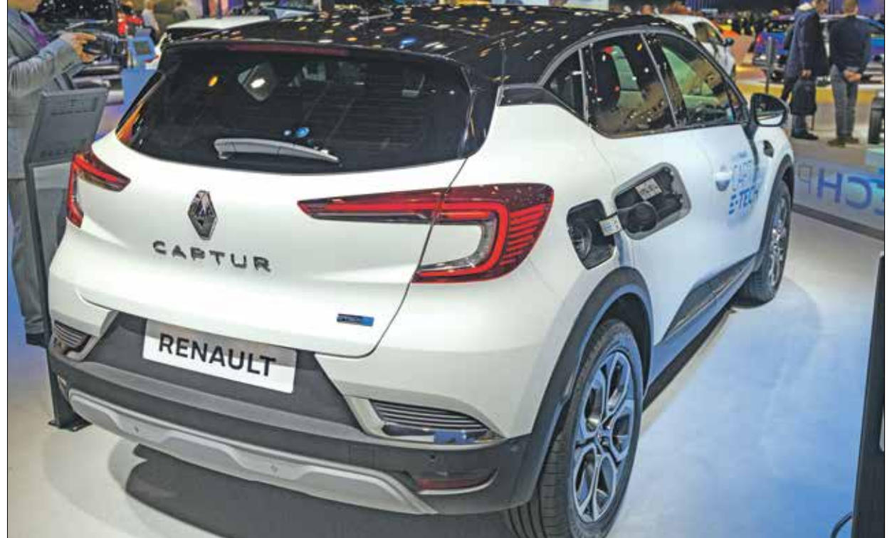
«كابتور» من ايقونات الشركة الفرنسية بين المركبات الكهربائية