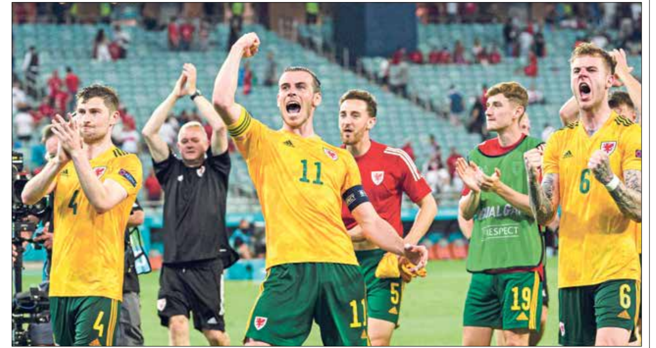
يتقدم به، إلى قيادة ويلز لتحقيق الفوز على إيطاليا

ويطمح منتخب إيطاليا إلى تحقيق الفوز، وخطف النقاط الثلاث الثمينة، من أجل الاستمرار بالتربع على عرش صدارة المجموعة الأولى، فيما يامل منتخب ويلز بمباغعة «الأزوري»، ونيل نقاط المباراة،