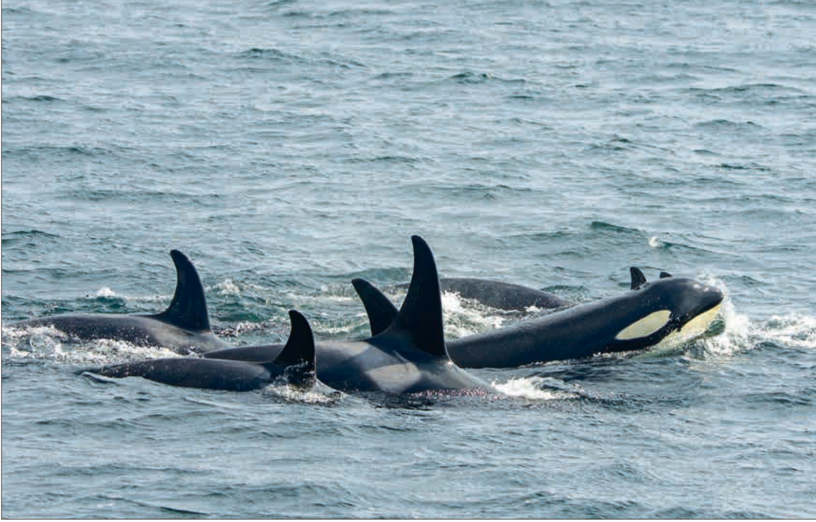
اعتمد البحث الجديد على أكثر من أربعة عقود من البيانات التي جمعها مركز أبحاث الحيتان

أظهرت دراسة جديدة نشرت في 15 يونيو/ حزيران الجاري من جامعة «إكستر» في بريطانيا، أنَّ الحيتان القاتلة تمتلك سلوكاً اجتماعياً غريباً، وهو تكوين الصداقات السريعة