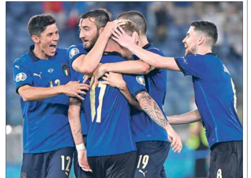
لجوم عديديون يتقدم عليهم منتخب إيطاليا في مواجهة ويلز

يسعى منتخب إيطاليا لمواصلة عروضه القوية، وتحقيق الفوز رقم 11 في جميع المناسبات، ويصني النفس بالفوز على ويلز وتصدر المجموعة الأولى