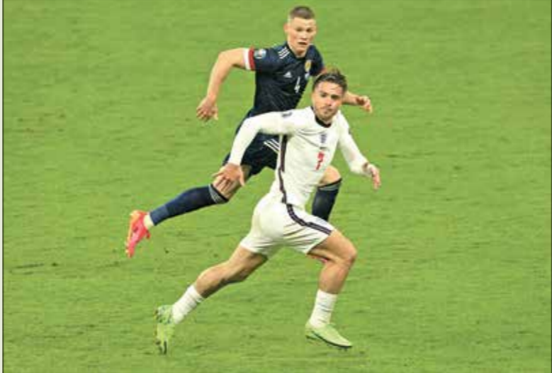
أخفق غريالين في تحديم الإضافة