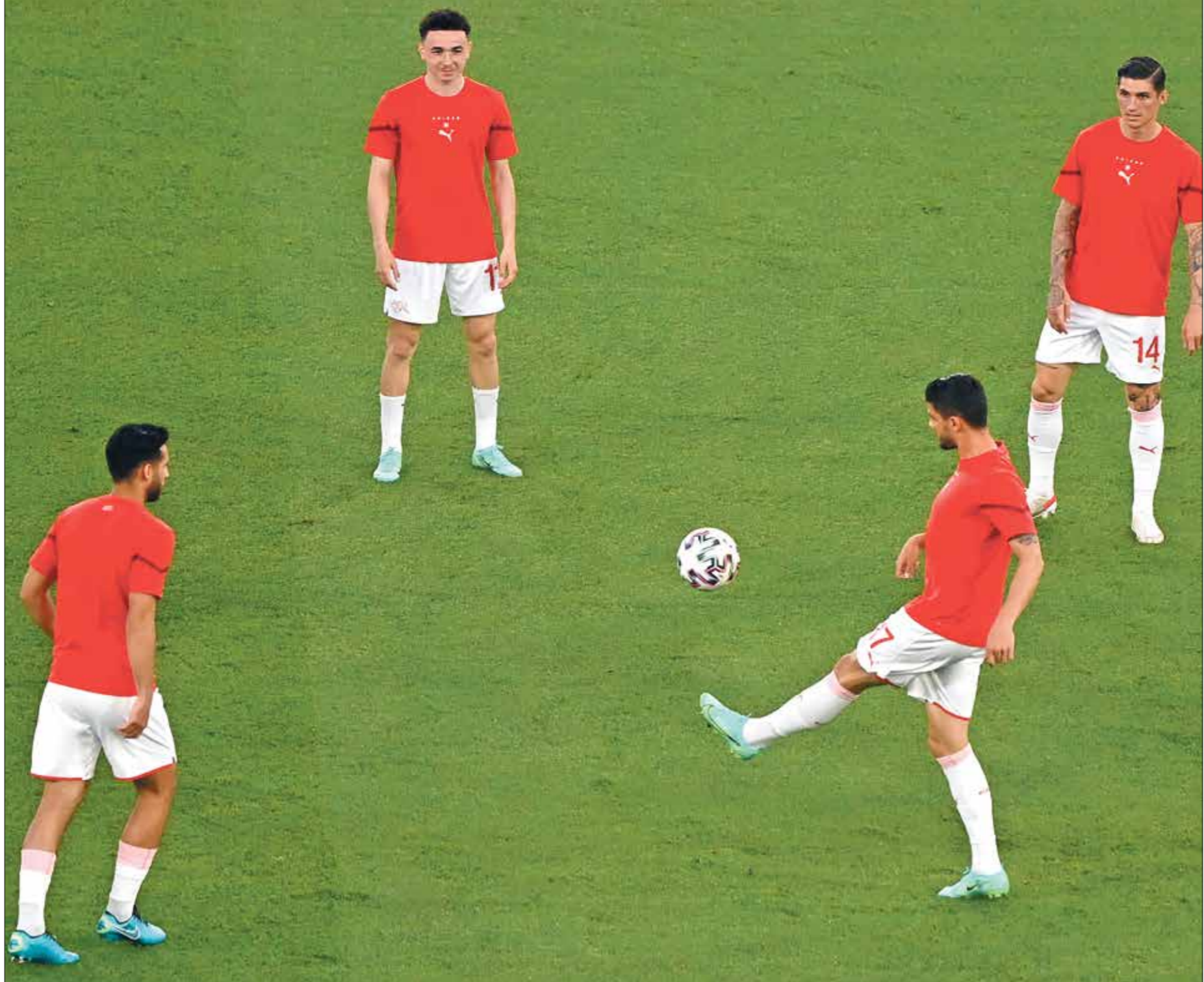
يحتاج منتخب سويسرا للانتصار على تركيا

ويمتح تعادل منتخب ويلز أمام إيطاليا المركز الثاني في المجموعة الأولى، لكن تحقيق رفاق القائد غاريت بيل الانتصار، سيضمن لهم صدارة المجموعة، والوصول إلى ثمن نهائي بطولة كأس الأمم الأوروبية لكرة القدم 2020، من دون الاهتمام بنتيجة المباراة الأخرى بين سويسرا وتركيا. ومن الممكن أن يضمن منتخب ويلز المركز الثاني، في حال خسارته أمام إيطاليا،