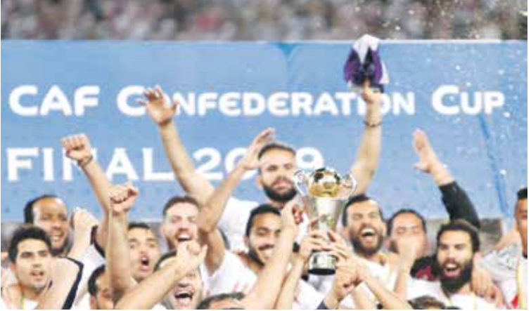
الزمالك حامله لقب الموسم الماضي

التي شهدت تالقه بشكل لافت تهديفياً، وتسجيله لهدفين من رماية الفريق في مرعى منافسه الكونغولي، وسجل الفحلي 5 أهداف لنهضة بركان خلال منسواره بالبطولة القارية، ويحتل المركز الثالث حالياً في لائحة الهدافين بفارق هدفين عن المتصدر كريم كوتاني هدف اسك ميموزا الصاحي الذي ودع المنافسات رسمياً، ويملك في جعبته حالياً 7 أهداف في المركز الأول.