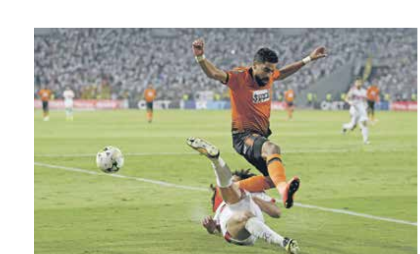
نهضة بركان وطموحات في تحطيم الصواب والترويج باللقب

والنهائي هو الثالث لنهضة بركان في الفترة بين عامي 2019 و 2022، أي بلغ