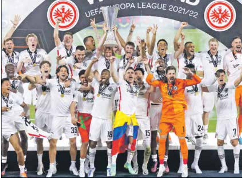
الأبحاث فرانكفورت عاد لمنصات التوج محققاً لقبه الثاني في المسابقة

ذلك كثيراً»، وأعرب المدرب الهولندي عن أسفه لأن المباراة ألت إلى «ركلات الترجيح، وهي لعبة حظ»، مشيراً إلى أن «الأمور لم تكن على ما يرام» مع فريقه، ونكر اللاعب السابق في نادي برشلونة أنه لا يمكن «توجيه اللوم في نادي برشلونة الذي لا يمكن