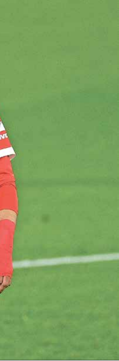
سعر التصريف في المزاع مع استمرار للشف في صفوف إسبيلية