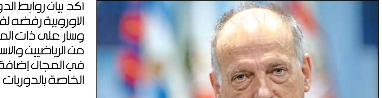
خافيير نيباس رئيس رابطة الييفا التقه هذا الشهراب ببلدة

أعلنت مجموعة من الأندية الأوروبية الكبرى، إطلاق مسابقة جديدة للأندية تسمى «السوبر ليغ» تضمّ 12 نادياً، من أفضل الفرق في القارة العجوز.