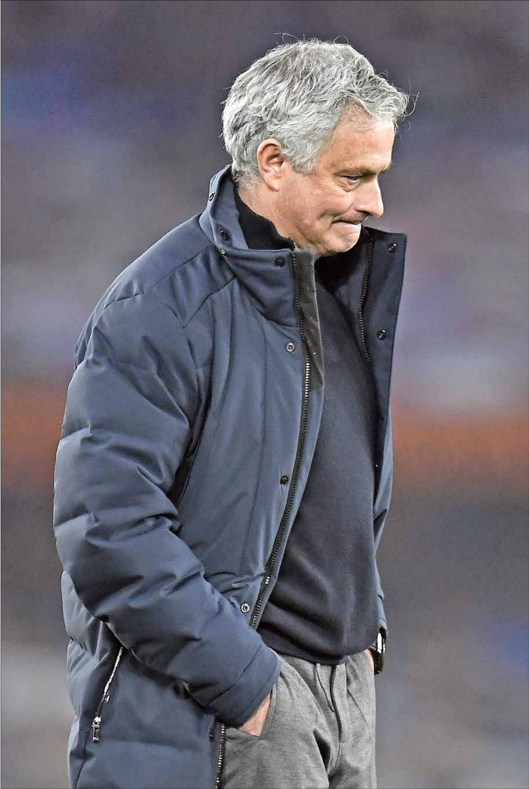
مورينيو عانى من سوء النتائج مؤخراً

أقال نادي توتنهام، المدرب البرتغالي جوزيه مورينيو، من منصبه، بعد سلسلة من النتائج السلبية التي لاحقت الفريق على مستوى مختلف المسابقات. وكتب النادي في بيان رسمي: «يمكن للنادي أن يعلن اليوم إعفاء جوزيه مورينيو وطاقمه الفني جواو ساكرامنتو، ونونو سانتوس، وكارلوس لالين، وجيوفاني سيرا من مهامهم، وسيتولى ريان مايسون تدريب الفريق الأول حتى يتم التعاقد مع مدرب جديد».