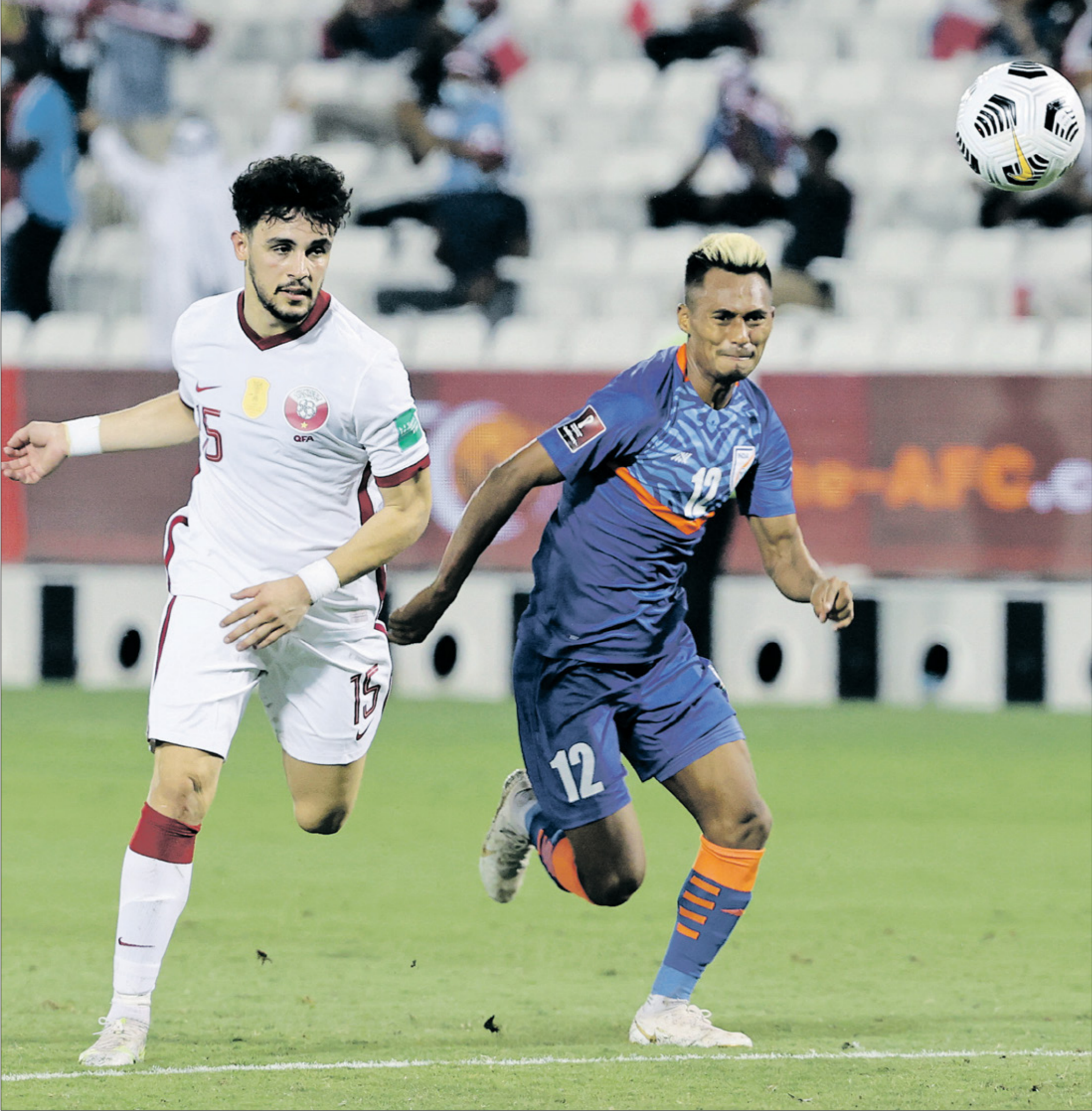
«الطالبي» بات علماً اعلمة التلمة للدور الثاني من التصفيات (صحيح ديويل)، (الخطأ)

السابقتين. في المقابل تتطلع طاجيكستان أيضاً إلى المحافظة على مستواها المُلغَت في نهائيات كأس آسيا 2023 في قطر، في حين تحتاج باكستان إلى الفوز بعد هزيمتين، وظهرت الإشارات تميزها بانتصاريين، وهي تتطلع الآن إلى إحكام قبضتها على صدارة المجموعة بشكل أكبر. في المقابل تتأخر البحرين واليمن بفارق ثلاث نقاط، بينما تحتاج نيبال إلى إعادة مشوارها