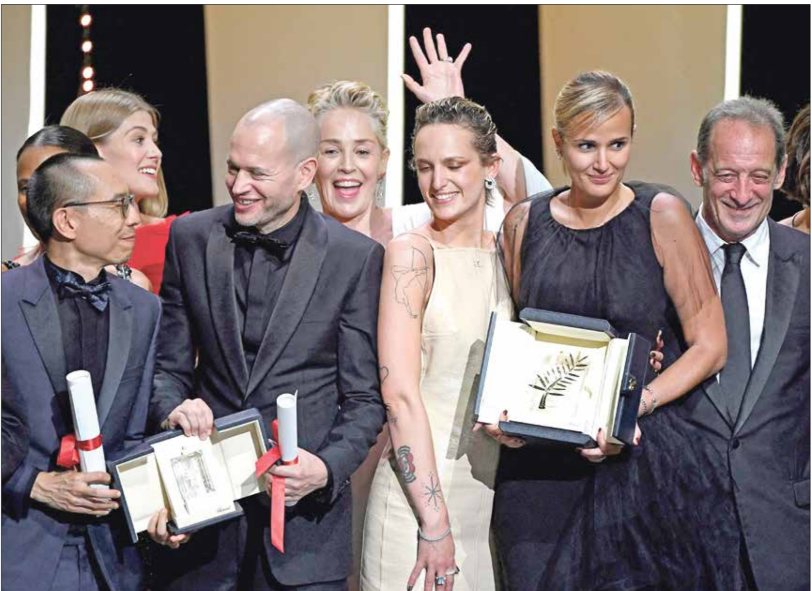
«تيتان» -عاد السعفة الذهبية من المهرجان

بمناخية سلاح قوة لرحضة جدران المعيارية التي تحسبنا وتفصلنا، ويشكّل منح دوكورنو هذه الجائزة رسالة بالغة الأهمية للصناعة السينمائية التي تشهد أكثر من أي وقت مضى إعادة نظر منذ أربع سنوات في ما يتعلق بمكافحة المرأة والمساواة بين الجنسين، على إثر قضية المنتج السينمائي السابق هارفي وينستين ثم حركة «مي تو»، واقتصر عدد الأفلام التي أخرجتها نساء على أربعة فحسب من أصل 24 عملاً كانت تتنافس