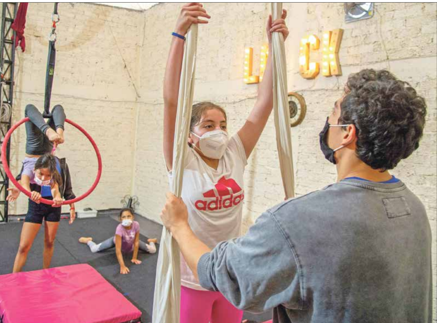
نشر صرف السرك من المكنة منذ

يُسجّل لشركة «روف توب» اللبنانية خوض مغامرة في إنتاج مسلسل لبناني، على الرغم من المعاناة الاقتصادية التي طرقت لبنان. «دور العمر» هو أول إنتاج الشركة التي يديرها طارف كرم، المسلسل سعيد ناصر فقيه، وتولى تنفيذ المخرج سعيد الماروق. من الحلقات الأولى لبداية السلسلة القصيرة (10 حلقات) يحاول المخرج والكاتب معا العمل على العوامل النفسية للشخص وال«كاركتيرات» «شمس» (سبرين عبد الحارث) التي لعبت لبناني يدخل مجال الإنتاج الدرامي لكسب المال، تُعجب «شمس» بـ«فارس» (عادل كرم) ما عندها لتختبر أنها قادرة على اللب والافتقار، كالشعر الأسود المستعار، والوجه الذي يعاني من صراعات نفسية واضحة تجده يخرج من صورة العنطة الجميلة، أو تلك التي دخلت المزارع والتعابير موسام الدراما الرمضانية سابقاً. يستقوي «شمس» بحسب شريط الأحداث، كانت