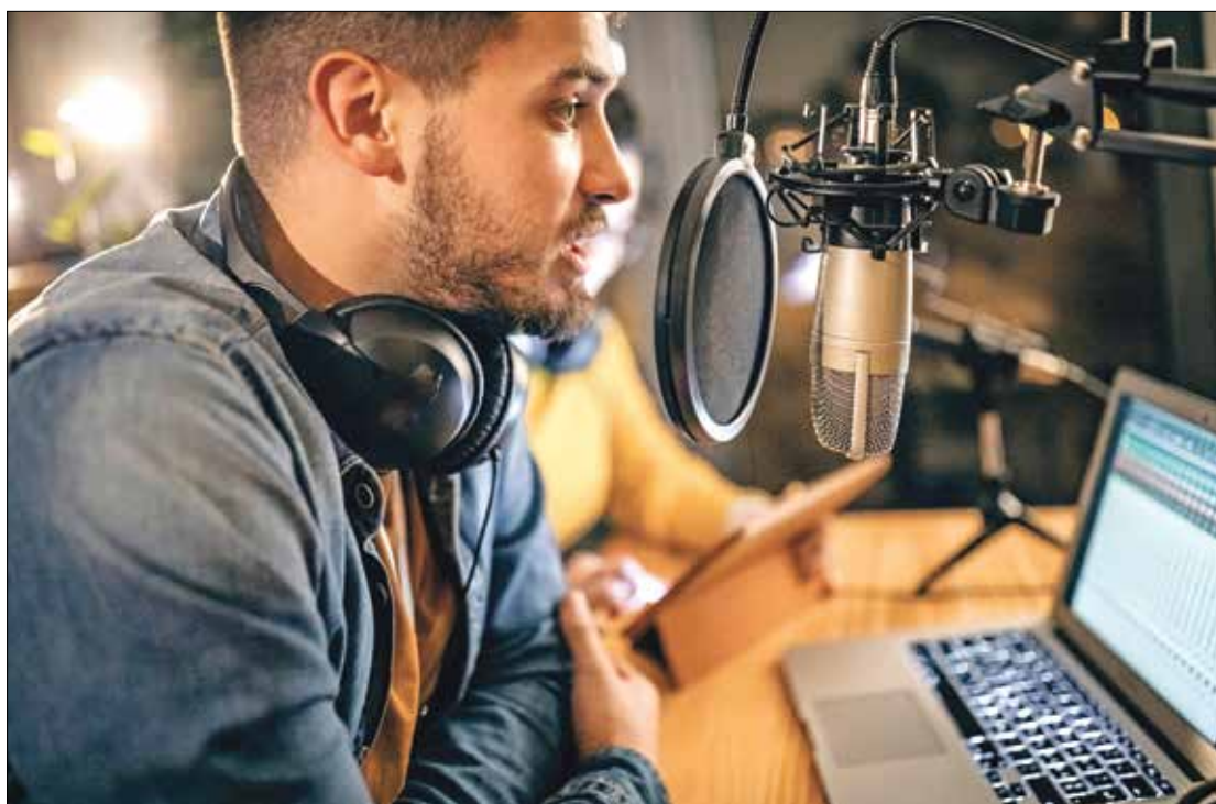
مجرمو الإنترنت يستغلون التزييف للتحريك

من خلال تسجيل شخص يتحدث، يكون البرنامج قادراً على تكرار صوته أو نطقه بأي كلمات أو جمل تكتب على لوحة مفاتيح. ولا يلتقط البرنامج اللهجة