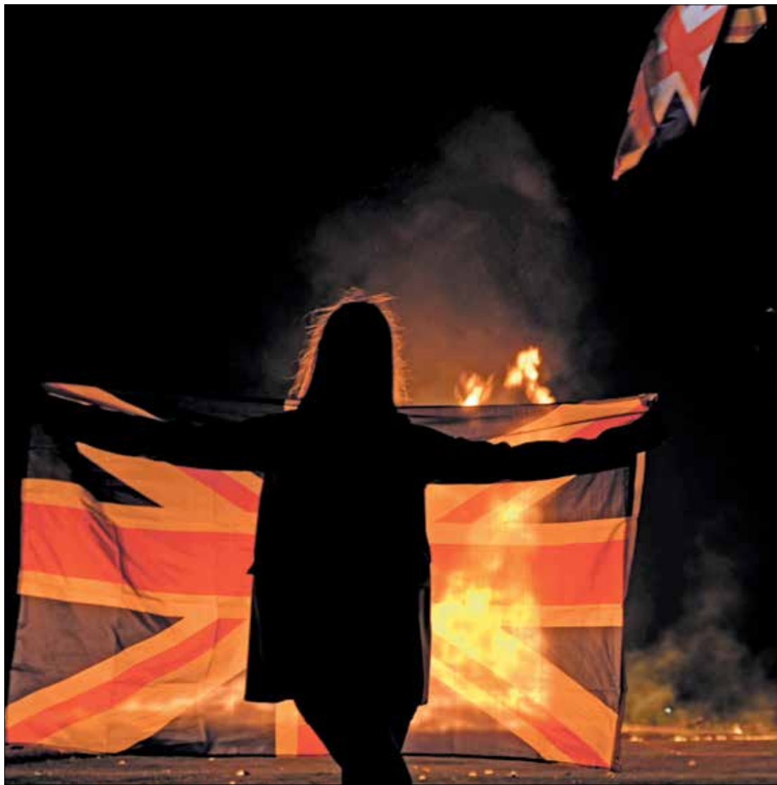
التصريحات الرسمية لا تُترجم دائما في سلوك المنصات