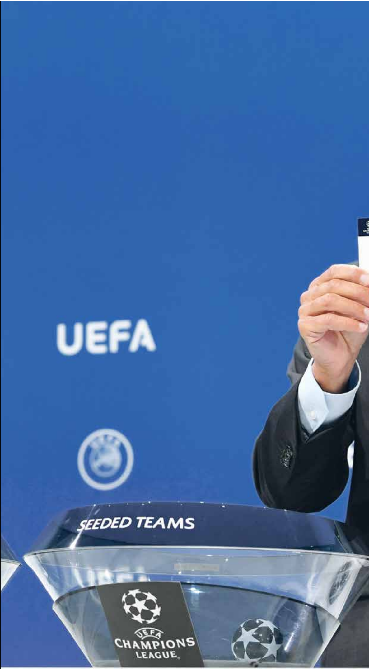
القرعة ستشهد ربما مواجهات نارية بين الأبطال

ويتأهل الأفضل هذا الموسم إلى الدور نصف النهائي، إذ أن القرعة ستُقدّم للجماهير مباريات غير متوقعة ويشهد المربع الذهبي مواجهات غير متوقعة؛ إذ من الممكن ألا يلعب دورتموند وبورنو مع بعضهما في الدور ربع النهائي ولا في الدور نصف النهائي، ويصل إلى المباراة النهائية، في واحدة من المفاجآت الكبيرة هذا الموسم.