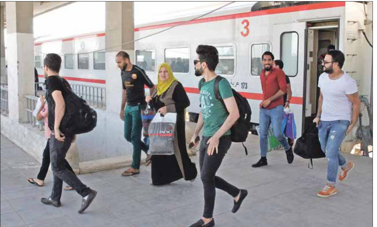
تجذب الأنبار الكثير من العمال من محافظات اخرى

جاذبة للعمل والمشاريع. تعد الأنبار من ضمن المنطقة التي وقعت تحت سيطرة تنظيم «داعش» في العراق بين صيف 2014 وحتى نهاية 2017. شهدت كثيراً طاول جميع مرافقها وبنائها التحتية وأغلب أحيائها السكنية والفري. وبعد أكثر من ثلاث سنوات على تحريرها، تحولت الأنبار إلى نقطة جذب مهمة