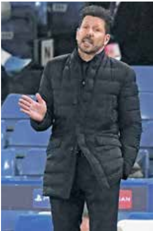
القرعة ستشهد ربما مواجهات نارية بين الأبطال

كشفت تقارير إخبارية أن نهائي كاس ملك إسبانيا المؤجل من العام الماضي بين أتلتيك بلباو وريال سوسبيداد، والذي سيلعب في الثالث من الشهر المقبل، سيشهد حضوراً جماهيرياً. وأشارت إذاعة «كادينا سير» الإسبانية إلى أنه من المتوقع أن يتم السماح بحضور نسبة تتراوح من 20 إلى 25% من سعة ملعب «لا كارتيخا» في إشبيلية. ولغفت إلى أن التذاكر ستباع في إقليم الأندلس فقط، لتجنب أي تفلات من إقليم الباسك، ضمن الإجراءات الاحترازية ضد فيروس كورونا. من جانبه، أعلن الاتحاد الإسباني لكرة القدم أنه سيجتمع بسوسبيداد وأتلتيك لمناقشة «شؤون مرتبطة بالتهاني». هذا وأكدت صحيفة «أس» الرياضية الإسبانية من جانبها، أن الاتحاد سيبلغ التانيين بخصوص مسألة السماح بحضور جماهيري محدود. في وقت لم يُحدد الاتحاد بعد ما إذا سيكون هناك حضور جماهيري في نهائي نسخة هذا الموسم بين برشلونة ولبلاو على نفيش للمعب، والذي سيُقام في 17 نيسان/إبريل القادم.