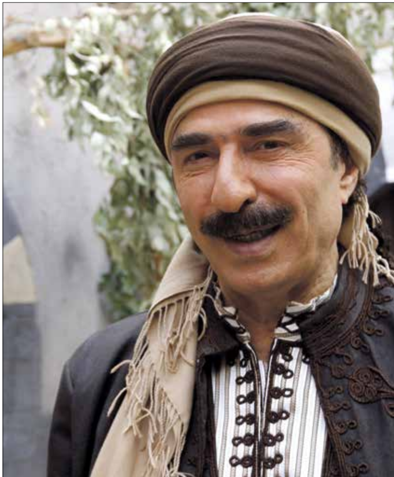
نورز الكاتب في نصوص وافيكر مكرزة

لطالما كان المنتج السوري حريصاً على الاستحسان بارض حسنة للكيميا، عبر جغرافيا واسعة تمتد من الساحل إلى الصحراء، مع تضاريس جبلية مكثت الإنتاج من تقديم عنبرات الأعمال المحلية وشركا تدرجياً إلى دائرة الأراضي السورية. لكنّه تحوّل تدريجياً إلى دائرة ضيقة من الجغرافيا تتمثل في دمشق وما حولها، ومن ثمّ العاصمة الرمزية فقط، من دون الريف المتشغل بالعارك والصراعات، وحتى أيضاً باتجاه الأحياء الراقية التي تعجز عن سريحة ضيقة جداً من المجتمع السوري، وترصد