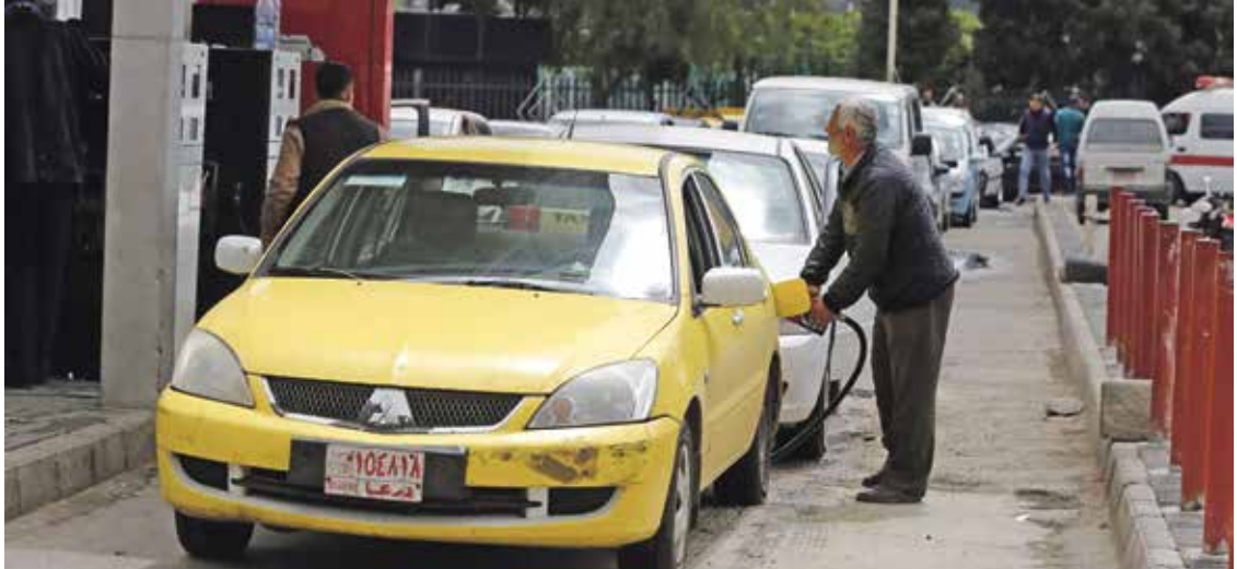
رضع النظام أسعار المحروقات خيرا (الوجع)بشارع(فرانس برس)