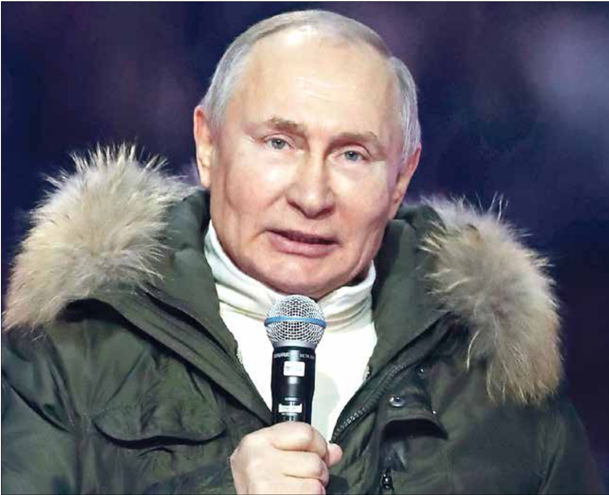
بوتين، تصريحات بايدن لعكس الماضي المضطرب لأميركا

ويبدو أن السجل الأخير يسرع دخول العلاقات الروسية الأميركية في دوامة توتر جديدة، رغم أن البلدين أكما منذ تغيير الإدارة الأميركية أنهما يريدان التعاون في ملفات ذات اهتمام مشترك. وقال بوتين، خلال محادثته عبر الفيديو مع سكان القرم وسيفاستوبول، إن «القاتل هو من يصف الآخر بذلك»، مضيفاً «هذه ليست مجرد عبارة طفولية أو مزحة، دائماً ترى مواصفاتها في شخص آخر وتعتقد أنه مثلنا»، إلا أنه أضاف «سدافع عن مصالحنا وسنعمل مع الأميركيين بشروط تكون مفيدة بالنسبة لنا». وأضاف «ماذا سأقول له: كن معافى! تخملي له الصحة»، مشيراً إلى أنه يقول ذلك «ليس سخريه أو مزاحاً». واعتقد بوتين أن تصريحات بايدن تكسر