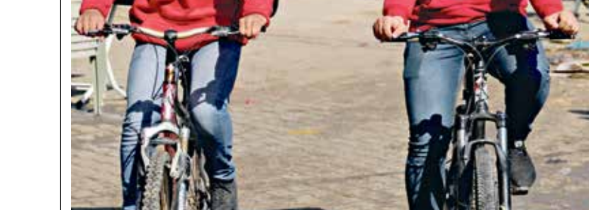
مرصّة عمك مناسبة لهما (محمد الحجار)