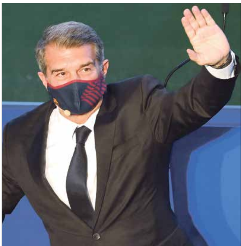
لابورتا يبدأ رحلة (بداية بة برشلونة)

كما أكد الرجل عاد لرئاسة النادي «الكاتالوني» عن 11 سنة من ولايته الأولى (2003-2010) أنه يشعر بأنه «وريث لقيم خوان غامبر، ولأرث النادي تركه»، والذي سيقدّمه لمواجهة التحديات الحالية والمقبلة للفريق خلال السنوات القادمة». كما شهدت مراسم التنصيب تواجد أعضاء مجلس الإدارة بالكامل، بالإضافة إلى رؤساء النادي السابحين جوسيب ماريو بارثوميو وساندرو روسيل وأندريك رينا وجوان جاسبريت، فضلاً عن ثلاثة من قادة الفريق الأول لكرة القدم: النجم الأرجنتيني ليونيل ميسي وجيرارد بيكجه وسيديري بويرتو، وبعض مسؤولي الفريق الإسباني.