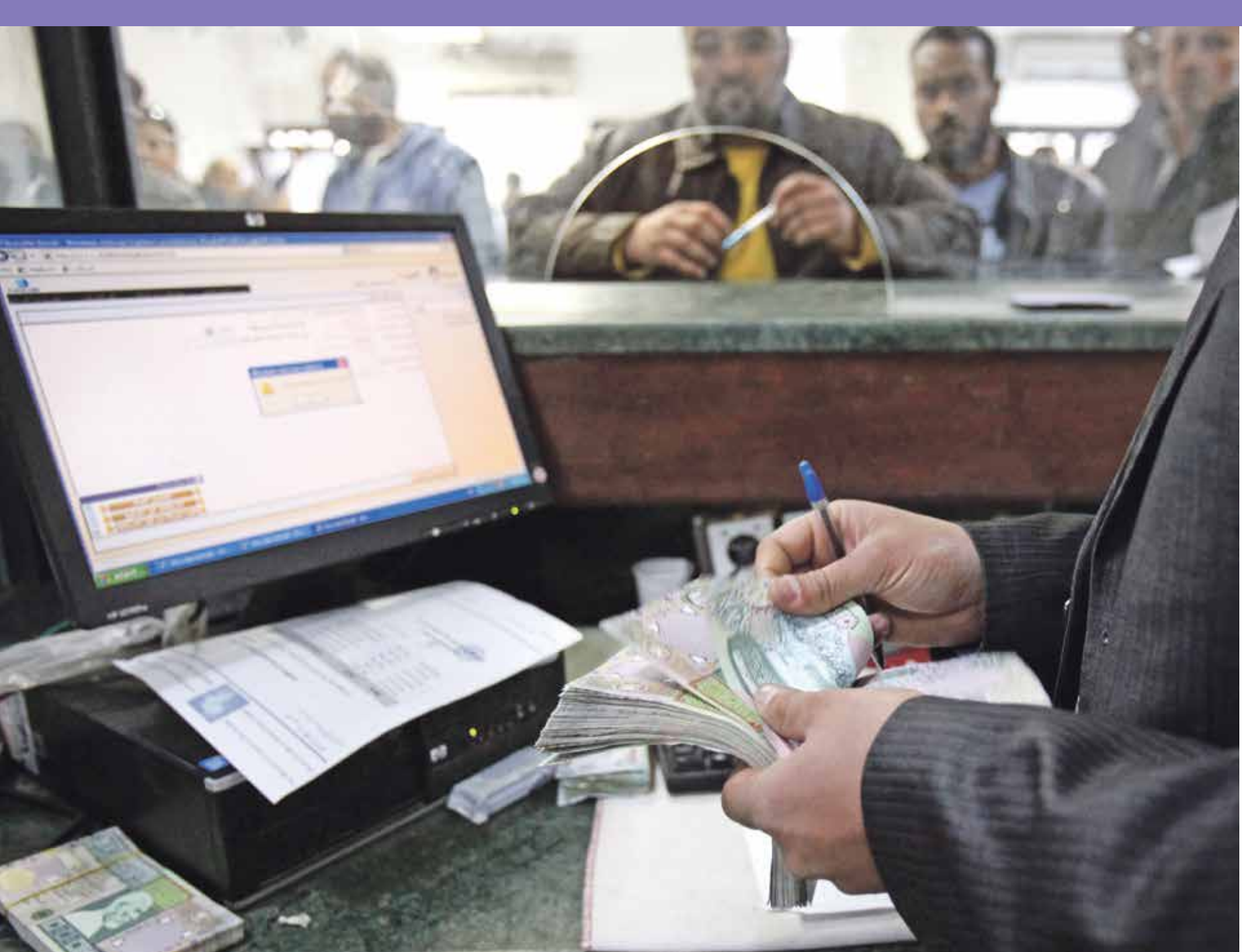
مطالب بدمم القطاع الخاص وتحريك الاسواق

إلى ثورة على الفساد الموجود في الدولة»، وتغيب عن ليبيا الإحصائيات الدقيقة حول مؤشرات وزارة المالية خاصةً جذاً، والوضع الاقتصادي يسير نحو المزيد من التضخم على الكادر الوظيفي للبلاد. وحدث الاصبيعي عدى ضرورة وضع سياسات لتقليل عدد الموظفين ومن ثم اتخاذ خطوات ترفع القوة الشرائية للدينار، وتحسن الأوضاع المعيشية والخدمات في البلاد، وأضاف «لكن هناك مشكلتان، الأولى انخفاض الوحدة الأدنى للاجور في ليبيا 450 ديناراً، و