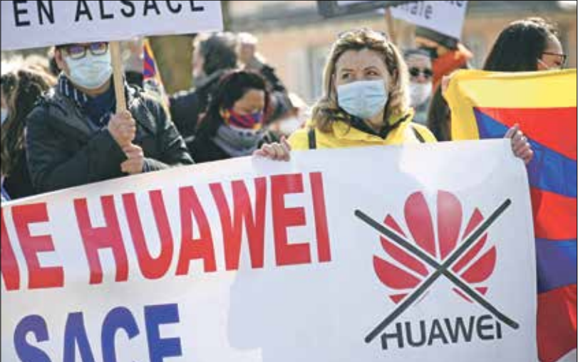
مظاهرات ضد شركة هواوي الصينية فى فرنسا

وصول الصين إلى التكنولوجيا والإسواق المالية الأمريكية. جاء ذلك فى الوقت الذى كان فيه مبعوثون أمريكيون وسينون يتوجهون إلى اسكا، لحضور أرفع اجتماع مباشر بين الجانبين منذ تولي بايدن منصبه فى يناير/ كانون الثانى الماضى، وقال تشاو إن بكين تستخدم الإجراءات الألامية لحماية الحقوق الصينى المشروعة للشركات الصينية»، بدون الخوض فى تفاصيل، والوصول للمسؤولون تحذيرات مماثلة فى الماضى، لكن تلك التحذيرات لم تسفر عن أي إجراء. واستهدف الإجراء الحديث شركة «تشانبا» يونيكوم أمريكان، وهي وحدة تابعة لشركة «تشانبا يونيكوم» المحدودة، وشركة كوم نت»، وهي وحدة تابعة