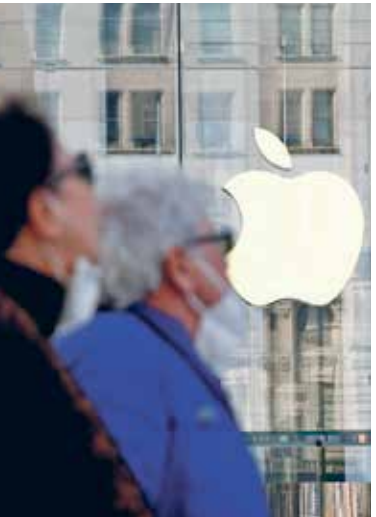
حجب تطبيقات شهيرة خلال الفترة الأخيرة (حجب ملقاً Getty)

إذا لغي المستخدم جمع البيانات، فإن لن تكون ذات صلة، «وهذا سيكون مرعباً» بالنسبة إلى خبراء. وقد تواجه «فيسبوك» انخفاضاً يصل إلى 3 مليارات دولار من عائدات الإعلانات إذا لم يؤيد مستخدمو «آيفون» استخدامها في جمع البيانات، حسبما تقول صحيفة «يو إس إن آي» الأميركية. واستمرارها في النمو من عائدات أي موقع يعتمد على الإعلانات، مثل المواقع الإخبارية، في المقابل، تتلك «فيسبوك» كمية هائلة من بيانات المستخدم، بحيث تصبح صورة طفل صغير ملكاً للشركة