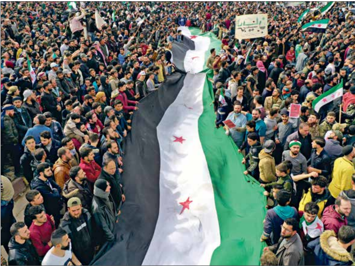
مظاهرة في احد اقطاب النظام السوري في 15 /3 /2021

شكل سقوط الاتحاد السوفيتي، وإفلاس الأنظمة القومية، وتحولها إلى تسلطية، وتطورات الوضع الذي تحكمه وطرحه؛ وتطورات الواقع التي تحكمه، وطرغ ضرورة ضرورة الخلاص من الأدلجة والتفكير بالمصالح والانتفاع على الخارن؛ بشكل ذلك أنه انفضى الخصبة للثورات الليبرالية، لتخرج نفسها جذراً، سيما أن العالم يتجه نحو ليبرالية منتصرة على «الاشتراكية»، فكانت التيارات الليبرالية، وحدثت نزوحٌ يساريٌ واسع نحوها، بل تتركز اليسار العربي بأغلبيته، وبذلك توهم من جديد أن الحل الجذري لك مشكلات المنطقة يكمن في الليبرالية.