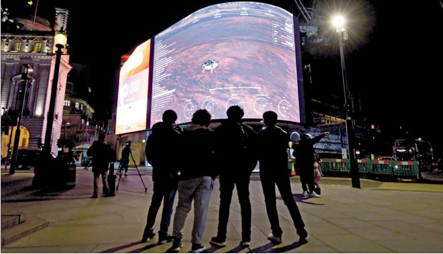
مسبار ناسا يحط على القمر الشهر الماضي

أخيراً، اتفقت وكالة الفضاء الدولية «ناسا» مع شركات خاصة ستساهم بزيادة عدد رحلات الوكالة إلى الفضاء، ومن أبرز هذه الشركات «سبيس إكس»، التي تمتلك مركبة تستوعب أربعة ركاب