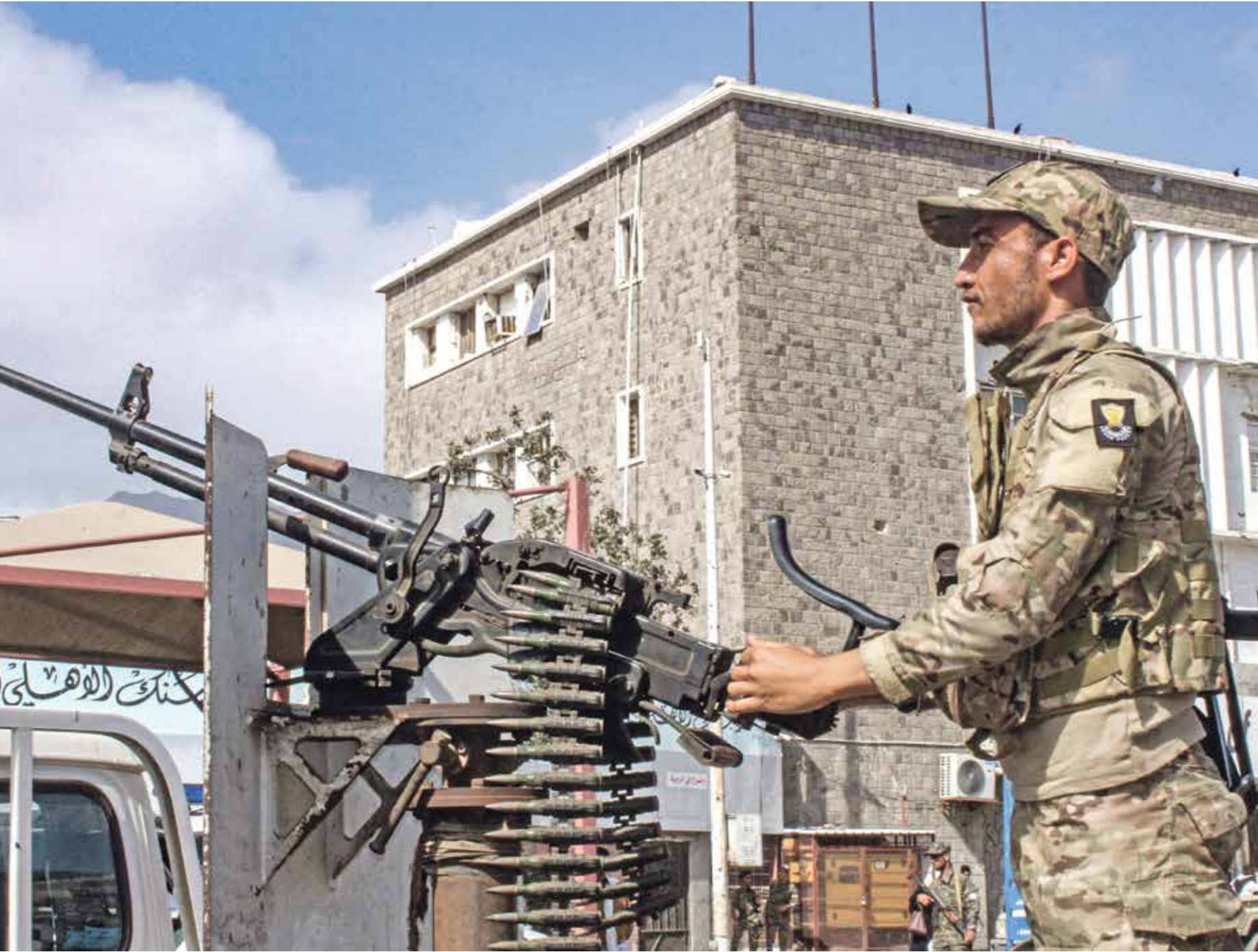
سلاوات عن حفرة الحكومة على ضبط الامن جيلها صالح الجديد(مارس/رأس سن)

تفاوتت التقديرات كثيراً، وكذلك التوقعات، بين الأراضي الفلسطينية المحتلة، بين ما ينتظره الفلسطينيون من الإدارة الديمقراطية الجديدة في البيت الأبيض، وبين ما ترغبه إلى به السلطة الفلسطينية، وما تريد إسرائيل، وعلى الرغم من عودة الإدارة الأميركية إلى دعم وإجاء «حل الدولتين» الأميركية وحيد لتسوية قابلة للاستمرار في الصراع الإسرائيلي - الفلسطيني، إلا أنها لم تبتد منذ تسلمها السلطة رسمياً، وحتى قبلها، أي مؤشرات لنيحتها العودة عن قرارات مفصلية اتخذتها الإدارة السابقة في عهد دونالد ترامب، لنسف أي قابلية لديمومة الروح في هذا المسار، وحتى مع عهد دونالد ترامب، لنسف أي قابلية لتأكيد أخيراً على تحضير إدارة بايدن لخطة لإحياء العلاقات مع الفلسطينيين، قد تسمح بالعودة عن «إجراء» من نهج ترامب، تتكرس خشية من أن يصبح النهج الذي