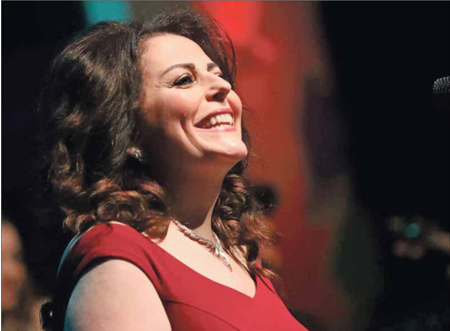
من الومالما، «عادي» الذي صدر عام 2003. ميلادية الذي صدر عام 1993 (بيسولك)

حالة التماهي مع السائد بالت تغيب رؤية كثير من المخرجين، على الأخص من قبل المنتج، أو التكرار في نسخ قوالب معينة لا تمرّد يذكر فيها مع مساحات لعب محدودة لخيال الكاتب. وبذلك، بدت النصوص مجرّاة من سياقها