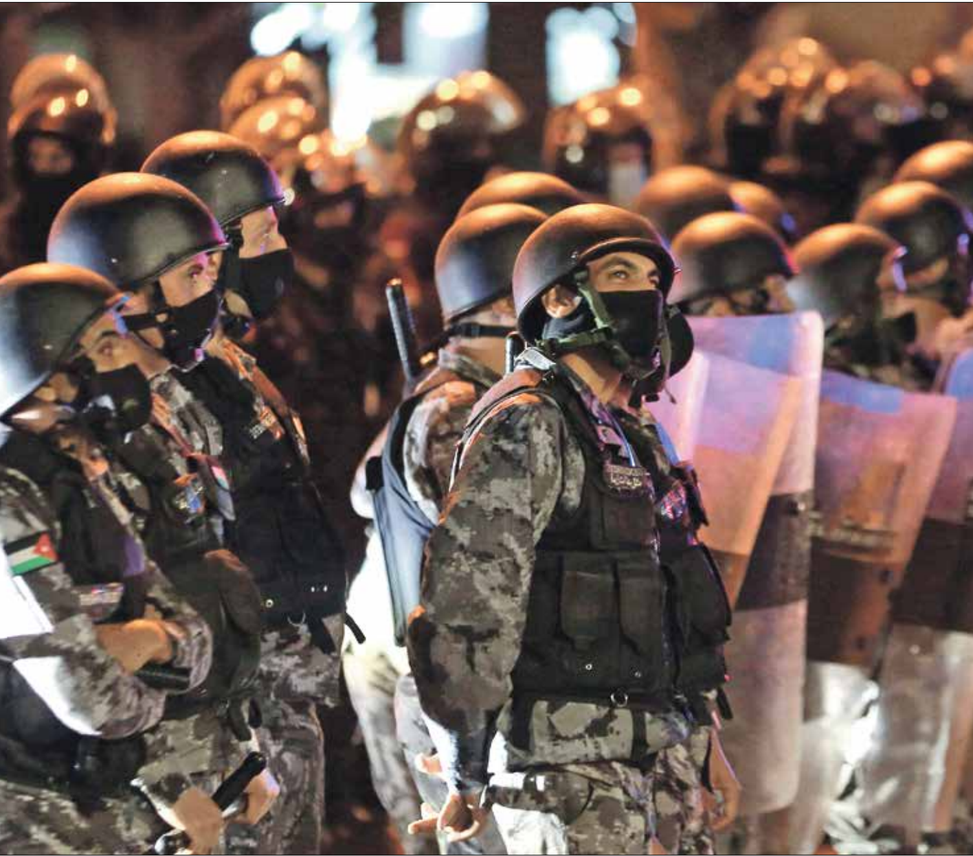
تصعد السلطات على الحة،الاصتب بمواجهة المحتجاج

وأضاف أن هناك تزايداً كبيراً في حجم الانتقادات التي تواجهها الحكومات مع صعوبة الأوضاع، بسبب حصول المواطنين على معلومات أكثر عن تفاصيل الإدارة الحكومية، خصوصاً في المعلومات لم تعد حكرا على وسائل الإعلام الرسمية، بل باتت المواقع غير الرسمية والنشطة على مواقع التواصل توجه الرأي العام بشكل كبير. ولغت شنيكات إلى أن الفرق والتمالة وترجع الحالة الاقتصادية التي تؤكدها التقارير الحكومية «تخلقت حالة من عدم الثقة بالحكومات وقدرتها على حل المشاكل»، مشيراً إلى أن الخفاء بعض أعضاء الحكومة الحالية، تدفع للاستنتاج بأن تجاربهم غير كافية لتولي مناصب وزارية، وحتاجون