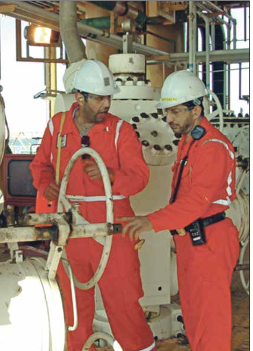
موظفون بالقطرة فى مصنع الغاز المسال فى العالم

ويمكن التذليل على إهمال الصحة والسلامة المهنية والفرق بين التشريع وبين تنفيذة فى ما يخص السلامة والصحة المهنية، فعلى سبيل المثال أقر قانون العمل تشكيل المجلس الاستشارى الأعلى للسلامة والصحة المهنية وتأمين بيئة العمل، ونشر القرار بالجريدة الرسمية فى 21 يونيو/ حزيران 2003، جاء ذلك أول اجتماع له فى 2010 برئاسة عائشة عبد الهادي، وزيرة القوى العاملة حينها، واجتمع المجلس للمرة الثانية برئاسة أحمد البرعى، وزير القوى العاملة، فى نهاية أكتوبر/ تشرين الأول 2011، وذلك بعد إعادة تشكيل المجلس مرة أخرى، ونصم ممثلين عن رجال الأعمال والاتحاحات العمالية، ولم تنظم الاجتماعات فى ما بعد. وفي السياق ذاته تم إعادة إنتاج المصاعب والبرامج، كما الاستراتيجى الوطنية لتقليل إصابات العمل، والتي تراجح مع كل وزير جديد للقوى العاملة بوصفها واحدة من جهوده المتفردة، بينما تصمم المجتمع الحوادث الكارثية والفتحة التى تطالو العمال، سواء بالحرق أو التسمم أو غيرها من إصابات تقضى إلى الوت.