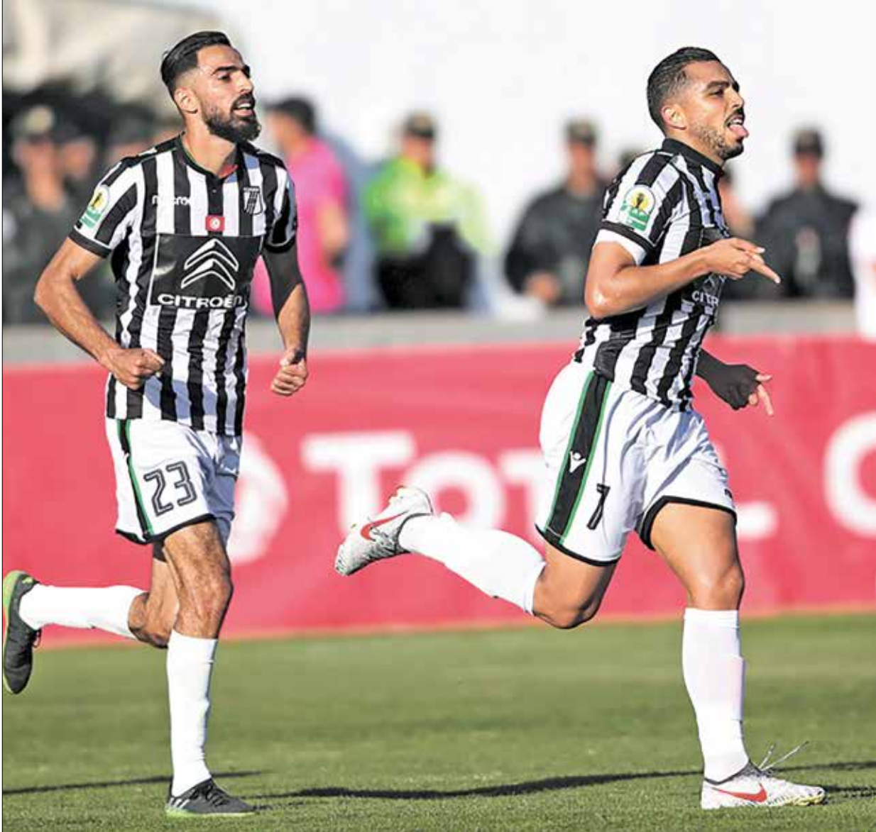
الضافسي لعاذه مع جب غراف كار السنغالي (فراش برس)

كافينغي وتشيفو مايباسا في الدقيقتين 89، فيما أحرز أوغستين أولانوبو هدف إنجيمبا الوحيد من ركلة جزاء في الدقيقة 47. وفي المجموعة الثانية، تلقى نادي نهضة بركان المغربي حامل لقب، ضربة قوية، بهدفين مقابل لا شيء، ليتجمد رصيد بركان 3 نقاط، ومثلها للقطن الكامروني. وسجل ثنائية القطن كل من سويديو مارو وسيديري سانيو. ولم يقدّم فريق بركان المستوى المنخفض منه، وتظهر أكثر من لاعب