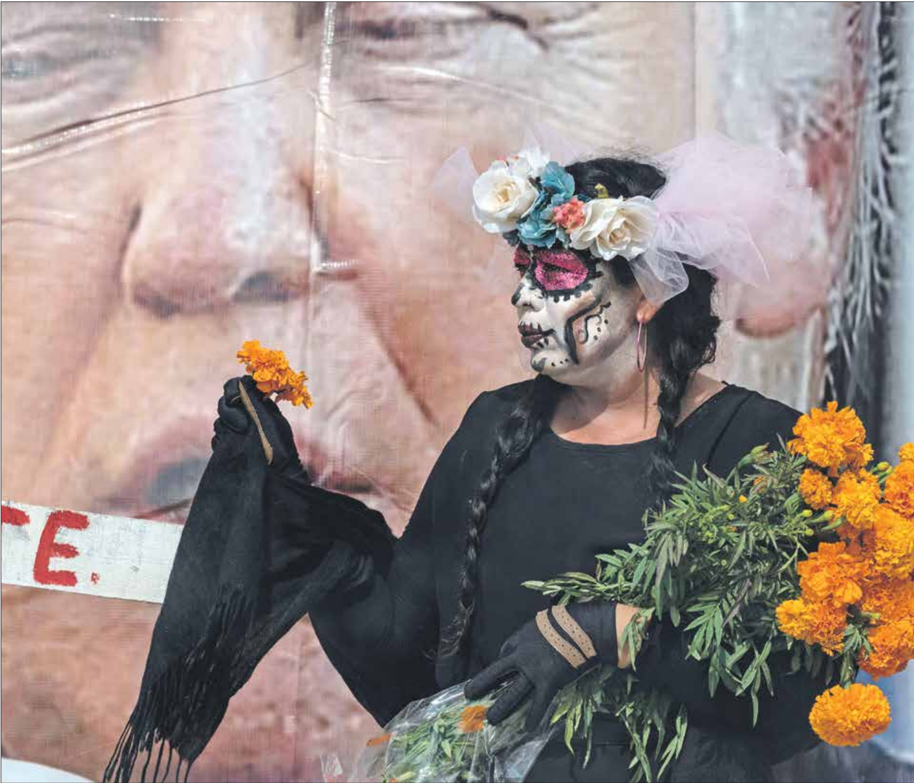
بربيع المهاجرون ياب يلعبه الكاروس (توريمو (الراس) فرائس برسا

ومن المتوقع أن يوقف تمويل بناء الجدار على الحدود المكسيكية - الأمريكية، وأن يصدر بايدن مرسوماً رئاسياً ينهي حالة الطوارئ التي أعلن عنها ترامب عندما لم يتمكن من الحصول على قرابة 15 مليار دولار لاستكمال تمويل بناء الجدار. وسمحت إجراءات الطوارئ بتحويل قرابة عشرة مليارات دولار من ميزانية الدفاع وميزانيات أخرى لبناء الجدار، إذ كان الكونغرس قد خصص 4,5 مليارات دولار فقط لبنائه، وكان بايدن قد أعلن أنه غير معنيّ ببناء الجدار، خصوصاً أنّ إصلاح الجدار من الحواجز على طول الحدود، ما يكفي من وقوع عمليات تسلل واسعة. وأظهرت جائحة كورونا مجدداً الدور الحيوي والرئيسي الذي يلعبه المهاجرون في الدول الغنية، بما فيها الولايات المتحدة، على الخطوط الأمامية، سواء في مجال الرعاية الصحية أو القطاع الزراعي