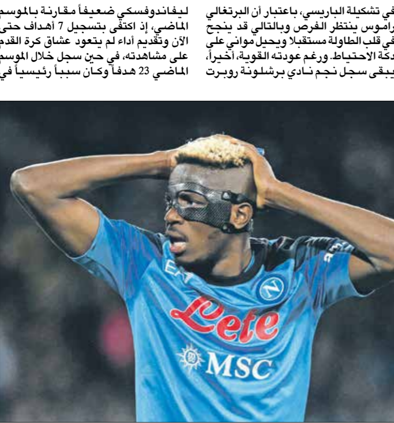
أوسيمين يلعب لصالح ليل في هذا الموسم

كما يبقى أداء النجم السابق لنادي مونيخه والصحالي لنادي لانس إيني وإهسي لغزًا حقيقيا يثير علامات الاستفهام، إذ لم ينجح هذا الموسم في هز الشباك سوى مرة واحدة، فيما تآلق خلال الموسم الماضي وسجل 19 مرة، ولعل الصعوبات التي واجهته في الانسجام كانت سببا في تراجع الهميب وكان لانس قد دفع مبلغًا قياسيًا من أجل إنتامه الصفقة وكان يعتقد أنه ضمن خدماته مهاجما سيكون قادرًا على تعويض نجمة الميجكي لويس أوبندا الذي غادر الفريق، ولكن إلى حد الآن ما زال الفريق ينتظر بروز الواعد الجديد، الذي يُعتبر من مواهب كرة القدم الفرنسية وهو أساسي في منتخب فرنسا الأولمبي ويتوقع له مصيرًا مميزًا.