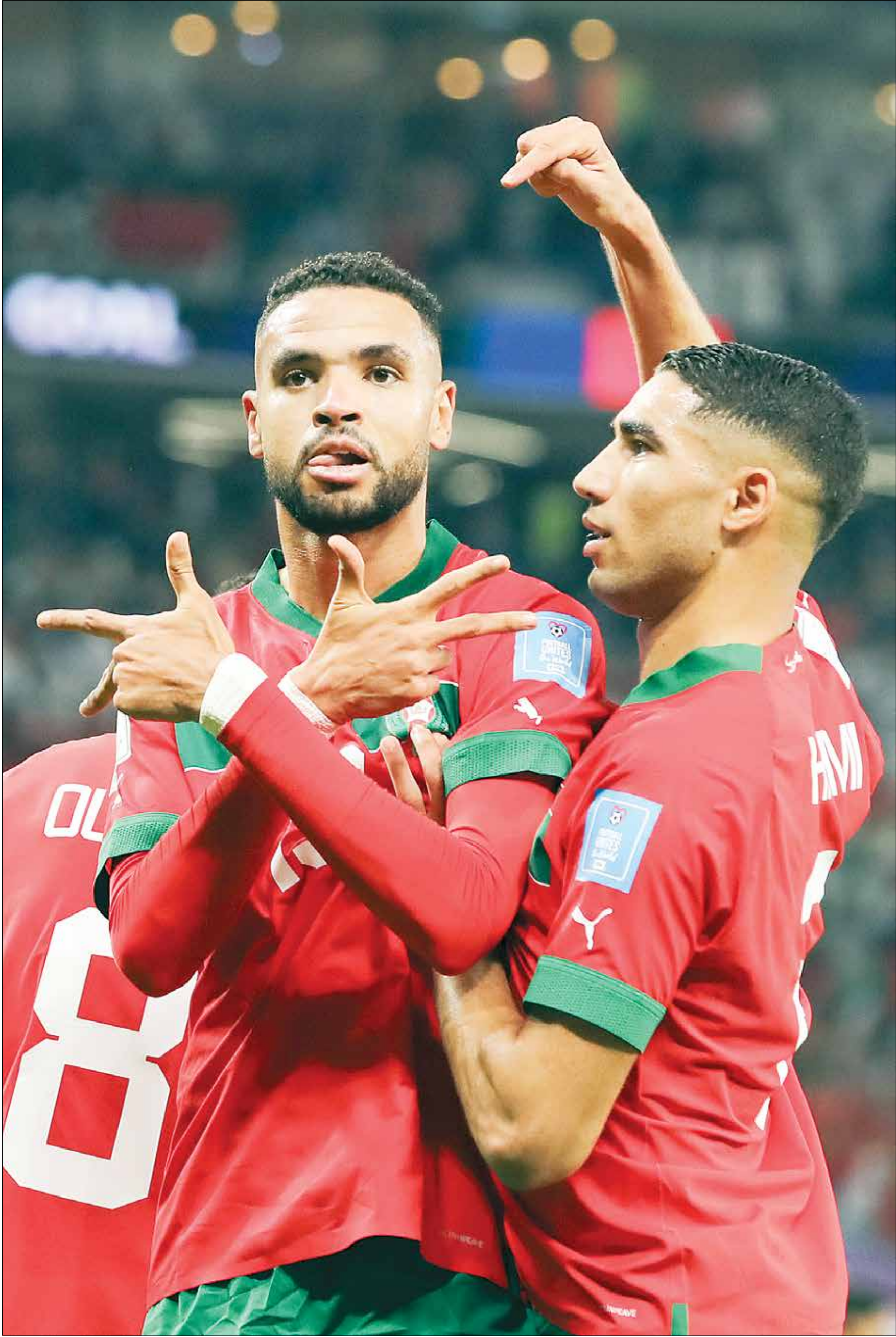
4 مرشدين من المغرب في القائمة إلى جانب محرز ومحمد صلاح

كشف الاتحاد الإفريقي لكرة القدم عن قائمة المرشحين لجائزة أفضل لاعب بالقارة، حيث سيتنافس عليها كل من نجم نادي ليفربول، المصري محمد صلاح، والجزائري رياض محرز لاعب الأهلي السعودي والمتوج الموسم الماضي بلقب أبطال أوروبا والدوري الإنكليزي مع مانشستر سيتي، وكذلك مهاجم إشبيلية يوسف النصيري ومواطنه ياسين بونو وسفيان امرابط وأشرف حكيمي إلى جانب الكاميروني فينست أبو بكر والسنگالي ساديو ماني والنيجيري فيكتور أوسيمين.