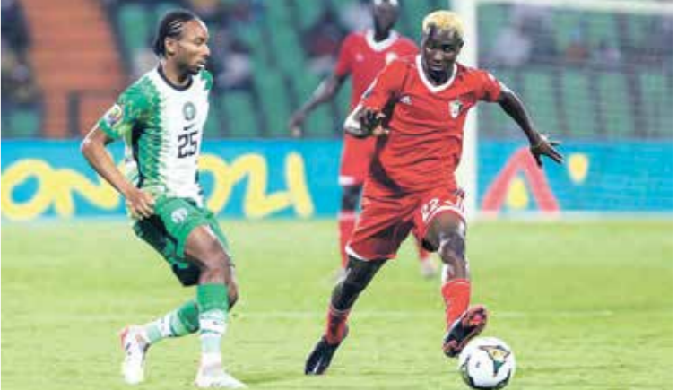
رضى منتخب السودان بالتعادل في التصفيات

فشل منتخب الصومال في حصد أية نقاط، وتعرض لخسارة منطوية أمام الجزائر بثلاثة اهداف مقابل هدف، فيما تعرض منتخب جيبوتي لأكبر الهزائم العربية بالسقوط أمام مصر بسبعة اهداف نظيفة في مباراة كانت من طرف واحد، من جهة أخرى، أعرب مدرب المنتخب الجزائري جمال بلماضي، عن غضبه من سوء أرضية ملعب «نيلسون ماندلا»، التي استضاف المباراة، مؤكدا أنها اعافت لاعبيه في مواجهة منتخب الصومال، ضمن منافسات التصفيات الأفريقية المؤهلة إلى بطولة كأس العالم 2026، وقال جمال