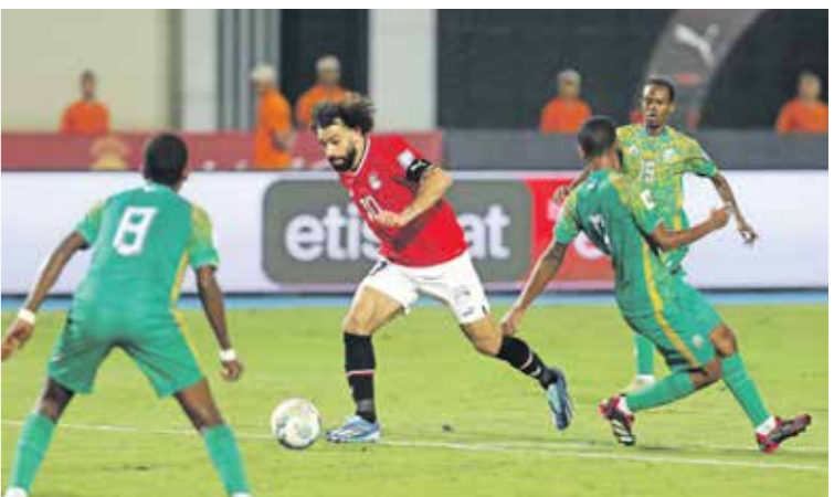
تالف صلاح مع منتخب مصر في التصفيات

وشهدت ضربة بداية العرب انطلاقا جيدة لمنتخبين كبيرين تنتظر منهما الجماهير العودة للعالم المونديال مرة أخرى، بعد رسالة مبكرة، تغيب السعي وراء تحقيق حلم