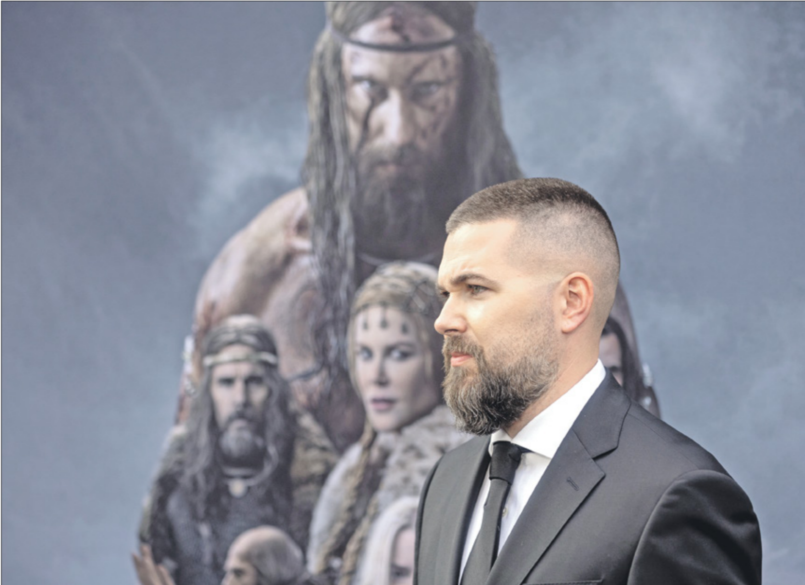
روبرت إغرز فَعَمًا «رجل السلام» في لوس انجليس في 18 ابريل، نيسان 2022

أمر وجهته «الهاثالا»، انصتْ إلى». افتتح إغرز فيلمه المحصي التاريخي بهذه سلبه والده وملكه، لا مكلل أو ابن آخ بل كعبد قوي مفقول العضلات، لديه القدرة