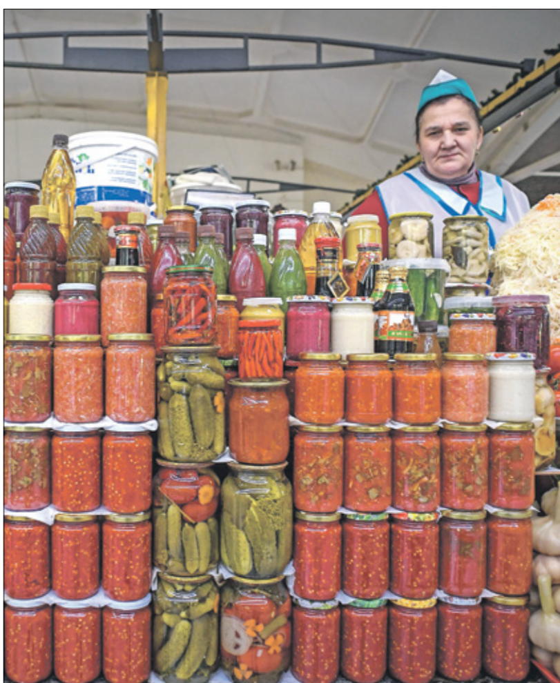
تخطيط المخللات على كمية كبيرة من الملح الوربي كادوبوف، فرانس برس

يقوم البوتاسيوم بالعديد من الوظائف الهامة، خاصة في ما يتعلق بصحة القلب وتقلصات العضلات ووظائف الأعصاب. كما أنه ضروري للحفاظ على حجم الدم وتوازن السوائل وبالتالي تقليل احتباس الماء. ويقلل البوتاسيوم احتباس السوائل عن طريق تقليل تأثيرات الصوديوم، وكذلك عن طريق زيادة إنتاج البول. ومن الأطعمة الغنية بالبوتاسيوم الفون والبطيخة والافوكادو .