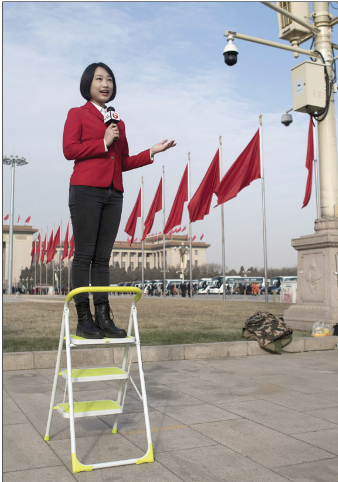
لا تغيب بكين برواية غير روايتها الرسمية