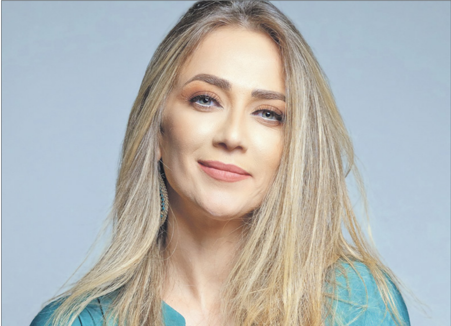
ابو أمته في طور القاء الخطيب مع إدارة حفلات الموسم الثاني، شكلت اللحن بشكله العاطفي (المنارة)

بداية الشهر الحالي، اصدر المغني اللبناني عاصي الحلاني أغنية جديدة بعنوان «صخرة حبيبي»، من كلمات عبيد أبو إسماعيل، والحنان سليم سلامة، وإخراج أحمد المنجد.