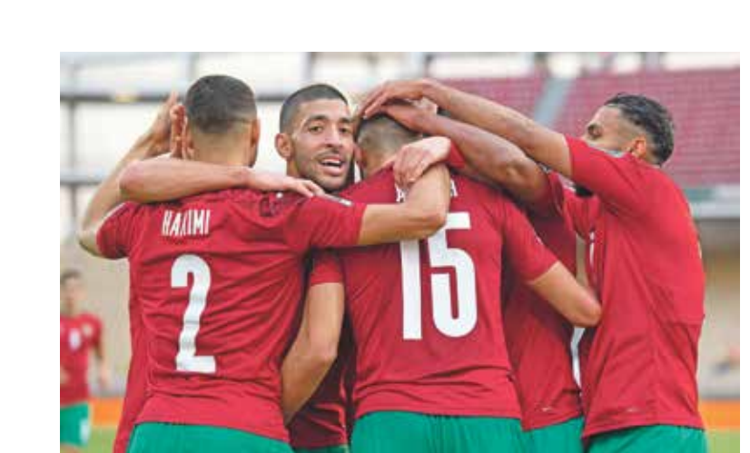
المنتخب المغربي يبعث لصدارة المجموعة

القاد، وتحتہ الإنظار العربية في المجموعة الثالثة، صوب لقاء يجمع بين منتخب المغرب مع نظيره في الغابون، يُمثل قمة المجموعة الحاسمة لتحديد هوية صاحب الصدارة والوصافة، ويدخل المنتخب المغربي المواجهة في ظروف معنوية رائعة بعد البداية النارية