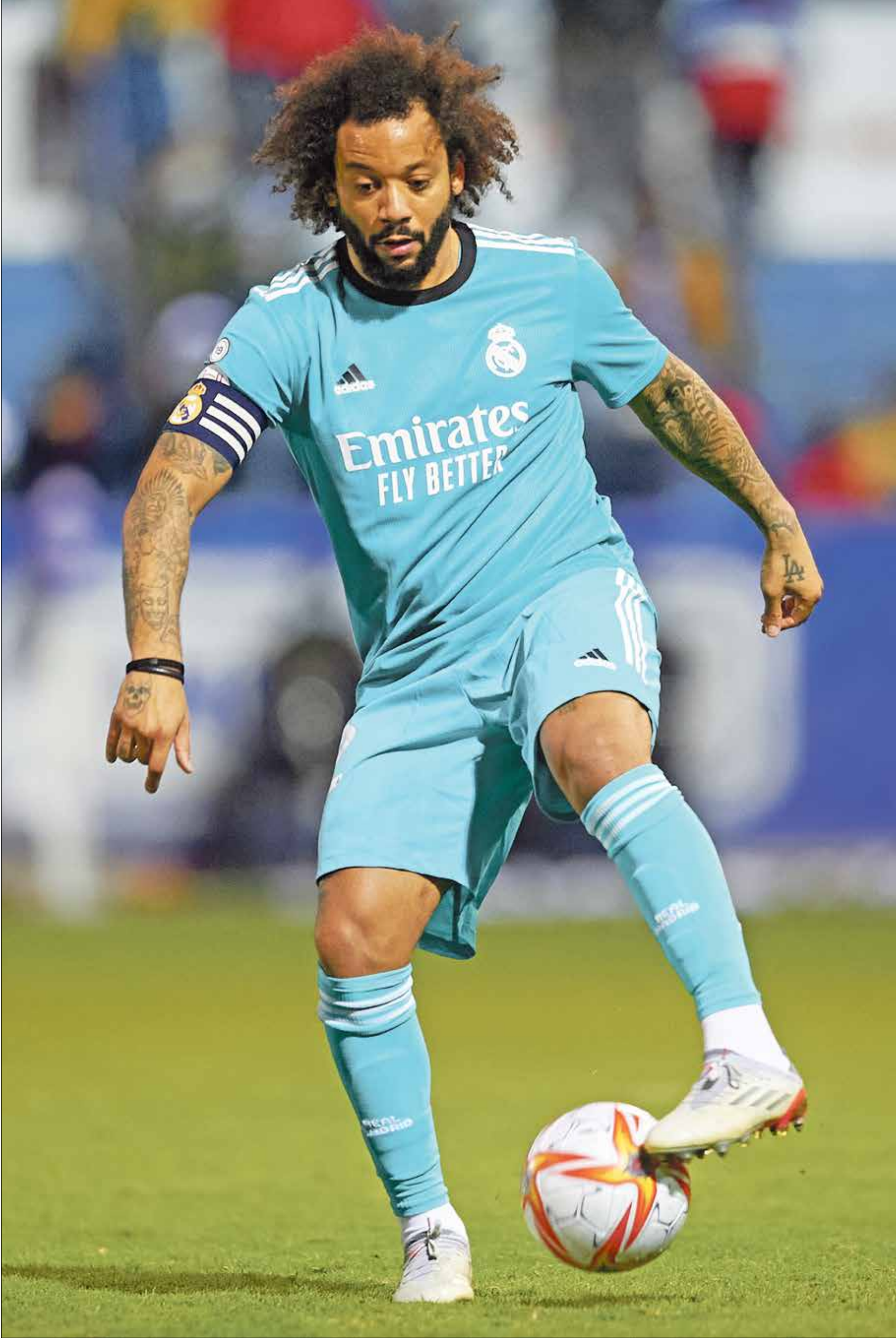
مارسيلو ربما يُغادر ريال مدريد قريباً

رفع الظهير البرازيلي، مارسيلو، لقب كأس السوبر الإسباني ليصبح اللاعب الأكثر تتويجاً باللقاب في فريق ريال مدريد بـ23 بطولة مُعادلاً رقم، باكو خينتو. ودخل مارسيلو التاريخ بتجاوزه مانولو سانشيس وسرخيو راموس ليزاحم خينتو على الصدارة، وكان قد حجز بالفعل مكانه كاكثر محترف نجاحاً في تاريخ «الميرينغي»، قبل أن يُصبح هذا الموسم أحد أساطير النادي.