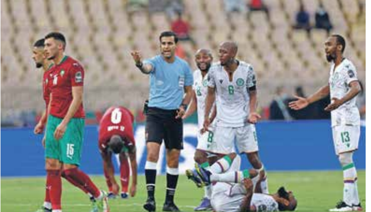
جزر القمر ومهمة شاقه في الجولة الأخيرة

4 نقاط، وهو ما يُمثل بداية طيبة له يحتل بها المركز الثاني، ويُتبع الفوز أو التعادل للمغرب التأهل للدور التالي متصديراً، فيما لا يملك منتخب الغابون للصدارة سوى الفوز، ويكفيه التعادل لحسم الوصافة أيضاً، والعبور للدور التالي بصرف النظر عن لقاء غانا وجزر القمر.