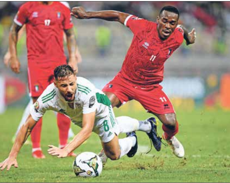
منتخب الجزائر لم يقدم مستواه المعتاد

مجددا الشبان الموريتانية بتسديدة من داخل المنطقة زاخفة إثر سلسلة تغيريات قصيرة بينه وبين المدير محمد علي بن رمضان والشعالي، وأضاف منتخب المغرب منذر الكبير الهدف الرابع، بعد هجمة قادها